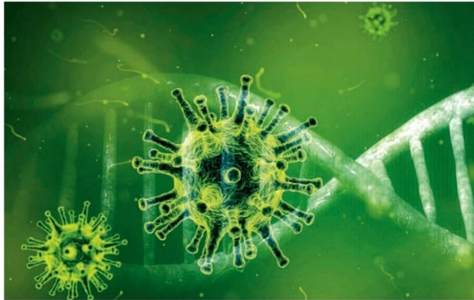
Especialistas são unânimes: não é hora de se descuidar, próximos dias terão cenário de alta de contaminações

“Após o surgimento da Ômicron, as mutações que ocorreram a partir dessa variante mostravam uma velocidade de transmissão muito maior. Então, essas duas últimas variantes mantiveram esse comportamento e, justamente por isso, esse novo aumento de casos”, explica o chefe do Serviço de Infecto-