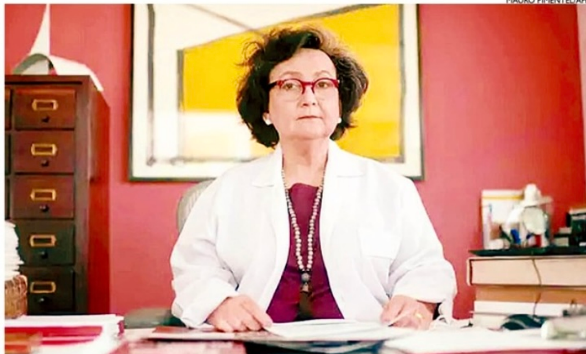
Margareth Dalcolmo é um dos principais nomes no combate à pandemia de Covid-19

A característica clínica dos casos que nós temos observado é de