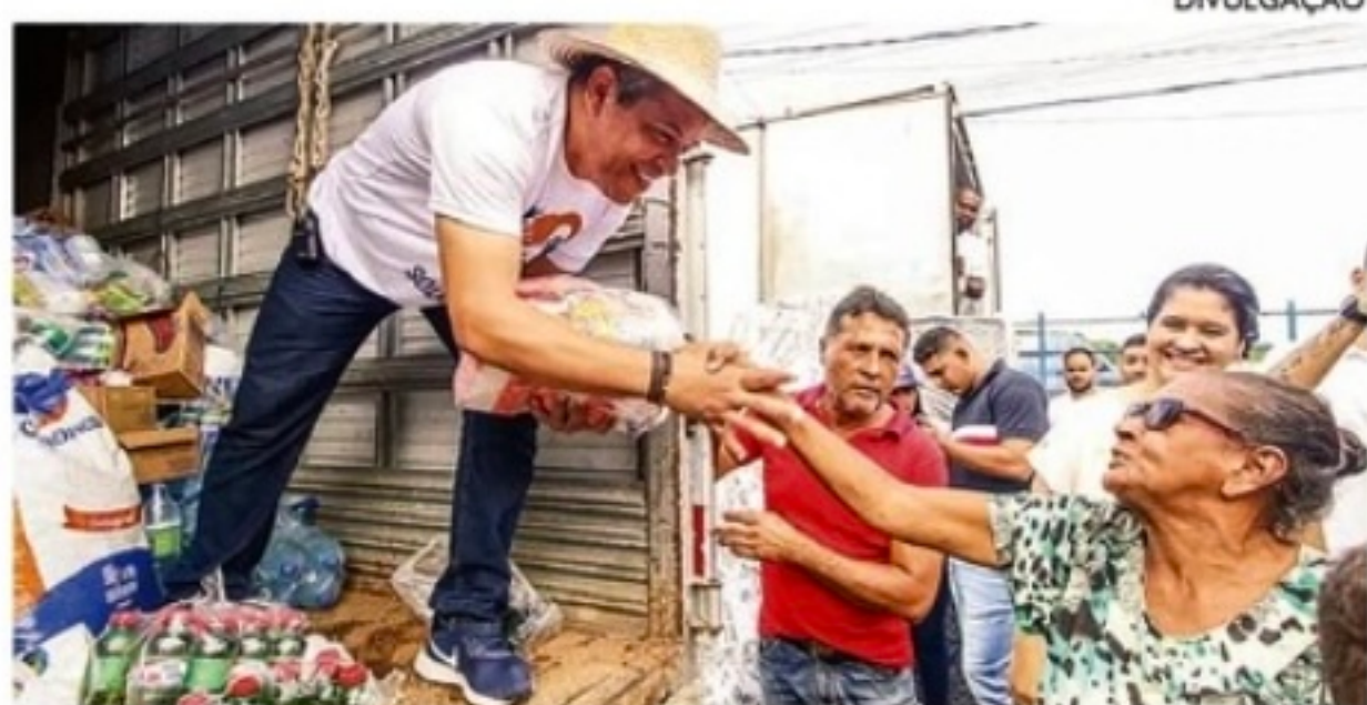
Doações e assistência médica no calendário dos cabenses

A Prefeitura do Cabo de Santo Agostinho vem mobilizando mutirões entre suas secretarias para atuar na assistência às famílias vítimas das chuvas que assolaram o município e outras localidades da Região Metropolitana do Recife, nos últimos dias de maio.