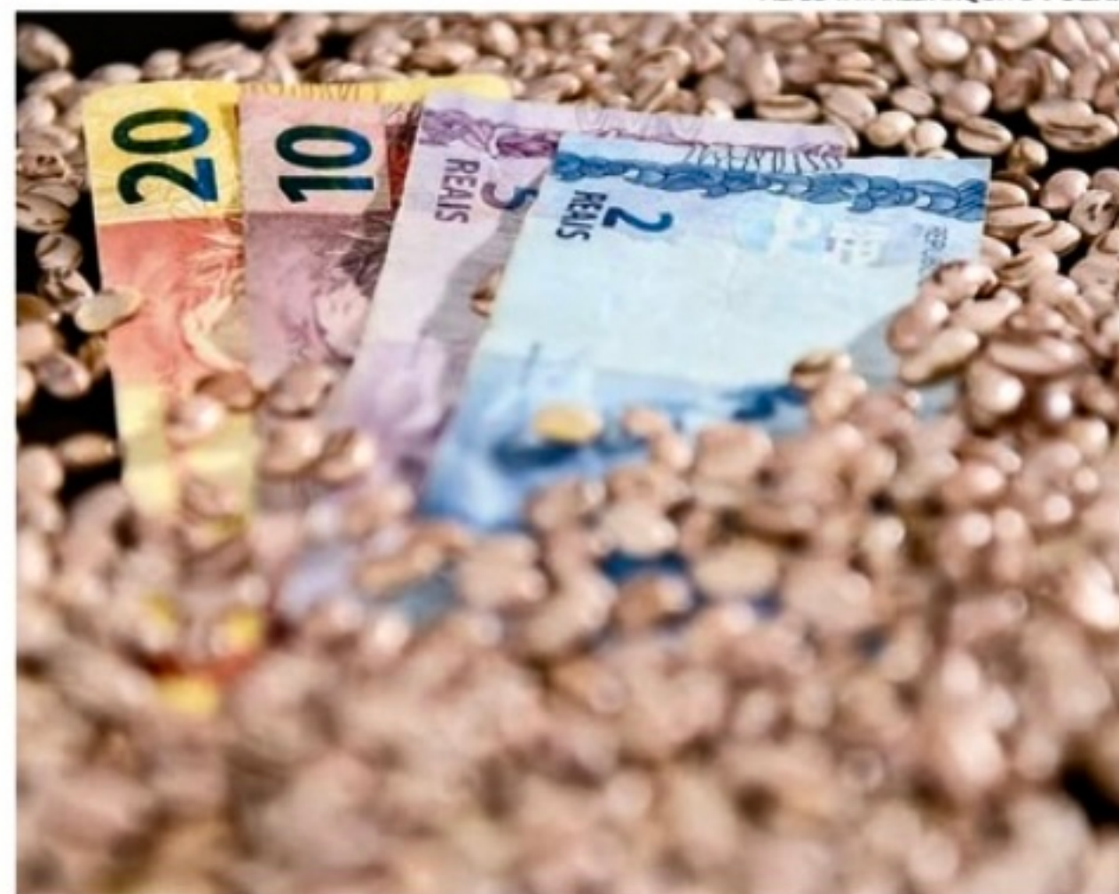
A safra de feijão terá aumento de 6,6% em relação ao período anterior