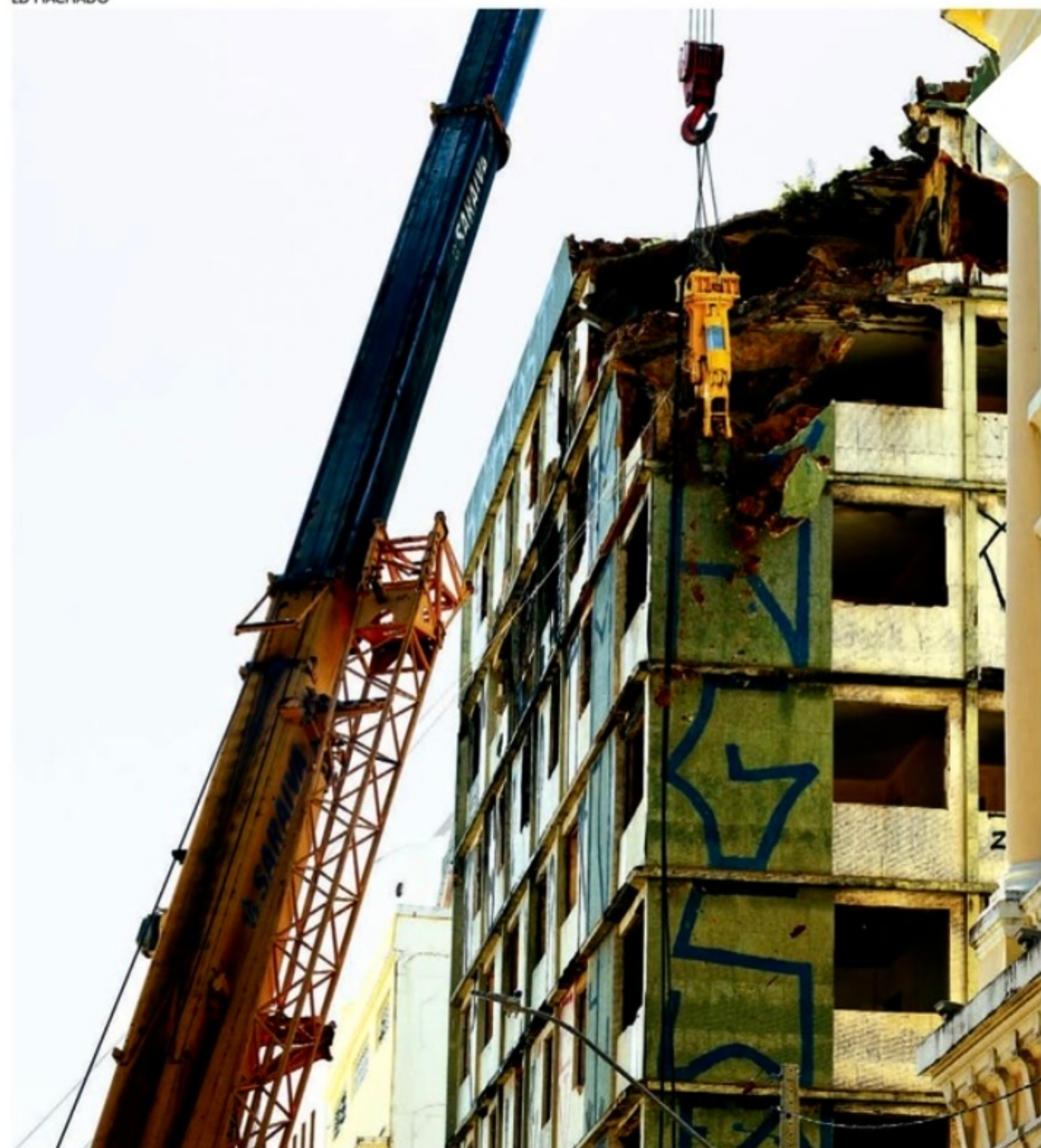
Prédio no Bairro do Recife começou a ser demolido no fim de semana. Áreas próximas estão interditadas