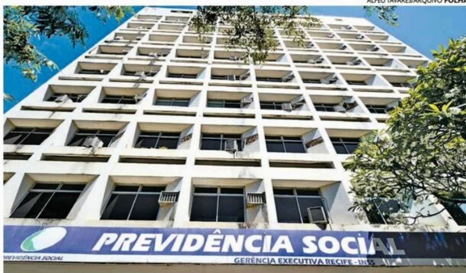
Oportunidades na Previdência vão possibilitar a recomposição da mão de obra, diz gestão

A portaria ainda autoriza o prazo de dois meses de antecedência mínima entre a publicação do edital e a realização da primeira prova do certame. O preenchimento dos cargos vai depender de autorização prévia do Ministério da Economia e está condicionado à existência das