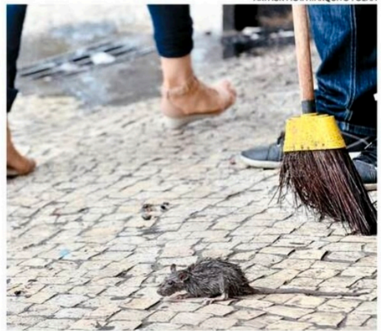
A leptospirose é uma doença transmitida pela urina do rato infectado

"Após a exposição, é necessário observar de 7 a 10 dias queixas como dores no corpo, febre, vermelhidão nos olhos que é a conjuntivite, e a dor na panturrilha, a batata da perna. Quando há a complicação do quadro, que aí são a icterícia que é o amarelão no corpo e a tosse com sangue, há a necessidade de busca imediata de uma unidade de pronto atendimento para fazer um tratamento adequada", pontuou o infectologista.