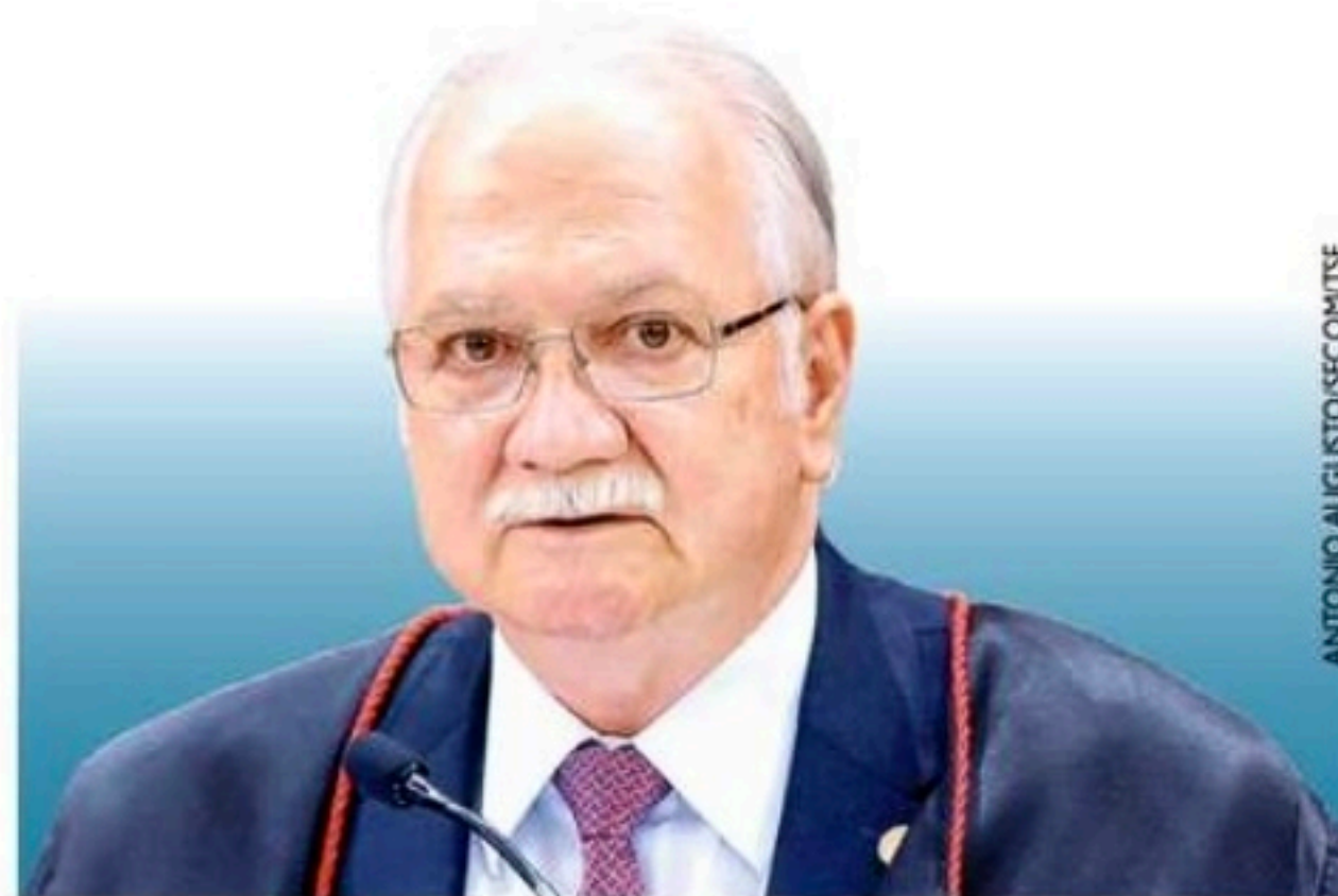
Fachin respondeu a ofício dizendo ter consideração por Forças Armadas

Na mensagem, Fachin afirmou ser "necessário diálogo interinstitucional em prol do fortalecimento da democracia brasileira", e agradeceu a apresentação de contribuições para o processo eleitoral pelo Ministério da Defesa.