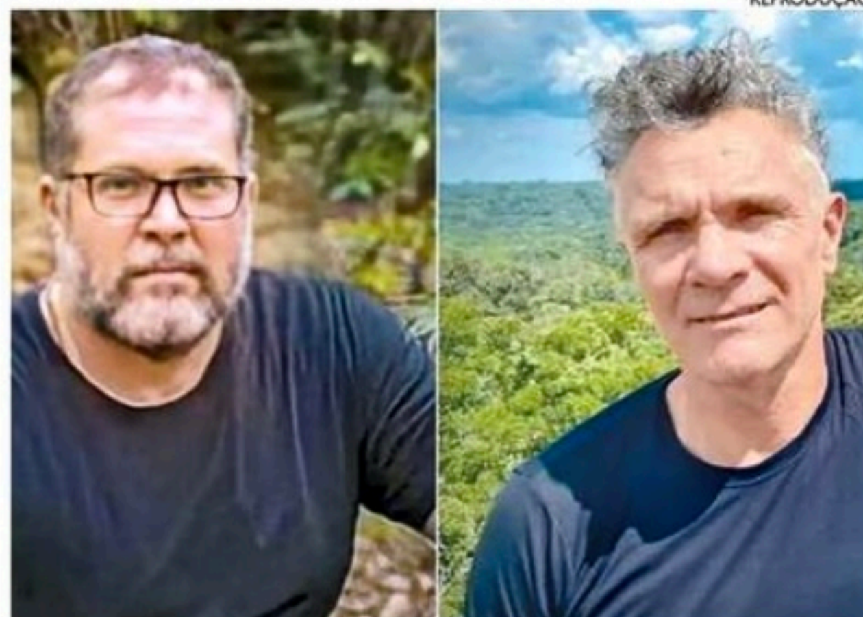
Acessórios de Bruno Pereira e Dom Phillips foram encontrados

No último domingo, bombeiros envolvidos na operação encon-