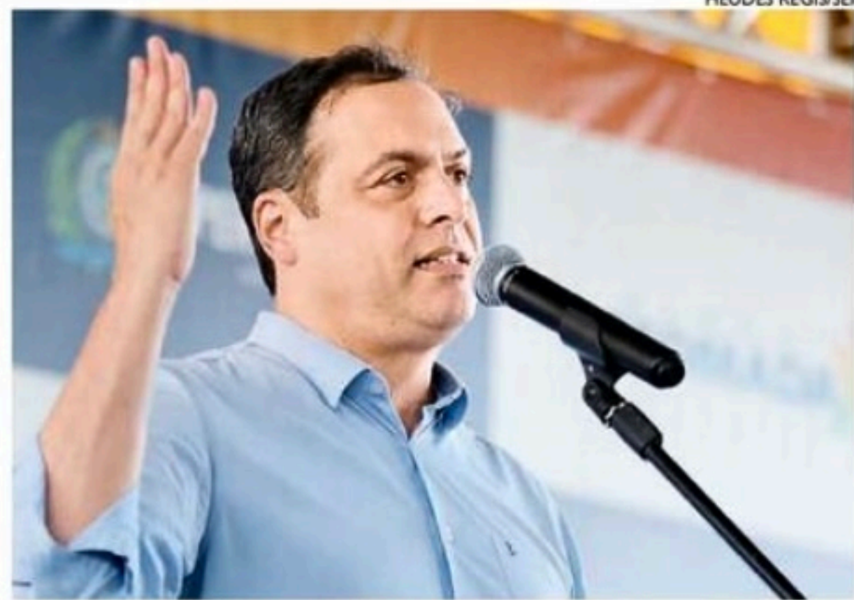
Governador viaja quinta-feira para encontrar Lula em Natal