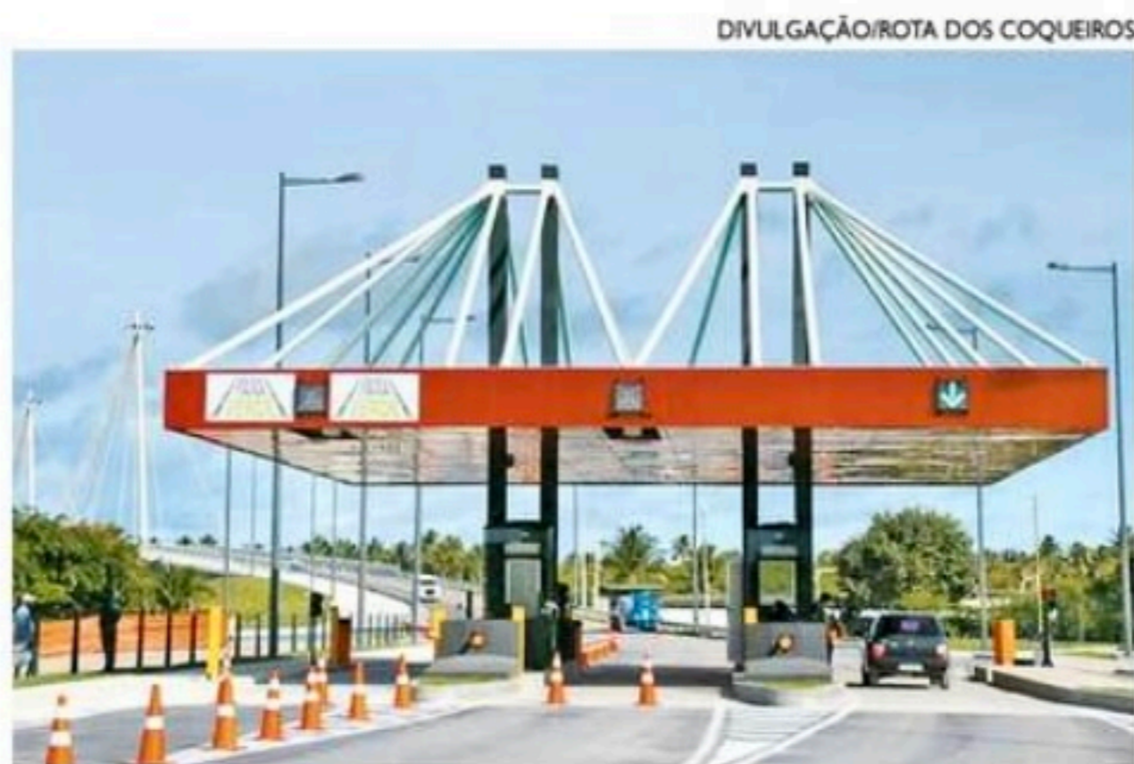
Nos fins de semana, por exemplo, a tarifa básica passa para R$ 11,80

A autorização para o reajuste anual foi publicada no Diário Oficial do Estado, por meio da resolução nº 215/2022 da Agência Estadual de Regulação de Pernambuco (ARPE). Segundo a concessionária, o pedágio é uma das formas de remuneração dos cerca de R$ 206 milhões investidos pela