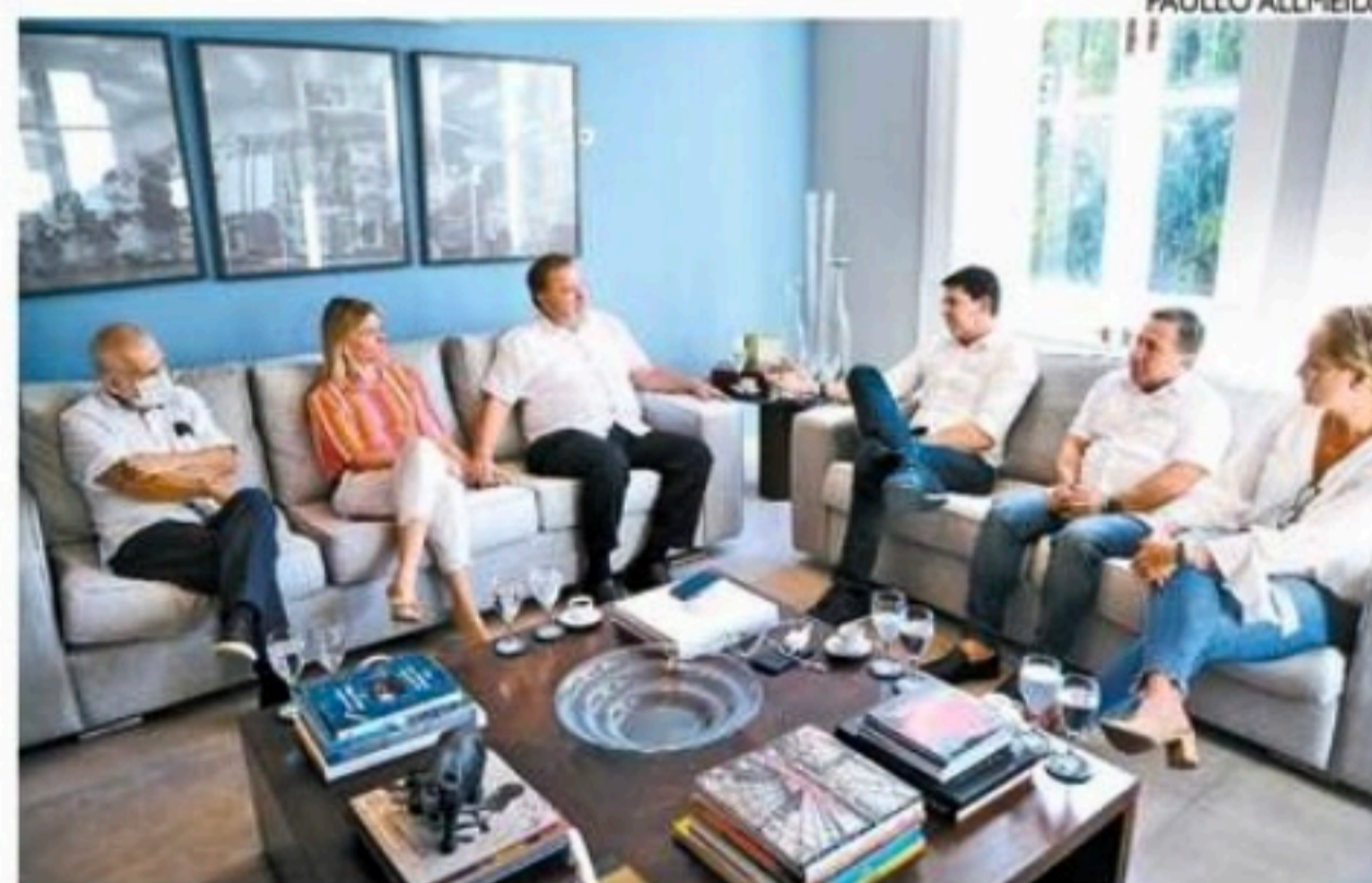
Gestor (centro, à direita) fez visita institucional à Folha de Pernambuco