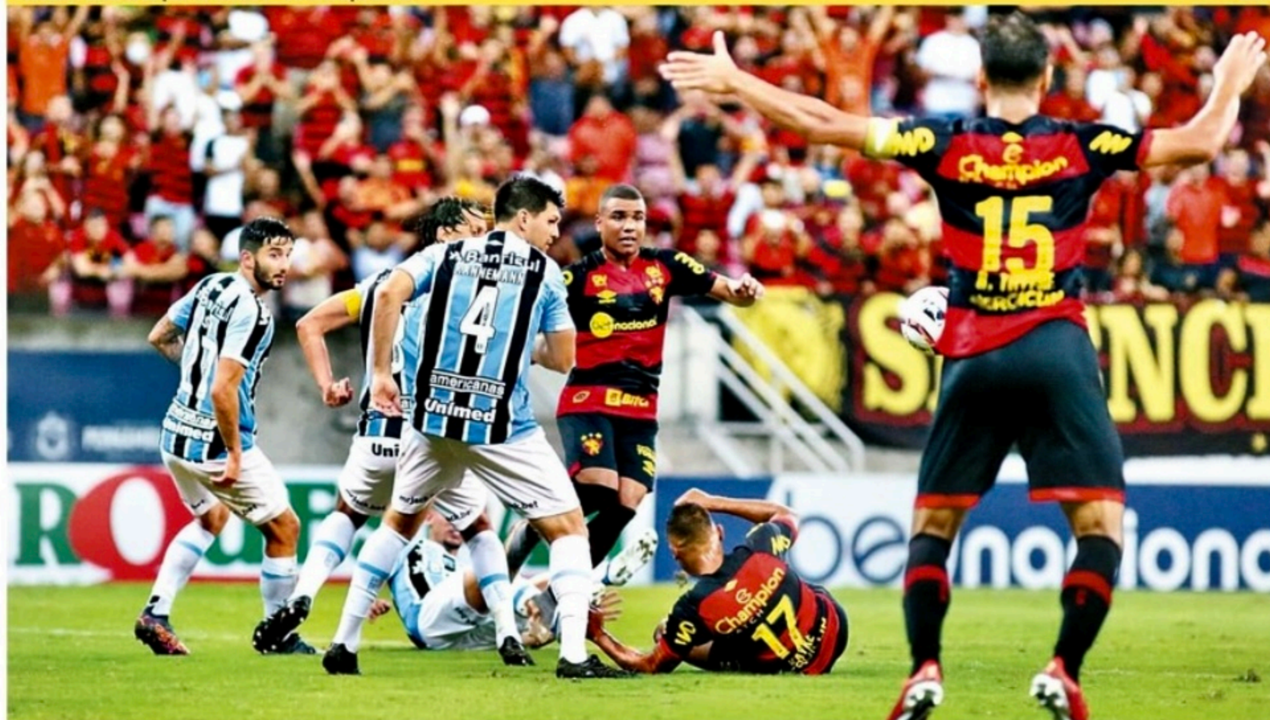
Em jogo movimentado na Arena, pernambucanos e gaúchos não balançaram as redes

Recife, terça-feira, 14 de junho de 2022 Ano XXV n° 136