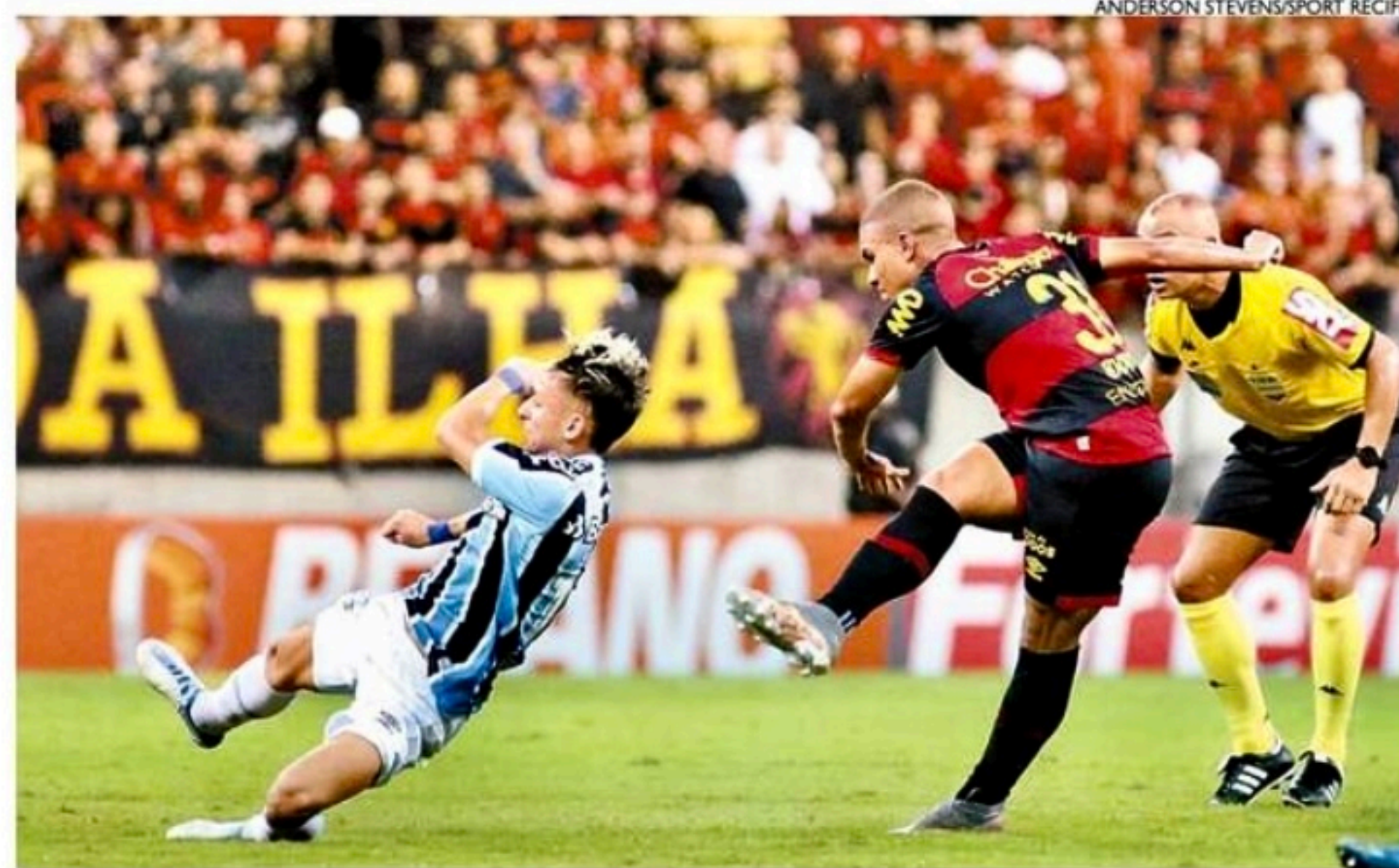
Com dois dos piores ataques da Série B, Sport e Grêmio perderam diversas oportunidades de marcar

O aproveitamento do Náutico em casa é de 27,78%. A única vitória em casa foi conquistada perante o Operário/PR, por 2x0. Contra