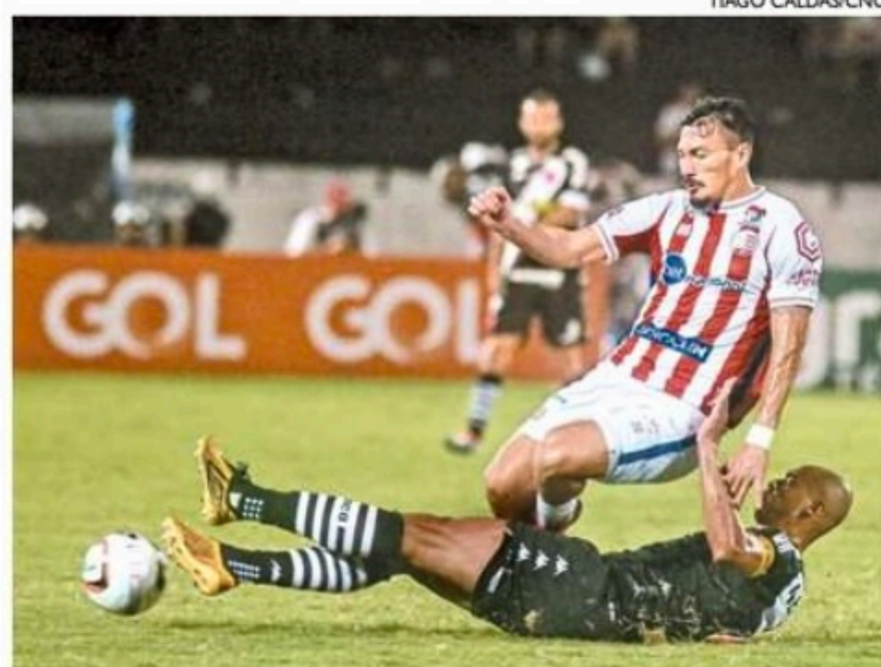
Timbu só venceu uma das seis partidas jogadas em casa

O Náutico só é melhor no quesito do que a Chapecoense, que ainda não venceu em casa, amargando dois empates e três derrotas.