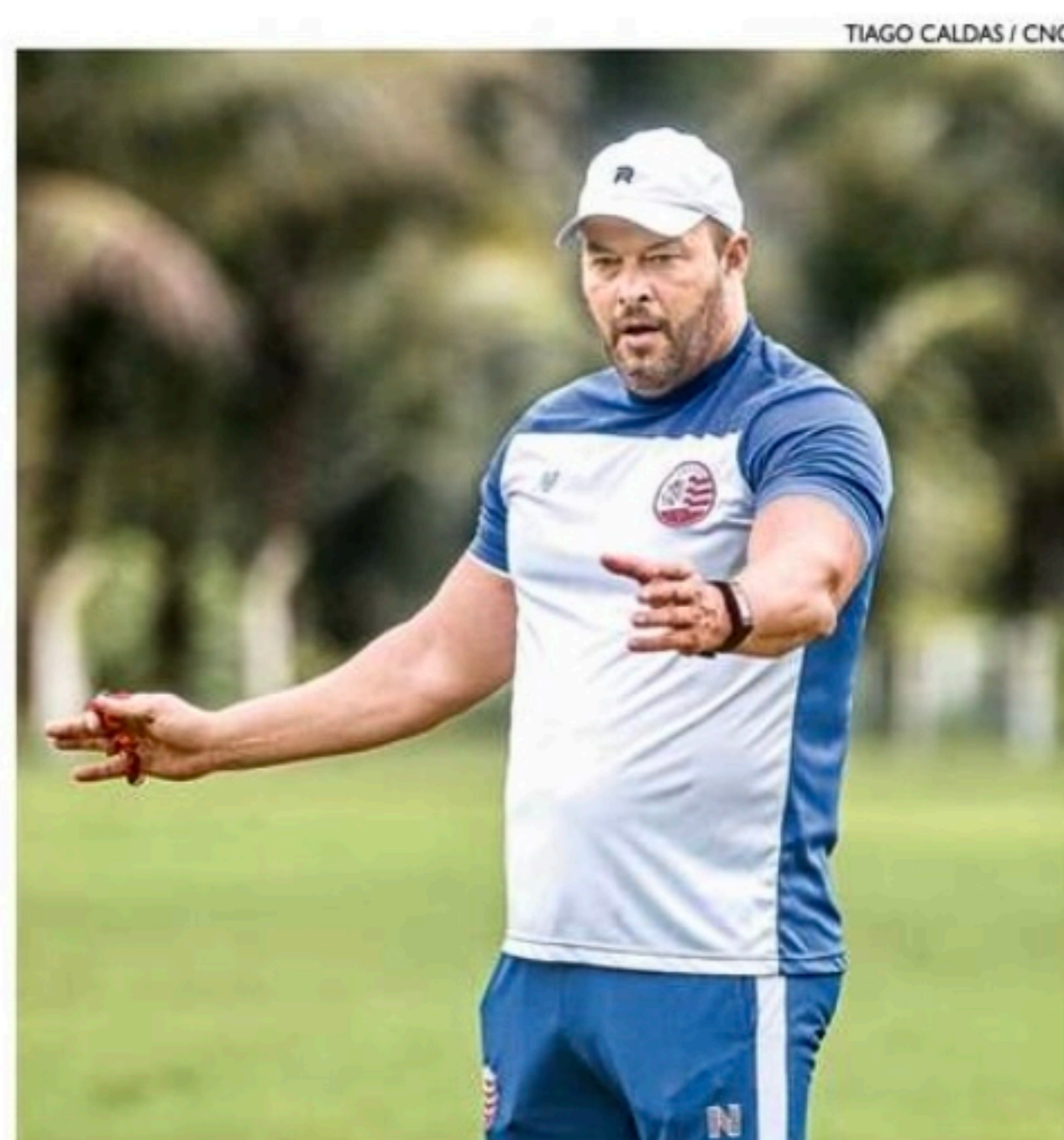
TIAGO CALDAS / CNC

Gilmar Dal Pozzo mantém o Sport no G4, mas sofre críticas