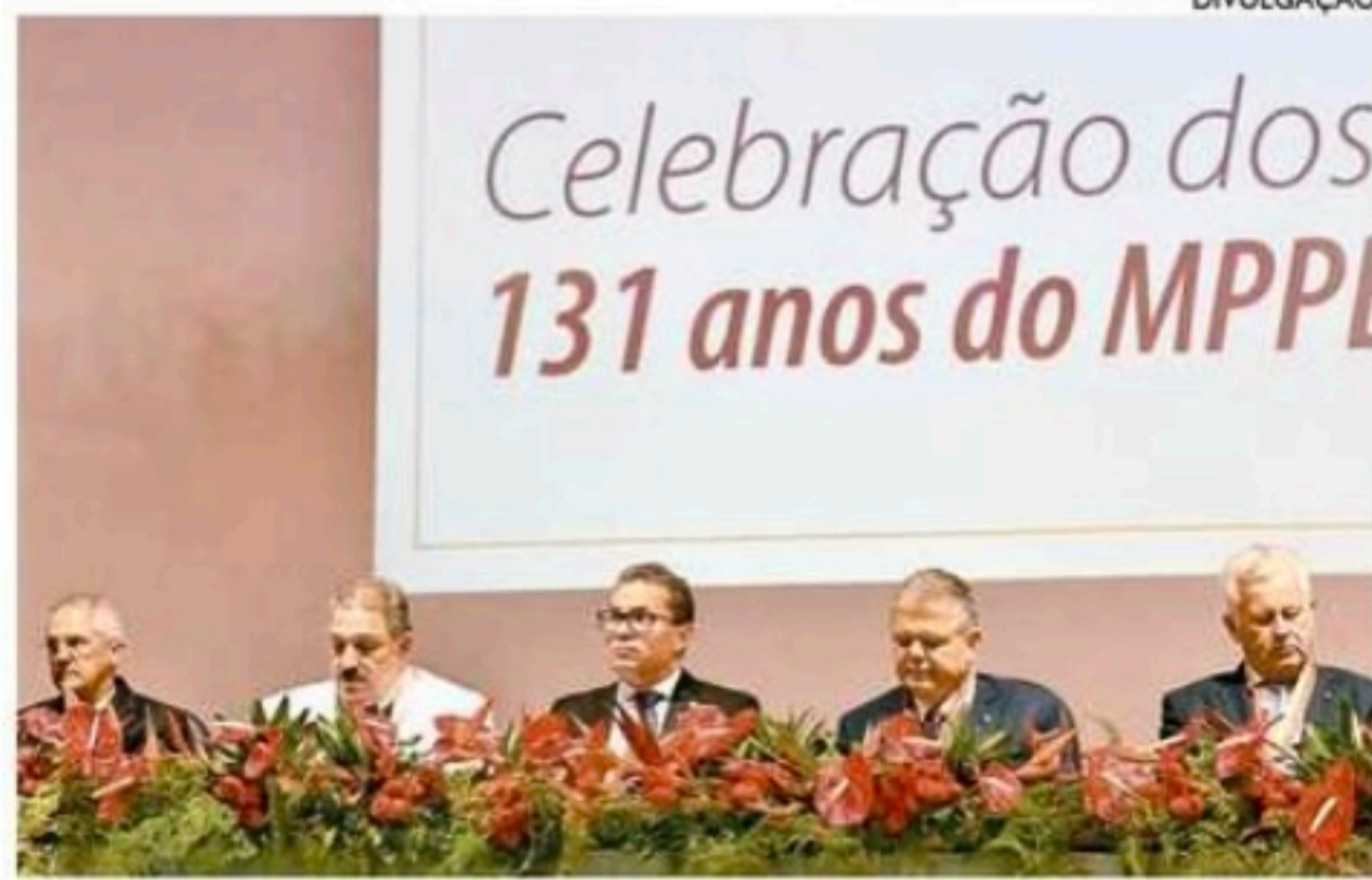
Procuradores se reuniram para festejar aniversário do MPPE

A coluna de Edmar Lyra é publicada de segunda a sábado.