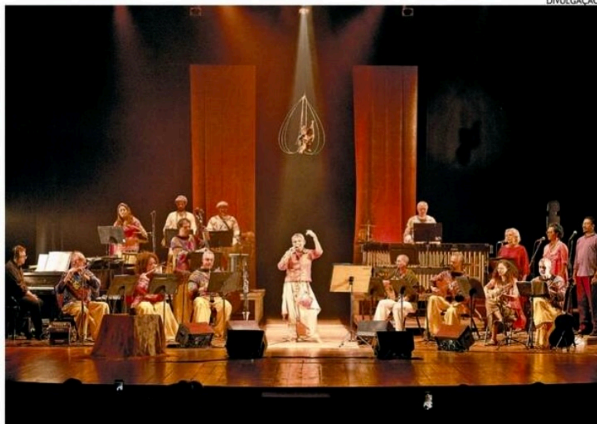
Registros históricos a partir de uma viagem pelo Nordeste feita pelo escritor inspiram novo álbum

“Na Trilha de Uma Missão” é, antes de tudo, um importante documento histórico da cultura popular brasileira. O repertório do disco foi construído a partir dos registros feitos pelo escritor Mário de Andrade (1893-1945), durante a viagem “Missão de Pesquisas Folclóricas (1938)”, em que