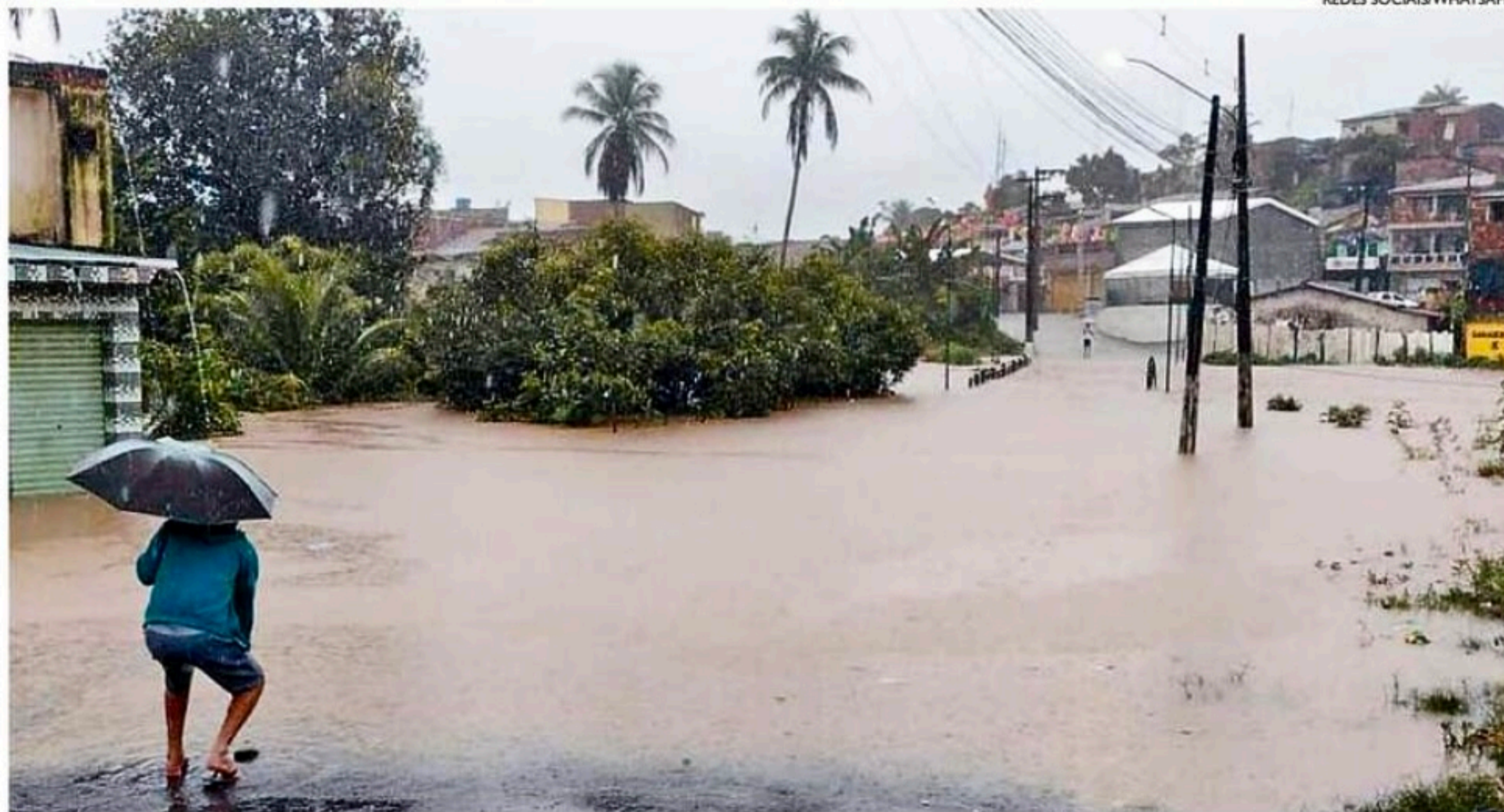
Chuvas alagaram ruas e casas no Agreste e Zona da Mata, desalojando 50 famílias. Tempo deve melhorar hoje

■ Casa desabou na zona rural de Bom Conselho, em consequência das fortes precipitações de ontem no Agreste e Zona da Mata Sul