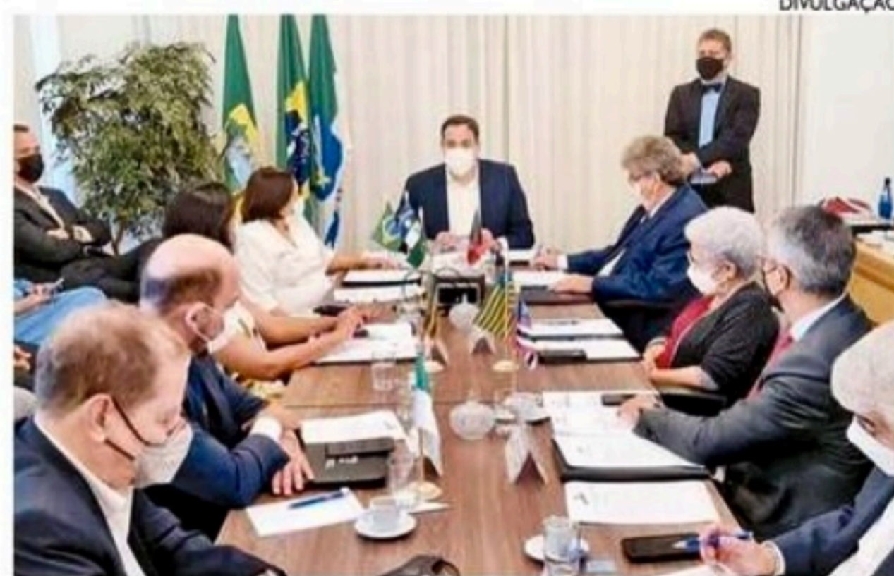
Gestores fizeram protesto contra intervenção do governo federal

"É importante dizer que a principal responsável pelos preços dos combustíveis é a atual política de paridade de preços de im-