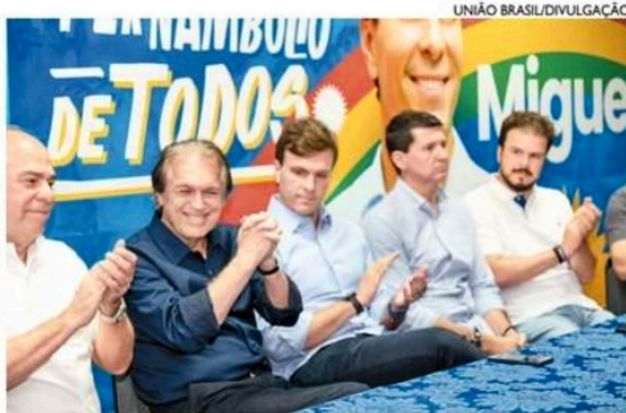
Postulante defendeu que Pernambuco se torne uma trincheira

A coluna de Renata Bezerra de Melo é publicada de terça a sábado.