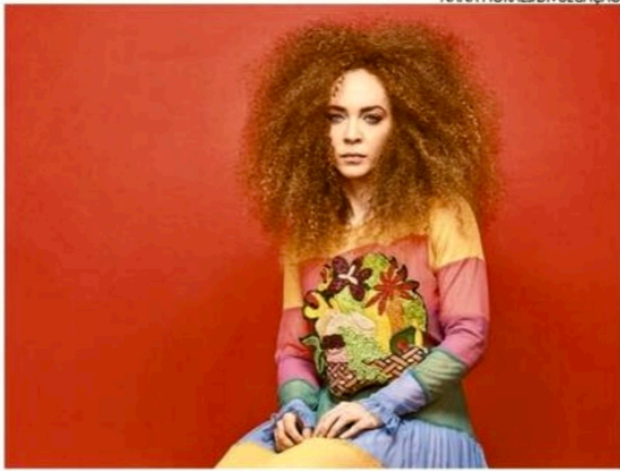
Atriz, que interpreta Marisa, não tem planos para desacelerar