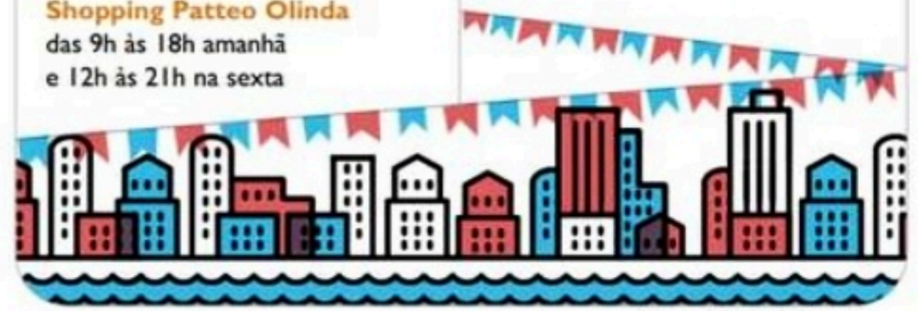
ARTE: FOLHA PE/ GREG