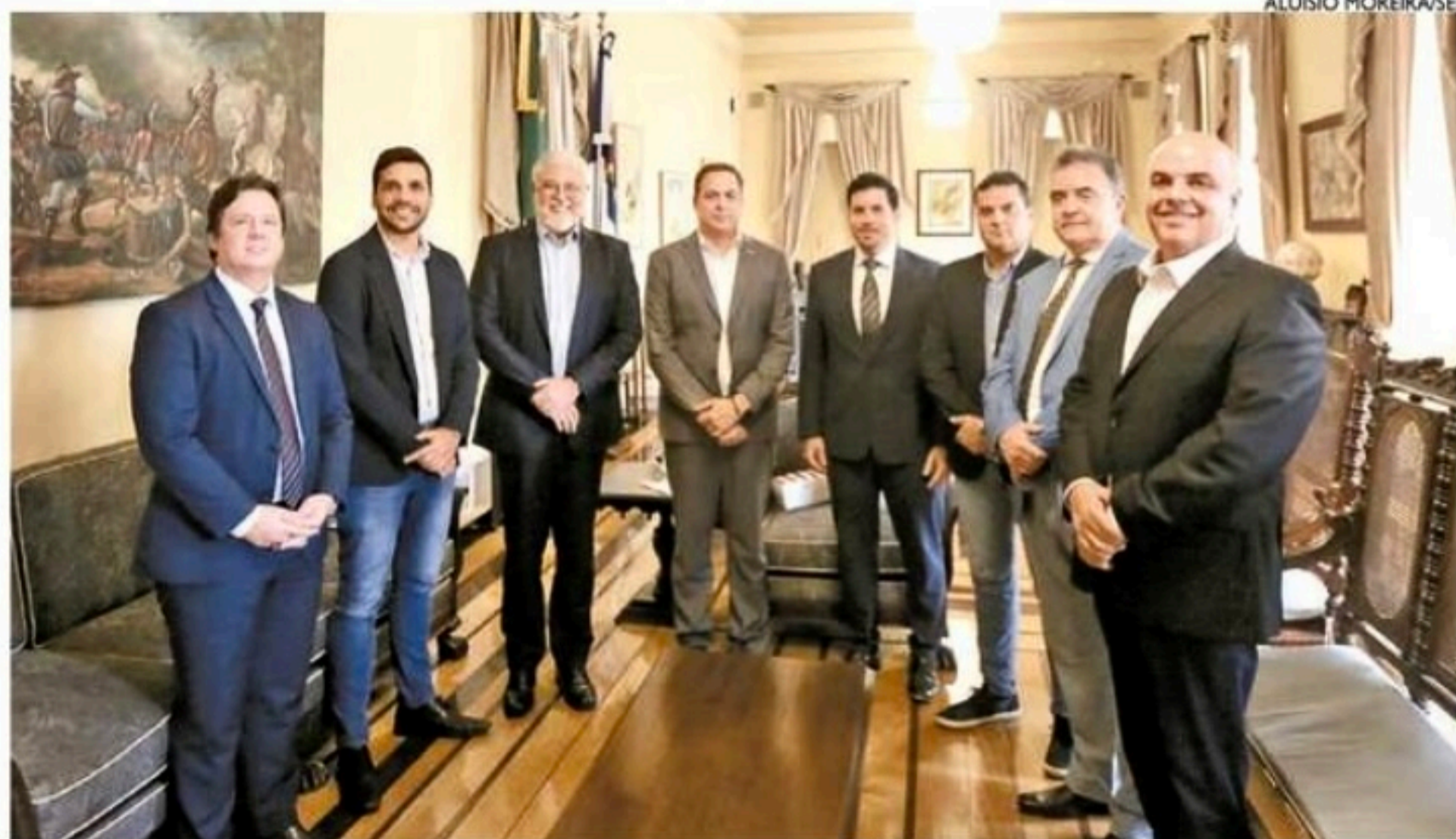
Governador Paulo Câmara e dirigentes do futebol pernambucano discutiram o formato do programa

A primeira versão do Todos com a Nota, de 1998, permitia a troca de R$ 50 em notas fiscais por ingressos, com a capacidade máxima dos estádios. Já a versão de 2007, R$ 100 em notas fiscais valiam por um ingresso, mas com um número pré-determinado de bilhetes.