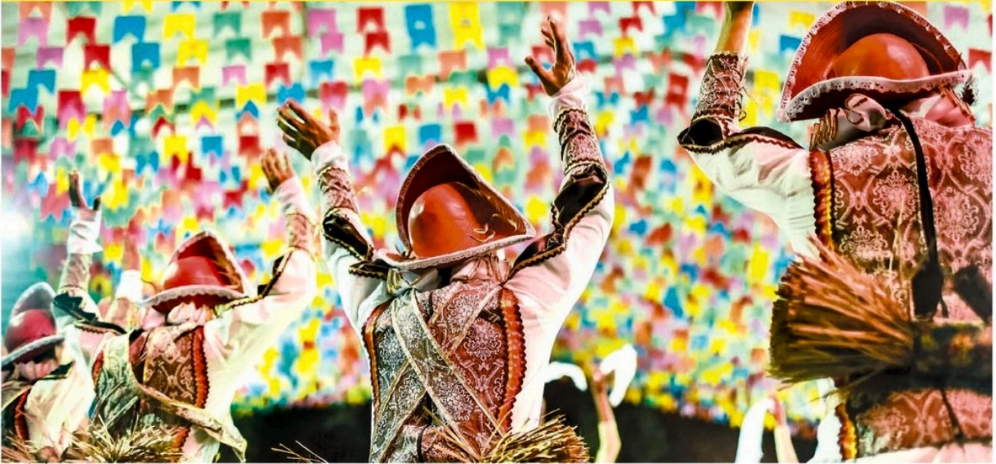
ANDREA RÉGO BARROS/PCR

Recife, quarta-feira, 22 de junho de 2022 Ano XXV n° 143