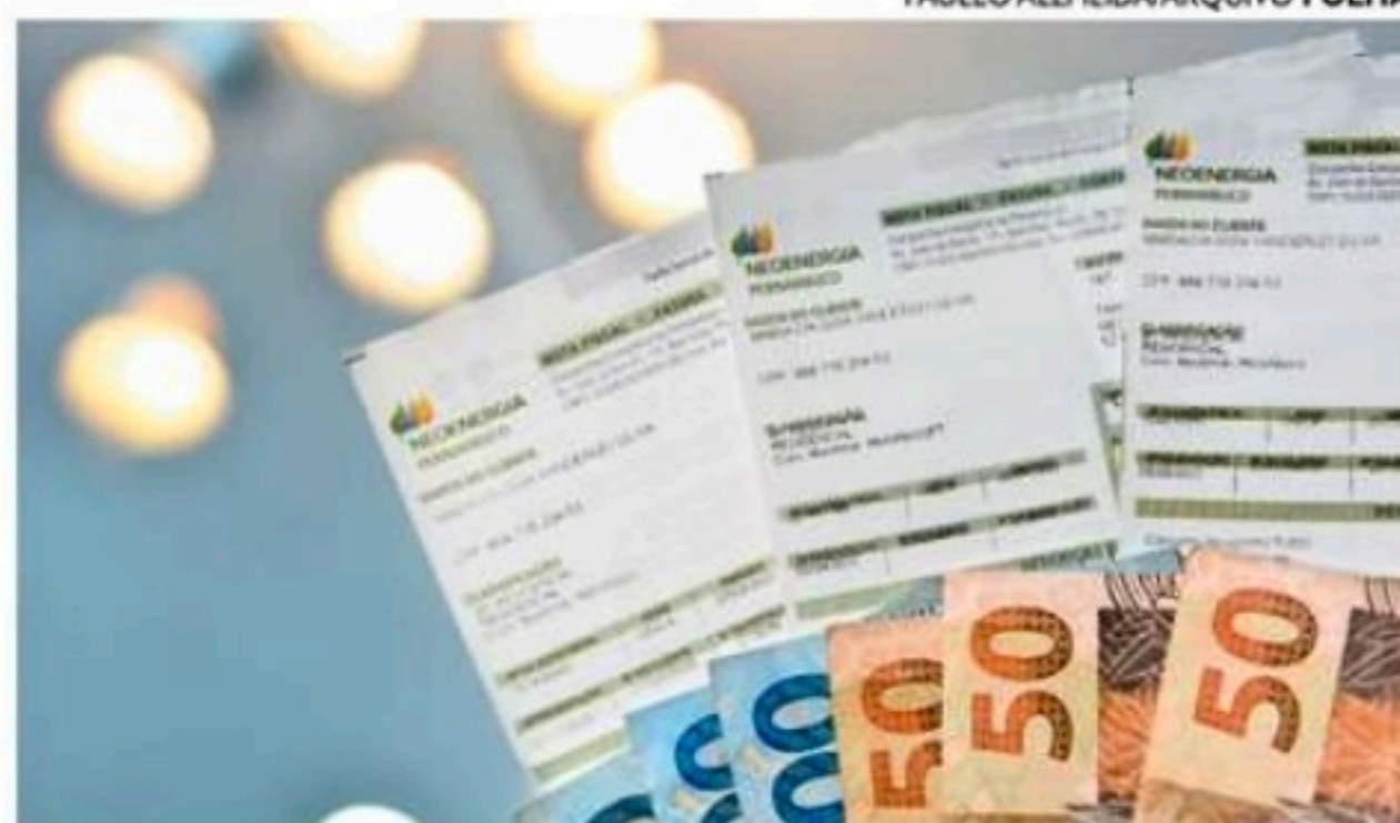
A bandeira verde, sem custo adicional, vigora no País desde 16 de abril

A coluna Nem 8 nem 80 é publicada às quartas e sextas.