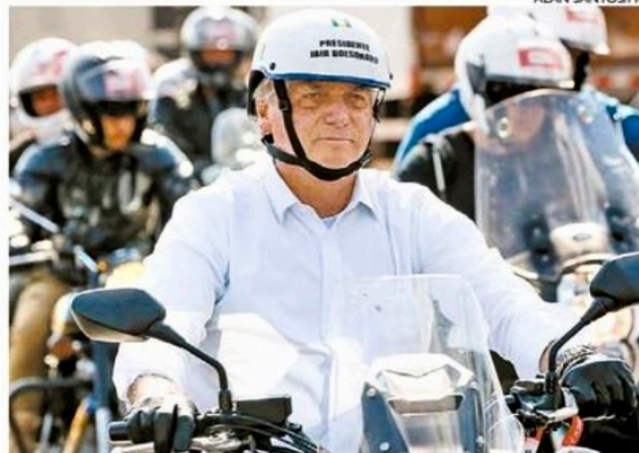
Presidente vai começar agenda com uma motociata com apoiadores