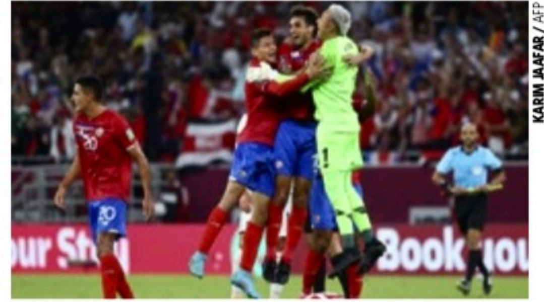
CLASSIFICADA Jogadores comemoram a vitória contra a Nova Zelândia