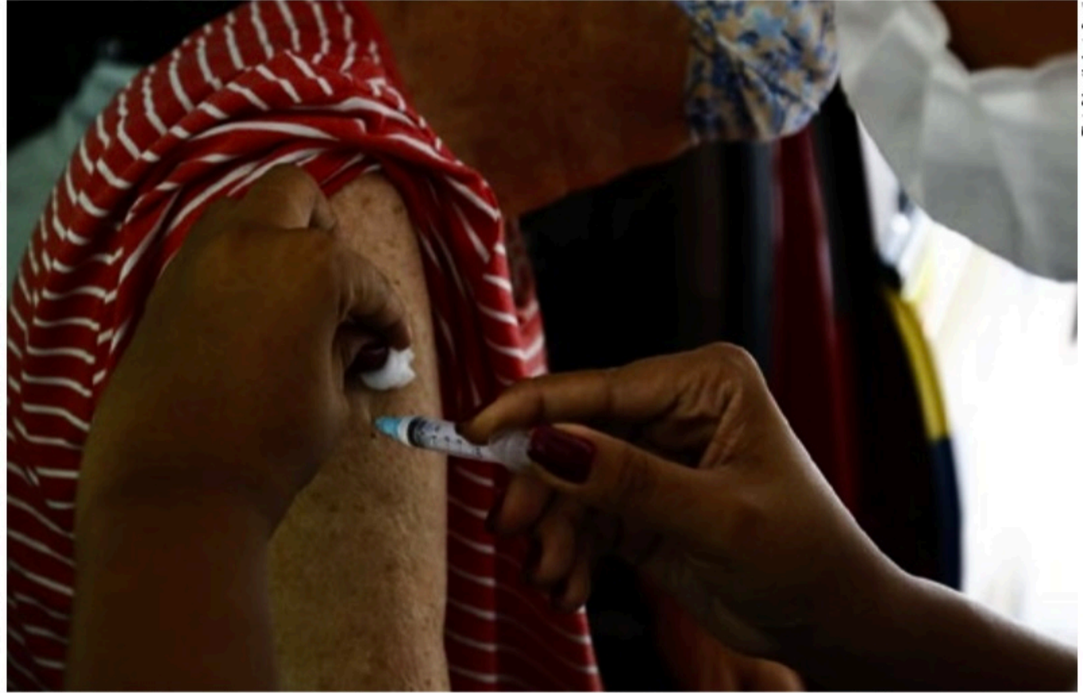
BAIXA COBERTURA Apesar das campanhas de conscientização, apenas 49,6% das pessoas receberam a terceira dose no Estado até agora

as pessoas que receberam a dose única da Janssen e tomaram o mesmo imunizante como dose de reforço tiveram aumento de até 94% de proteção contra a covid-19, quando aplicado com no mínimo dois meses de intervalo. Com apenas uma dose, esse índice é de 75%. Esses resultados embasaram o Centro de Controle e Prevenção de Doenças (CDC, em inglês), que também recomendou o reforço.