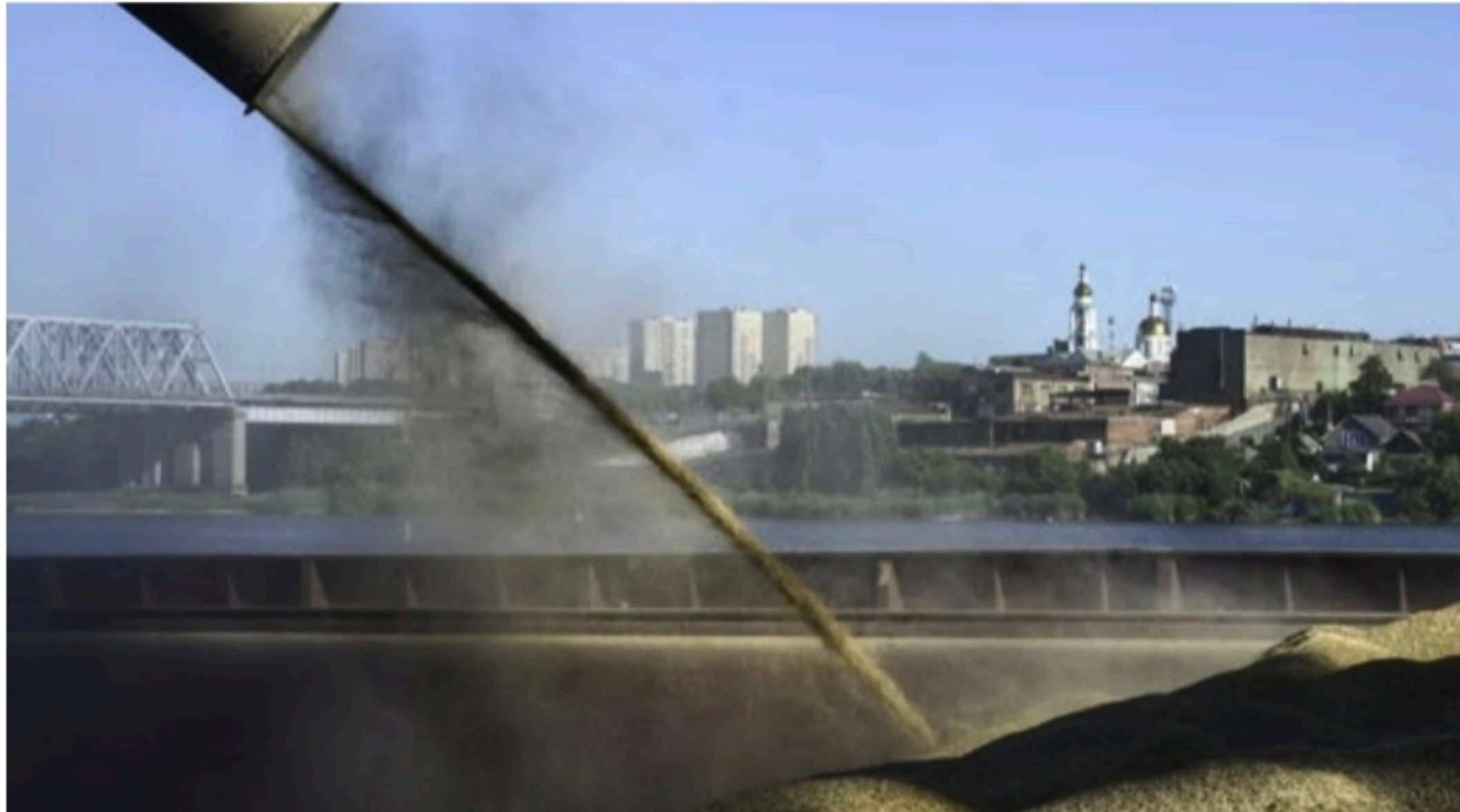
DESABASTECIMENTO Invasão teve um impacto global, agravando a crise alimentar em muitos países devido ao aumento dos preços de grãos e fertilizantes

A invasão da Ucrânia pela Rússia, dois importantes produtores de fertilizantes, abre uma corrida para a produção desses insumos, principalmente nas Américas.