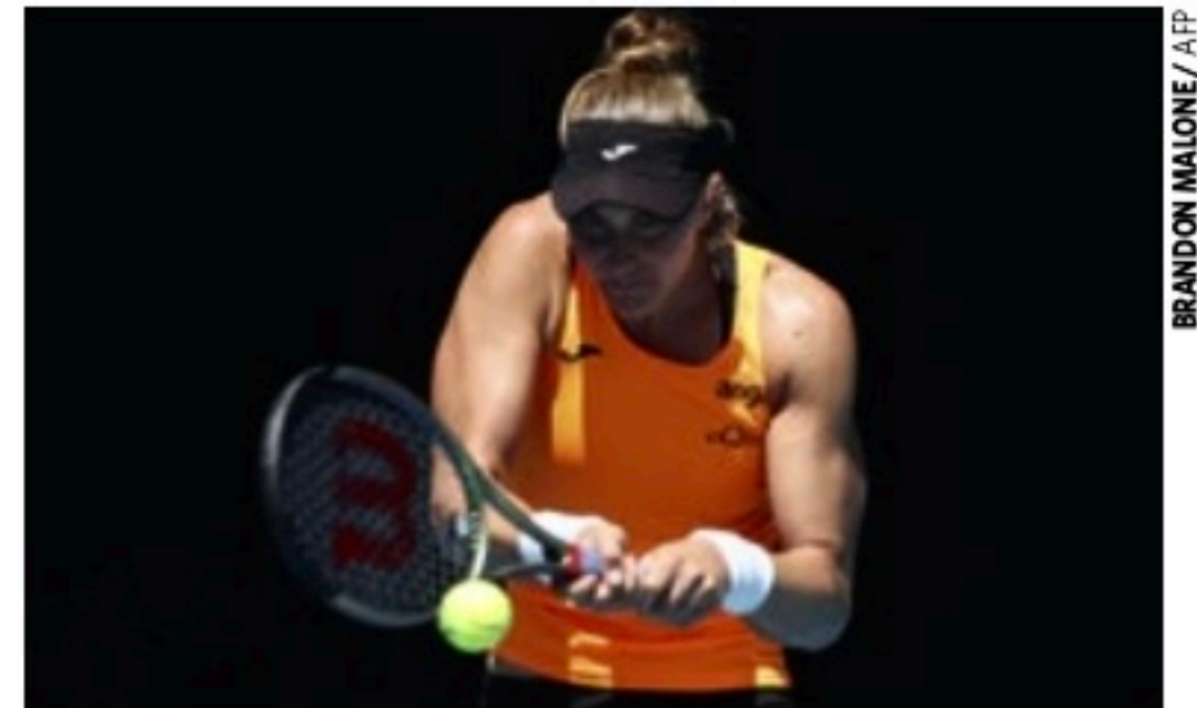
CRESCIMENTO Campeã do WTA 250 de Nottingham vive ótimo momento