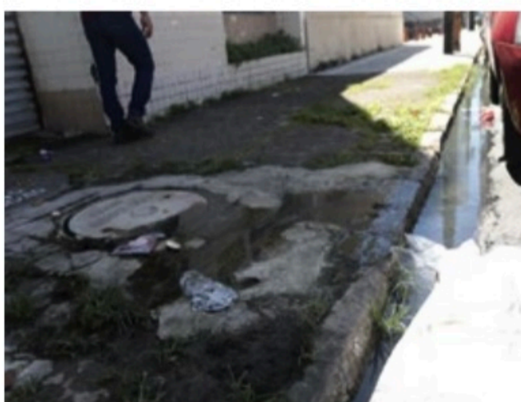
BRUNO CAMPOS / VOZ DO LEITOR