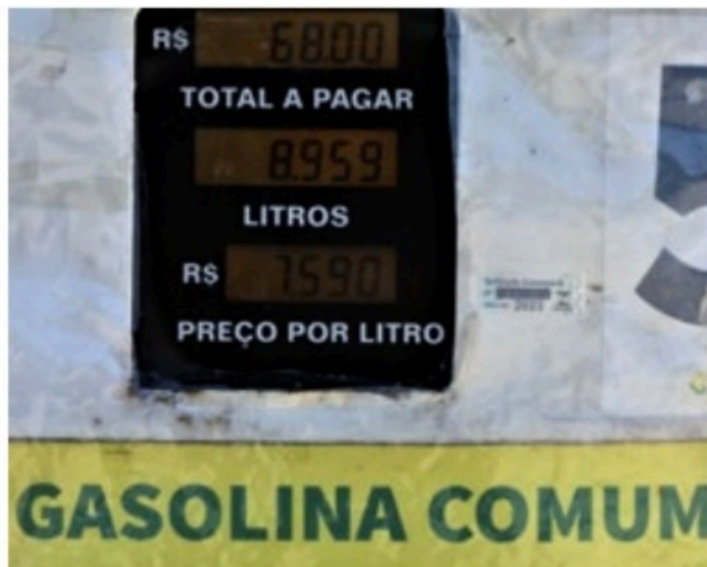
PREÇO Na semana passada, em meio aos debates, gasolina subiu R$ 0,60

Assim, em tese, o preço final passaria dos R$ 7,39 para R$ 4,89. Uma redução