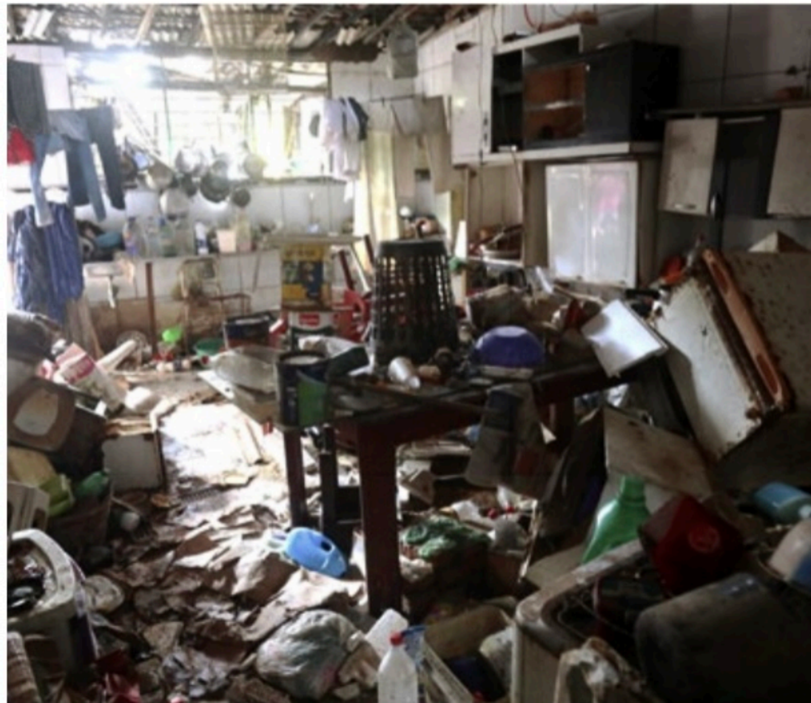
UM POUCO DE ALÍVIO Valor pago vai ajudar famílias a diminuir os prejuízos causados pelos alagamentos

Caso o beneficiário não possua celular, deve procurar um dos Centros de Referência Especializados de Assistência Social (Creas) ou Centros de Referência da As-