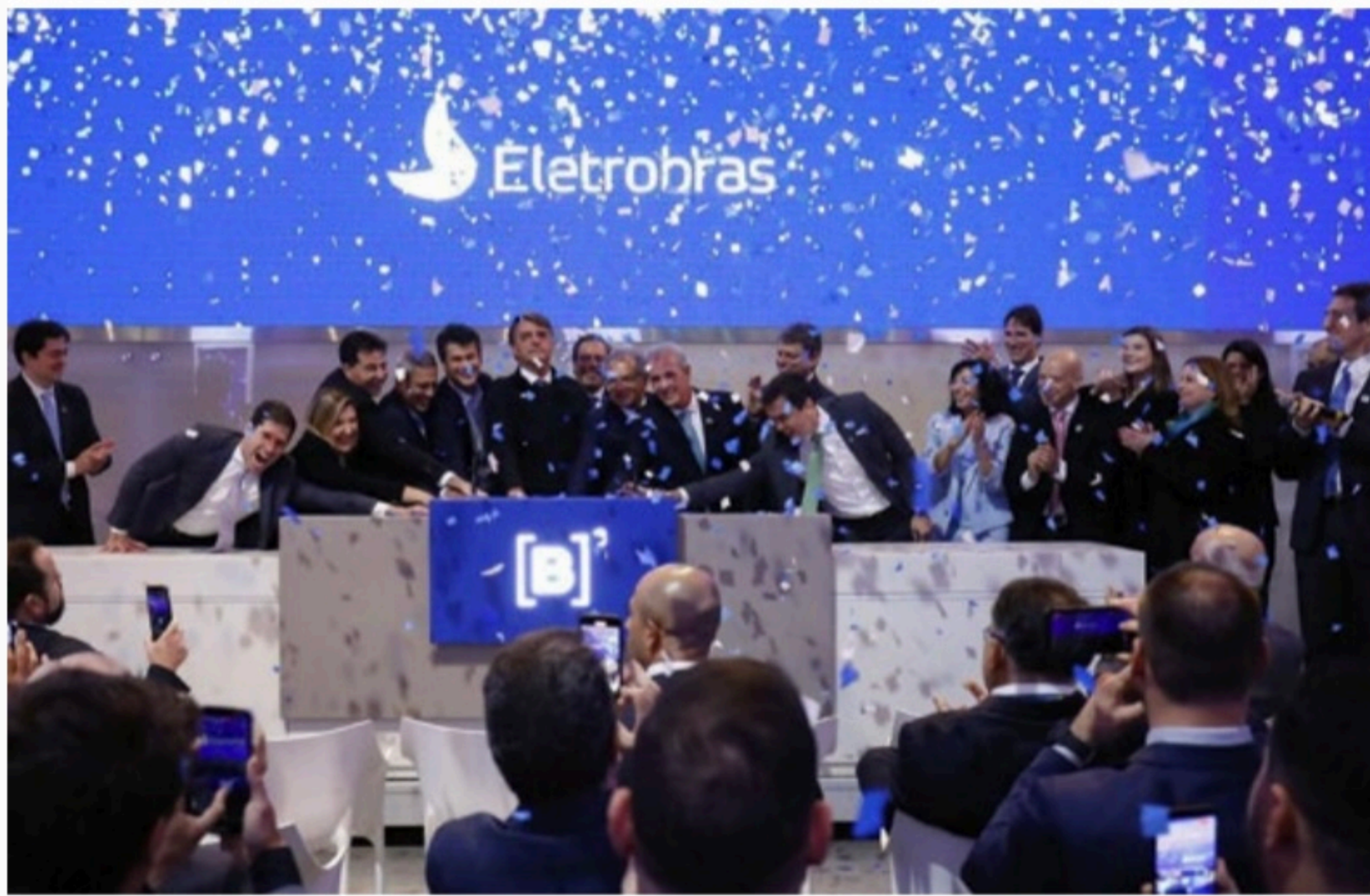
TOQUE DE CAMPAINHA Cerimônia celebra a oferta de ações da Eletrobras, a maior empresa do setor elétrico da América Latina, privatizada após 60 anos