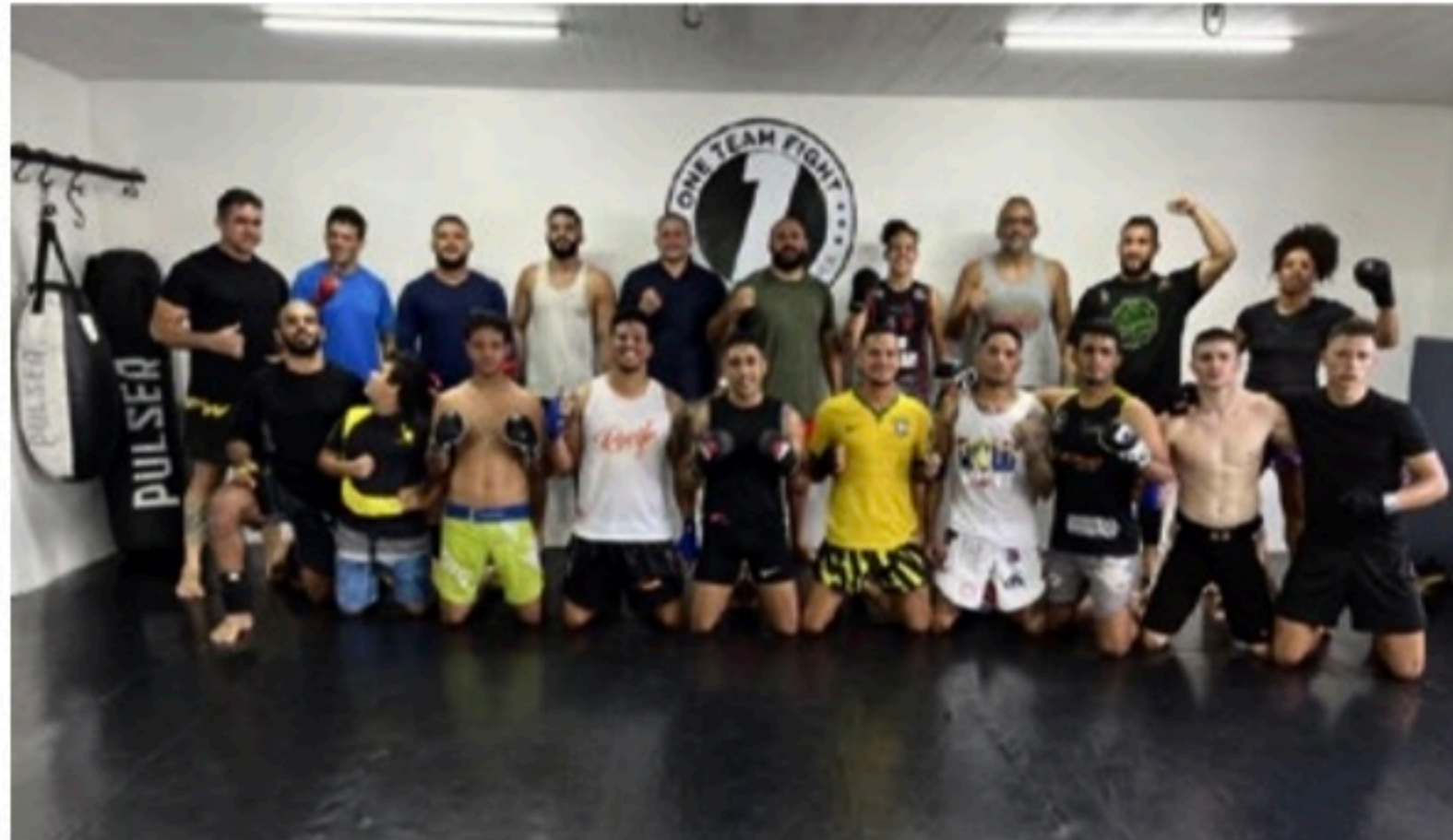
ACADEMIA Alunos da One Team Fight vão lutar em várias categorias e nos Cards principais do Number1