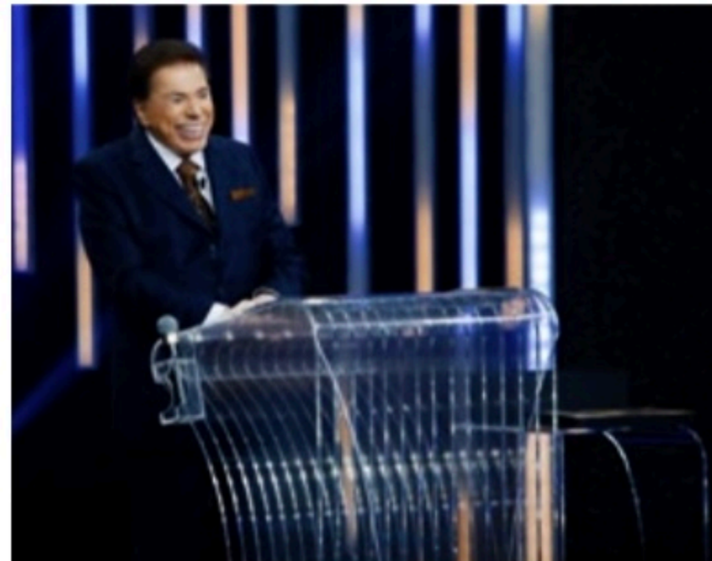
RETOMADA Silvio Santos volta com a premiação, após dois anos sem

Nesta edição, a protagonista de Poliana Moça , Sophia Valverde, e os apresentadores da casa Carlos Alberto de Nóbrega, Eliana, Danilo Gentili, Patrícia Abravanel e Rebeca Abravanel subirão ao palco da premiação.