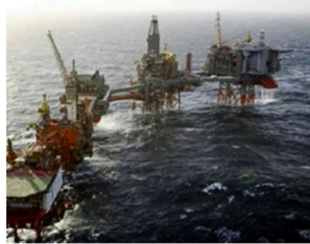
REAJUSTE Petrobras deve anunciar em breve nova alta da gasolina e diesel

A pressão do governo sobre a diretoria da Petrobras não chega a ser ilegal. Mas o artigo 117 da Lei das S.A. diz que o acionista controlador pode responder por abuso de poder quando adotar políticas ou decisões que causem prejuízo à empresa - o que aconteceria se a Petrobras deixar de reajustar seus preços a pedido do governo. A lei afirma também que o controlador deve preservar o poder de