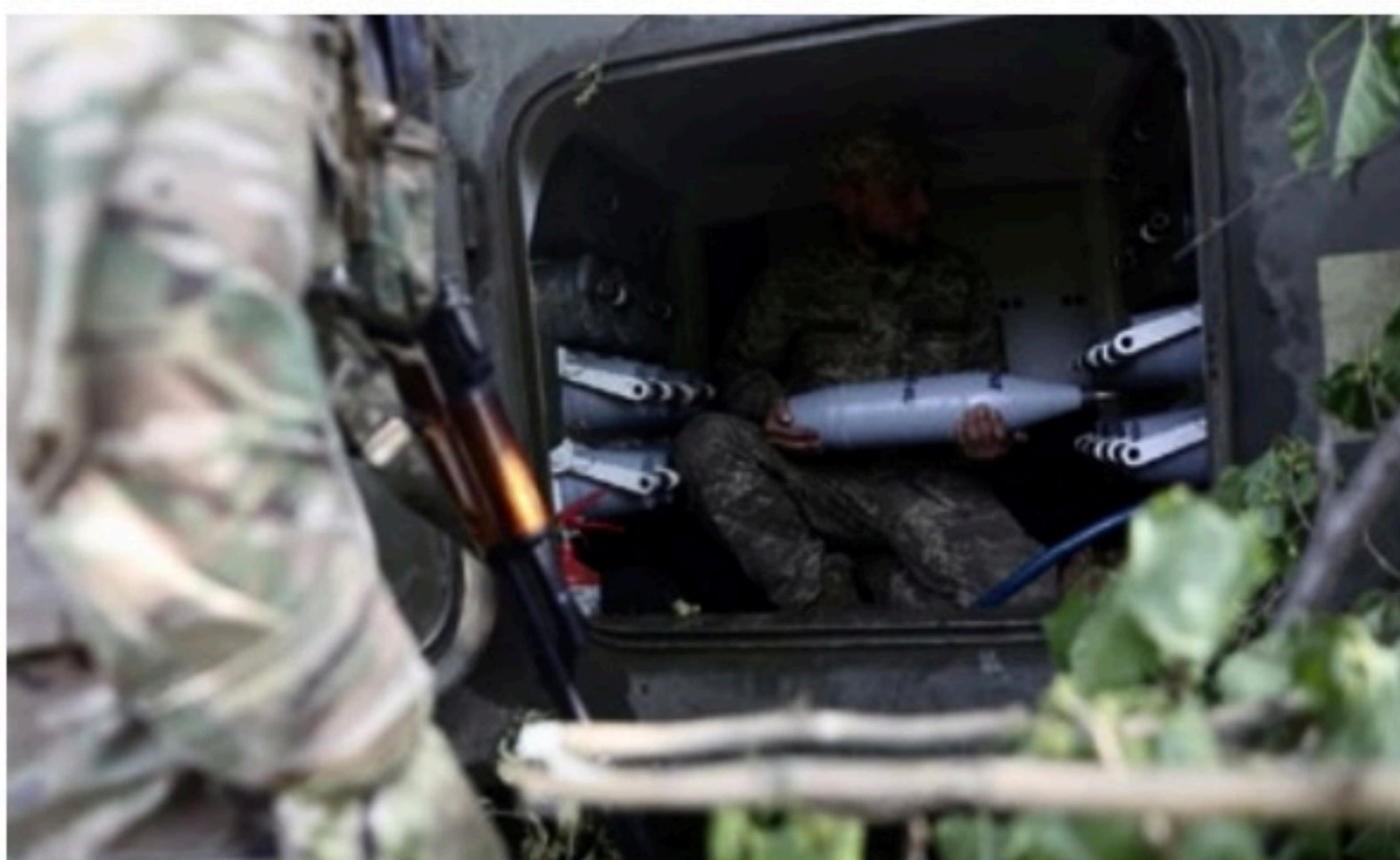
ARTILHARIA Ucrânia afirma que recebeu só '10% das armas' que pediu aos ocidentais para resistir à invasão

A Rússia é o maior exportador de fertilizantes do mundo, com vendas de 7,6 bilhões de dólares por ano em 2020, segundo o Observatório Econômico da Competitividade (OEC), praticamente paralisado pela guerra e pelas sanções internacionais. Sua produção cobriu 12,1% da oferta global.