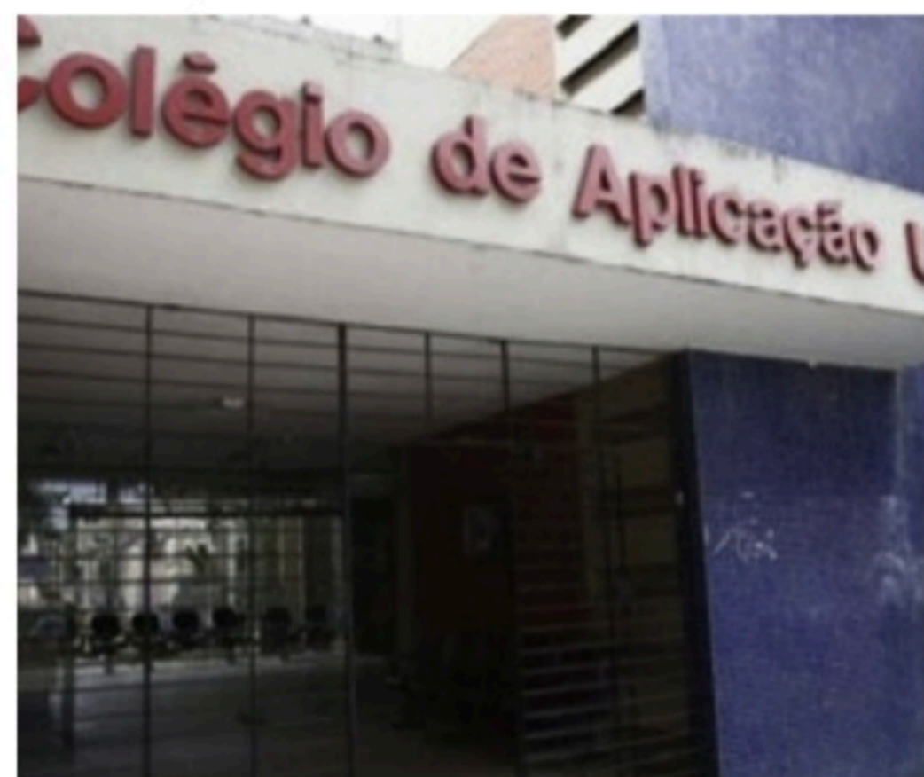
UFPE Edital com regras para vagas deve ser publicado até o final do mês