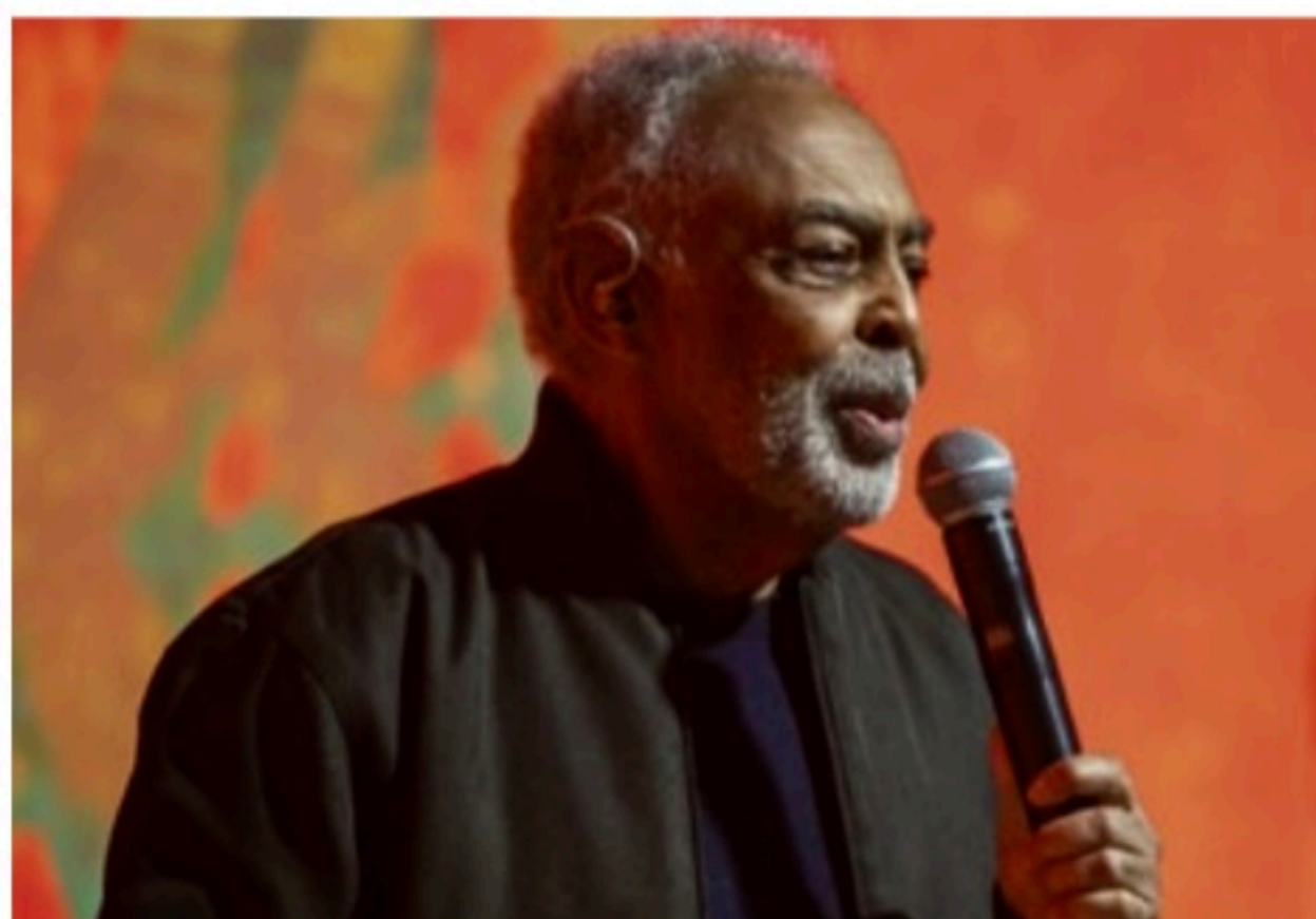
VIDA E OBRA Gil, que completa 80 anos no dia 26, ganhou um rico museu digital na plataforma

A preciosidade da carreira de Gil está no álbum de 1982, gravado em Nova York, nunca lançado e que acabou perdido em sua volta ao Brasil. Agora, sua história chega ao público pela primeira vez. O material do “disco perdido” foi encontrado durante o processo de curadoria e digitalização dos materiais e revela gravações inéditas como a da música You Need Love .