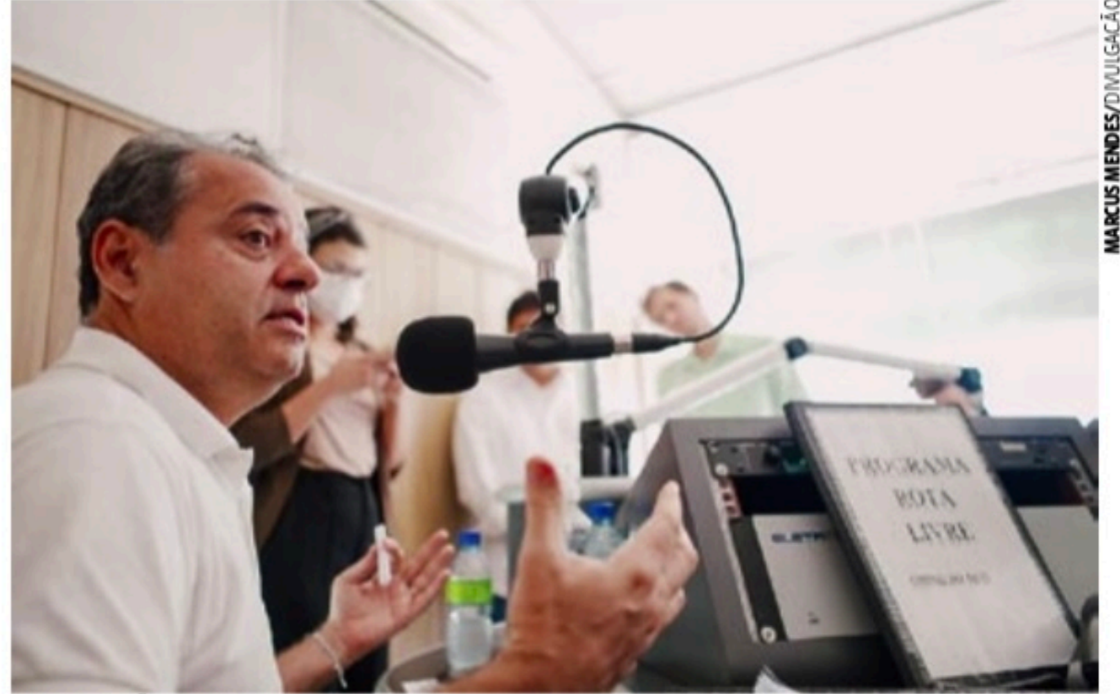
VALORIZAÇÃO Danilo reforçou os laços que tem com interior e se comprometeu em avançar com projetos

A visita de Lula a Pernambuco, adiada primeiramente por causa da crise das chuvas no estado, foi novamente postergada. Planejava-se um 'giro pelo Nordeste', contemplando a pré-campanha de Danilo Cabral, ainda na segunda quinzena deste mês.