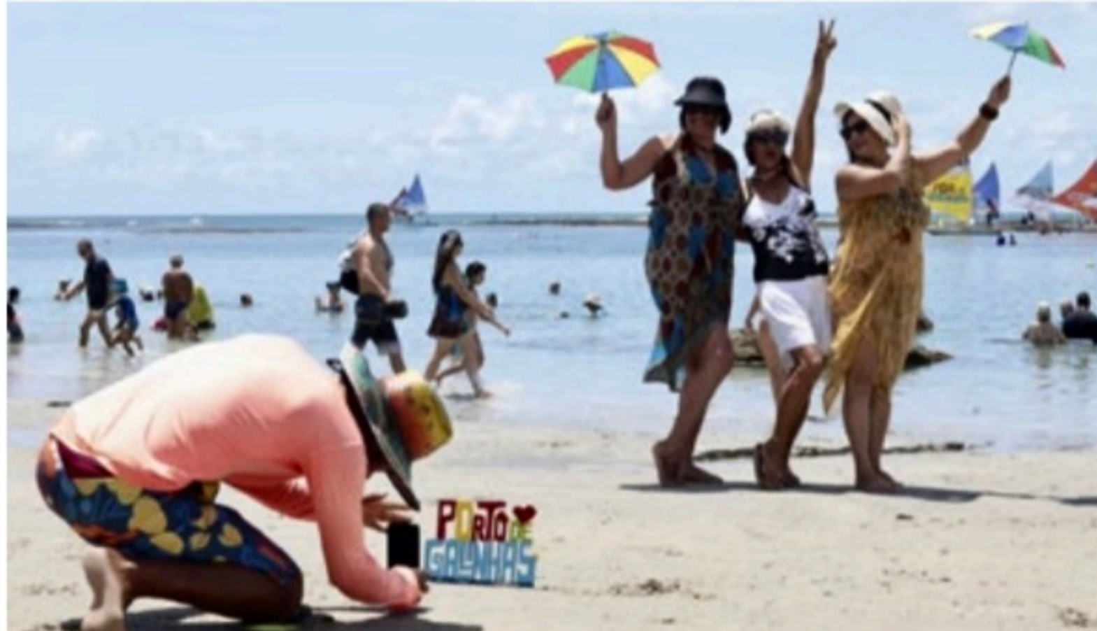
MAIS FÔLEGO Na comparação com abril de 2021, a alta no setor de turismo foi de 70,4% em Pernambuco

viços produz indicadores que permitem acompanhar o comportamento conjuntural do setor de serviços no País, investigando a receita bruta de serviços nas empresas formal-