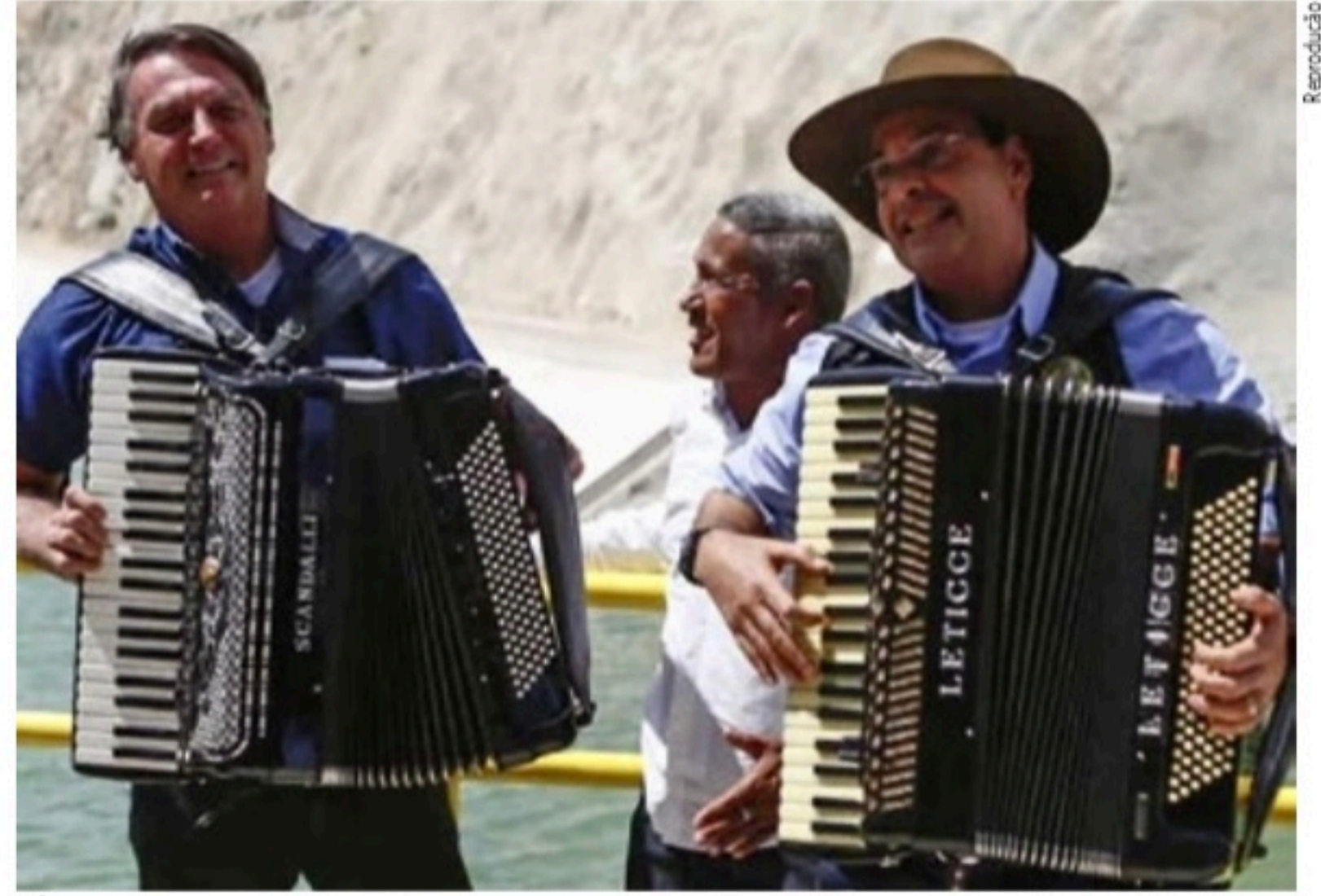
PÁTIO DE EVENTOS Nos bastidores, espera-se que Bolsonaro faça passagem pelo meio do público

É no dia 23 que Gilson Machado sobe ao palco do São João de Caruaru. Não espera-se discurso político: é que o ex-ministro tocará junto com sua banda, Forró da Bruce lose.