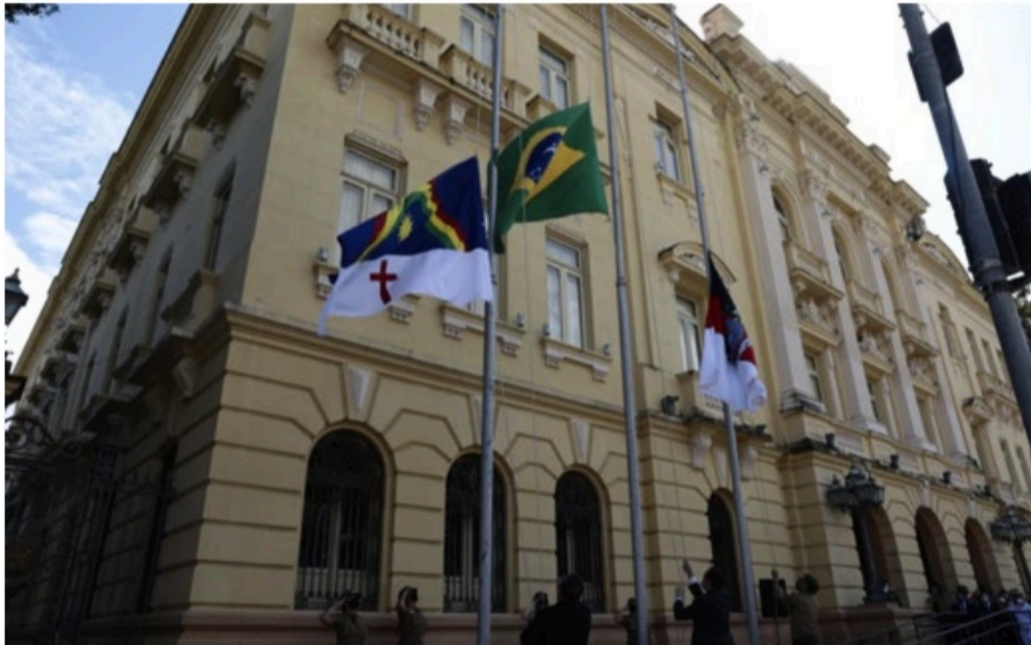
REVISÃO Com a promulgação da PEC, será necessário revisar as Leis de Diretrizes Orçamentária (LDO) e a LOA, Lei de Orçamento Anual

Os estados estavam revidendo as necessidades de ajuste nas receitas, de modo a que, em 2024, os orçamentos já não tivessem essas receitas. Esse quadro foi integralmente mudado e será preciso rever todas as contas.