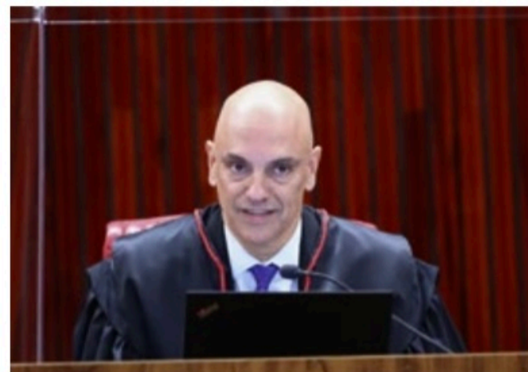
COMANDO Alexandre de Moraes foi eleito presidente do TSE

"Traz-me tranquilidade a certeza de que a condução dos afazeres da justiça eleitoral estará, a partir do dia 16 de agosto vindouro, sobre a batuta do eminente ministro, caríssimo amigo, Alexandre de Moraes" disse o atual presidente do TSE, Edson Fachin. "Hoje, a Justiça Eleitoral renova uma vez mais seu pacto indissolúvel com a democracia e com a missão de realizar eleições seguras em todo o território nacional", frisou.