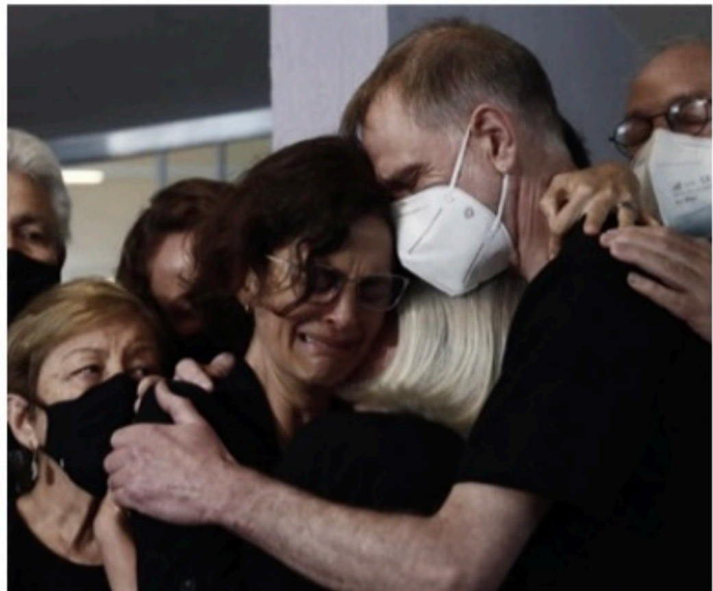
NITERÓI Funeral do jornalista Dom Phillips foi realizado ontem

Dom Phillips era colaborador do jornal britânico The Guardian e já havia produzido reportagens sobre desmata-