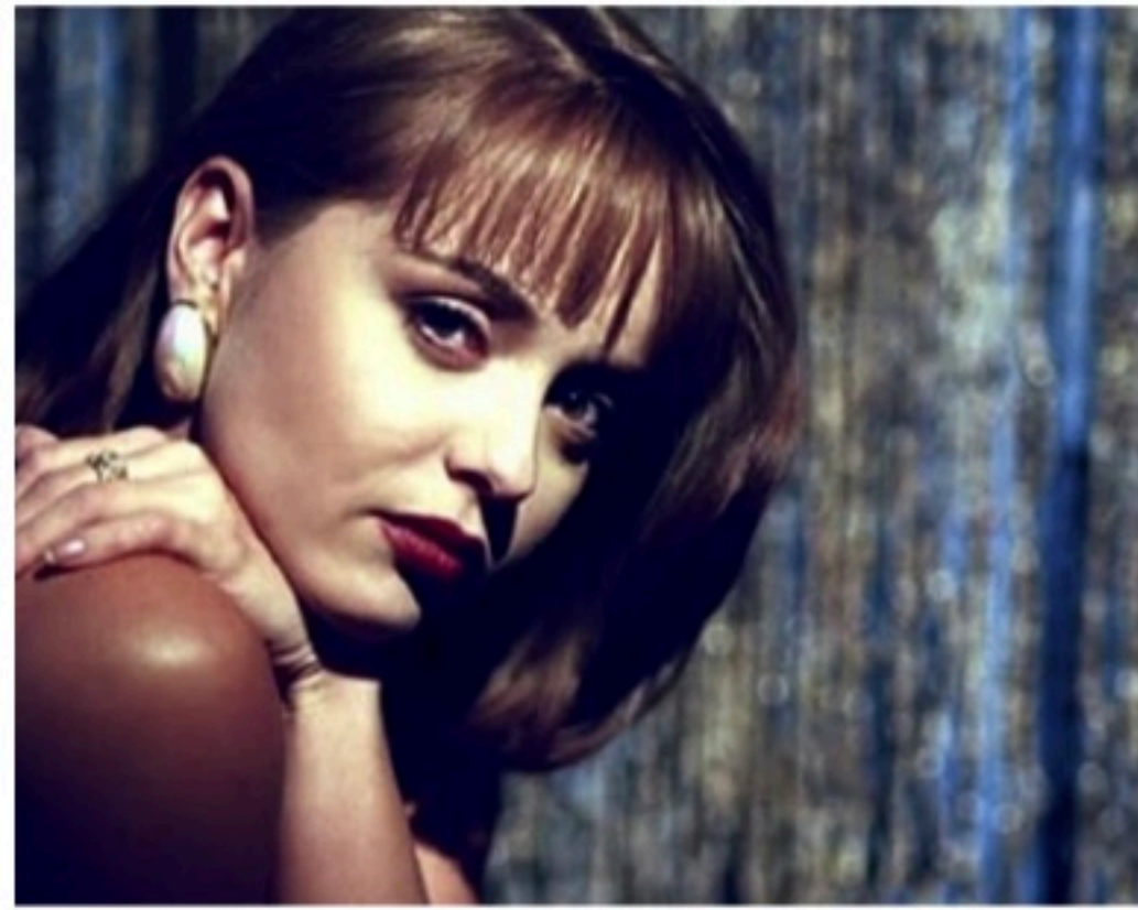
USURPADORA Gabriela Spanic interpreta as irmãs Paola e Paulina

A novela narra a história de duas mulheres idênticas, Paola e Paulina, que descobrem ser irmãs gêmeas. Enquanto Paola é fria, ambiciosa e calculista, Paulina é humilde e cresceu enfrentando dificuldades. Quando as duas se encontram, Paola vê a oportunidade de fugir da vida que tem com a sua família e propõe a Paulina que se passe por ela durante um ano. A trama se