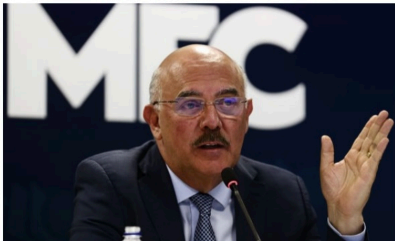
INVESTIGAÇÃO Milton Ribeiro foi preso e solto e o MPF apontou indícios de que o presidente possa ter interferido

Em documento enviado à Justiça Federal, Calandrini sugere que a ligação do ex-ministro com o presidente "tenha acontecido por meio de aplicativos de inter-