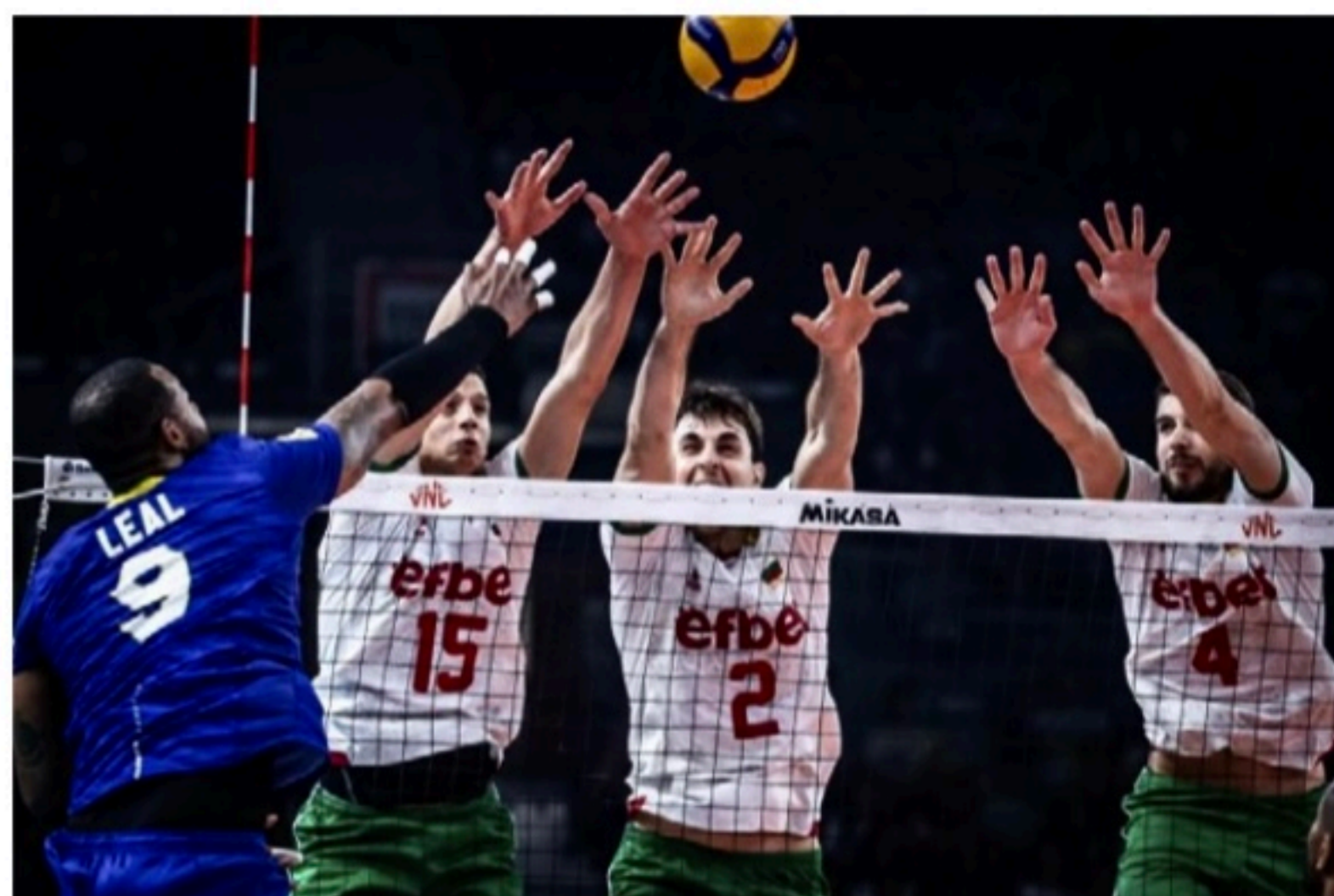
DESTAQUE Maior pontuador da partida foi o ponteiro Leal, que anotou 12 pontos (11 de ataque e um de saque)

Após encerrar a sua participação em Sofia, o Brasil volta à quadra para competir em Osaka, no Japão. A estreia vai ser diante da Alemanha, dia 6 de julho.