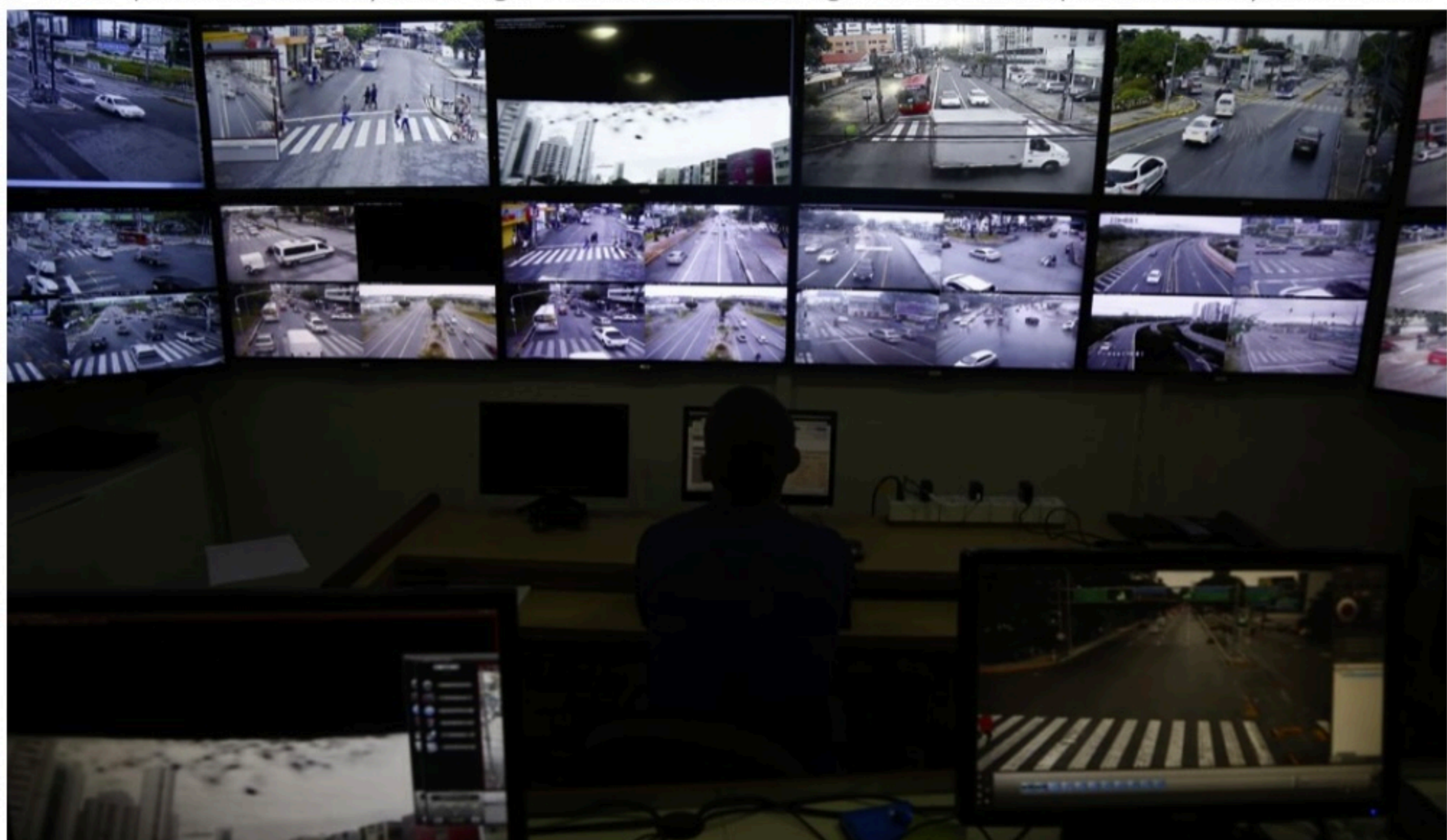
INFRAÇÕES Motorista filmado paga multa se estacionar em local proibido, em fila dupla, no passeio ou faixa de pedestre ou se fizer conversão proibida, por exemplo

E nesse pacote valem todos os tipos de infrações, inclusive as de uso do celular, manuseio ou simplesmente o ato de