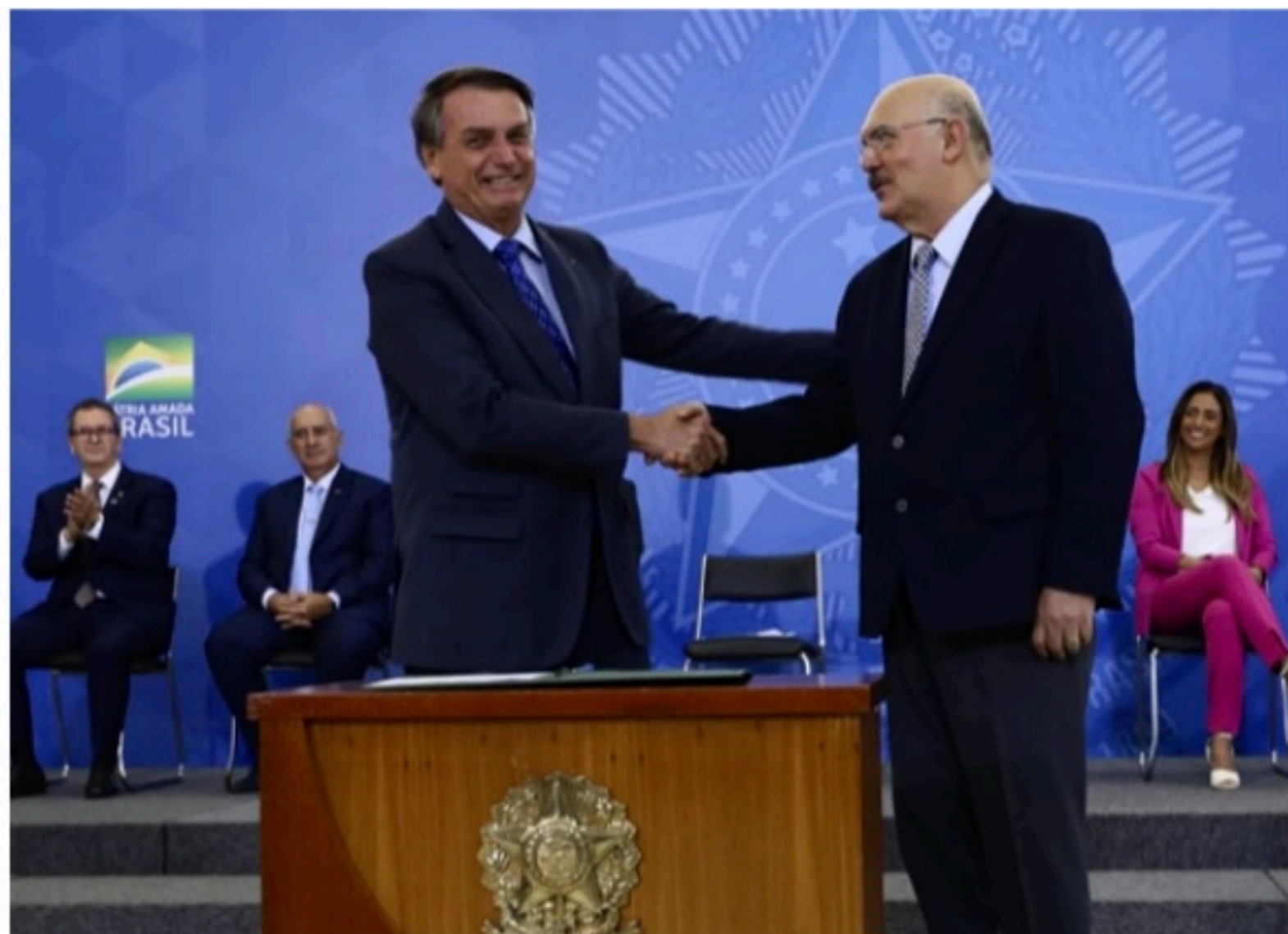
ALIADO Presidente voltou a defender Milton Ribeiro e declarou que não há indícios mínimos de corrupção

Na semana passa, em live realizada direto de Caruaru, no Agreste de Pernambuco, o presidente já havia defendido Ribeiro. "Era para dar uma moral para o pastor... A imprensa pega... Investigue aí melhor. A PF levou em conta o trabalho da CGU. O processo está em segredo de Justiça", disse o presidente. "Não resta dúvida que é constrangedor, ninguém quer isto, na casa. A imprensa quer colar em