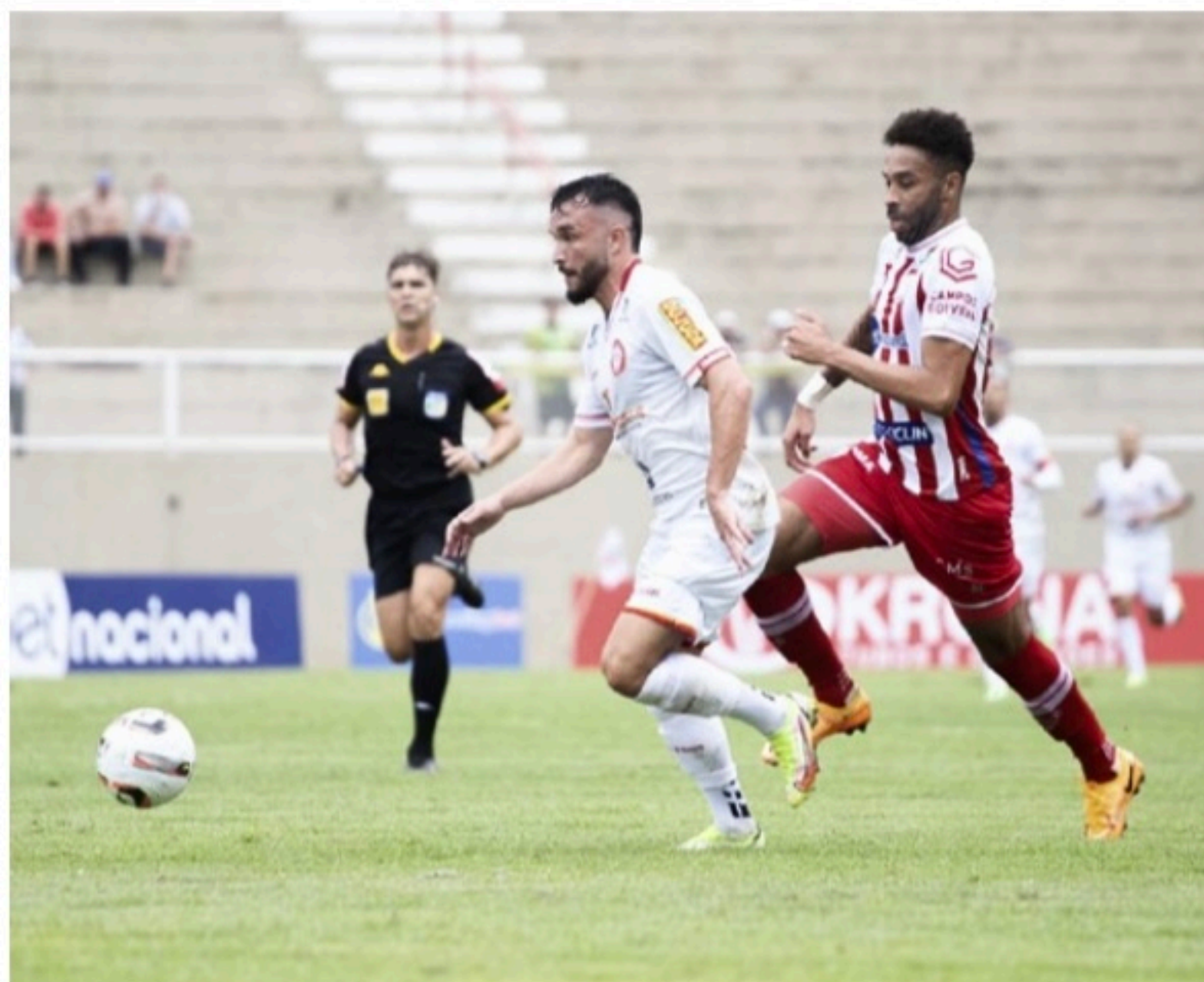
BRONCA Gol do empate do Tombense foi marcado após um pênalti duvidoso assinalado pelo árbitro

Inicialmente, o atleta havia levado apenas o amarelo, mas acabou levando o vermelho após a revisão da imagem, já que o goleiro acabou tocando duas vezes na bola, ao escor-