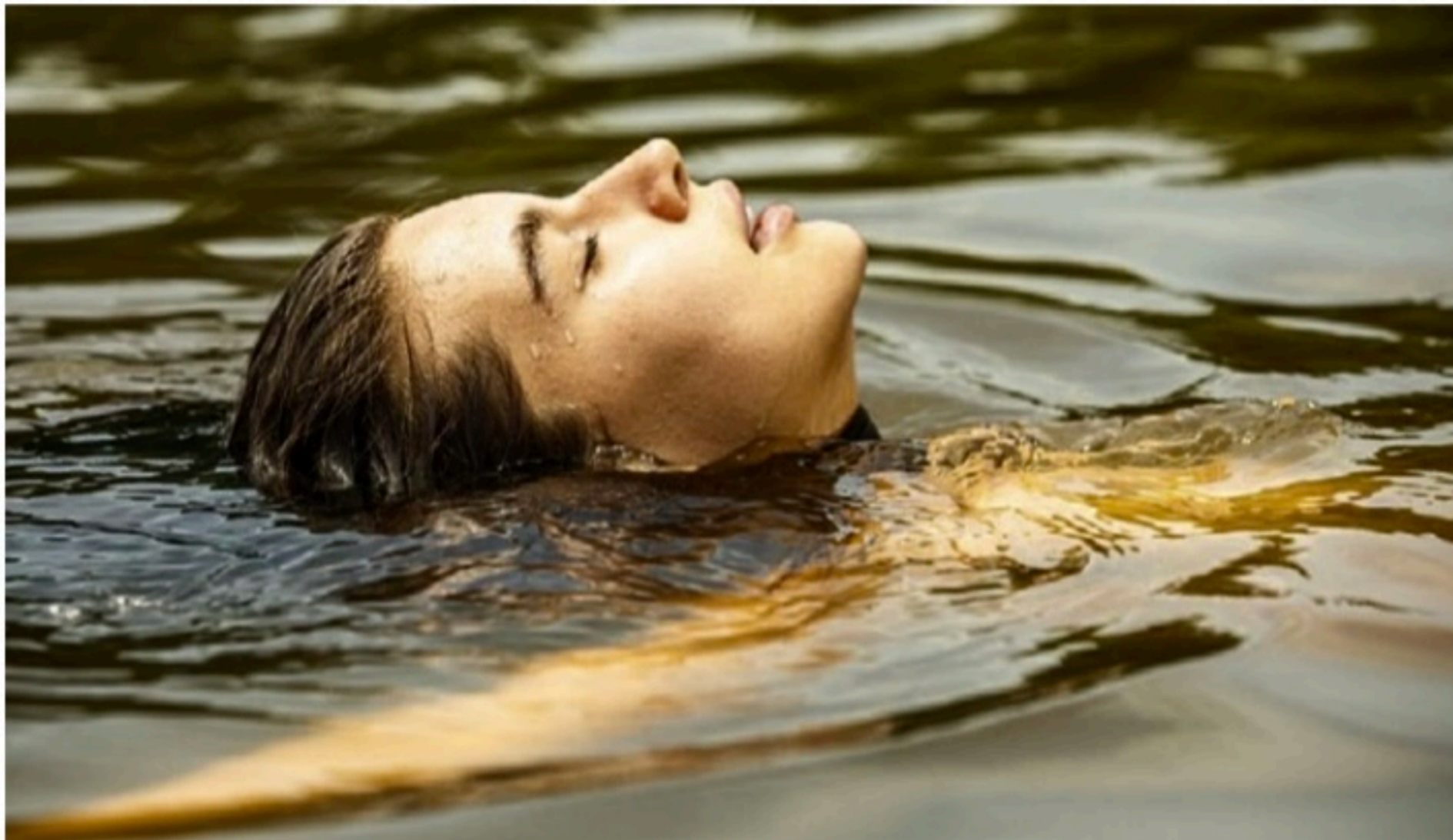
PERSONAGEM Juma Marruá, vivida antes por Cristiana Oliveira e agora por Alanis Guillen, marcou para sempre a teledramaturgia

Se em 1990 a namorada preterida por Jove, tomada pelo desejo de vingança, espalhou que o jovem era “bicha”, em