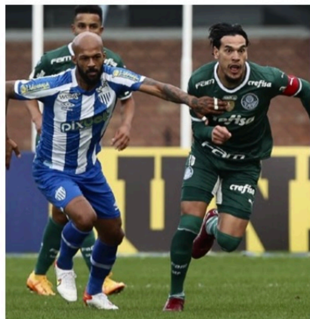
LÍDER Alviverde ficou na igualdade por 2x2 com o Avai fora de casa