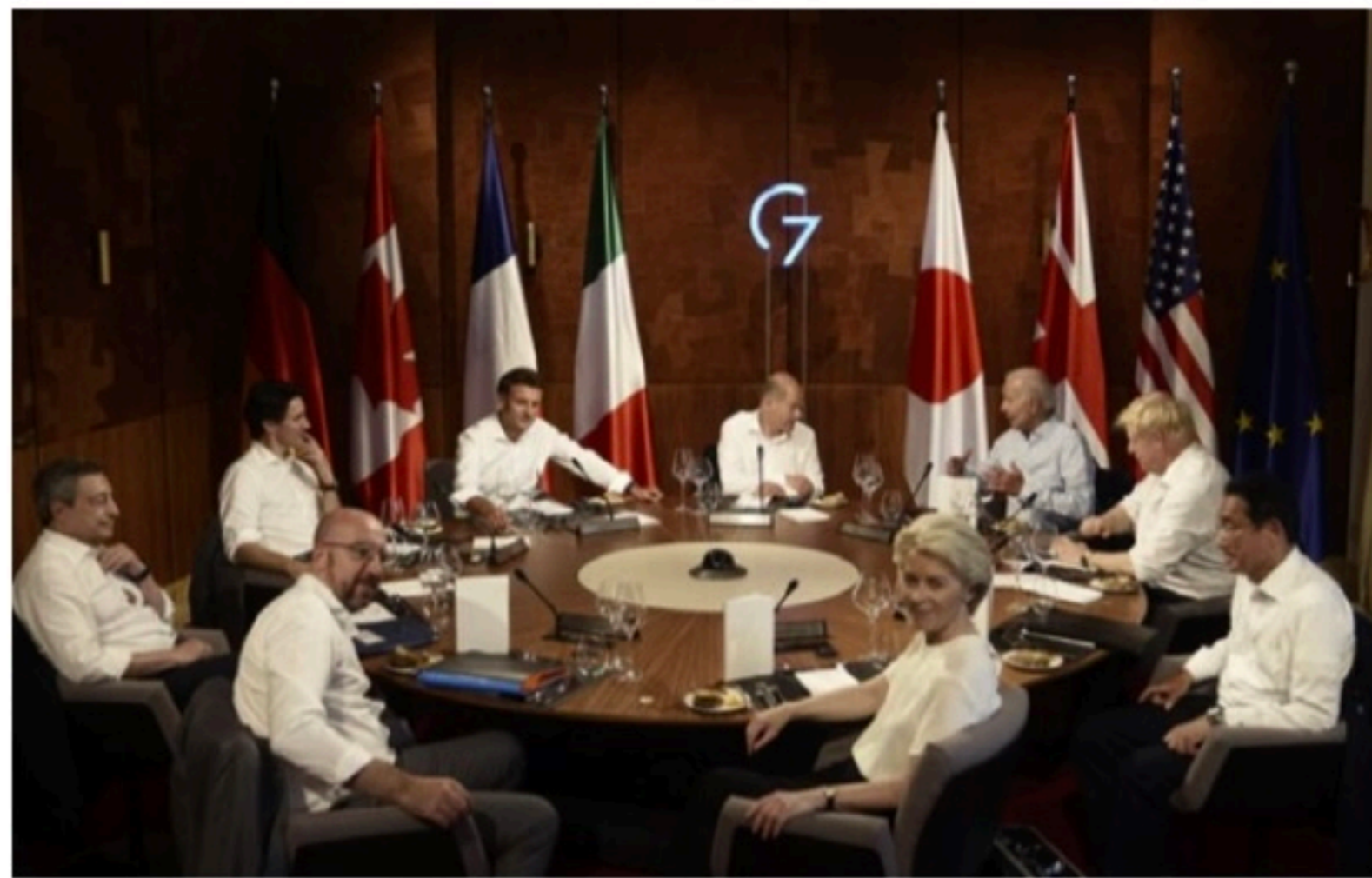
ENCONTRO Os líderes das grandes potências econômicas se reúnem por três dias no castelo bávaro de Elmau

O líder dos EUA pediu a unidade do G7 e da OTAN diante da ofensiva de Moscou. Vladimir Putin esperava "que, de uma forma ou de outra, a Otan e o G7 se separassem",