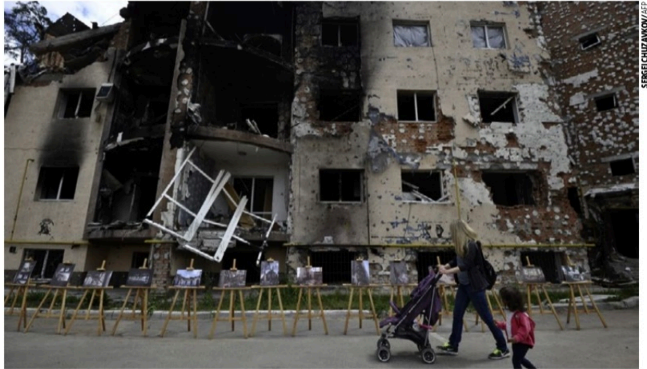
SOB ATAQUE Quatro explosões foram registradas em Kiev e atingiram um complexo residencial; capital foi um dos primeiros alvos da guerra

Após a agressão, o governo ucraniano voltou a pedir mais armas e sanções aos líderes ocidentais.