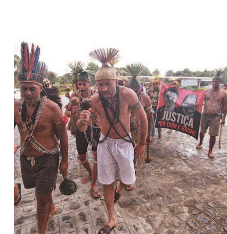
Comissão está atenta à eventual coordenação de mandantes das mortes

“Ficamos particularmente impressionados com as amea-