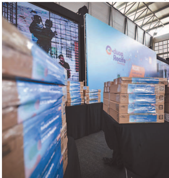
Entre os modelos, há tablets, computadores e TVs

Equipamentos irão para as salas de aula, mas também para as casas, pensando no modelo online, usado durante a pandemia