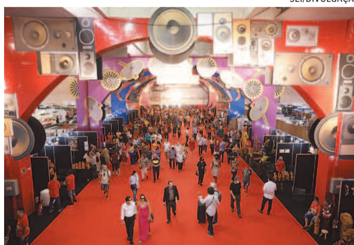
Maior evento de artesanato do estado começou ontem

7 milhões, espera-se que a feira movimente R$ 40 milhões, em 12 dias. A programação é extensa, com salões de arte, desfiles de moda, oficinas gratuitas, rodas de conversas, shows, decoração, gastronomia, atividades infantis, entre outros.