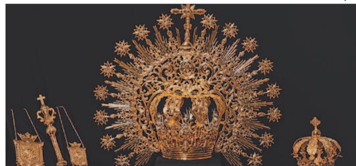
Imagem da Virgem também ganhou novas vestes

Ontem à noite, houve ainda a abertura do Novenário, com a apresentação da versão 2022 do manto da Venerável Imagem de Nossa Senhora Peregrina.