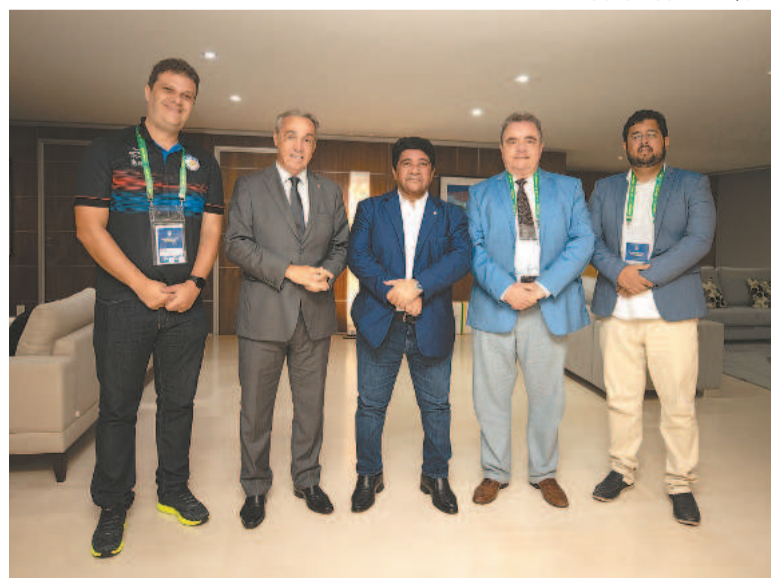
Reunião na CBF contou com representantes do estado