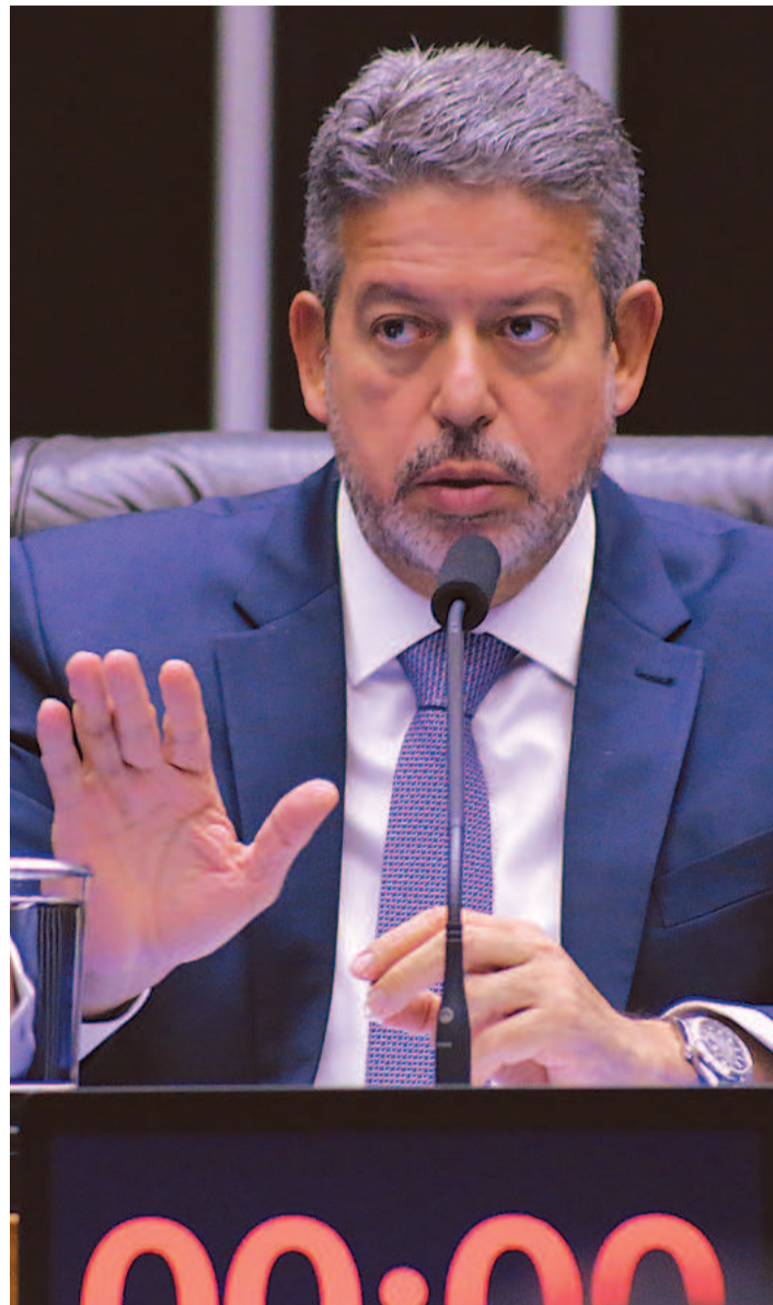
Presidente da Casa, Arthur Lira, estaria disposto a derrubar outras pautas para votar a PEC ainda hoje

Danilo Forte desistiu de incluir no texto um mecanismo que possibilitasse o pagamento para motoristas de aplicativo, como será feito a motoristas de táxi, por exemplo. A justificativa usada pelo deputado federal, foi que os aplicativos que oferecem o serviço de corrida paga não oferecem transparência.