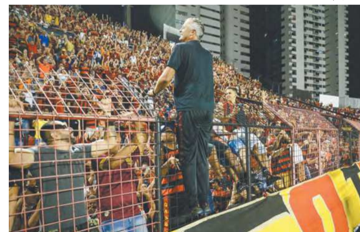
Técnico e torcida já aumentaram a conexão entre si

Esse era o grande objetivo do treinador e que parece ter sido conquistado. Porém tudo isso pode estar comprometido. Isso porque, o Sport está mui-