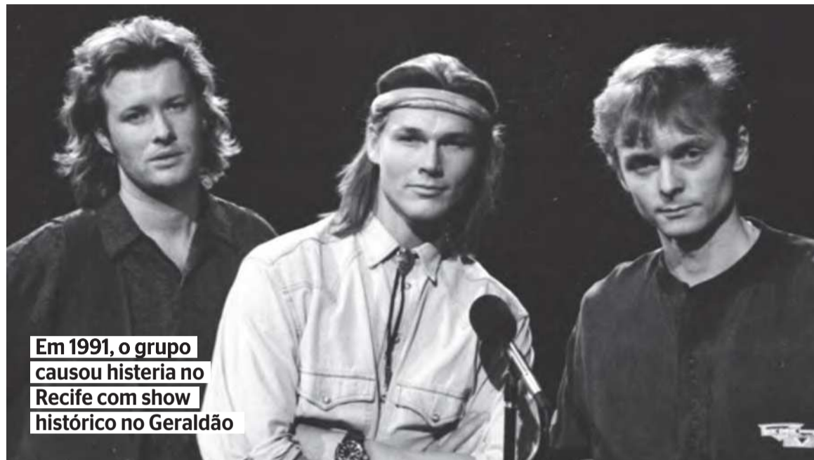
Em 1991, o grupo causou histeria no Recife com show histórico no Geraldão

Pela quarta vez na capital pernambucana, a terceira nos últimos 12 anos, banda norueguesa faz show num Classic Hall de ingressos esgotados