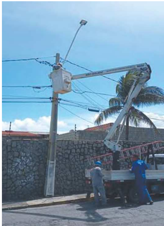
Prefeitura espera uma economia de 50% nos gastos

Após a substituição das lâmpadas da Orla de Olinda, a gestão municipal definirá junto à Secretaria de Manutenção Urbana qual será o novo ponto da cidade a ser beneficiado.