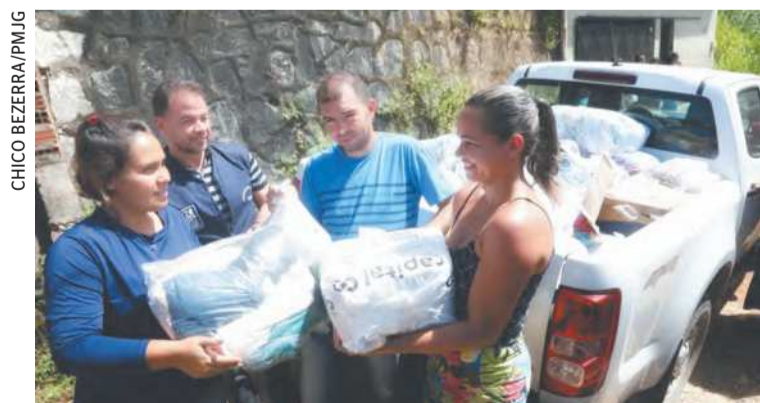
Ontem, 545 cestas foram distribuídas, em dois bairros

A Prefeitura do Jaboatão dos Guararapes entregou ontem mais 545 cestas básicas, em Vila Piedade e Vila dos Palmares. Com o ato, já são 113,5 toneladas de alimentos distribuídas. Além dos alimentos, também ocorreu a doação de kits de limpeza, produtos de higiene pessoal, fraldas, roupas e colchões.