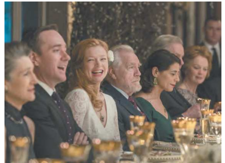
Succession fez a HBO desbancar a Netflix nas indicações

Das mais recentes produtoras, as novatas Apple TV+ e Star+ mostraram a que vieram. A primeira emplacou, além de Ted Lasso , Ruptura , com 14 indicações, e a veterana The morning show , que configura na lista de Melhor atriz em série dramática, com a atriz Reese Witherspoon. A Star+/Hulu, por sua vez, dominou a categoria de minisséries