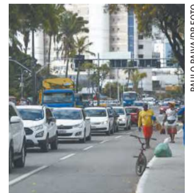
CTTU estará no local para orientar motoristas, pois o trânsito ficará complicado

A Compesa ressalta a importância da realização da obra para o bom funcionamento do sistema de esgotamento sanitário dos bairros Espinheiro, Derby e Graças, atendidos pela rede coletora de esgoto.