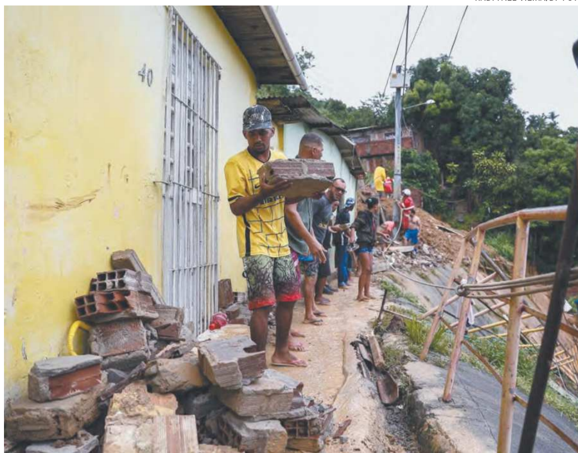
Primeira parte foi para as vítimas da tragédia, que matou mais de 130 pessoas no estado

De acordo com o Governo, 99% dos recursos da primeira fase do Auxílio Pernambuco já foram liberados