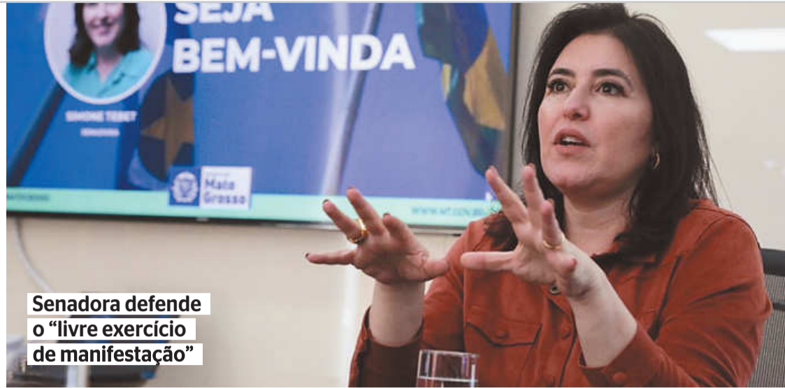
Senadora defende o “livre exercício de manifestação”

te do PSDB, por sua vez, espera que a Justiça Eleitoral e as instituições em geral possam “coibir com muita energia episódios de violência que tenham como pano de fundo as eleições”. (Vincius Doria, do Correio Braziliense)