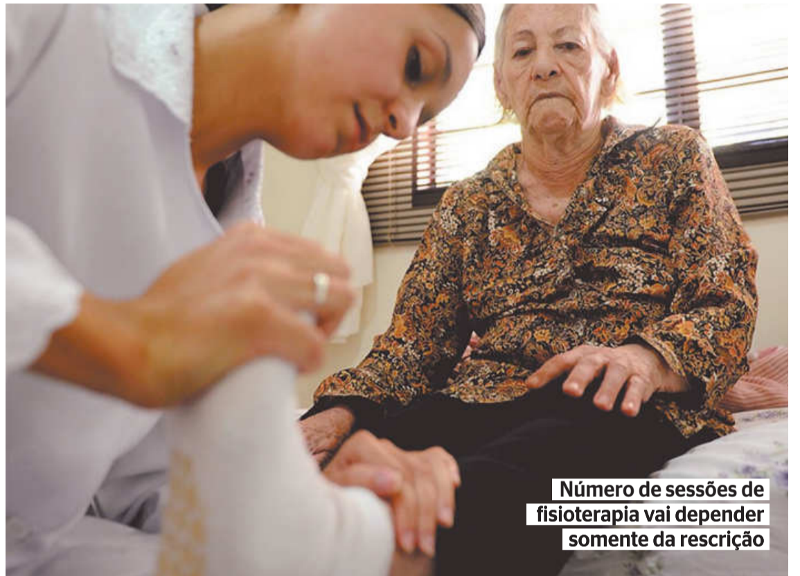
Número de sessões de fisioterapia vai depender somente da prescrição

proprietário da Tecon Suape, de que o processo para a venda do Atlântico Sul estaria privilegiando o grupo Maersk ao lhe conceder a cláusula de stalking horse . Esta permite que o Maersk, grupo filipino, cubra qualquer oferta de compra a partir da abertura dos envelopes. O estaleiro se encontra em recuperação judicial desde janeiro de 2020, época em que os donos, a Queiroz Galvão e a Camargo Correia, pediram a reestruturação de uma dívida de R$ 1,4 bilhão.