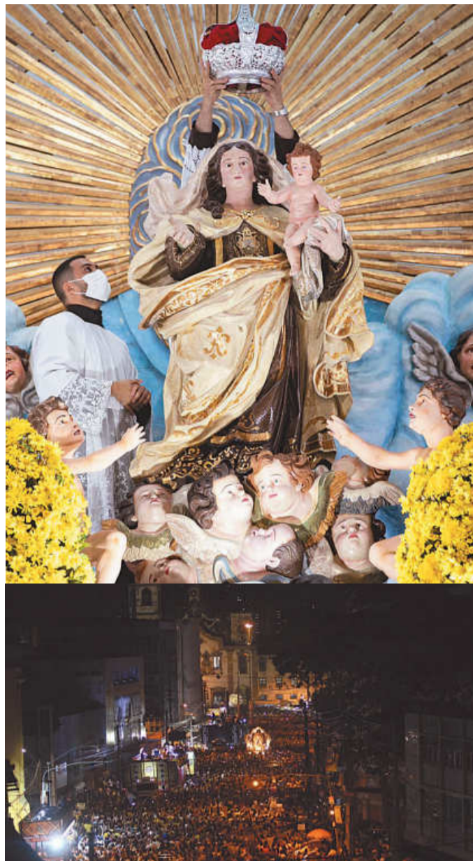
Neste sábado, a procissão volta, após dois anos

nimes na oração, juntamente com Maria, Mãe de Jesus" (Cf. At 1, 14). A temática faz referência ao 18º Congresso Eucarístico Nacional (CEN) que será celebrado pela Arquidiocese de Olinda e Recife e realizado na capital pernambucana, de 11 a 15 de novembro, e traz como tema, "Pão em todas as mesas".