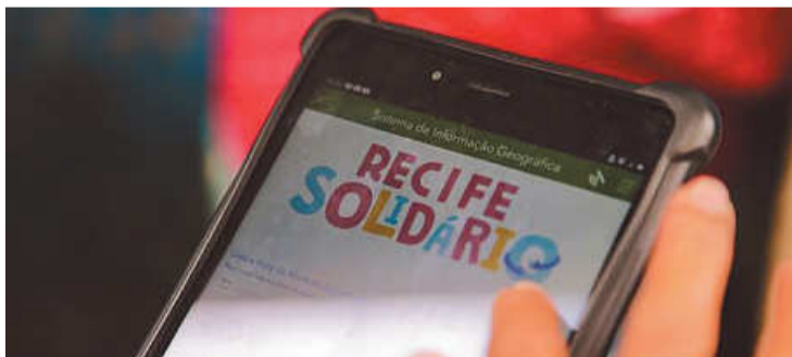
Recursos são destinados às vítimas dos temporais