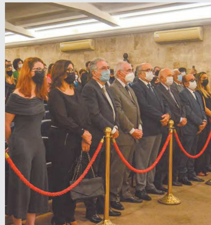
Ao todo, 31 pessoas foram homenageadas no evento