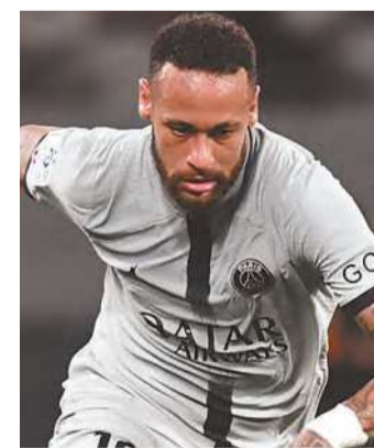
Guardiola desmentiu informação de interesse

O jornal indicava que “o clube treinado por Pep Guardiola respondeu com uma negativa a esta possibilidade” e que o técni-