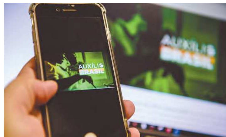
Valor do programa passa de R$ 400 para R$ 600

O valor extra de R$ 200 será complementar aos benefícios previstos na lei que institui o programa Auxílio Brasil (Benefício Primeira Infância, Benefício Composição Familiar, Benefício de Superação da Extrema Pobreza e Benefício Compensatório de Transição) e do Benefício Extraordinário, transformado em permanente pela Lei Federal nº 14.342 em maio deste ano. (Estados de Minas)