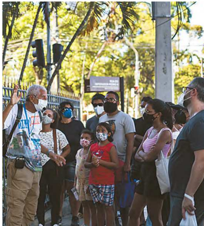
Há roteiros especiais para todo tipo de público

À tarde, tem passeio de ônibus com o tema "Meu Recifinho". Contrapondo a megalomania recifense, esse tour mostrará os menores atrativos da cidade. As duas menores ruas, a Rua Vital de Oliveira, no Recife Antigo, e a Pedro Ivo, no bairro de Santo Antônio estão no roteiro, assim como a menor Capela Nossa Senhora da Saúde, na Ilha do Lei-