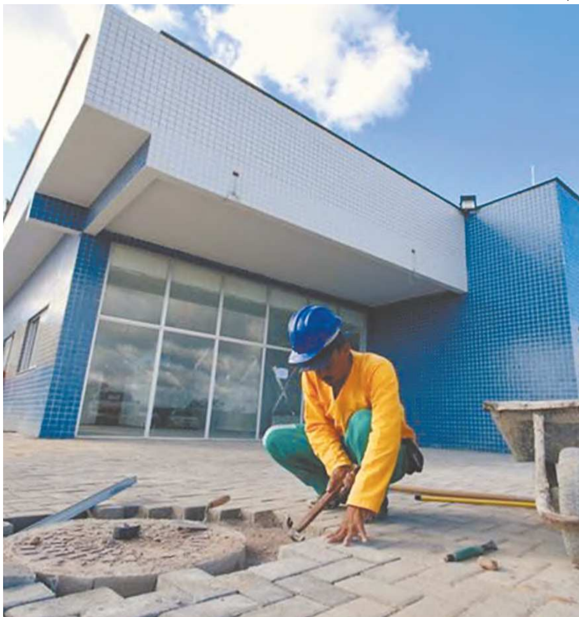
Governador esteve no canteiro das obras, que devem duplicar atendimento na região