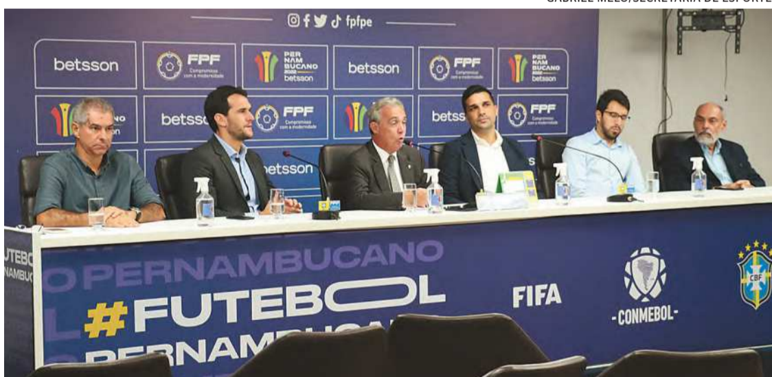
Nova versão foi lançada na sede da FPF e terá toda operação efetuada virtualmente

Sport, Santa Cruz, Retrô e Afogados. No caso de Náutico e Sport, que estão na Série B, cada clube tem direito a uma carga mínima de 6 mil bilhetes por partida. Já o Santa Cruz, que está na Série D, tem direito a uma carga mínima de 15 mil entradas por jogo. Retrô e Afogados, por sua vez, têm direito a 1 mil ingressos cada um, no mínimo, por jogo.