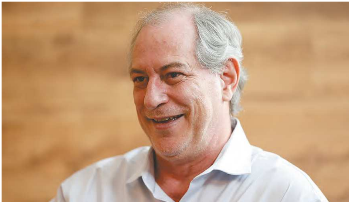
Ciro Gomes voltou a criticar o ex-aliado Lula , de quem chegou a ser ministro: “Corrupto”