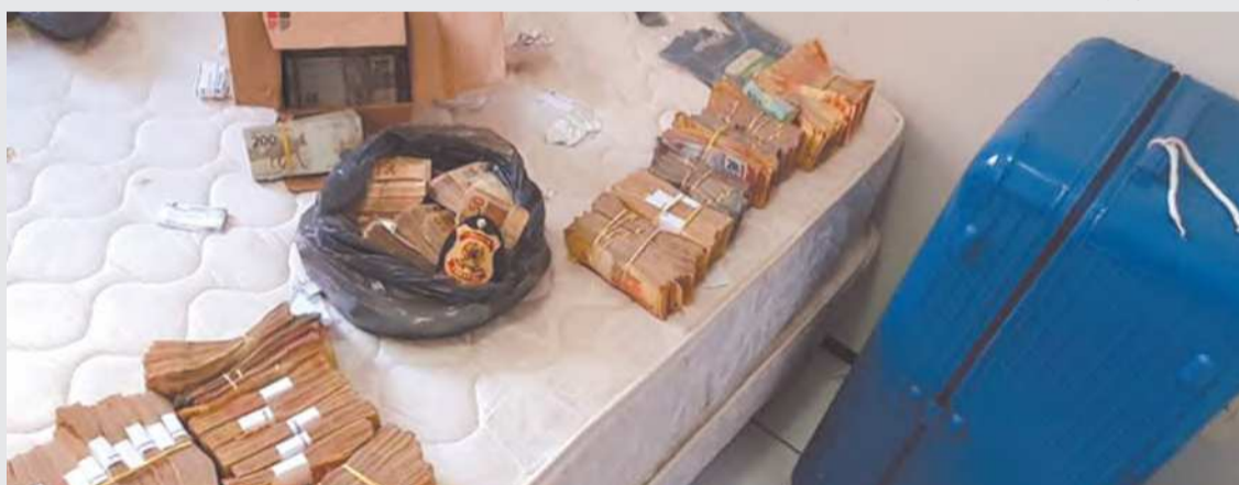
Contas bancárias eram vinculadas a CPFs falsos para dificultar os órgãos de controle

Descobriu-se que são constituídas pessoas jurídicas de fachada,