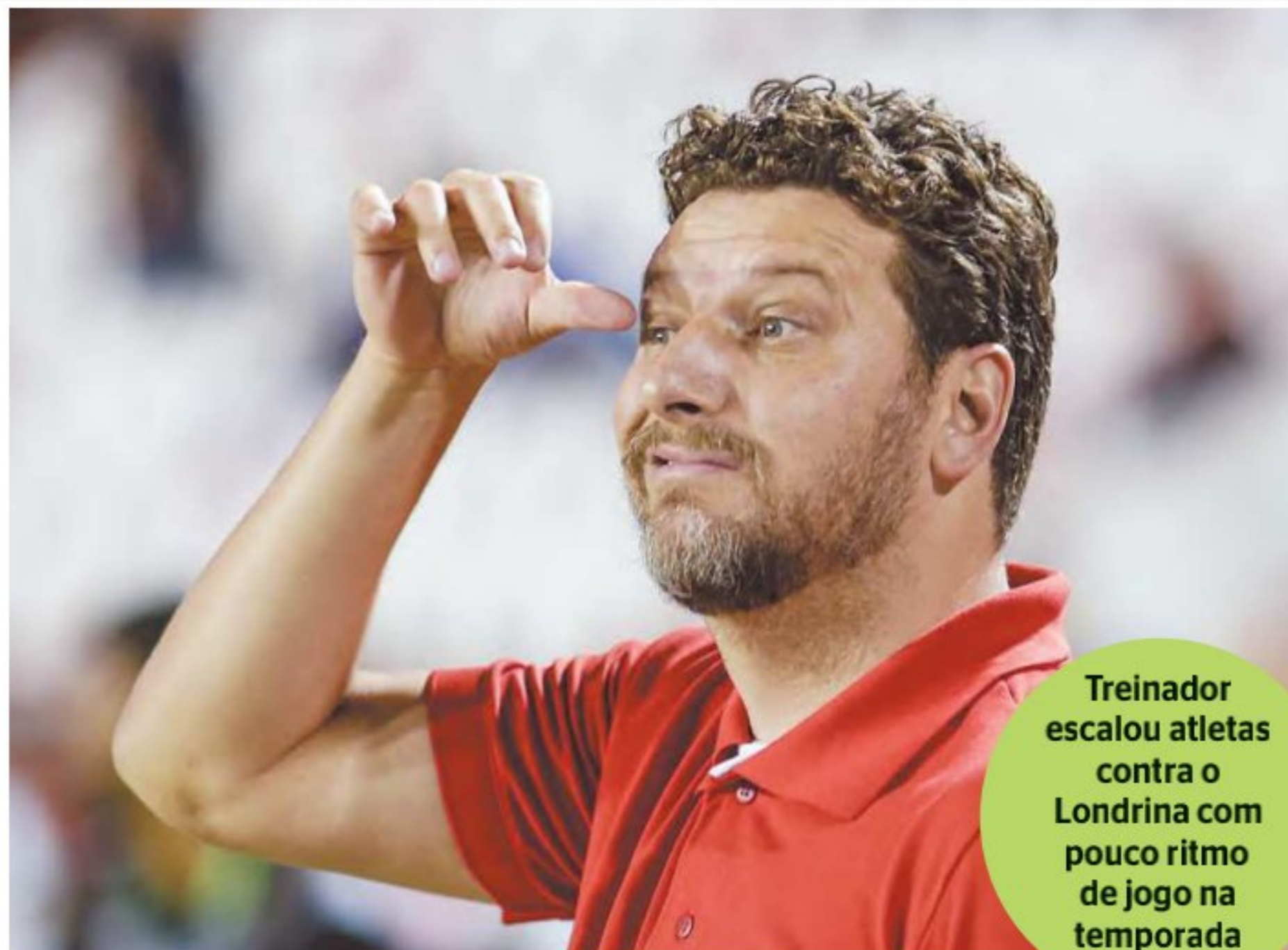
Treinador escalou atletas contra o Londrina com pouco ritmo de jogo na temporada

Elano ainda reforçou que chegou ao Náutico sabendo da qualidade do elenco e das condições financeiras do clube. O treinador ainda lembrou que vários jogadores estão sem ritmo de jogos, alguns retornando de lesão e outros voltando a atuar após a janela de transferências. Na derrota contra o