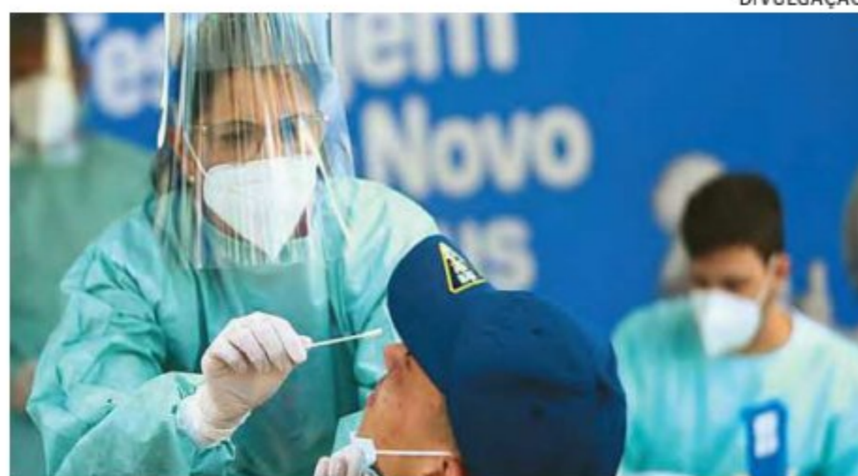
Estudo diz que variantes oferecem desafios à vacinação

Riscos, porém, começam a diminuir cinco semanas depois do fim dos sintomas, voltando ao normal após 12 semanas