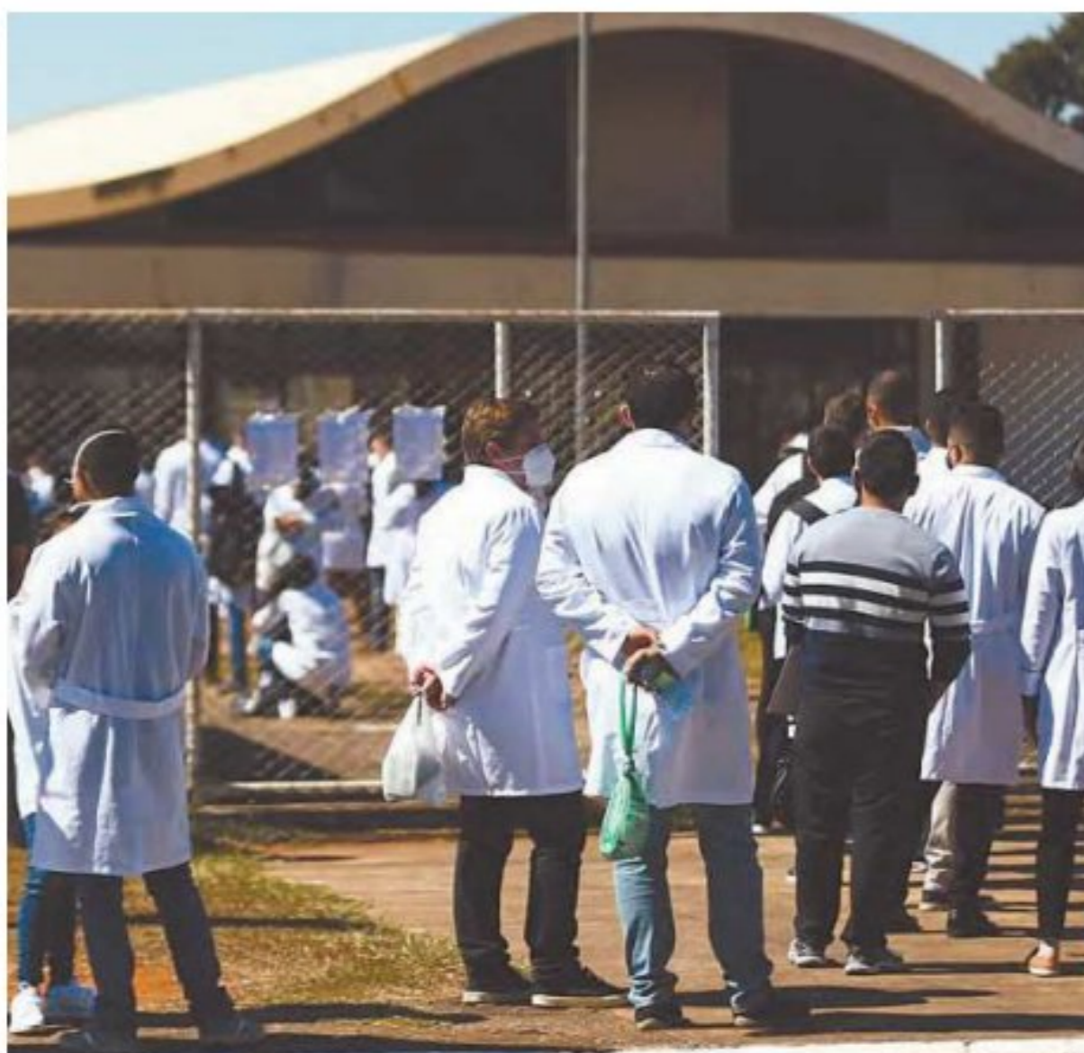
Exame nacional para residentes funciona como o Enem

A publicação do edital de abertura do Enare está prevista para 15 de agosto.