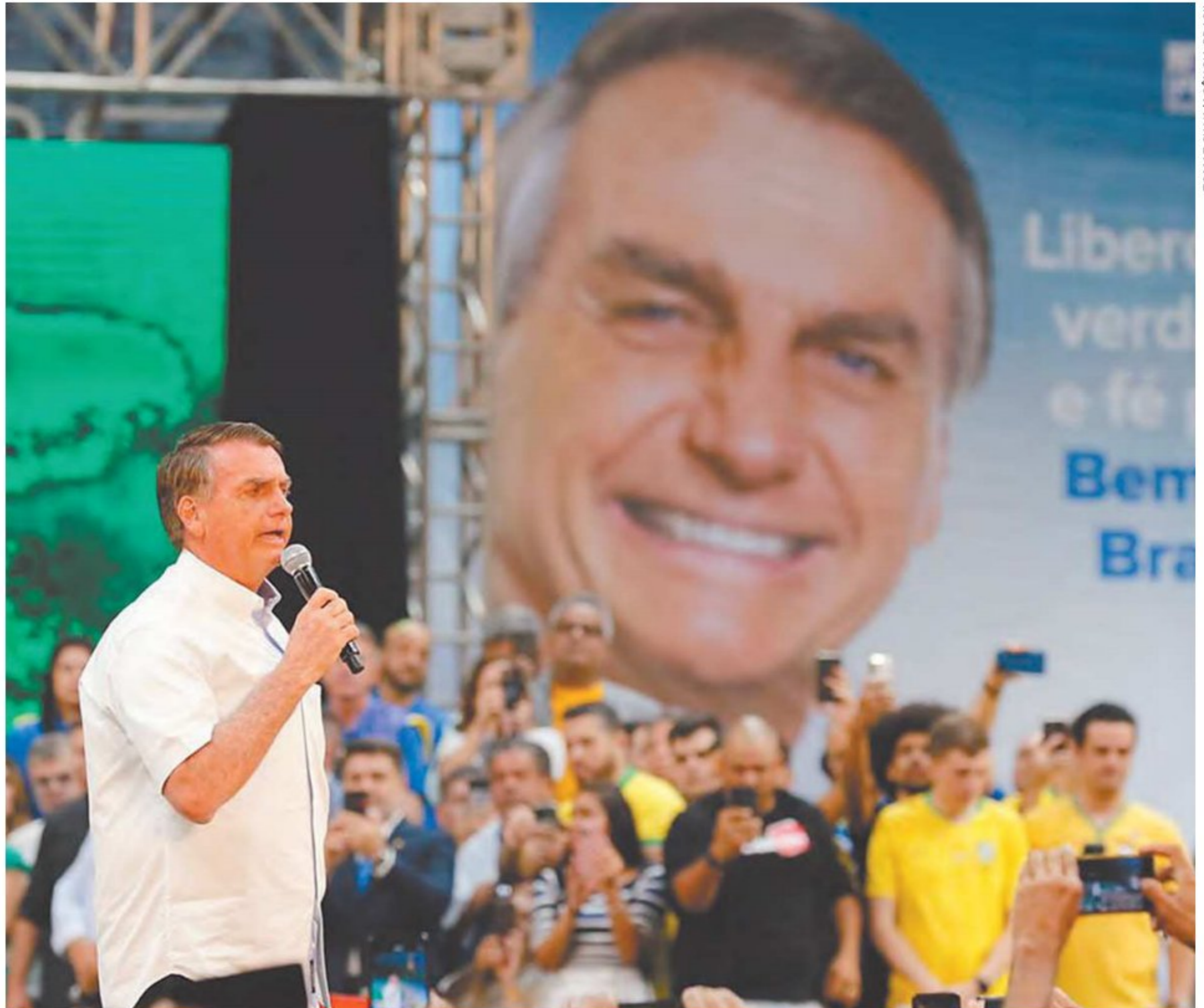
Presidente atacou o STF, convocou para o 7 de setembro e confirmou o General Braga Netto como vice na chapa

do bem e temos disposição para lutar por liberdade e pátria. Convoco todos vocês agora para que todo mundo vá às ruas no sete de setembro pela última vez. Vamos às ruas pela última vez”, disse.