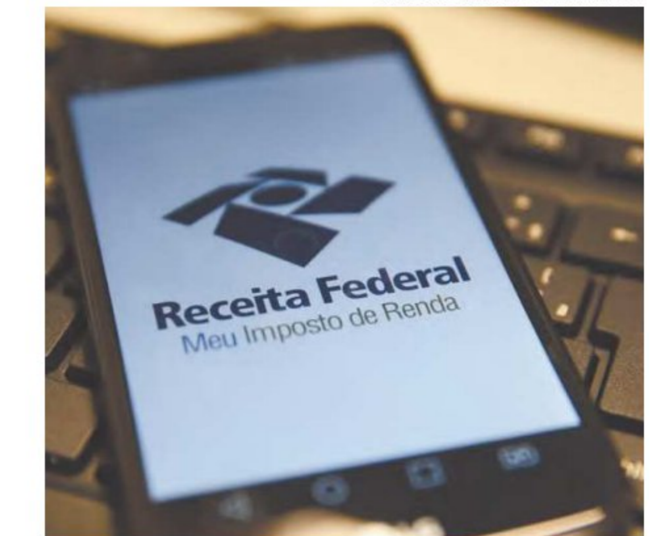
Faixa de isenção será de um salário mínimo e meio