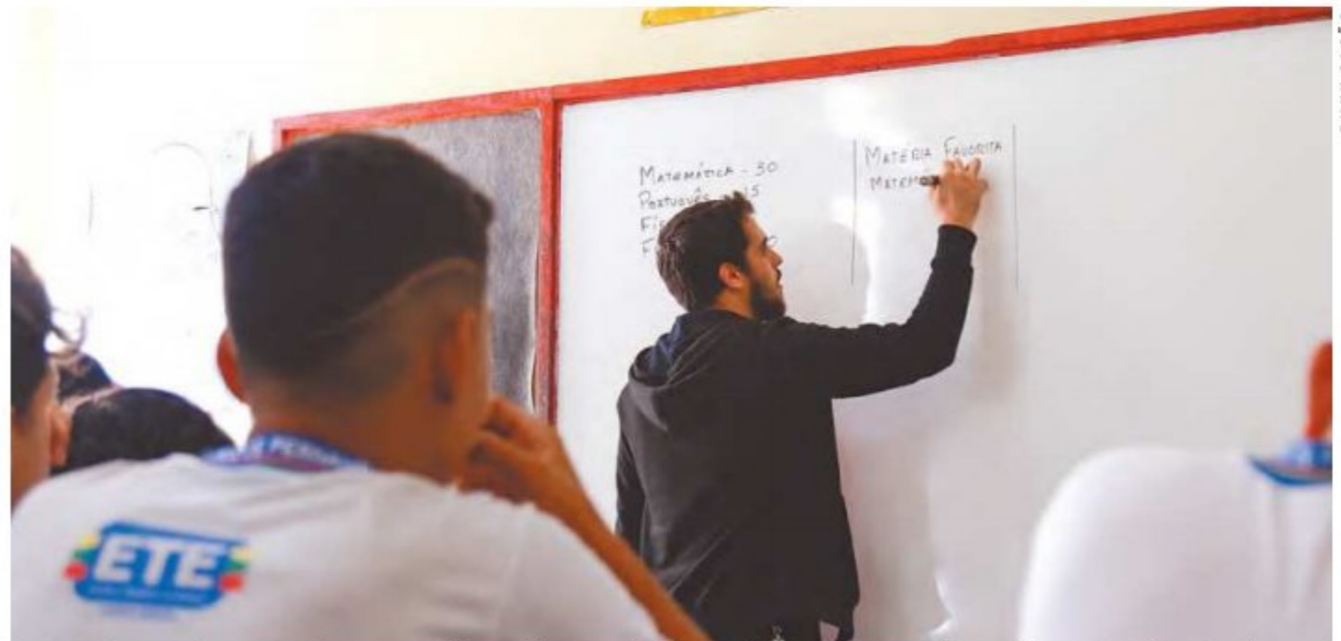
Levantamento apontou que educadores ainda sonham com ensino diferente do atual

Para 97% dos professores do ensino público, escola pode melhorar. As conclusões são de pesquisas da USP, com Instituto Iungo. Dois mil docentes foram ouvidos