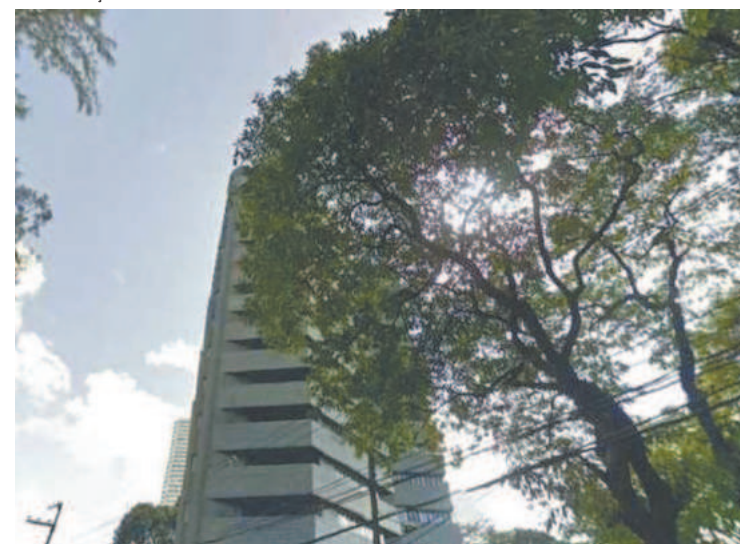
Edifício fica no Parnamirim. Vítima era doméstica