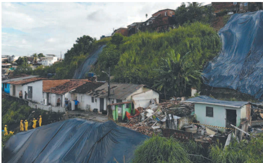
Chuvvas de maio e junho deixaram mortos, desabrigados e desalojados no estado