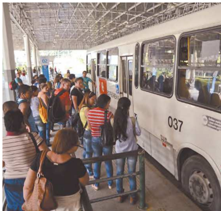
Com o VEM, passageiros podem alternar entre linhas

O sistema de bilhetagem eletrônica permite a identificação do usuário no momento do embarque e o mapeamento do seu trajeto, ajudando o Grande Recife Consórcio no melhor planeja-