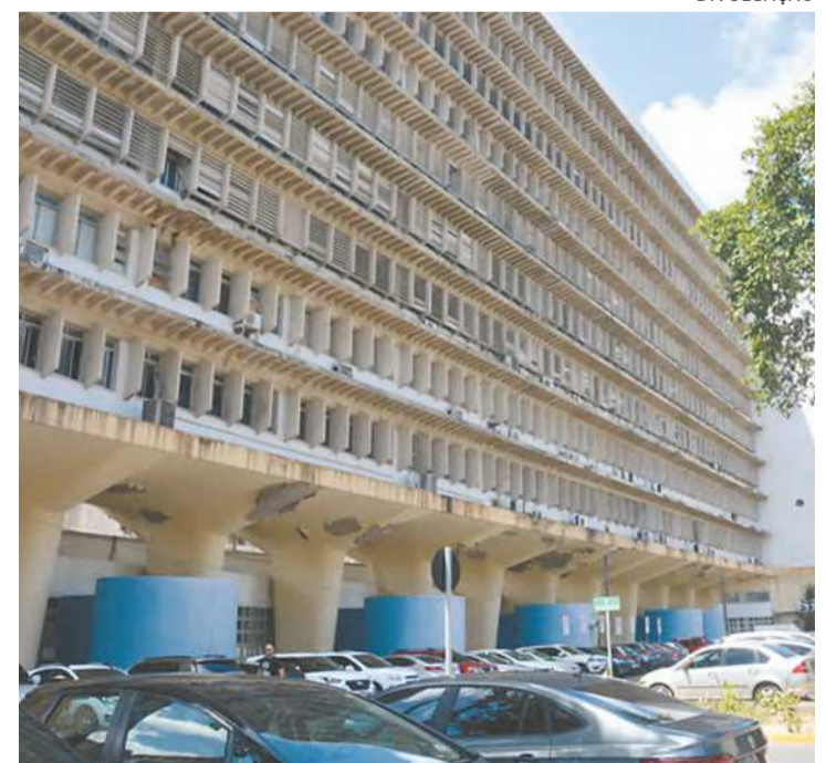
Programação começa já na próxima segunda-feira

O Agosto Dourado terá a realização de palestras e conversas, oficinas, atividades educativas itinerantes, mamaço e realização de Quiz, entre outras atividades. Confira a programação completa no endereço https://www.gov.br/ebserh/pt-br/hospitais-universitarios/regiao-nordeste/hc-ufpe/