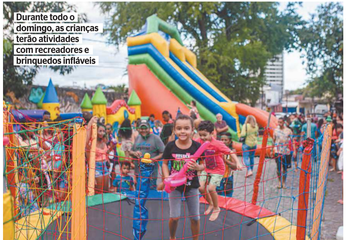
Durante todo o domingo, as crianças terão atividades com recreadores e brinquedos infláveis

A ação descentralizada terá polos de serviços, palcos com atrações culturais, espaço para as crianças brin-