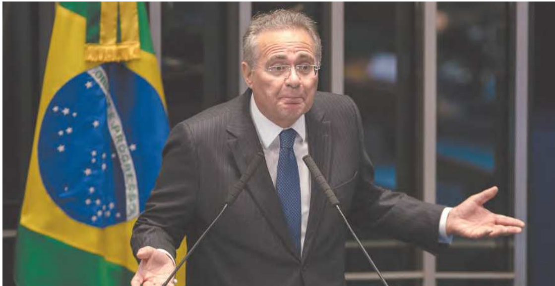
Renan Calheiros tentou levar o partido ao palanque de Lula já no primeiro turno