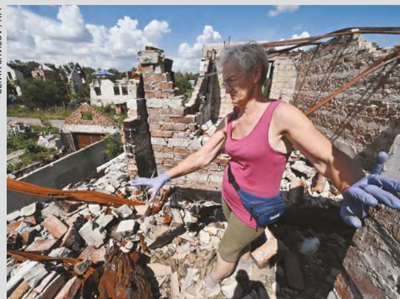
Mulher limpa destroços em Mala Rogan, região de Kharkiv

A Rússia lançou ontem vários ataques a infraestruturas militares e edifícios residenciais na Ucrânia, cujas forças tentam retomar o território ocupado por Moscou em uma contra-ofensiva no sul. Pelo menos cinco pessoas morreram, e 25 ficaram feridas após um bombardeio em Kropivnitskyi, cerca de 300 km ao sul de Kiev, no centro da Ucrânia, informou o governador regional Andriy Raikovitch.