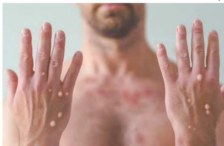
Doença já tem cerca de mil casos confirmados no Brasil

Até o momento, contudo, não há evidências de que Pernam-