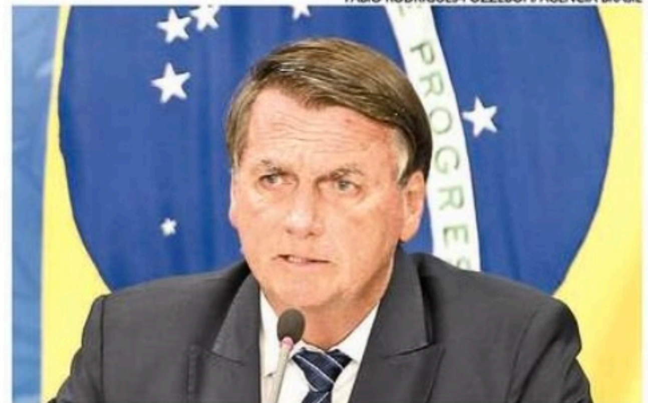
Candidato à reeleição, Bolsonaro deve voltar ao Recife em agosto