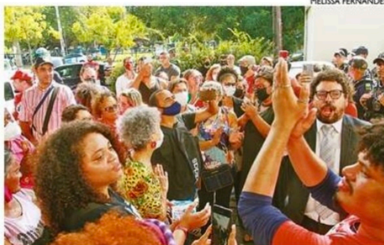
Distribuição de senhas para ocupar galerias acirrou ânimos dos presentes