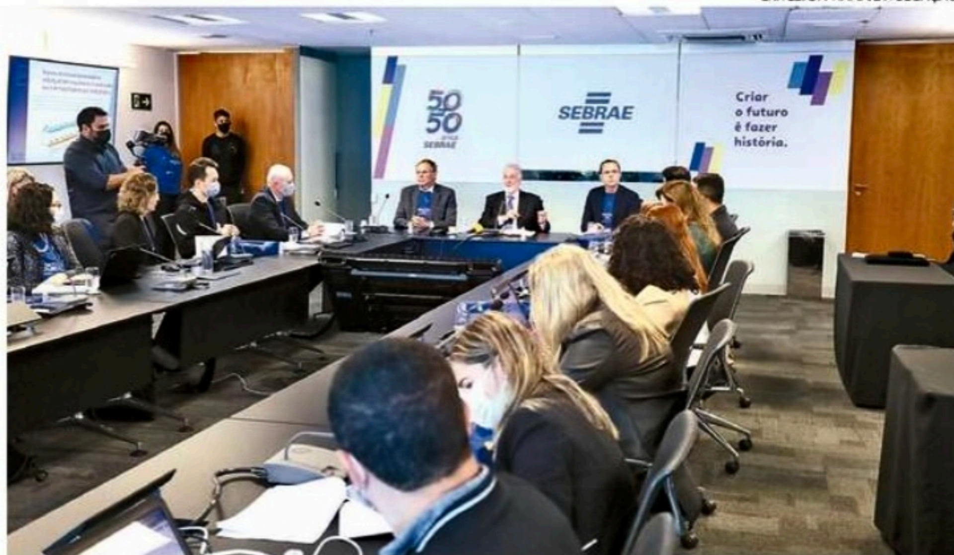
O estudo sobre as microempresas foi apresentado ontem, dia em que o Sebrae completou 50 anos

A coluna Nem 8 nem 80 é publicada às quartas e sextas.