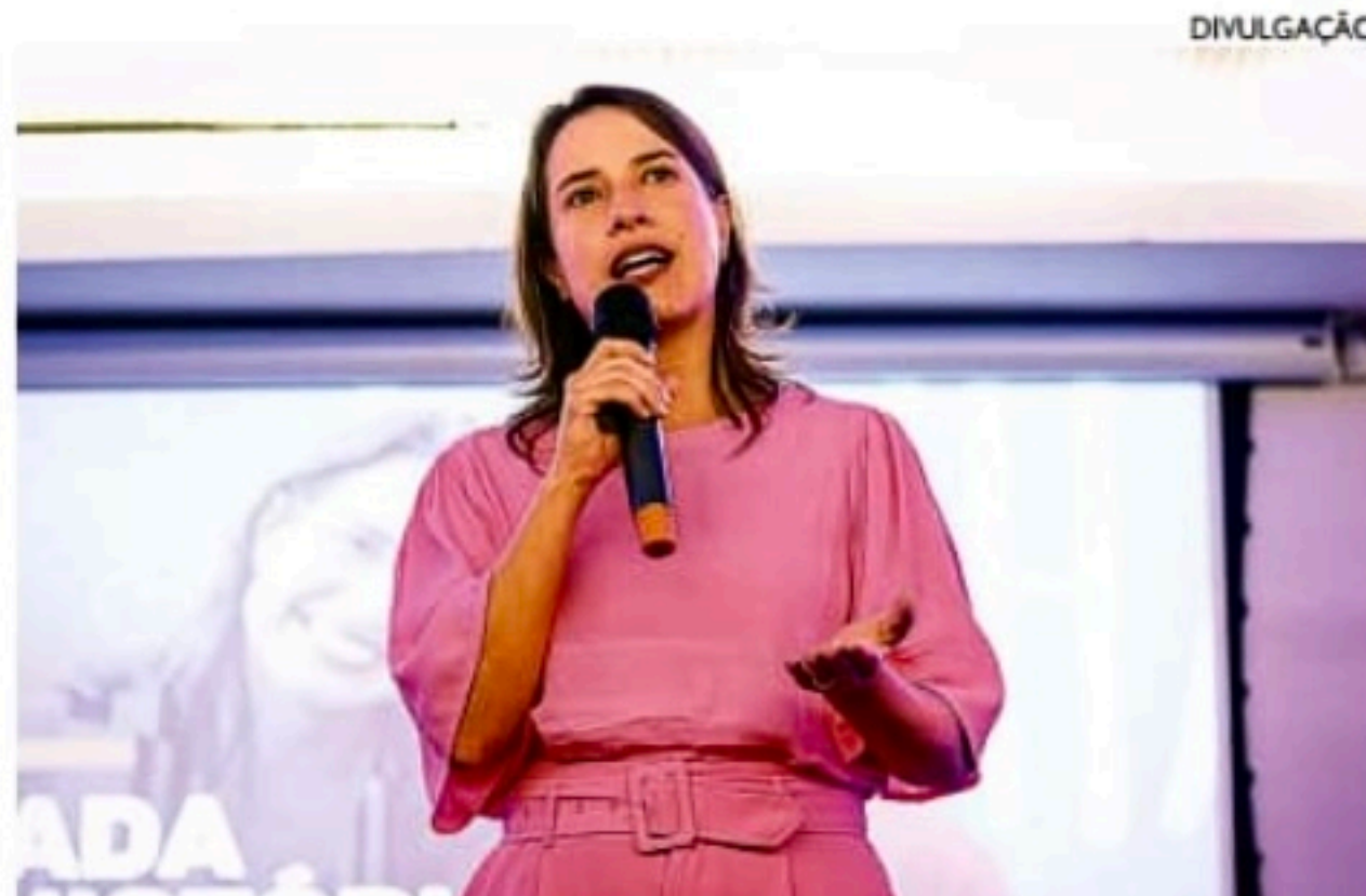
Raquel Lyra teve encontro com pastores e líderes evangélicos