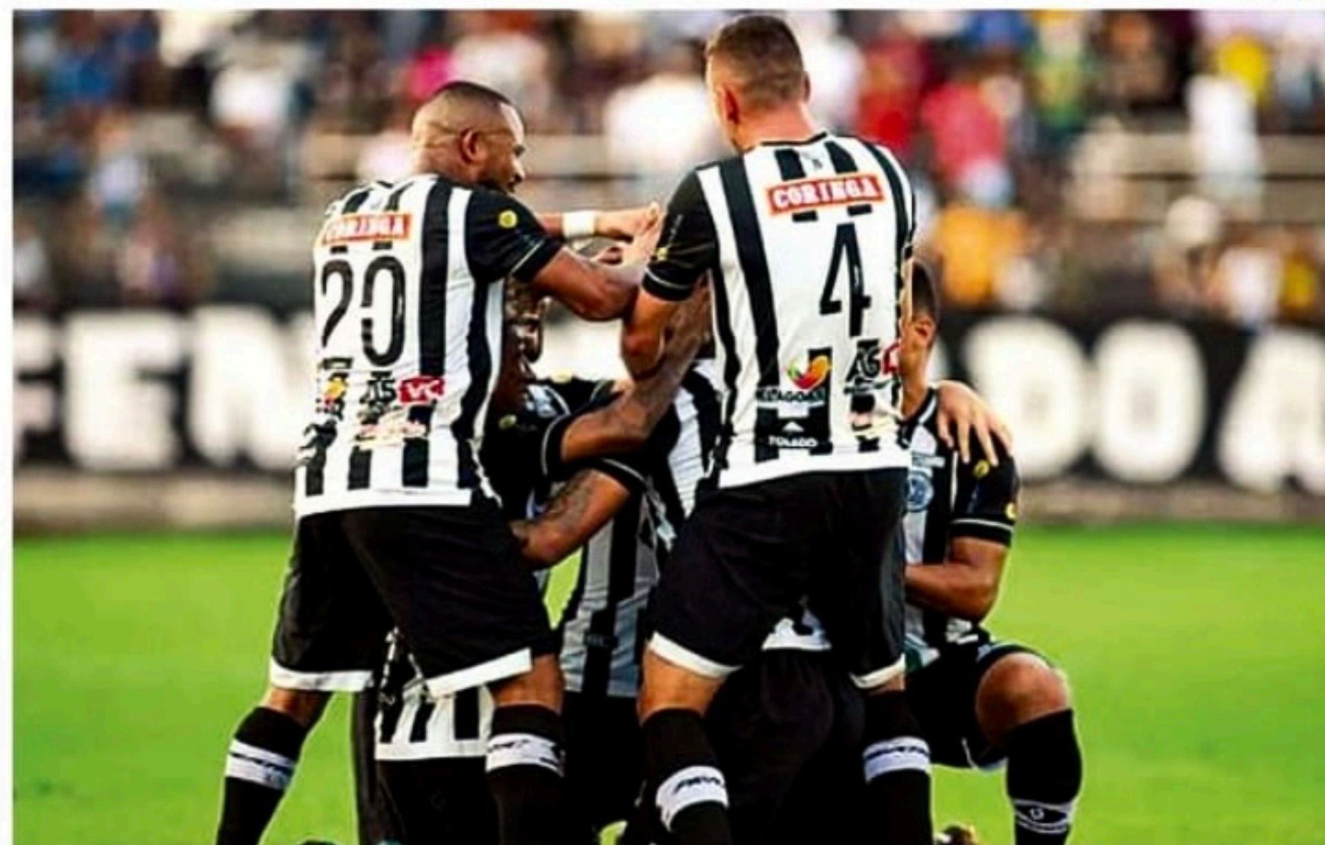
Com vitória, alagoanos garantem classificação à próxima fase e colocam pressão na Cobra Coral

Separados por apenas um ponto na tabela, Santa Cruz e ASA entraram ambos com chances de classificação antecipada ao mata-mata da Série D. A julgar pelos primeiros minutos, os alagoanos ti-