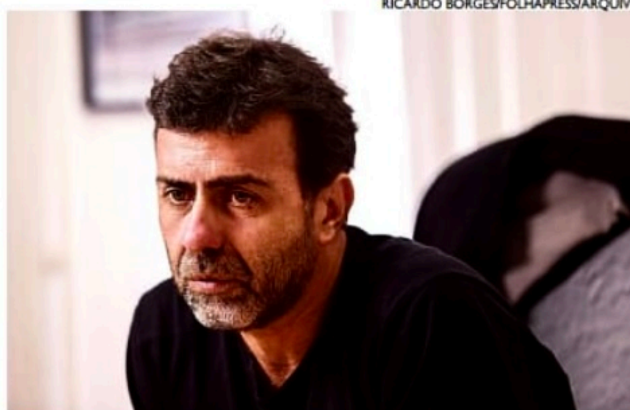
No Rio, coligação que apoia Freixo ao governo deve ter 2 candidatos