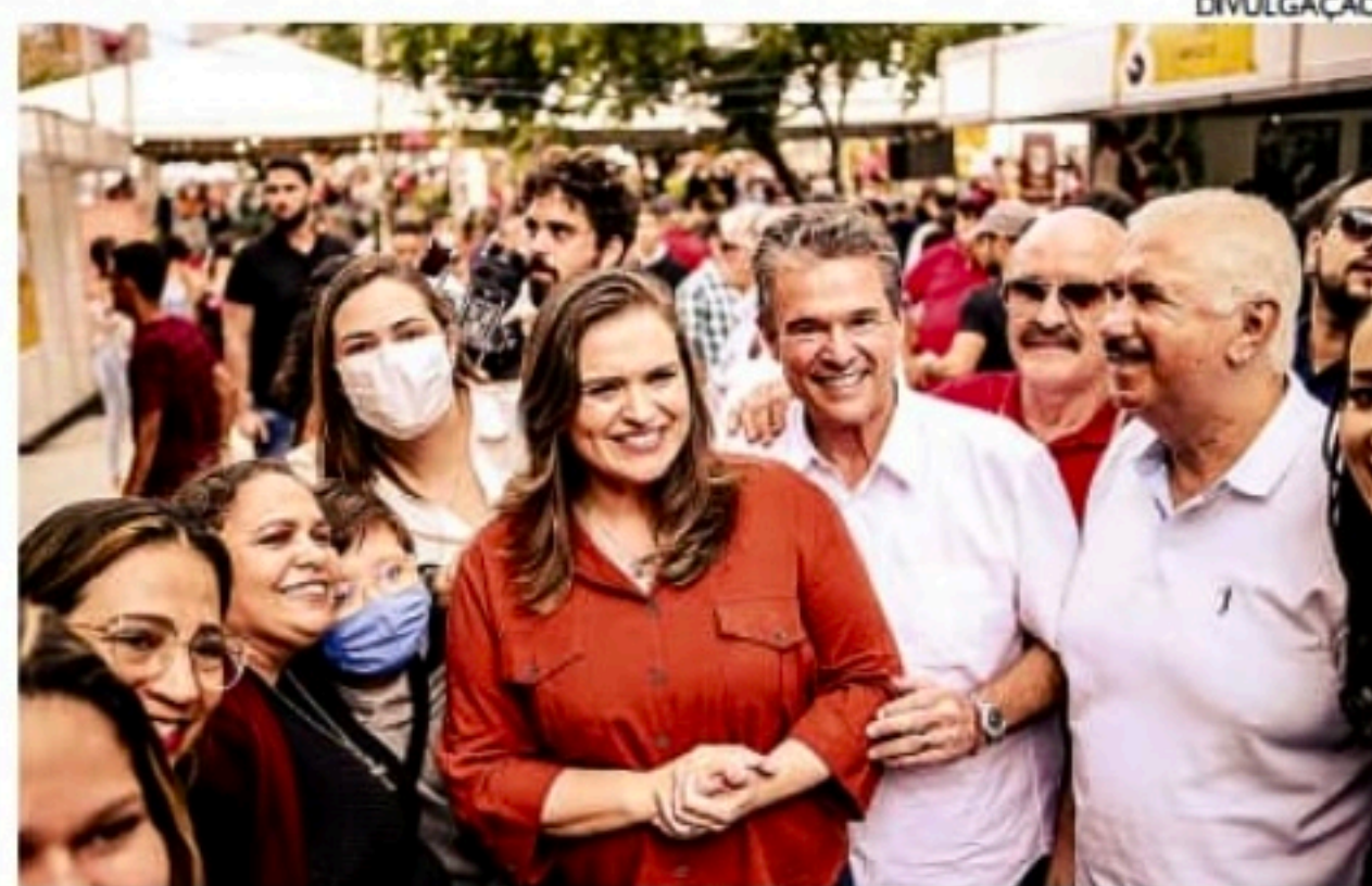
Marília Arraes iniciou sua programação no sábado logo cedo

Já Anderson Ferreira (PL) começou o final de semana levando a caravana Simbora Mudar Pernambuco a Floresta, no Sertão.