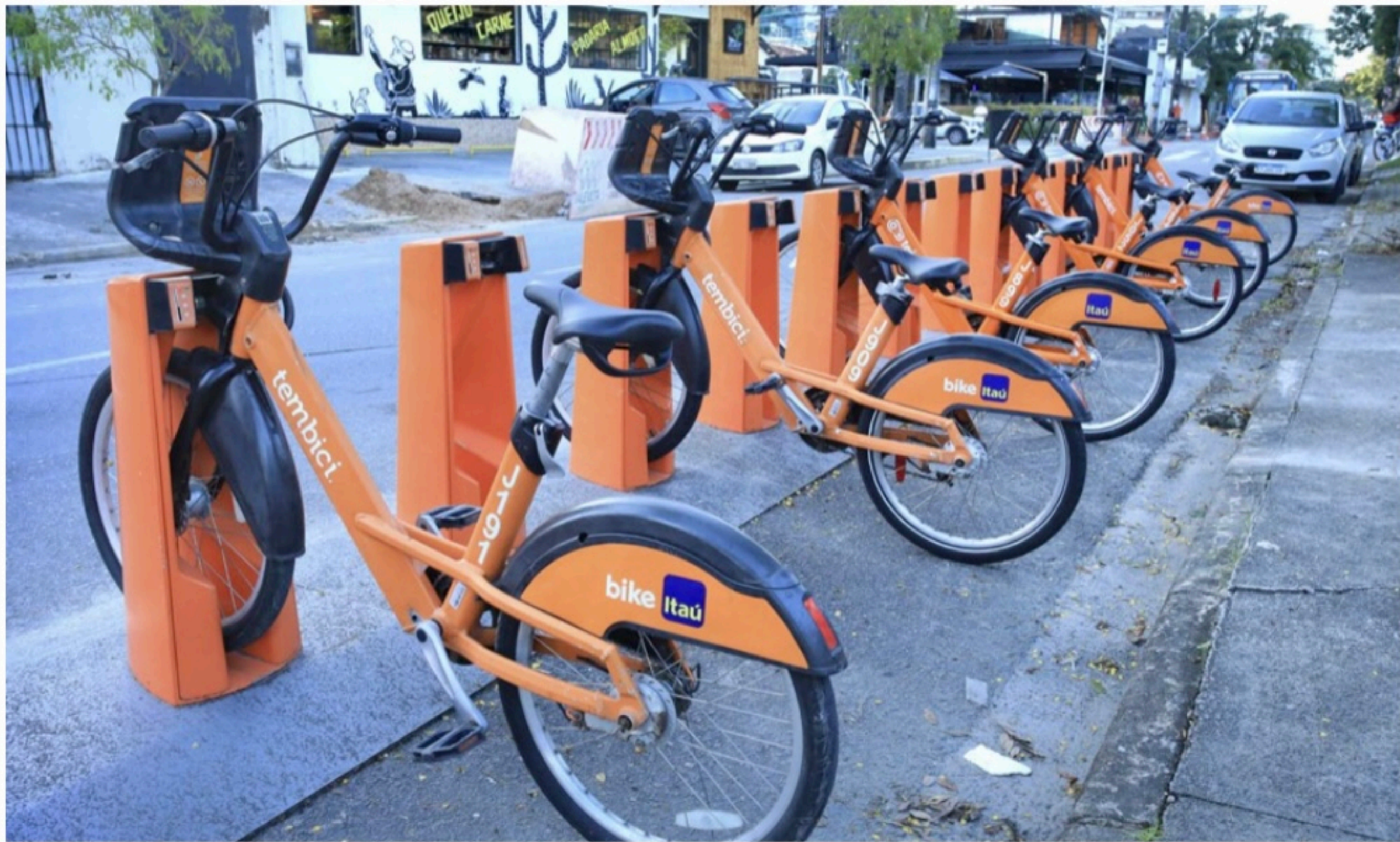
MAIS VIAGENS O Bike PE registrou aumento de 60% nas viagens na Região Metropolitana do Recife entre os meses de janeiro e maio de 2022, em relação ao mesmo período de 2021

O levantamento fez um panorama geral sobre o uso de bikes compartilhadas na América do Sul. Os dados mostraram o crescimento do serviço de bikes compartilhadas, o impacto na mobilidade urbana das cidades, o aumen-