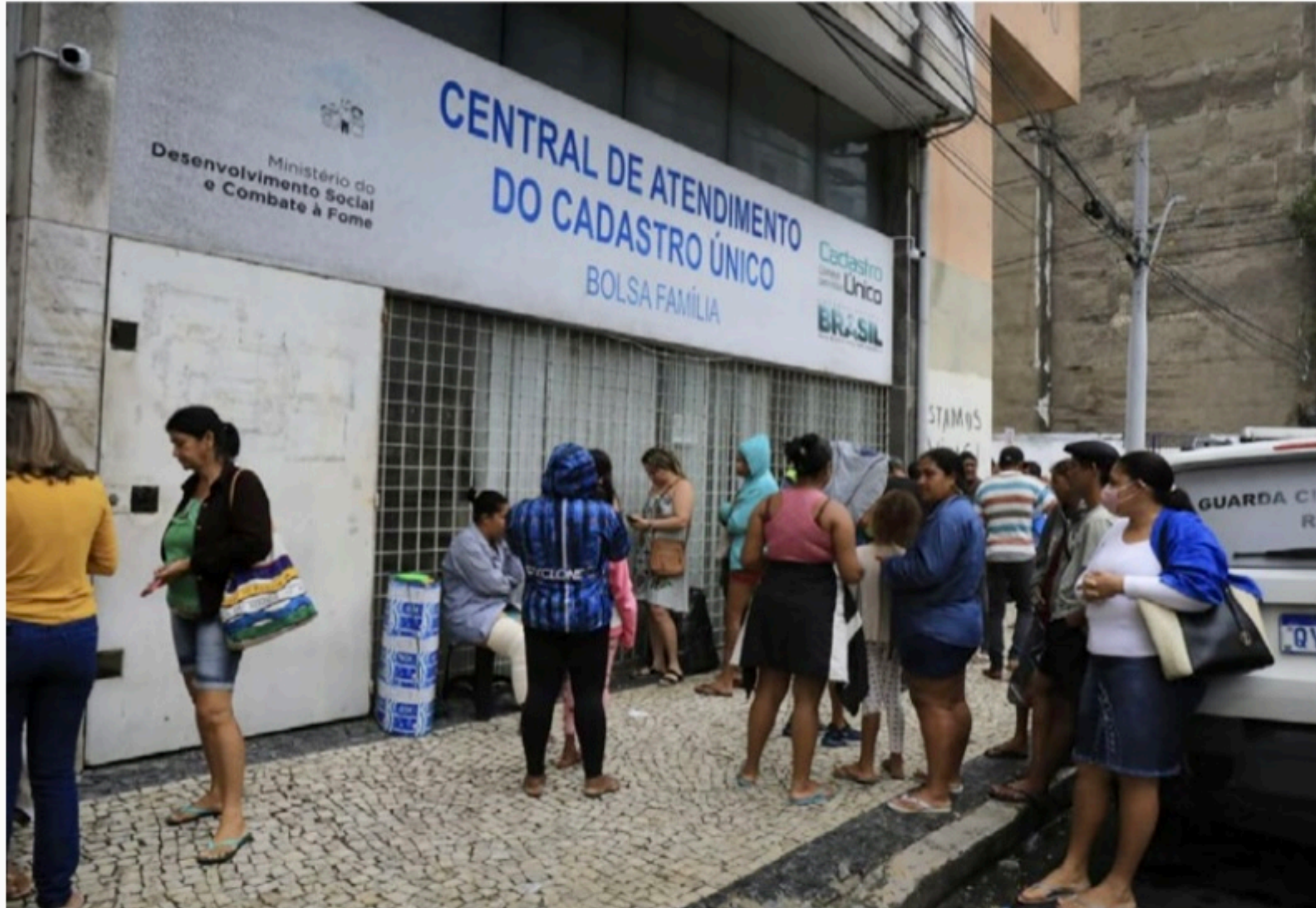
PEC KAMIKAZE Governo Bolsonaro planeja a inclusão, a partir de agosto, de cerca de 2 milhões a mais de famílias no programa Auxílio

Em relação à bolsa-caminhoneiro, como antecipou o Estadão, o governo usará o Registro Nacional de Transportadores Rodoviários de