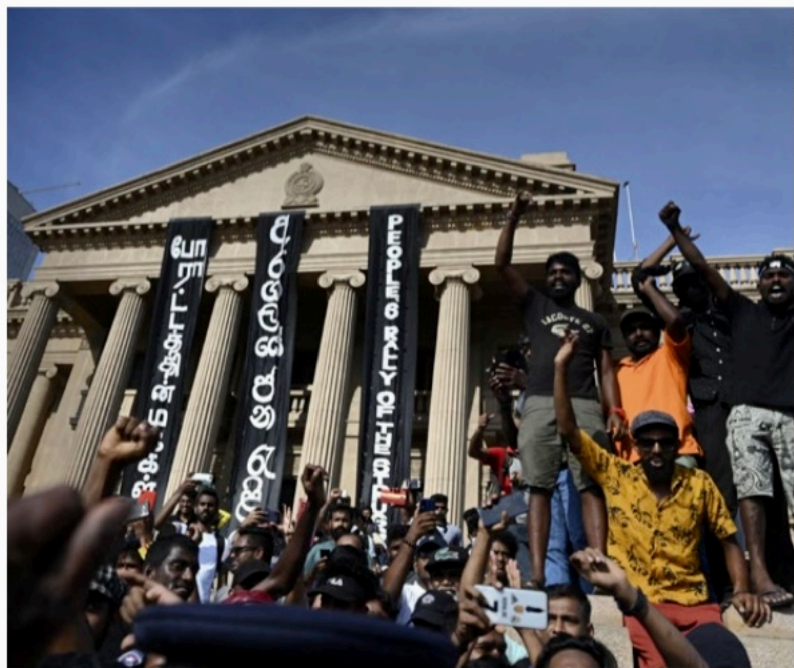
PROTESTOS Militantes continuarão pressionando o poder em meio à grave crise, econômica e política

País situado no Oceano Índico, ao sul do subcontinente indiano, o Sri Lanka sofre com a escassez de produtos