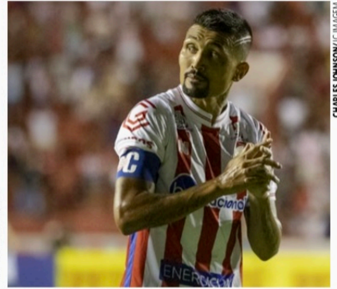
RECUPERADO Atacante será opção para o jogo de domingo contra a Chape