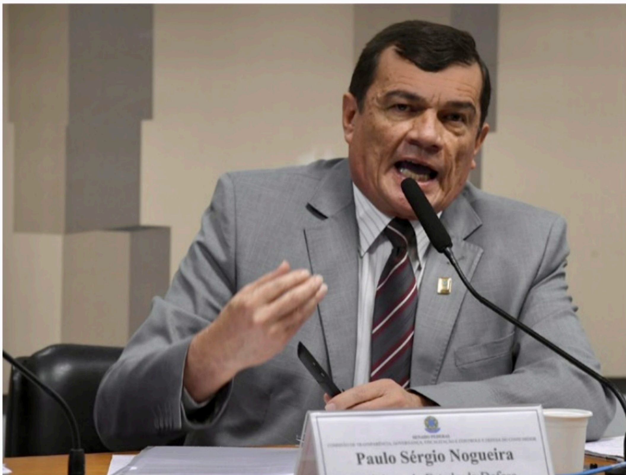
PAPEL Proposta segue a linha do discurso do presidente Jair Bolsonaro, que põe em dúvida a segurança do processo eleitoral

A audiência no Senado serviu de palco para parlamentares governistas insistirem no discurso de colocar em suspeição a segurança do processo de votação. Senadores e deputados que apoiam o presidente Bolsonaro pediram para falar no evento. O presidente do TSE, ministro Edson Fachin, foi convidado, mas não compareceu.