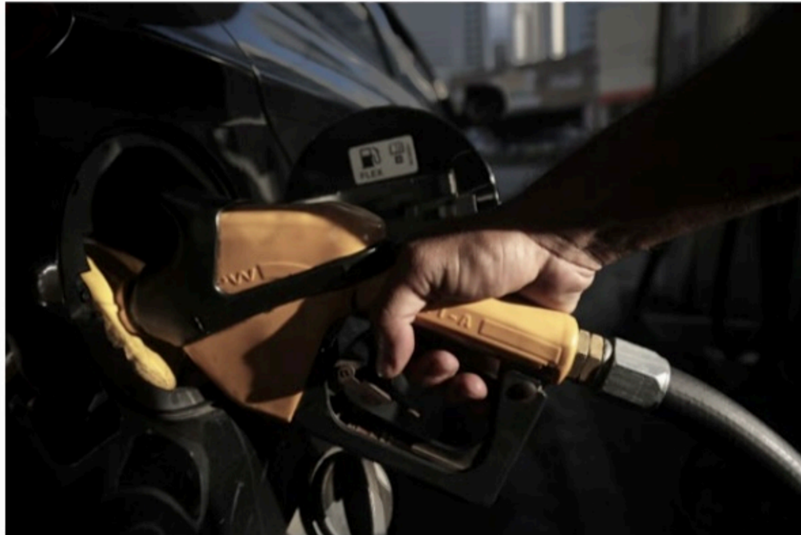
POSTOS Efeitos nas bombas dos postos do Estado devem começar a ser percebidos na próxima semana

Ramos espera que as distribuidoras repassem "o quanto antes" esse percentual de redução, assim que o Projeto de Lei for sancionado pelo governador Paulo Câmara e publicado no Diário Oficial do Estado, o que deve acontecer nesta sexta-feira (15).