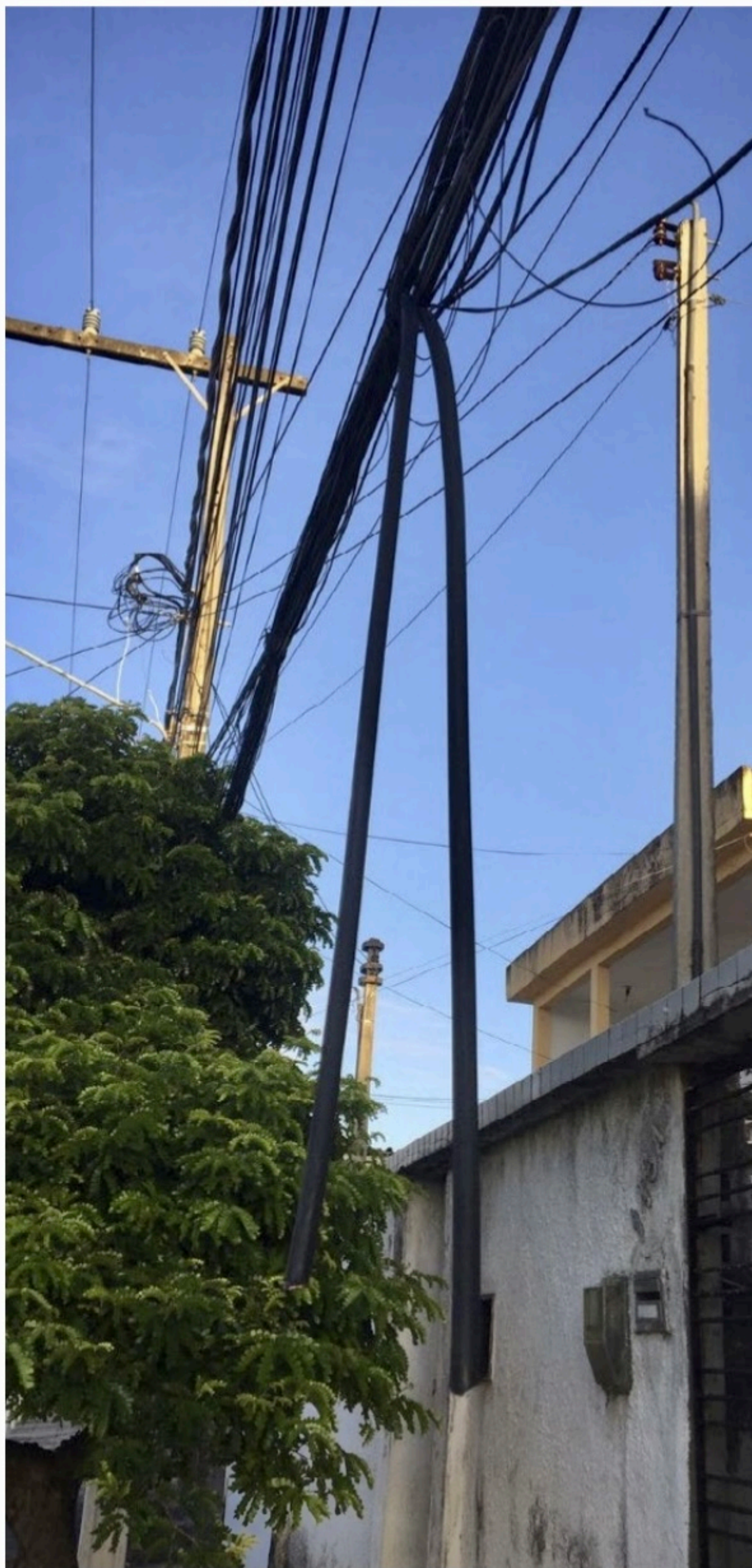
FRANCISCO CARLOS / VOZ DO LEITOR