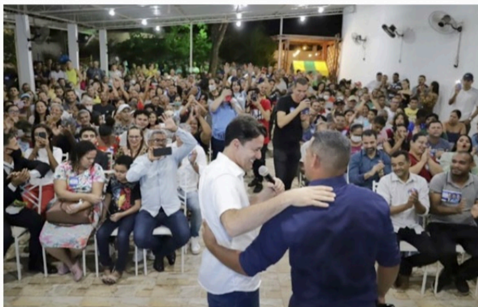
RECIFE Ex-prefeito de Jaboatão dos Guararapes apresentou eixos do seu plano de governo em ato na Zona Norte

À população que compareceu ao ato, o ex-prefeito de Jaboatão esmiuçou os projetos apresentados pela bancada do PL, ações