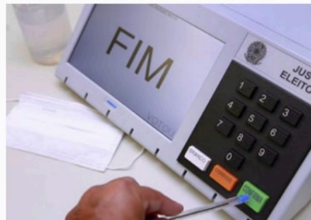
RELATÓRIO Parecer faz parte da terceira etapa de auditoria do tribunal

O relatório aprovado está relacionado à terceira etapa da auditoria realizada pelo TCU no sistema de votação.