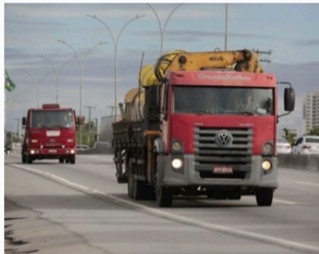
CAMINHONEIROS Novo benefício pode ferir lei eleitoral

"Ainda que a situação de 'emergência' seja menos grave, adotam-se na PEC praticamente as mesmas dispensas e os privilégios concedidos para situações mais críticas que