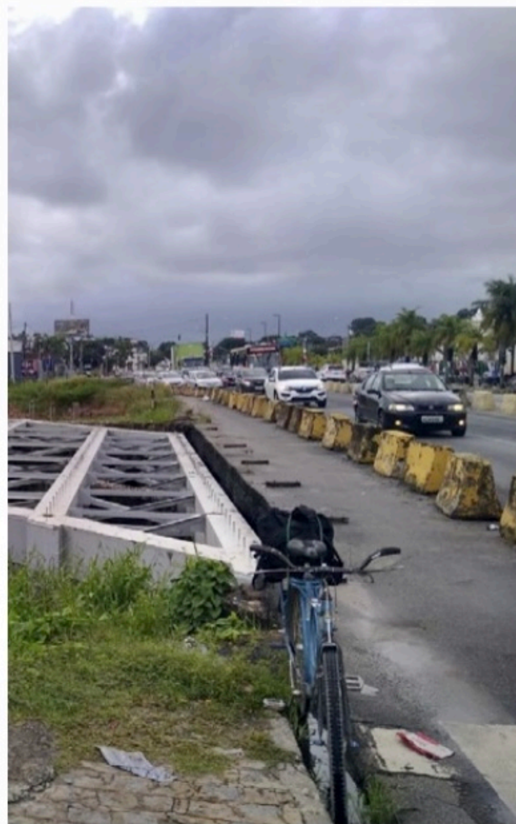
VALTER ROCHA / VOZ DO LEITOR