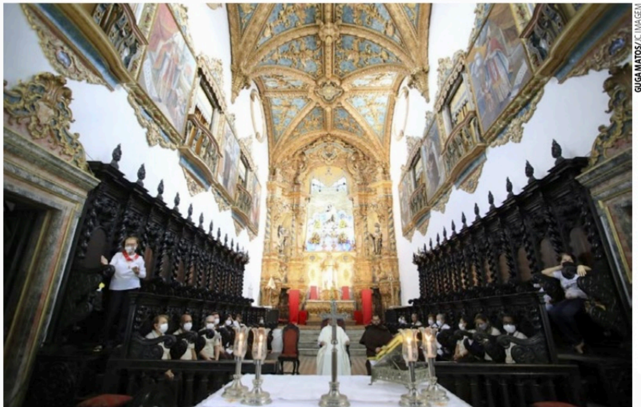
DATA ESPECIAL Em 2022, completam-se exatamente 100 anos que a Basílica do Carmo do Recife foi elevada à condição de Basílica Menor