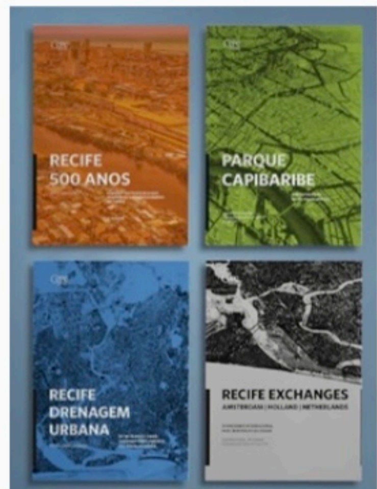
VOLUMES Bilingue, a Coleção Recife 500 Anos tem seus primeiros livros lançados hoje; ao todo, serão 12