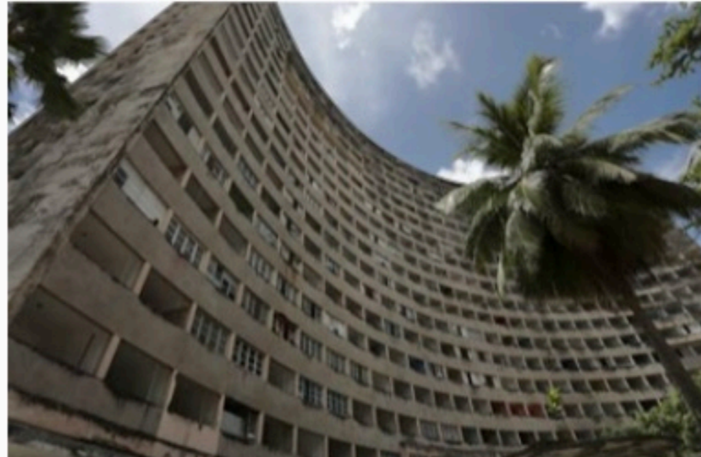
RISCOS Edifício em Boa Viagem está interditado desde março de 2019