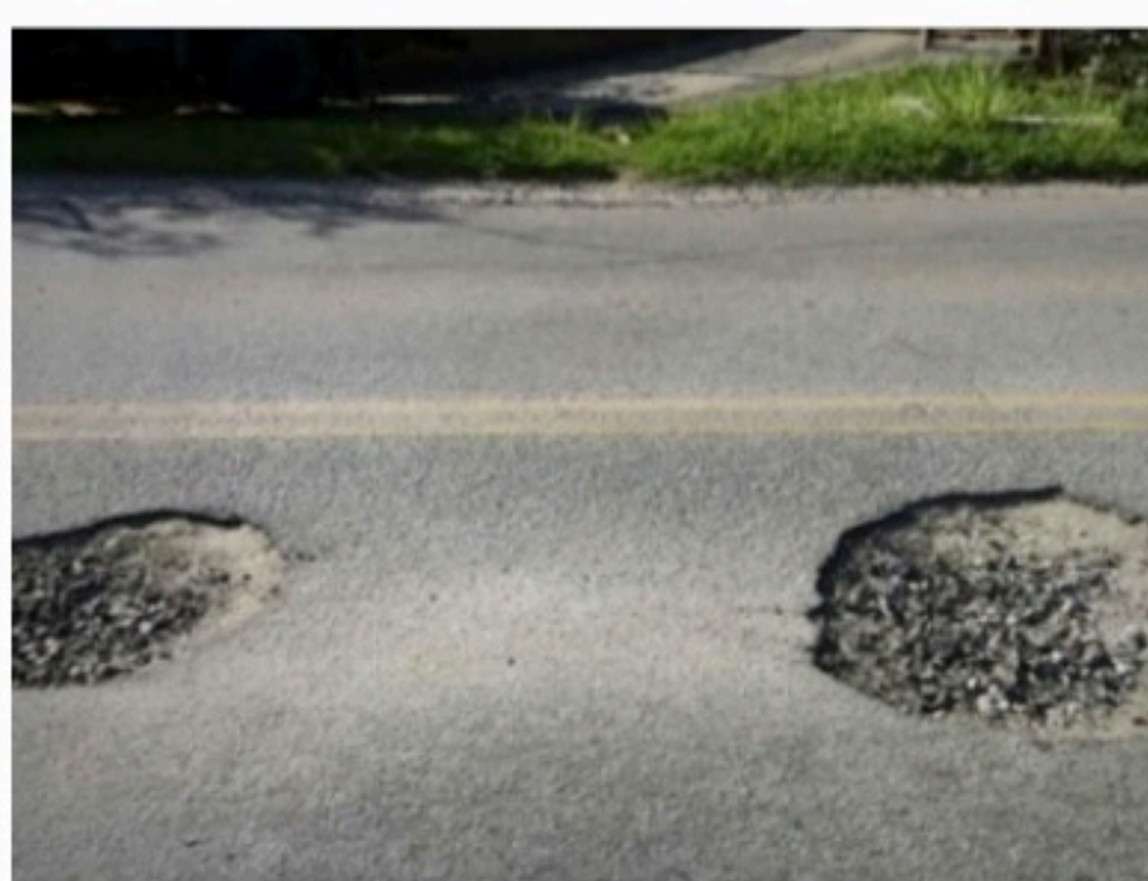
WELLINGTON MONTEIRO / VOZ DO LEITOR