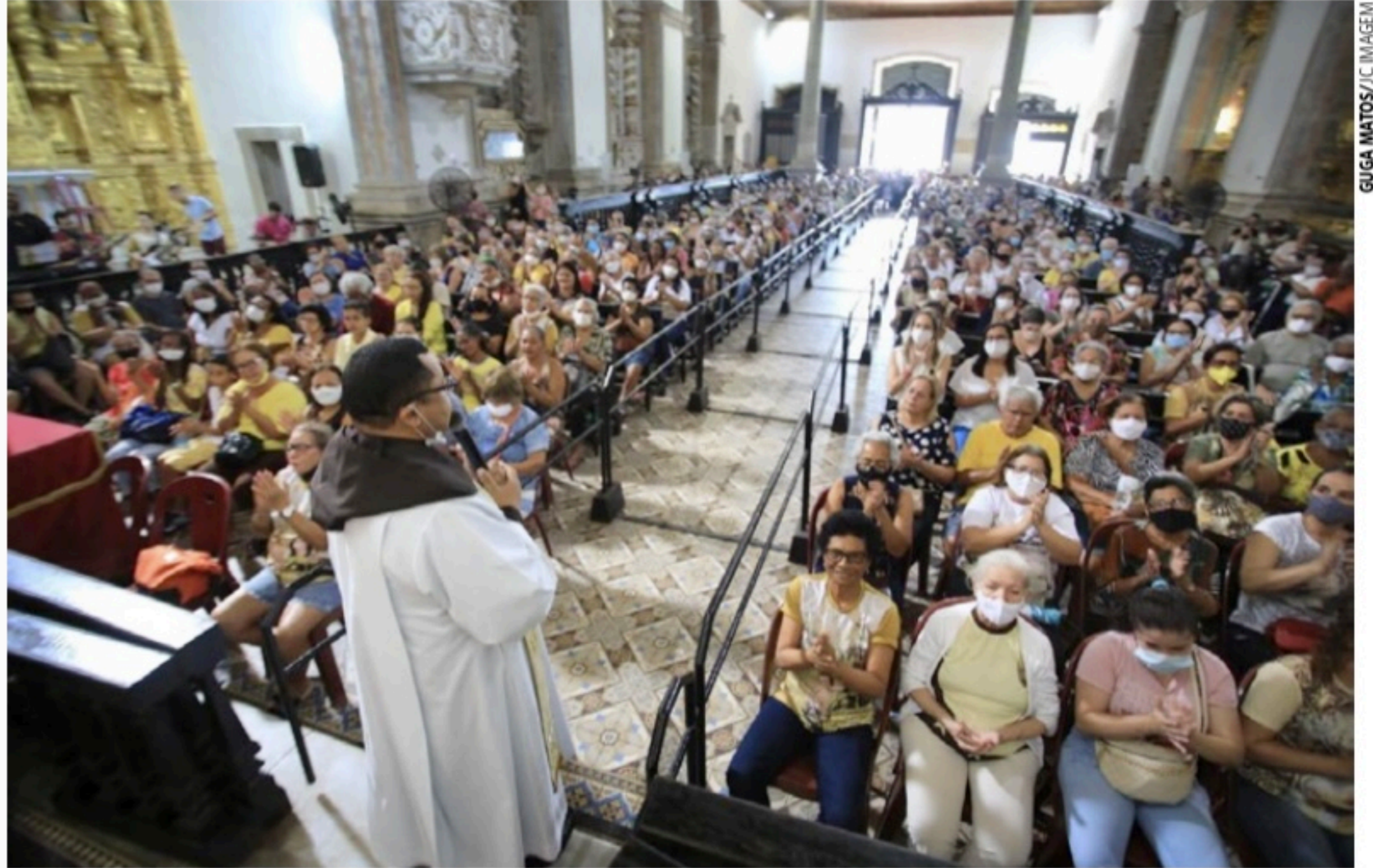
MOMENTO DE FÉ Basílica do Carmo, na área do central do Recife, segue cheia durante as santas missas em celebração à Nossa Senhora

Outra novidade para a celebração deste ano é a realização de missas em horários diferentes. “No dia 16 (amanhã) teremos mais uma novidade: a primeira missa será ministrada a meia-noite. Então, quem estiver disposto, prepara a caravana de suas comunidades, pois teremos missas de hora em hora, durante a madrugada toda”, garantiu o reitor da