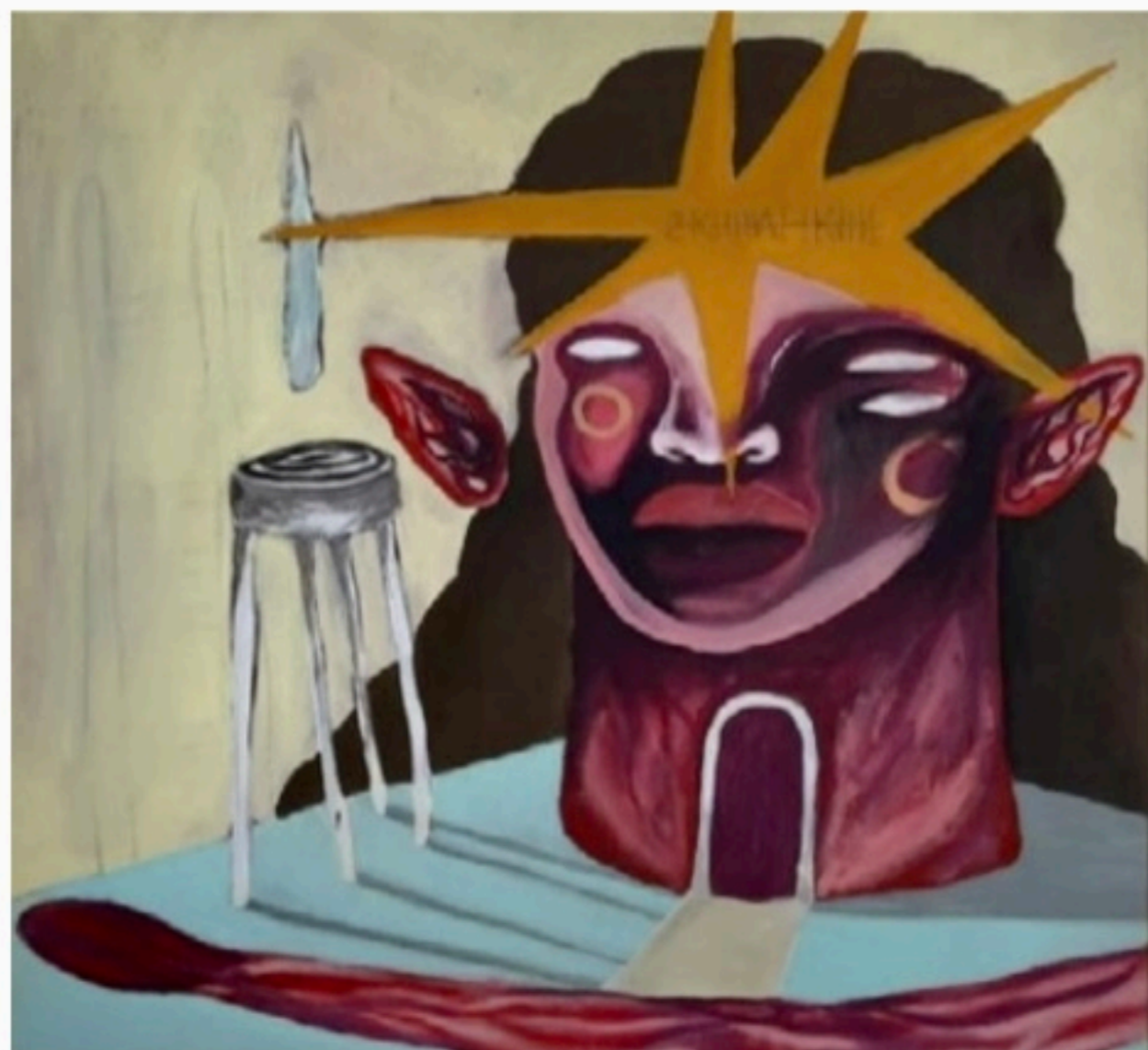
OBRA O Segundo Rastejo, de Abrôs Barros, de Camaragibe, é uma das novas aquisições

“Interdisciplinaridade e diversidade são as tônicas das afinidades entre as gerações dos artistas pernambucanos apresentados na exposição e partiu da ideia de observar, ainda num tempo presente,