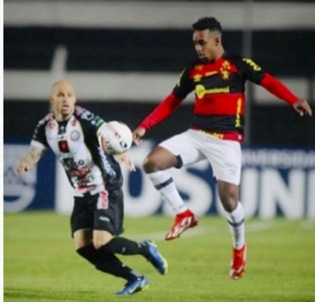
CRESCENTE Apesar de não ter vencido, rubro-negros tiveram boa atuação

gem coloca em destaque a linha do jogador que está milímetros na frente. Nesse caso, a linha vermelha, do jogador do Sport. Além disso, vale destacar que o impedimento foi apontado no campo. Wagner Magalhães era o juiz principal. Os outros dois gols foram anulados corretamente pela arbitragem no jogo entre Operário x Sport. Com o resultado, o Sport segue na quinta colocação e somou 26 pontos, três a menos que o quarto colocado Grêmio. Já o Operário ficou em 13º com 20. Na próxima rodada, o Sport recebe o Vila Nova, às 20h, na Ilha do Retiro, em jogo válido pela 19ª rodada e última do primeiro turno da Série B. O Operário visita o Novorizontino.