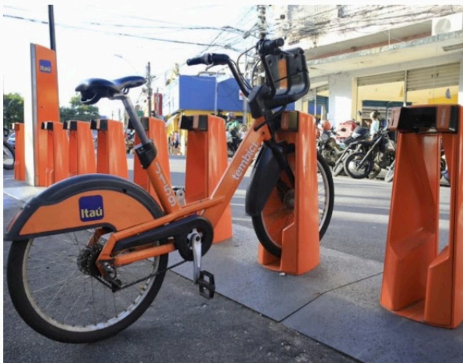
ROTINA Levantamento constatou ainda que 75% dos clientes usam o sistema de bicicletas diariamente

do uso das bicicletas como fonte de renda, o impacto no meio ambiente, além de um perfil detalhado dos usuários do serviço.