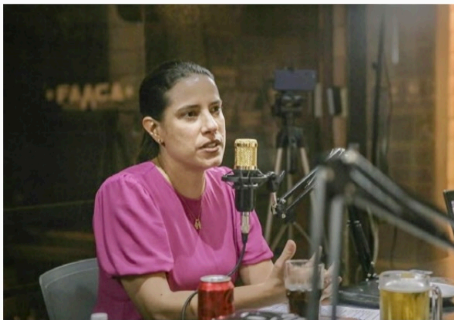
LIVE Tucana conversou com o Movimento Cultura Independente de Pernambuco, que reúne trabalhadores da área

"O Estado deve agir como articulador e capacitador da cultura e da economia criativa e garantir que Pernambuco sempre tenha bons projetos culturais na prateleira para captar recursos nacionais e internacionais. Venho aqui como alguém que tem