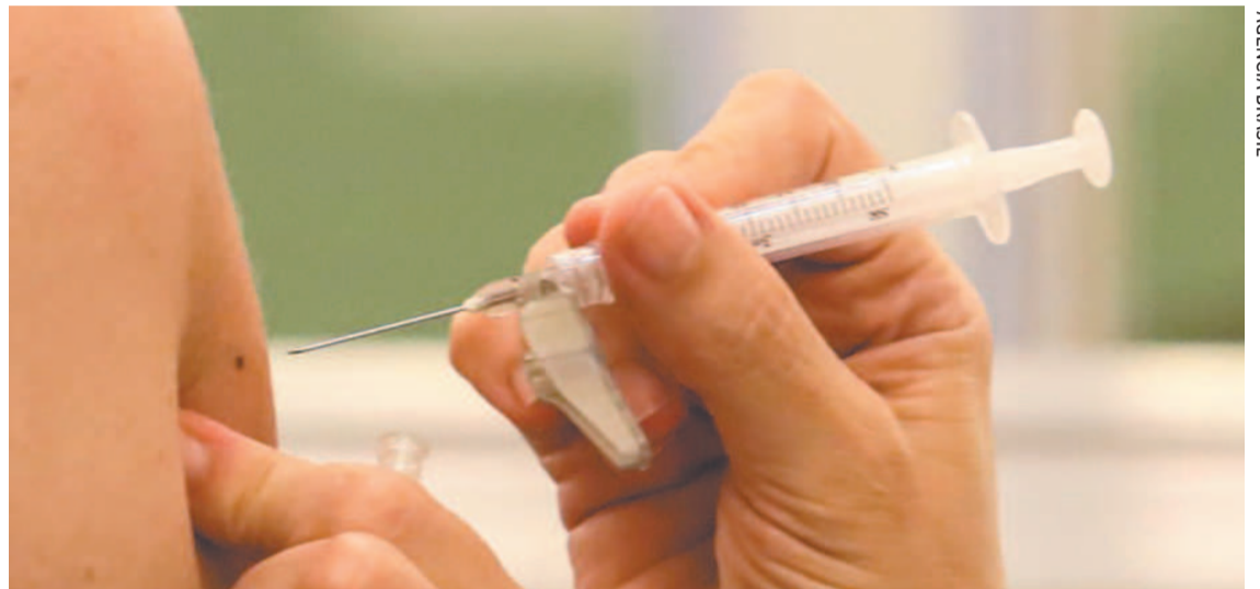
Dados, com o tempo, reforçarão ainda mais importância da imunização, dizem cientistas

Estudo foi feito pela Fiocruz. Fenômeno é observado em todas as faixas etárias, mas entre idosos, contudo, é ainda mais acentuado, pela perda de resposta imunológica