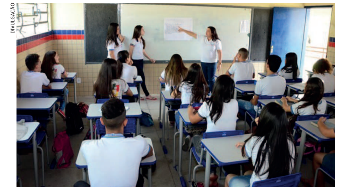
Escolas públicas têm mais dificuldade, mas desigualdades regionais influenciam