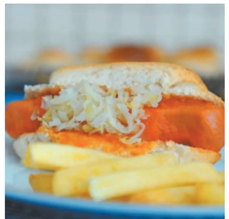
Frituras e embutidos estão entre os grandes vilões

A pesquisa baseia-se em banco de dados em inglês, com informações de saúde de moradores da região. Os participantes tinham 55 anos ou mais e não apresentavam demência no início do estudo. Eles foram acompanhados por 10 anos. Ao final, 518 foram diagnosticadas com algum tipo de degeneração da cognição. (Do Correio Braziliense)