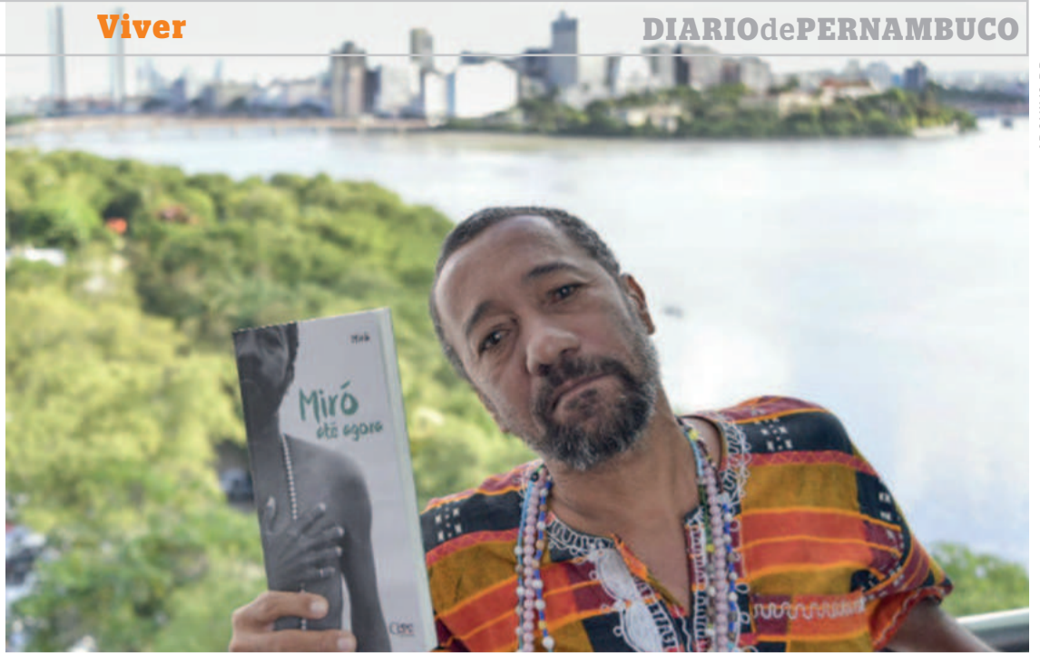
O poeta, com sua veia urbana, vinha ganhando novos leitores e respeito dos críticos