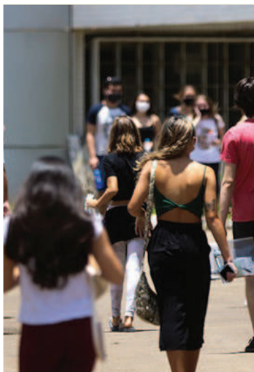
Há bolsas de 50% e de 100%