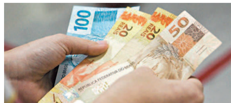
R$ 303 equivale a 25% do salário mínimo vigente

Para os custos de energia, água e esgoto seria possível obter descontos por meio das tarifas sociais. A Compesa disponibiliza a cobrança mínima de R$ 9,44 para inscritos em programas sociais e a Neoenergia desconta até 65%. Mesmo descontando possíveis gastos com moradia, saúde, educação, vestuário e higiene, o salário mínimo existencial não conseguiria suprir as necessidades básicas.