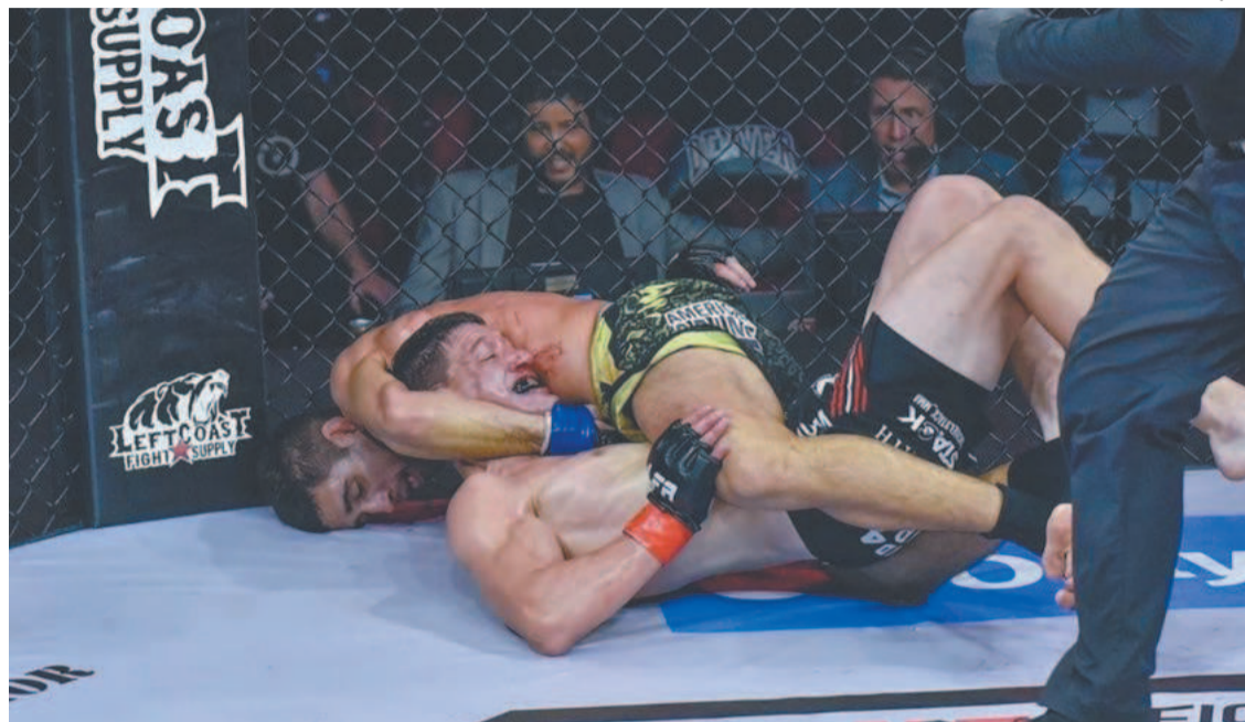
Vencedores de cada categoria garantem automaticamente um contrato com o Bellator

O LFA terá transmissão ao vivo para mais de 213 países, com exibição para o Brasil nos canais SporTV 3, Combate e UFC Fight Pass, que hoje já tem 1,2 milhão de assinantes. O canal ESPN também