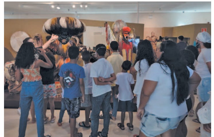
Atendimento a crianças e adolescentes é o foco do grupo

famílias que perderam tudo, recebem doação, mas sabemos que em muitas vezes não é suficiente, então temos buscado arrecadar agasalhos para as famílias. Além de itens para bebês, que é uma das nossas grandes necessidades, como fraldas, sabonetes, pomadas de assadura, lenços umedecidos. Têm várias alternativas para as pessoas colaborarem e se solidarizarem com o projeto”, ressaltou.