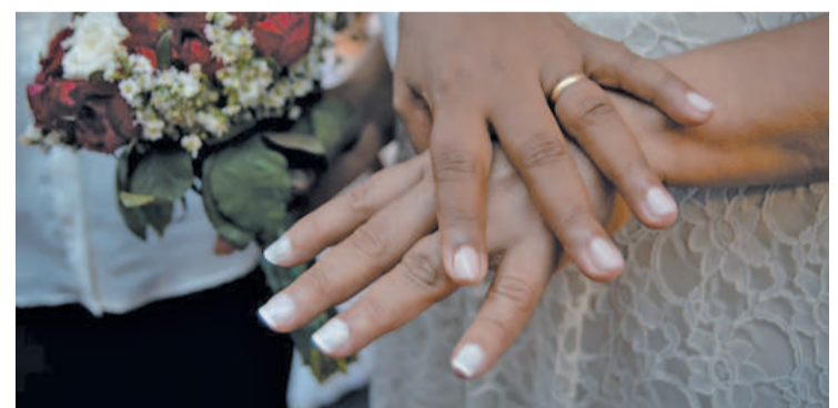
Interessados têm até 5 de setembro para fazer pedido

Até a sonhada data, os envolvidos também contarão com palestras e aconselhamentos para ajustar toda preparação do casamento coletivo, versando sobre temas importantes para a vida a dois. A formação também esclarece sobre os detalhes jurídicos que envolvem o matrimônio e trâmites para a obten-