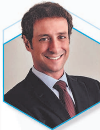
Economia e Negócios em Foco