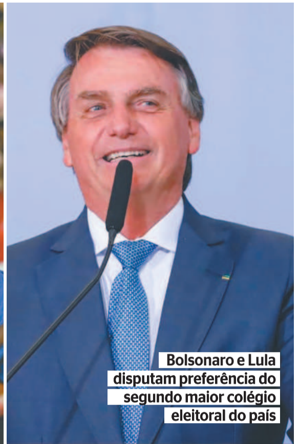
Bolsonaro e Lula disputam preferência do segundo maior colégio eleitoral do país

fim do mês passado, pesquisa do Instituto F5 Atualiza Dados apontou que Lula tem 44,8% das intenções de voto em Minas Gerais, contra 31,5% de Bolsonaro. A sondagem está registrada no Tribunal Superior Eleitoral (TSE)