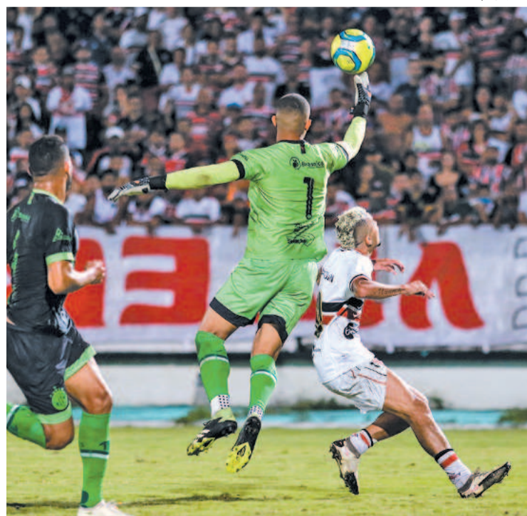
Além da logística, corais terão desfalques para partida