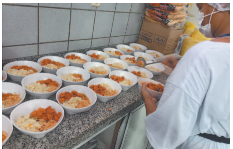
Distribuição de alimentos faz parte da rotina da ONG