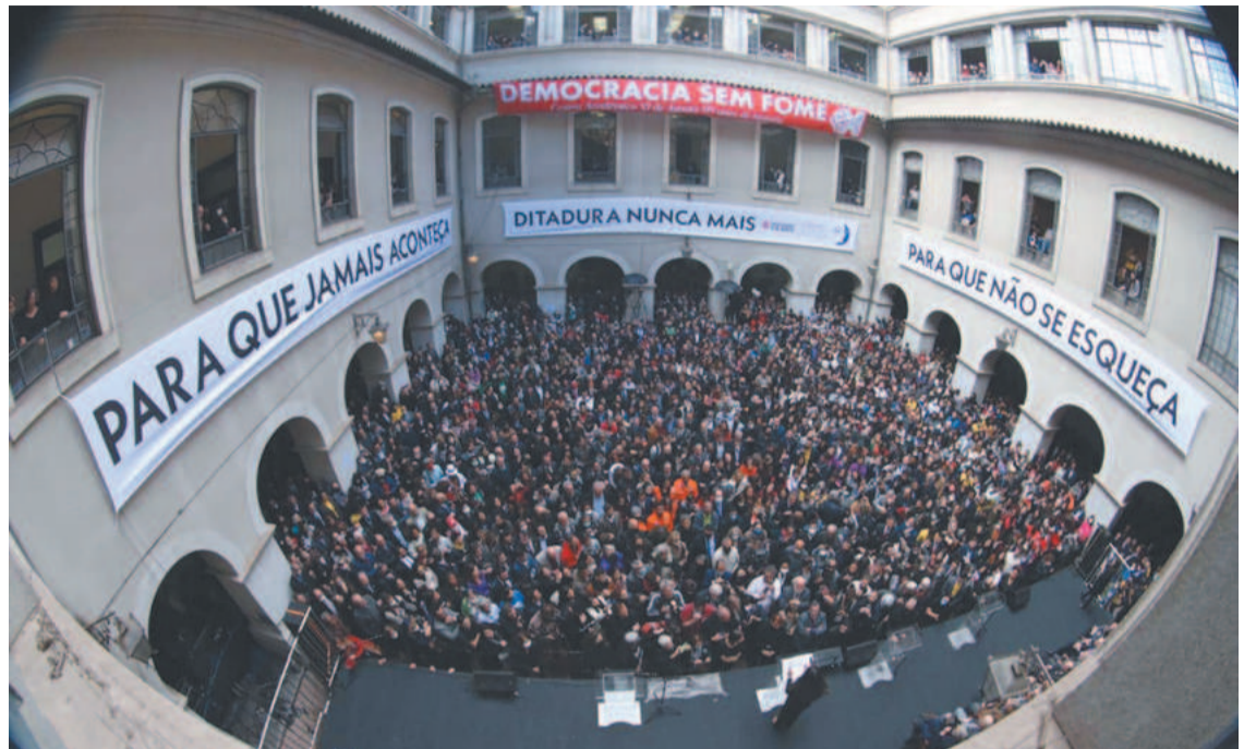
Ato em São Paulo foi acompanhado por multidão e deu início à mobilização nacional

José Carlos Dias (82 anos), advogado, presidente da Comissão Arns e ex-ministro da Justiça entre 1999 e 2000, durante