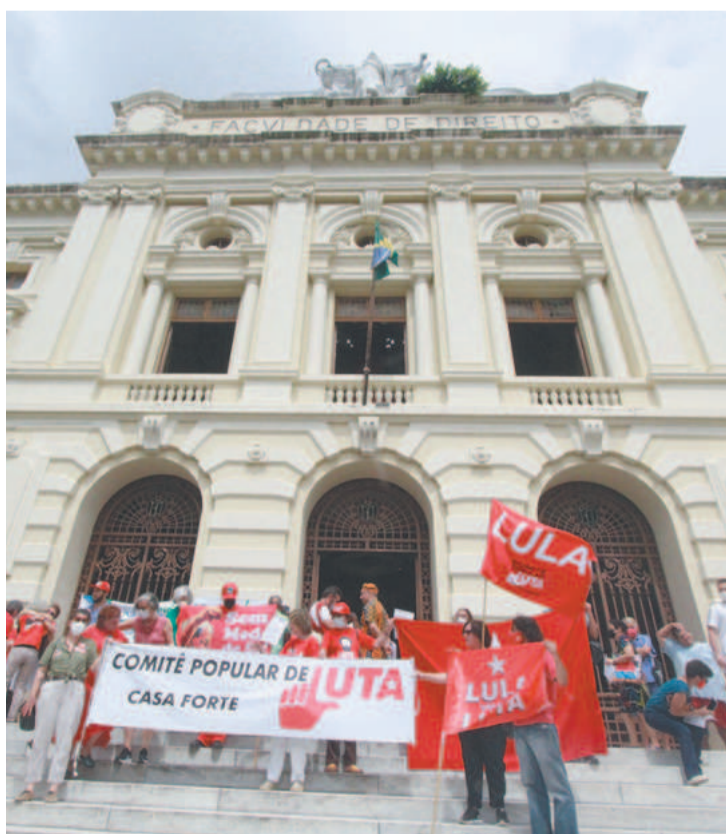
Houve leitura de carta na Faculdade de Direito do Recife