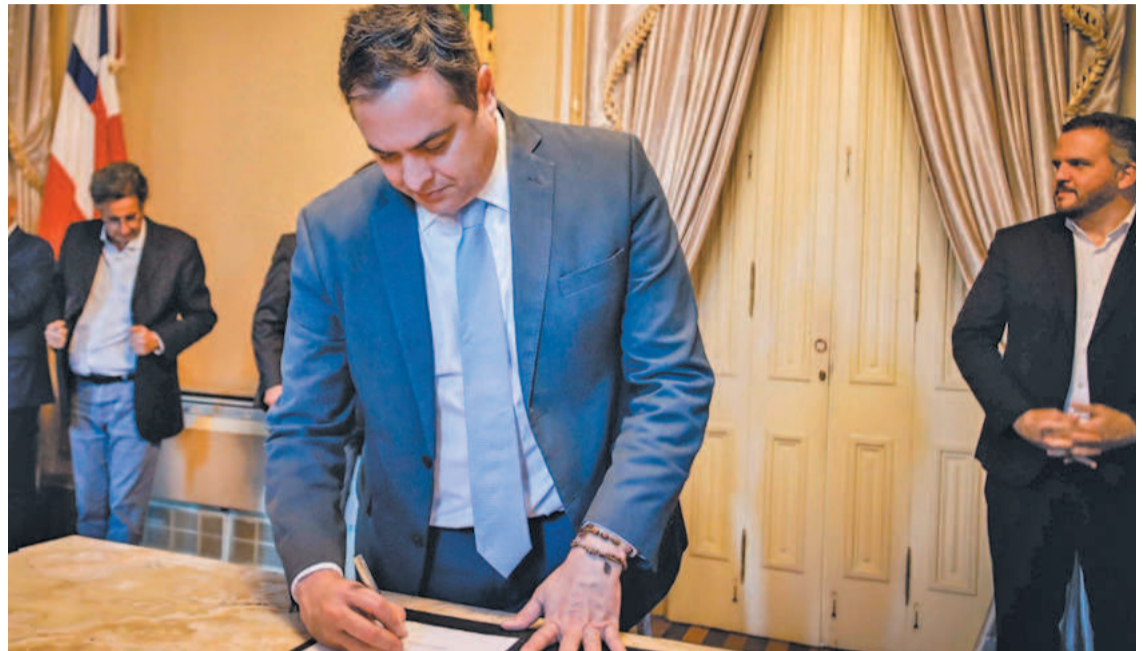
Governador Paulo Câmara assinou acordos com os prefeitos, ontem, no Palácio

As obras de desenvolvimento urbano e habitação autorizadas ontem também vão assegurar a pavimentação de ruas em Arcoíaba, Goiana e Passira.