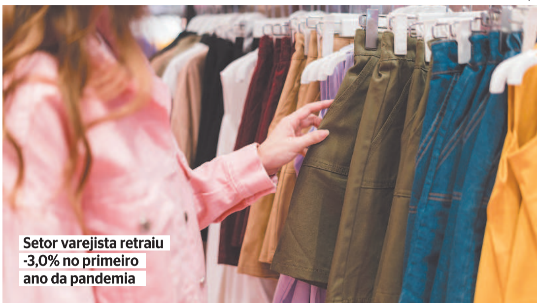
Setor varejista retraiu -3,0% no primeiro ano da pandemia

Embora timidamente, a pandemia elevou o número de empresas no comércio do estado. O IBGE registrou um avanço geral de 0,58% de estabelecimen-