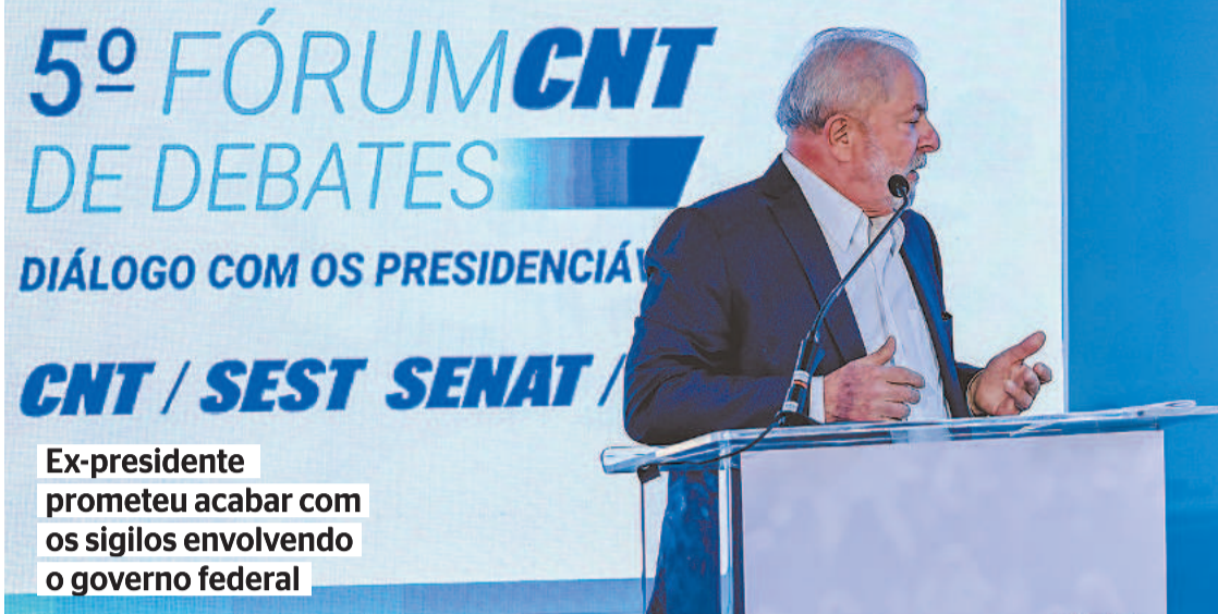
Ex-presidente prometeu acabar com os sigilos envolvendo o governo federal

No governo de Lula, houve casos como o do Mensalão, que estourou quando o então deputado federal Roberto Jefferson (PTB) denunciou o pagamento de propinas em troca de apoio legislativo. A investigação levou integrantes do PT à prisão e gerou, por exemplo, a cassação de José Dirceu na Câmara dos Deputados. Jefferson, o denunciante, se tornou aliado do presidente Jair Bolsonaro (PL) e, embora tenha