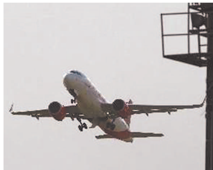
Apesar da decisão, alguns protocolos seguirão ativos

Em documento, a Anvisa informou que o cenário epidemiológico atual permite que algumas medidas sanitárias tomadas em 2020 sejam atualizadas, como o uso obrigatório das máscaras. "Diante do atual cenário, o uso de máscaras, adotado até então como medida de saúde coletiva, é convertido em medida