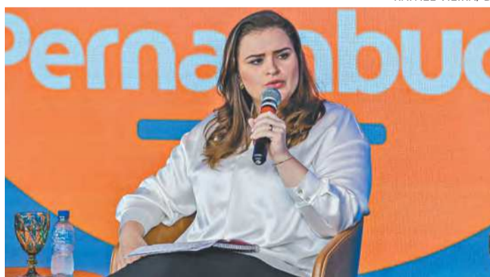
Candidata defendeu a recriação do Chapéu de Palha