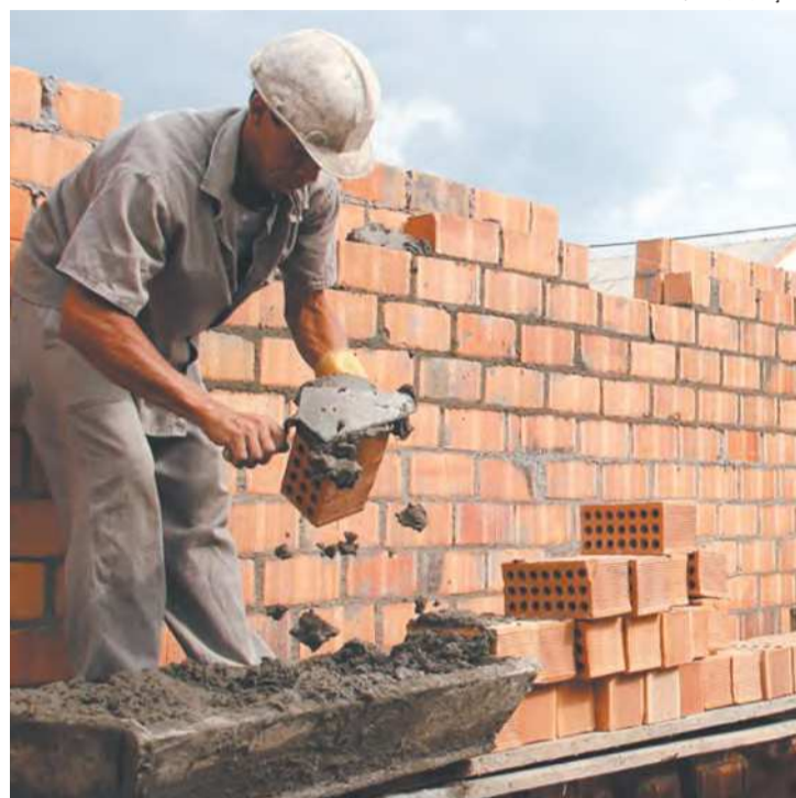
Alta na mão de obra e matéria-prima impactaram custos

Dado positivo é que parte expressiva das empresas da construção (47,1%) afirmou que as renegociações de contratos estão sendo bem-sucedidas. Por outro lado, outros 31,3% aguardam respostas da renegociação e 21,6% disseram que os processos não sendo bem-sucedidos. Por segmento, os de Obras viárias (40,2%) e Obras de artes (39,3%), nos quais predominam contratos com os governos federal, estadual e municipal, são os que mais aguardam respostas. A