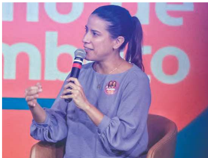
Ex-prefeita de Caruaru foi primeira sabatinada na série

“O índice de competitividade dos estados indica Pernambuco nas piores posições para empreender. E isso é uma somatória de fatores que impede o estado de prosperar. A gente vai fazer uma força tarefa, primeiro com a desburocratização da abertura de novas empresas. Em Caruaru criamos o “Facilita Caruaru” e aqui vamos criar o “Facilita Pernambuco”, para reduzir o tempo de abertura de novos negócios. Lá [Carua-