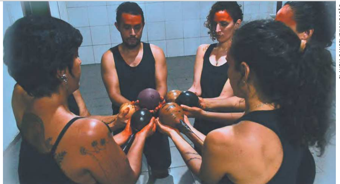
Apresentação será aberta ao público amanhã, às 20h, no Teatro Hermilo Borba Filho

Para fazer esta conexão entre o lado do caos e a essência das pessoas, vão sendo introduzidos em cena alguns elementos durante a performance, tais como instru-