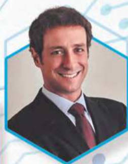
Economia e Negócios em Foco com Ecio Costa (Segundas-feiras)