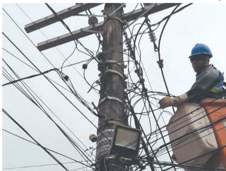
Empresa fará fiscalizações na área central até setembro