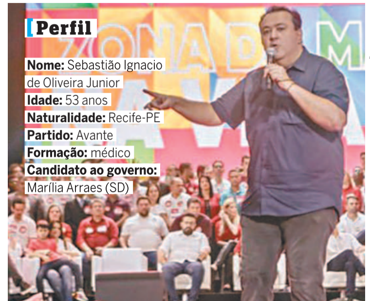
Sebastião levou o Avante para o palanque de Marília

Antes de ser o meio de campo no time de Marília, Sebastião foi deputado estadual pelo PL. Deixou o partido em 2020, já como deputado federal – cargo para o qual foi eleito pela primeira vez em 2014, mesmo ano em que foi nomeado secretário de Transportes de Pernambuco por Paulo Câmara (PSB). Em Brasília, o deputado se absteve na votação que sacramentou o afastamento de Dilma Rousseff (PT).