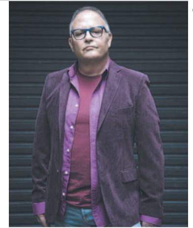
Guilherme Arantes faz show no sábado em Olinda

ra a Arena de Pernambuco, em São Lourenço da Mata, e Guilherme Arantes, com o projeto In concert , no Teatro Guararapes. Já a Casa da Rabeca, em Olinda, será reaberta com várias atrações.