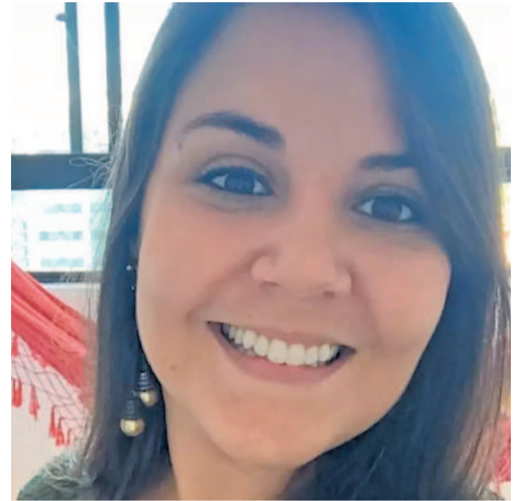
A vítima e o acusado estavam juntos há oito meses