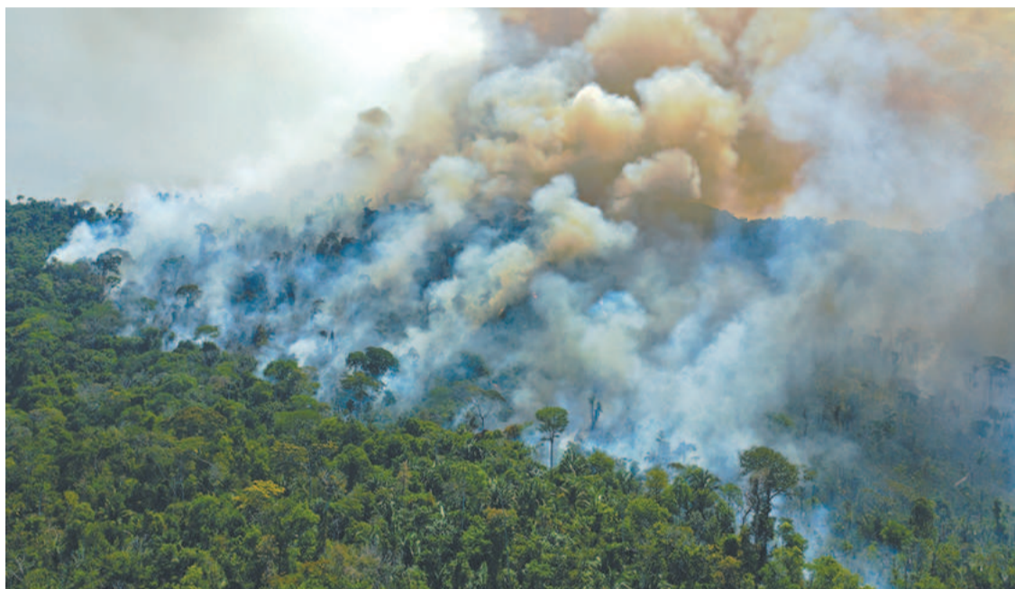
Especialistas atribuem queimadas na Amazônia a agricultores, pecuaristas e grileiros

O número de queimadas na Amazônia legal registrou um recorde em quase 15 anos na segunda-feira, segundo cifras oficiais, em um novo sinal da destruição provocada na maior floresta tropical do planeta. Imagens de satélite detectaram 3.358 incêndios florestais na segunda-feira, 22 de agosto, o número mais elevado em um dia desde setembro de 2007, confirmou à AFP ontem um funcionário do Instituto Nacional de Pesquisas Espaciais (Inpe).