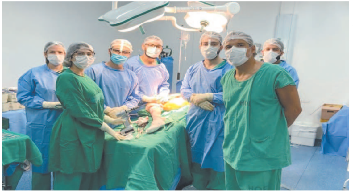
Operação demorou cerca de três horas. Paciente teve uma prótese de quadril trocada

"Ao avaliarmos o caso, identificamos um obstáculo que era o estoque ósseo dela para suportar a remoção da prótese anterior e colocação da nova. Diante disso, foi necessário partir para o enxerto de tecido ósseo visando à restauração da área com ausência de osso. O Hospital Otávio de Freitas iniciou o contato junto à Central de Trans-