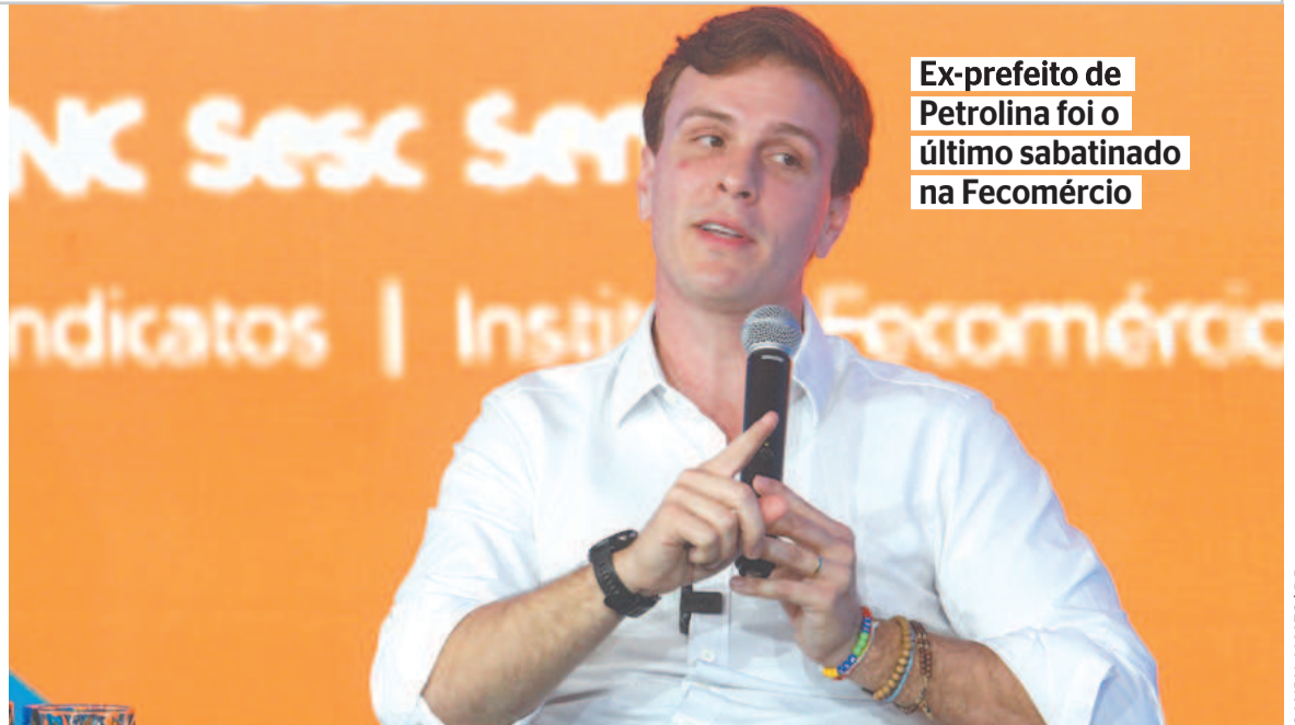
Ex-prefeito de Petrolina foi o último sabatinado na Fecomércio

“Em Pernambuco vamos implantar o programa Terra Plantar, com apoio técnico ao pequeno produtor familiar. O IPA (Instituto Agrônomo de Pernambuco) vai ser reestruturado e fortalecido, assim como o Iterpe (Instituto de Terras e Reforma Agrária do Estado de Pernambuco)”, disse. Em seu Plano de Governo, o Terra Plantar visa ainda realizar ações como aração, distribuição de sementes, silagem, implantação e limpeza de barreiros e manutenção permanente.