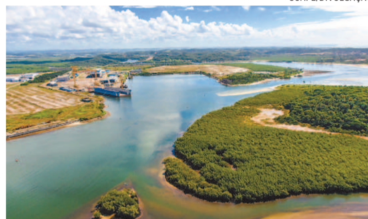
Área destinada à fábrica fica fora do porto organizado

O Complexo Industrial Portuário de Suape publicou edital para arrendamento de área destinada à instalação de uma planta industrial produtora de hidrogênio verde (H2V). As propostas podem ser encaminhadas até 27 de setembro. O texto está disponível no site do complexo, devendo ser publicado no Diário Oficial do Estado.