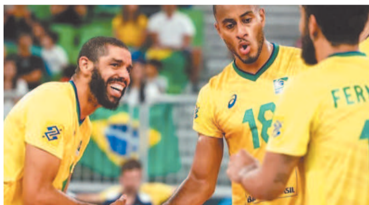
Brasil lidera o Grupo B com cinco pontos e duas vitórias

que Cuba, segunda colocada. Já classificados às oitavas, os brasileiros voltam a competir amanhã, às 6h (horário de Brasília), em confronto contra o Catar, último jogo da fase da primeira fase. (Agência Brasil)