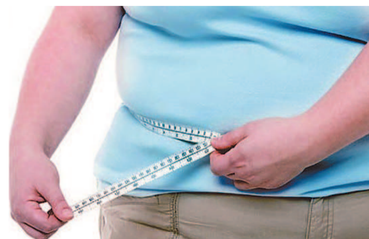
Obesidade subiu na pandemia e afeta a saúde em geral

Um encontro gratuito com nove especialistas no Recife pretende esclarecer as dúvidas mais comuns sobre o enfrentamento à obesidade.