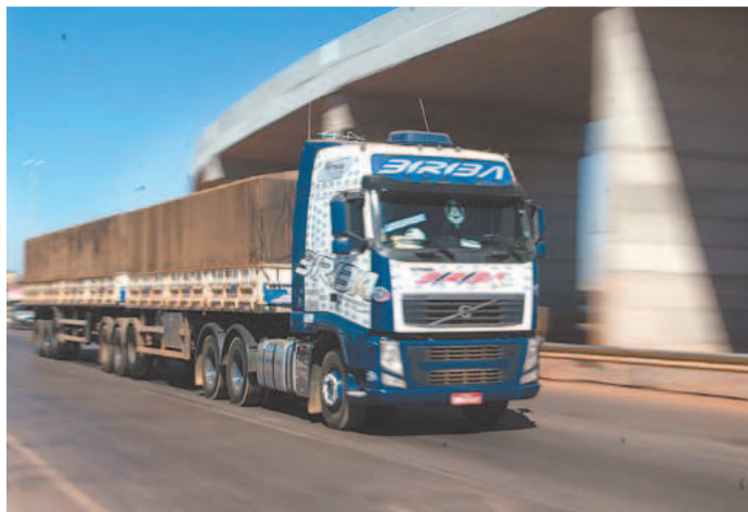
Primeiras parcelas serão pagas em 6 de setembro