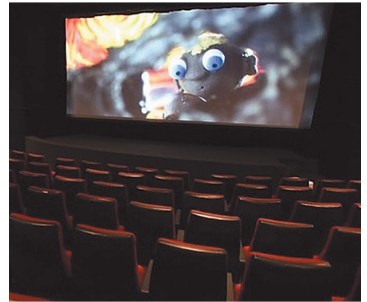
Entre as atividades que as pessoas mais sentiram falta no ano passado no país está ir ao cinema

tos com cultura no ambiente digital, o valor médio foi de R$ 128,38, sendo que 35% dos entrevistados não gastaram nada. As regiões Norte e Centro-Oeste são aquelas nas quais as pessoas declararam os maiores gastos, R$ 159,18. Os valores mais baixos ficaram com o Nordeste (R$ 102,93) e o Sul (R$ 122,74). O gasto médio com atividades culturais presenciais foi de R$ 178, mas 50% dos entrevistados disseram que não gastam nada. A pesquisa também avaliou o impacto do consumo de cultura na saúde mental. Nesse aspecto, 68% responderam que assistir a programação on-line aumenta o bem-estar.