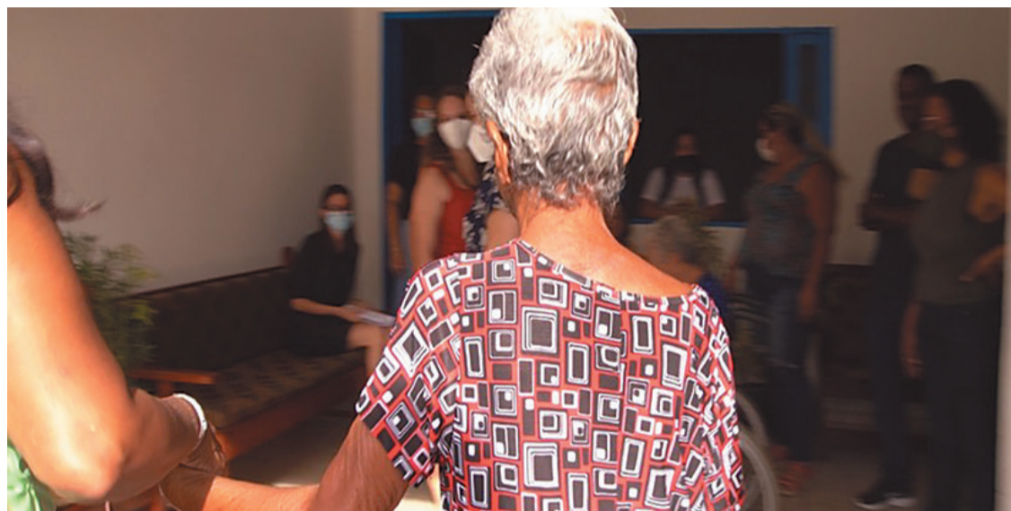
Com fim de colônia em Igarassu, pessoas serão transferidas para centros de convivência

Estado comemora ter liberado as últimas pacientes que viviam em instituições de longa permanência, um marco na luta antimanicomial pernambucana