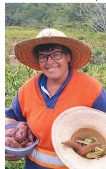
Mulheres são prioridade