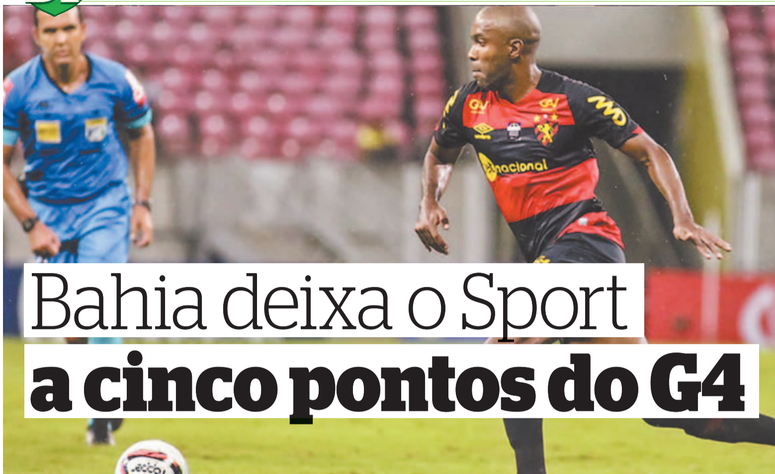
ANDERSON STEVENS/SPORT CLUB DO RECIFE