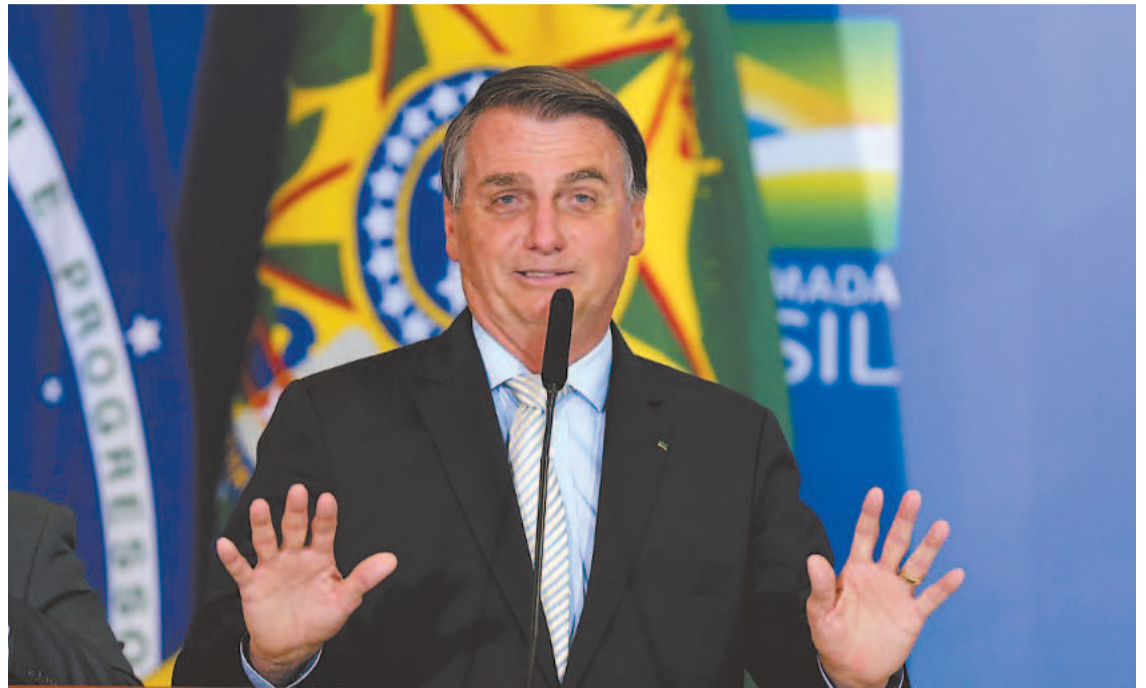
Jair Bolsonaro afirmou durante entrevista que “não existe da forma como é falado”

Dados de recente relatório da Organização das Nações Unidas (ONU) mostram que quase 30% da população brasileira sofre de insegurança alimentar moderada ou grave. São 61,3 milhões de pessoas que não têm garantia de alimentação - entre elas, 15,4 milhões convivem com insegurança alimentar grave. Os dados da pesquisa foram colhidos no período de 2019 a 2021.