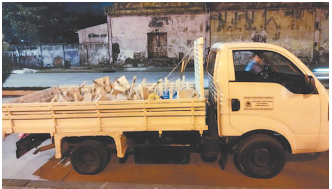
Fiscalização também apreendeu ontem 170 bases de bandeiras irregulares

Caminhão tem circulado exclusivamente para veicular mensagens “antidemocráticas, inverídicas e difamatórias”