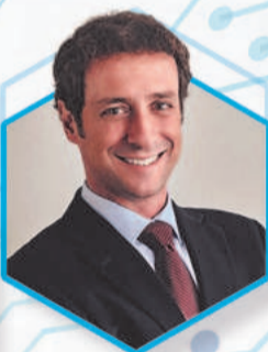
Economia e Negócios em Foco com Ecio Costa (Segundas-feiras)