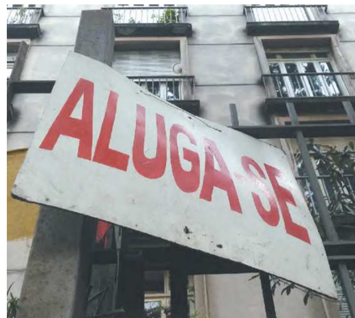
Taxa havia registrado queda em setembro de 2021

O IGP-M é composto pela ponderação de três outros índices: Índice de Preços ao Produtor Amplo (IPA), Índice de Preços ao Consumidor (IPC) e Índice Nacional de Custo da Construção (INCC). O IPA registrou queda de 0,71% em agosto, na análise por estágios de processamento; a taxa do grupo Bens Finais caiu 0,73% em agosto, enquanto o IPC recuou 1,18%, com seis das oito classes de despesa compo-