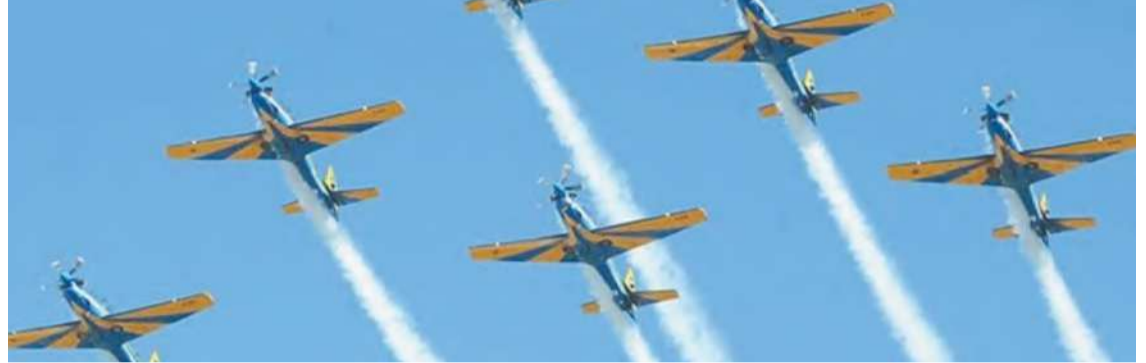
Grupo de pilotos apresenta-se amanhã no céu do Recife

No Recife, os aviões A-29 Super Tucano tomarão os céus da capital pernambucana a partir das 16h de amanhã. A demonstração tem duração aproximada de 45 minutos. O ponto cen-