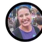
Raquel Lyra (PSDB)