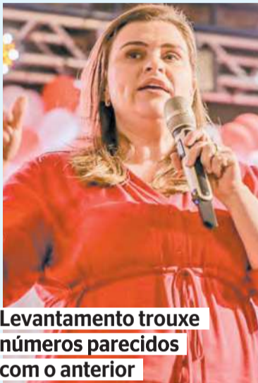
Levantamento trouxe números parecidos com o anterior