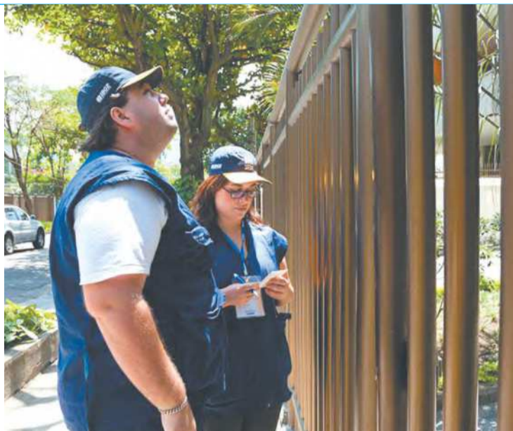
O questionário básico do censo contém 26 perguntas

dos domicílios responderam ao questionário básico e 11,8% ao ampliado. O questionário básico contém 26 questões sobre características do domicílio, moradores e a identificação étnico-racial, registro civil e educação. De acordo com o IBGE, 2,3% das residências não responderam.