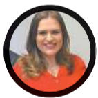
Marília Arraes (SD)