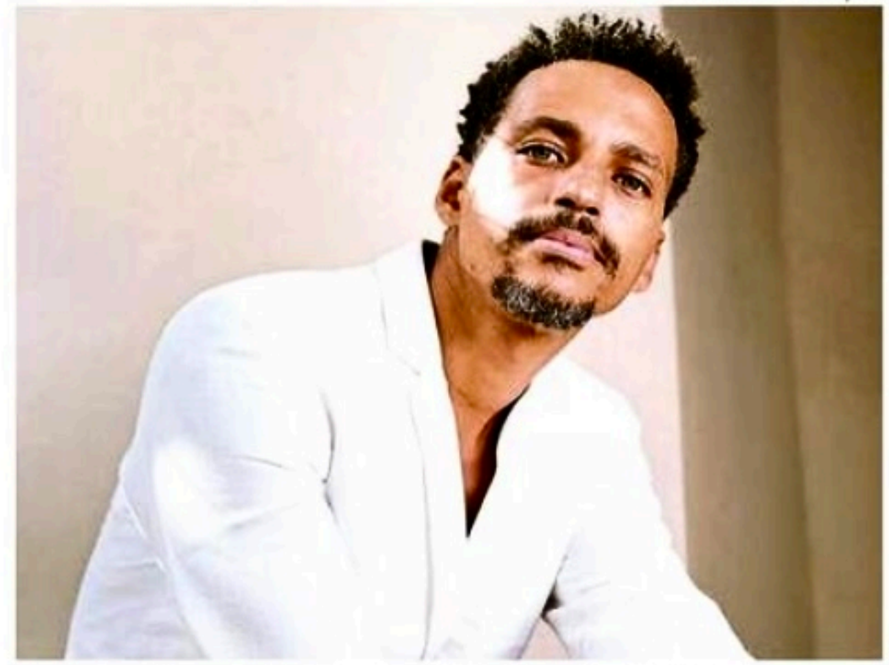
Ator começou a carreira como modelo aos 17 anos mundo afora

Hoje, orgulha-se por se tornar um instrumento de reflexão e de crítica com o próprio trabalho. "O audiovisual é uma ferramenta importante no processo de dar visibilidade e propor alternativas a temas negligenciados por autoridades e pela sociedade", defende ele. "Bom Dia, Verônica" cumpre essa função muito bem", valoriza ele, que também atuou em "O Escolhido".