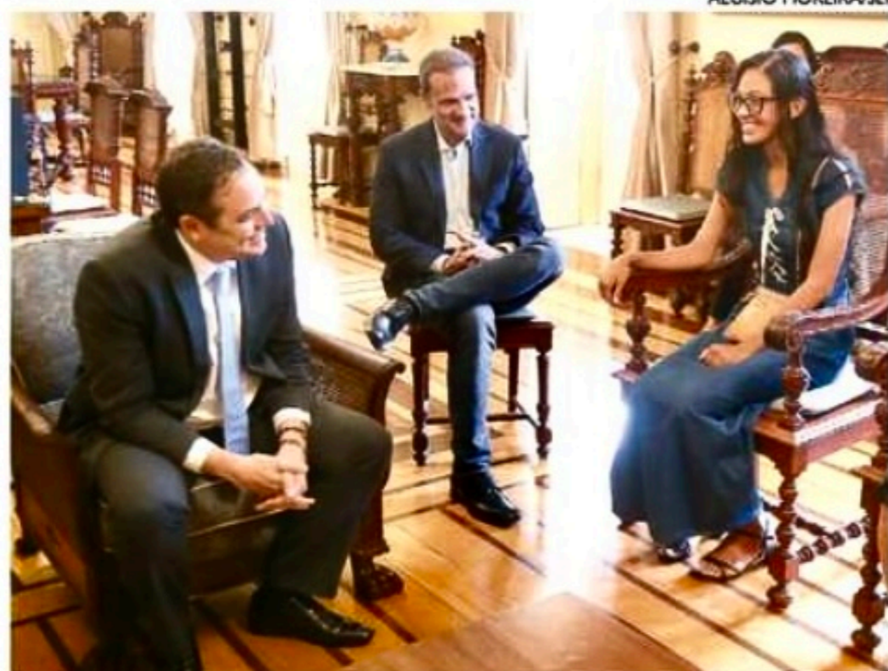
Governador Paulo Câmara anuncia que Estado irá custear passagem

Os interessados em ajudar podem fazer a doação no site da Vakinha. As informações sobre a vaquinha podem ser encontradas no perfil @voa_dandara ou dentro do site Vakinha, com o id 2744046.