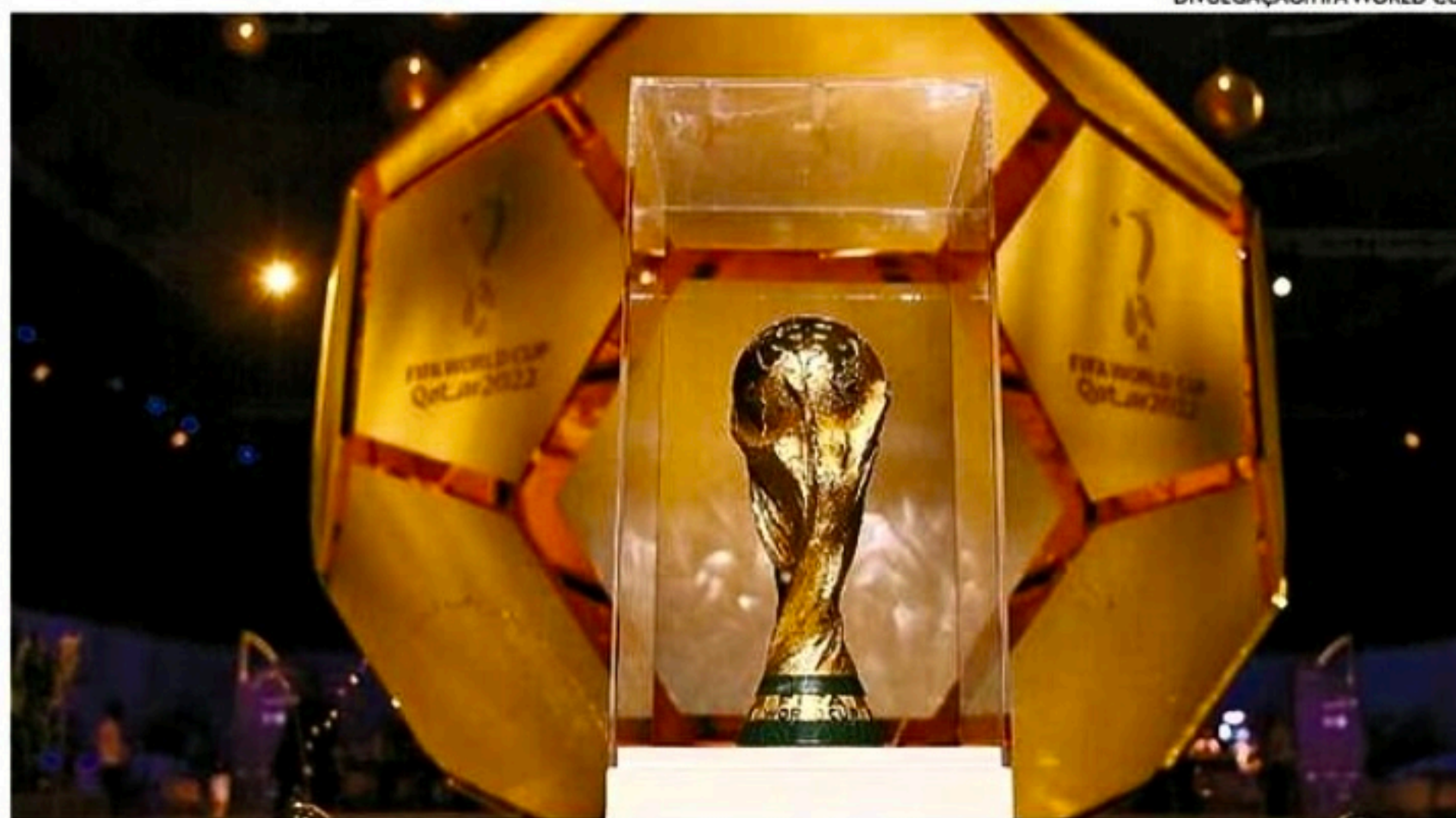
Competição terá Catar x Equador no jogo inaugural, a partir das 13h (horário de Brasília), no estádio Al Bayt

Para os torcedores que têm ingressos para a partida de 21 de novembro, "qualquer problema será administrado de forma que o impacto seja mínimo", disse à AFP outra fonte próxima ao torneio.