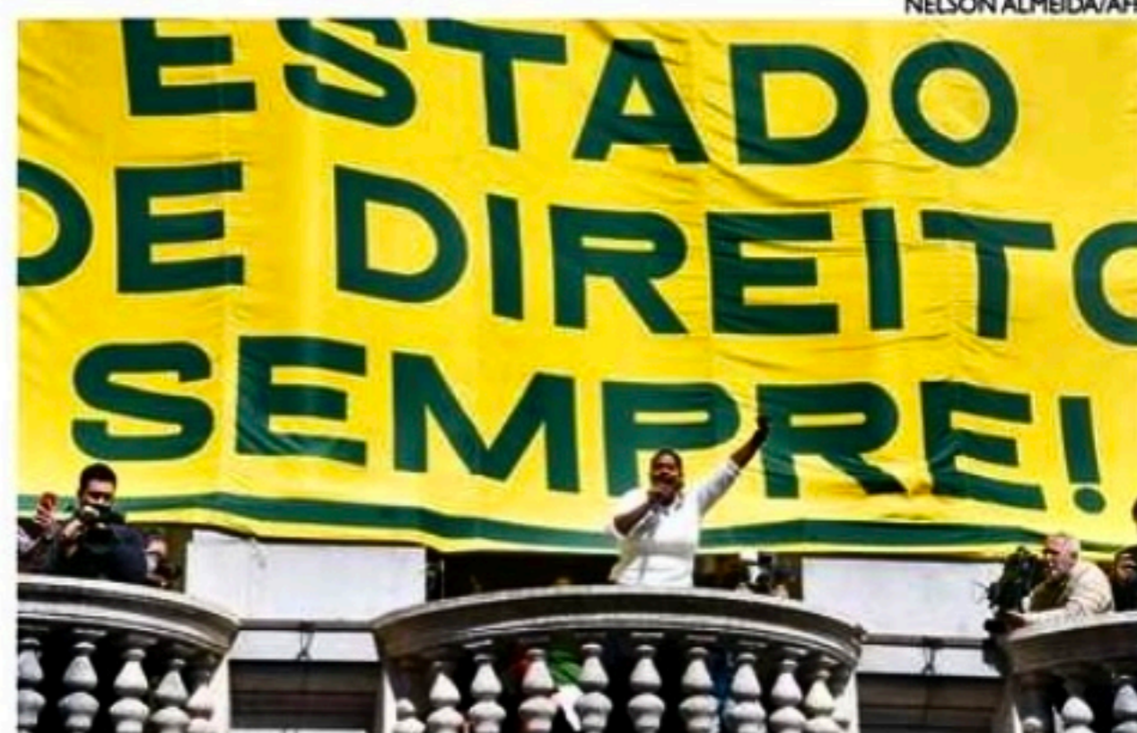
Juristas, estudantes e lideranças acompanharam ato na USP em São Paulo

No Recife, o movimento teve como palco a Faculdade de Direito do Recife (FDR), no Centro da cidade. Os participantes do ato chegaram com cartazes com os nomes de movimentos sociais e alguns leva-