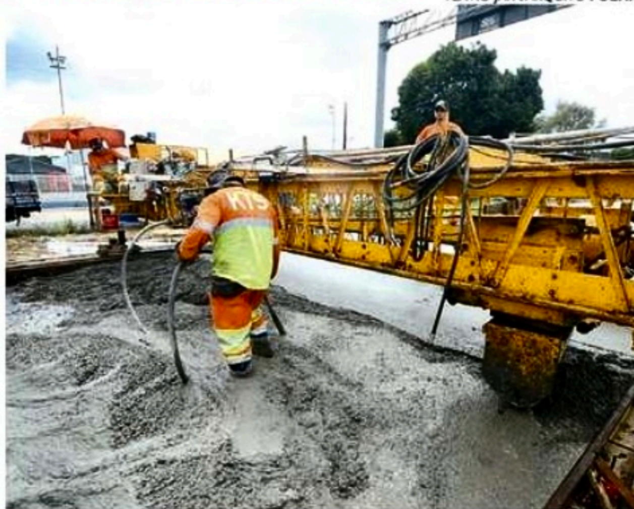
Nova etapa da obra tem previsão de 45 dias para ser finalizada