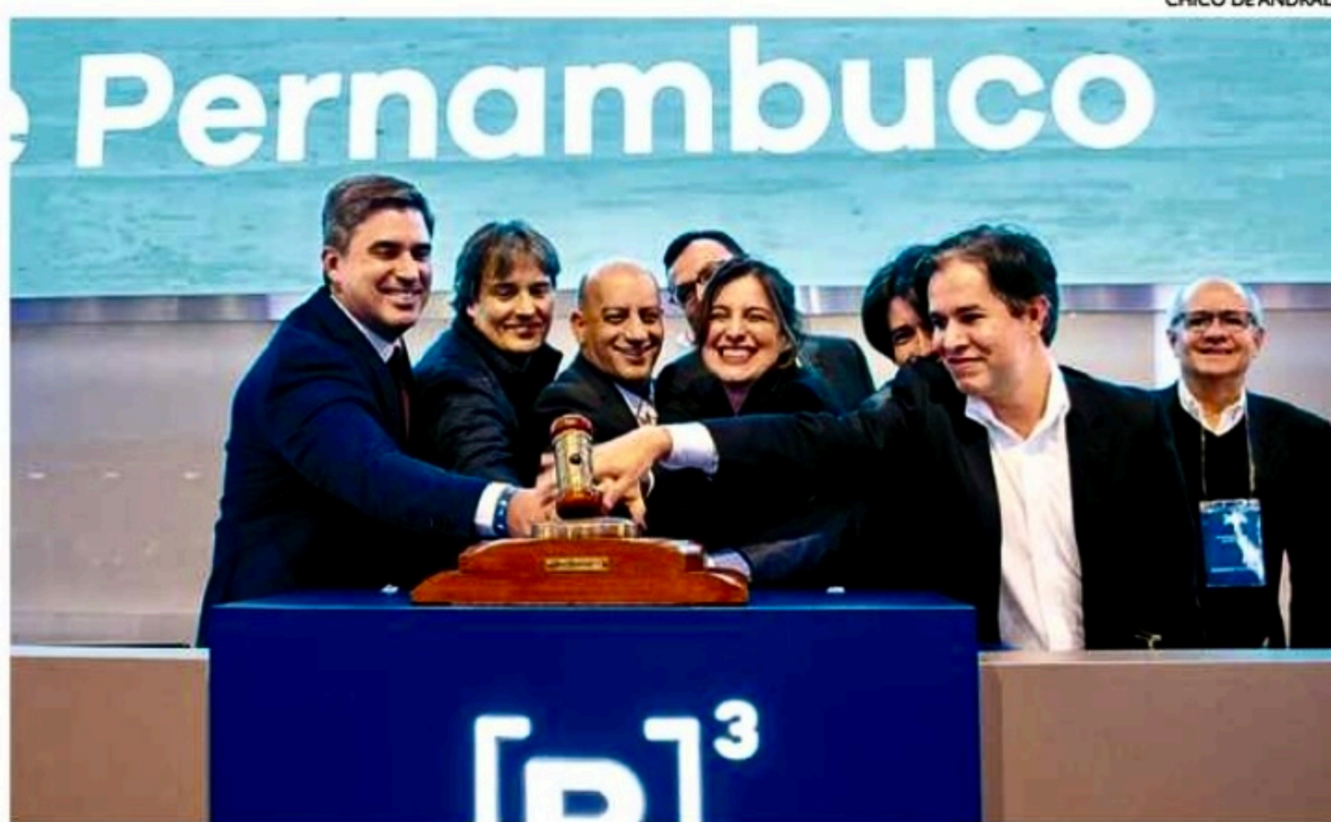
A B3, em São Paulo, foi o palco do leilão. Vencedores devem assumir o Cecon a partir de dezembro

Após o processo do leilão, o próximo passo será a habilitação para a concessão. Essa fase deve durar entre 20 e 30 dias, sendo necessária para dúvidas e esclarecimentos da qualificação técnica e econômica do processo. Em seguida, ha-