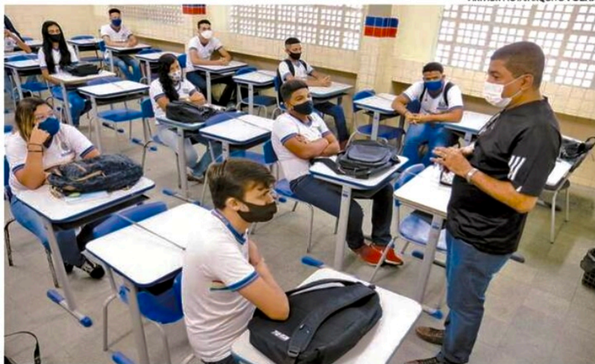
Anunciada ontem pelo Governo do Estado, medida vale tanto para rede de ensino pública quanto privada

A SES-PE registrou, ontem, 803 casos da Covid-19. Agora, Pernambuco totaliza 1.041.447 casos confirmados da doença, sendo 59.634 graves e 981.813 leves. Também foram contabilizados sete óbitos (4 masculinos e 3 femininos). Com isso, o Estado totaliza 22.134 mortes.