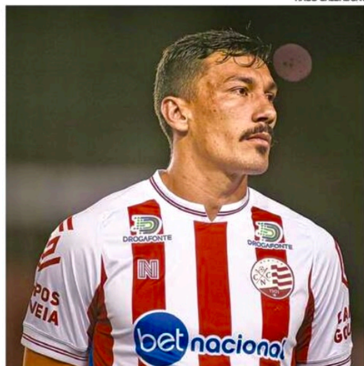
Volante está com uma lesão grau 1 na coxa esquerda