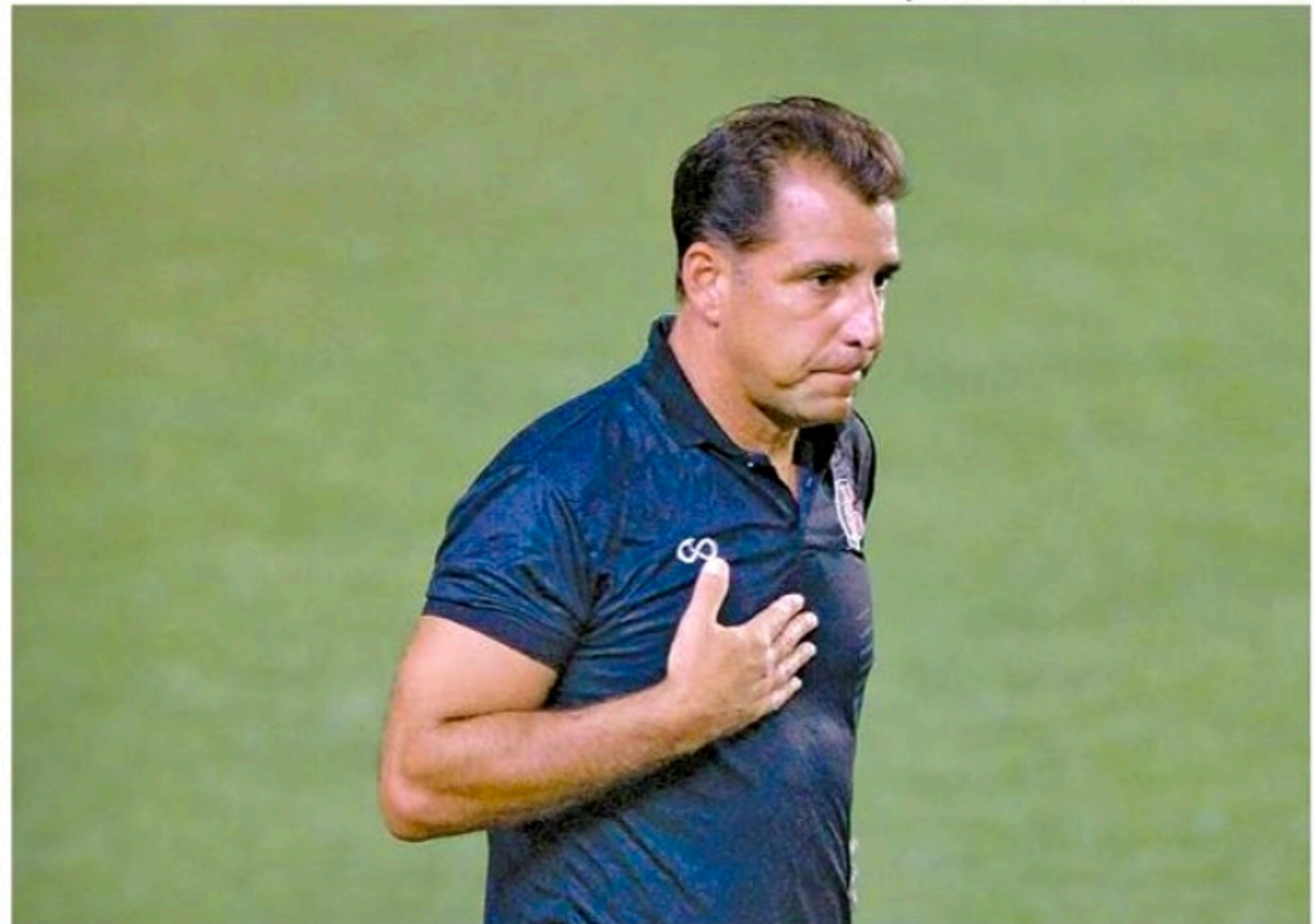
Depois do revés sofrido para o Tocantinópolis, treinador havia falado em permanecer no Santa Cruz

Três dias após eliminação na Série D, técnico deixa o comando do time tricolor, que tem reapresentação marcada para hoje, no Arruda