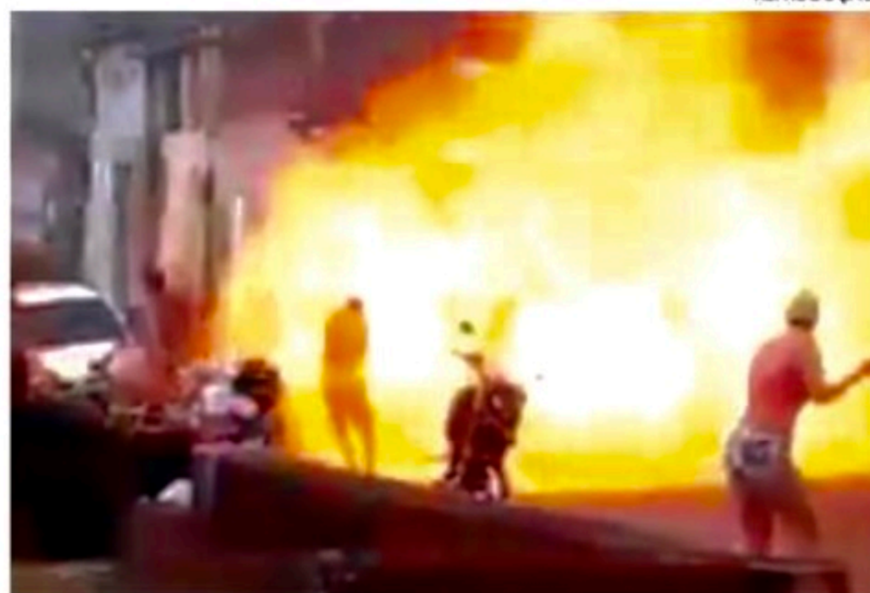
Acidente ocorreu no último dia 24 de julho, em Água Fria