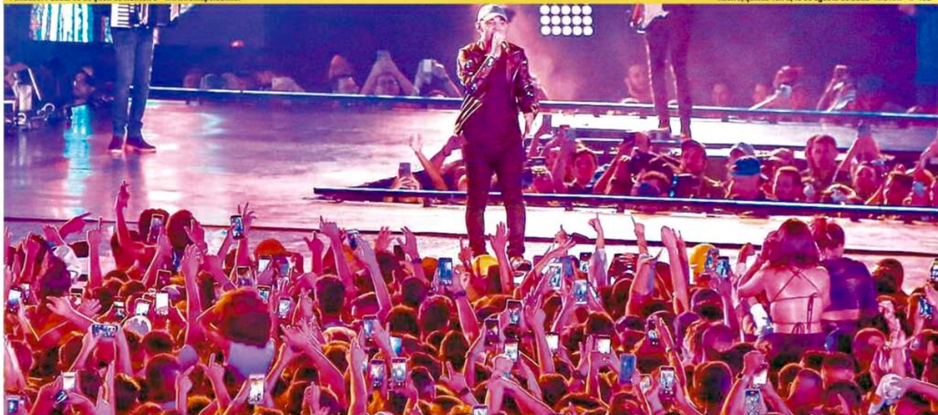
O artista de Serrita, que já é considerado um fenômeno da música brasileira, deu um show no palco e interagiu com os milhares de fãs

Recife, quinta-feira, 18 de agosto de 2022 Ano XXV n° 192