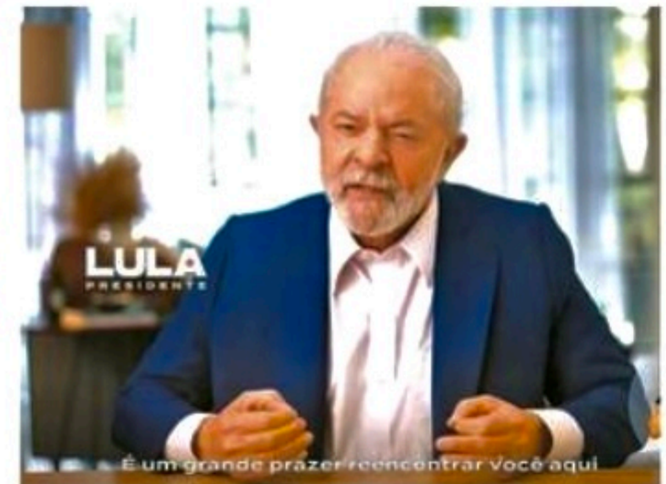
Lula abordou os preços praticados no seu governo