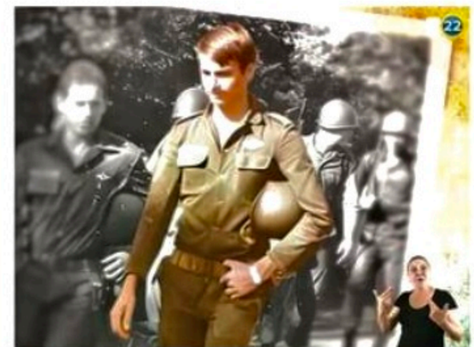
Bolsonaro voltou a mostrar lembranças da juventude

■ Presidenciáveis dividiram seus programas entre propostas de governo e apresentação de biografias para o eleitorado no segundo guia eleitoral