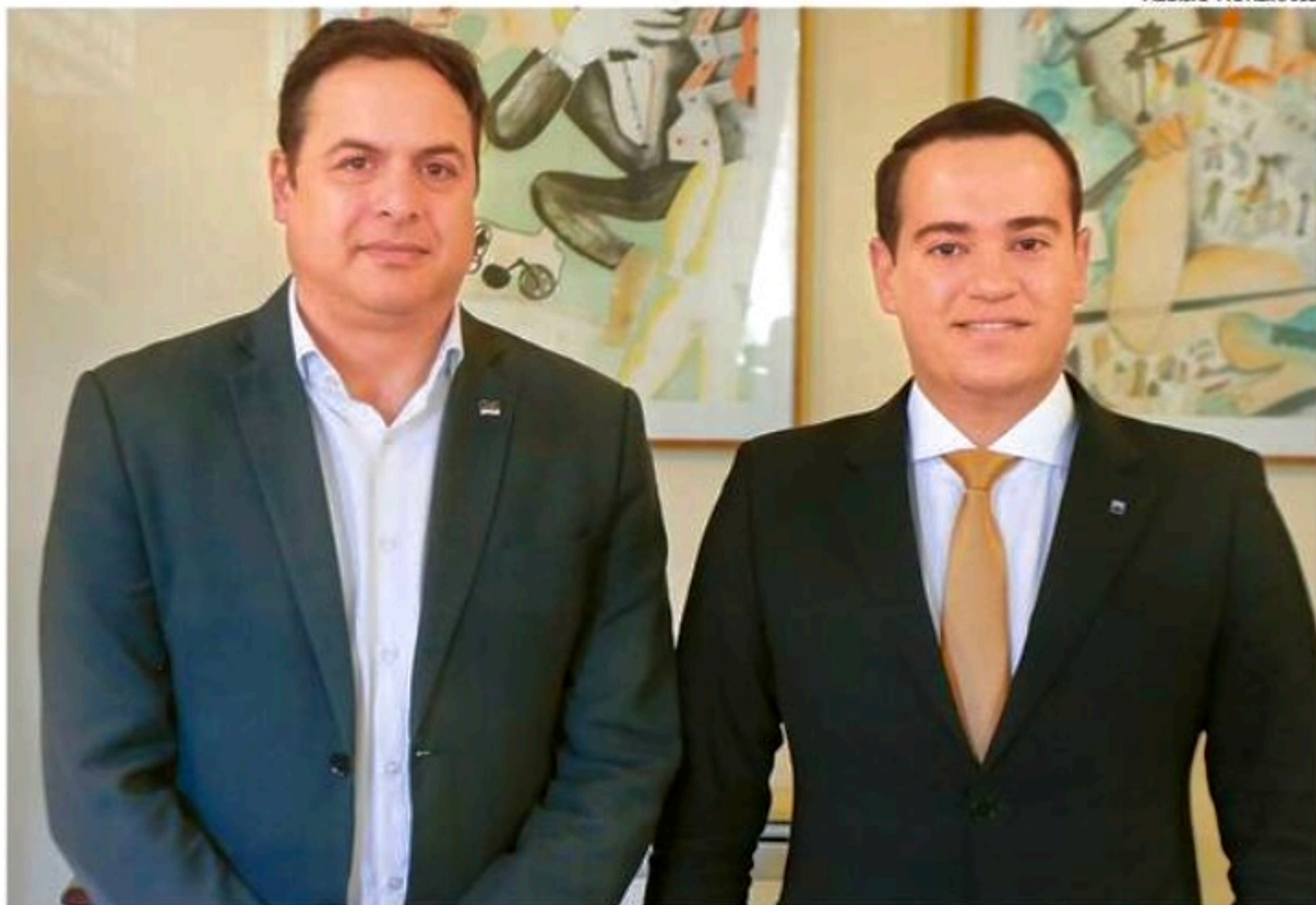
O governador Paulo Câmara (PSB) e o presidente do Porto do Recife, Tito Moraes, em recente encontro para assinatura da ordem de serviço para a instalação do novo Museu do Porto do Recife