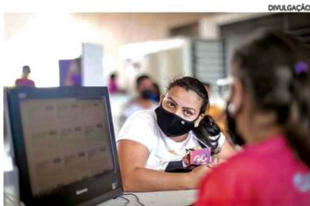
Para participar, interessado precisa fazer o cadastro prévio

Onde: No MTE, na Avenida Agamenon Magalhães, nº 2000, no Espinheiro Inscrições: site www.e-inscricao.com/gorecife/arenago-superintendenciado-trabalho