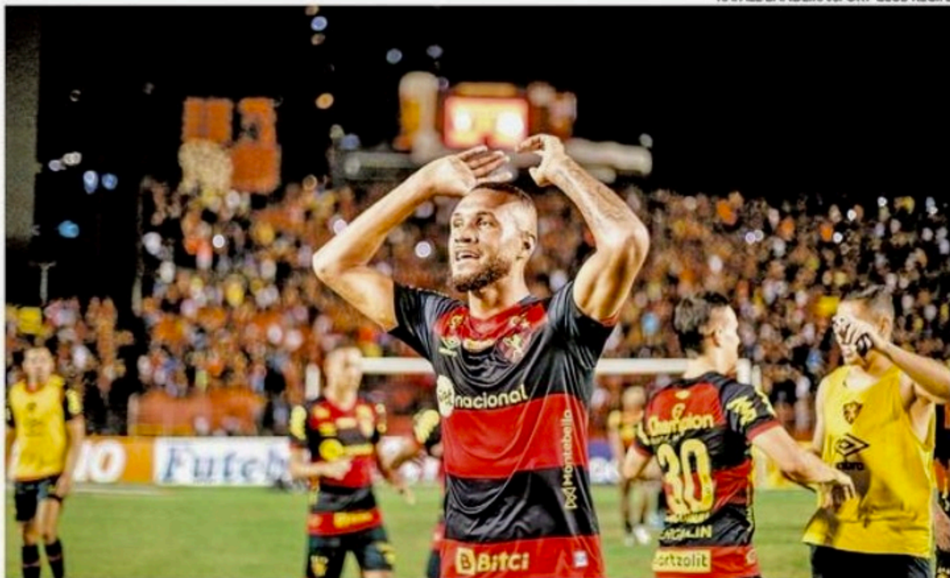
Rubro-negro chega a 40 pontos na Segundona com triunfo conquistado, ontem, na Ilha do Retiro

Com gol aos 42 minutos do segundo tempo, Sport derrota Novorizontino na Ilha do Retiro e fica a dois pontos do G4 da Série B do Brasileiro