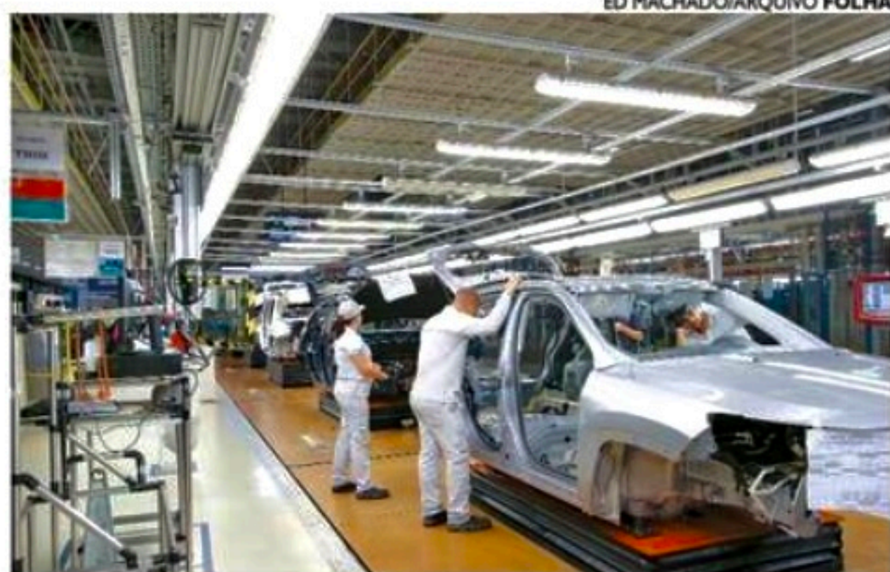
O curso da Stellantis será realizado junto com o CIn-UFPE e a Facepe

A formação de profissionais na área automotiva será oferecida em Pernambuco através de um programa promovido pela Stellantis (dona de marcas como Jeep e Fiat, com fábrica no Polo de Goiana), pelo Centro de Informática (CIn) da Universidade Federal de Pernambuco (UFPE) e pela Fundação de Amparo à Ciência e Tecnologia do Estado de Pernambuco (Facepe). Serão ofertadas 15 vagas para o curso de pós-graduação Lato Sensu em Residência Tecnológica para formação de pessoal no segundo semestre deste ano.