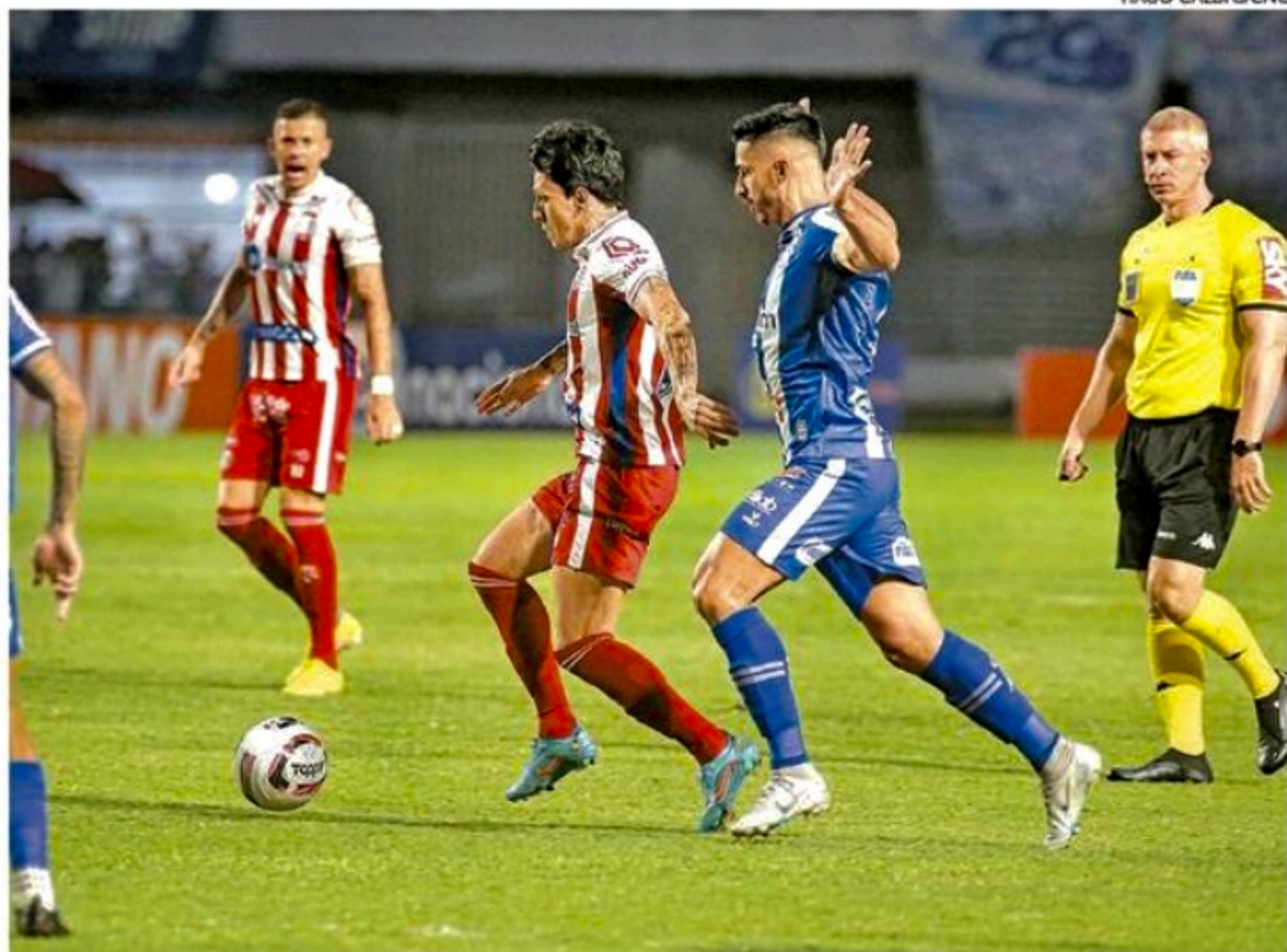
Náutico de Jean Carlos estaciona nos 21 pontos e caminha a passos largos para rebaixamento

Com a casa cheia, era esperada uma pressão dos donos da casa durante a primeira etapa. No entanto, bem postado defensivamente, o Náutico não viu o goleiro Jean correr riscos de ser vazado antes de ir para o intervalo. Com as equipes precisando do resultado na fuga contra a degola, o que se viu foi um jogo amarrado, com muitos passes errados. Apostando nos contra-ataques, o Timbu teve