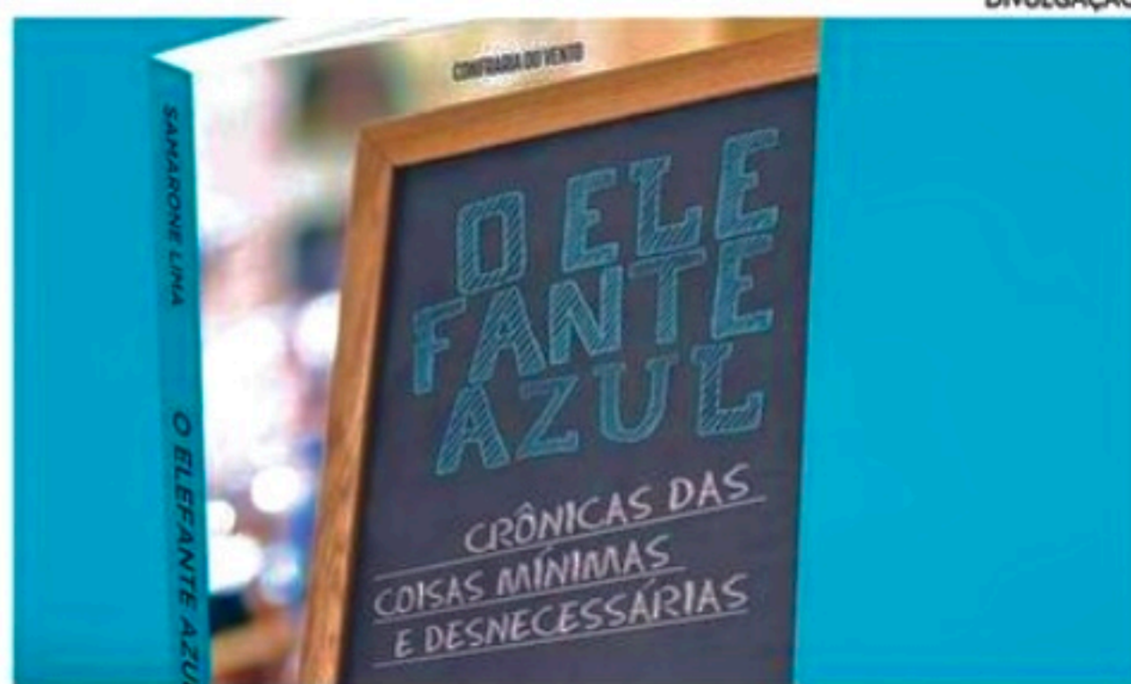
As crônicas do "Elefante" começaram a ser escritas em 2003

Na leitura, é fácil perceber certo lirismo e poesia nos textos. Muitos deles são histórias que o jornalista ouviu ao longo dos anos e outras descortinam sua própria vida em