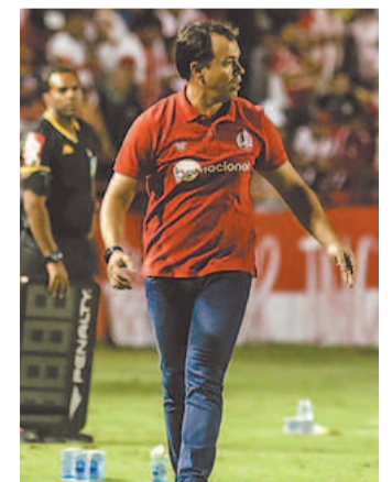
Técnico ressalta o apoio da torcida alvirrubra

sa para o Vasco da Gama, o time recebe o Sampaio Corrêa, na próxima sexta-feira (23).