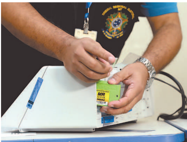
Urnas são adaptadas para os portadores de deficiência