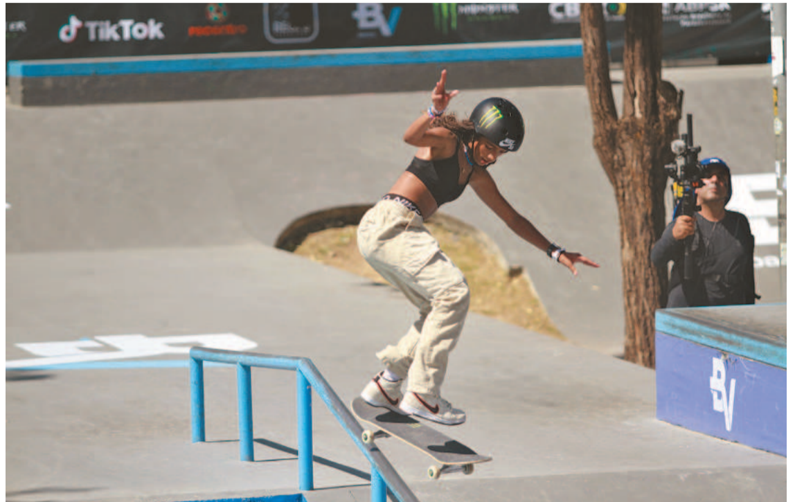
Rayssa Leal foi o nome da competição, disputada na Rua da Aurora, Centro do Recife

Essa foi a quinta vitória de Rayssa Leal em uma edição do STU, competição em que já foi campeã geral em 2019. Gabi Mazzeto, que liderava o ranking antes da edição recifen-