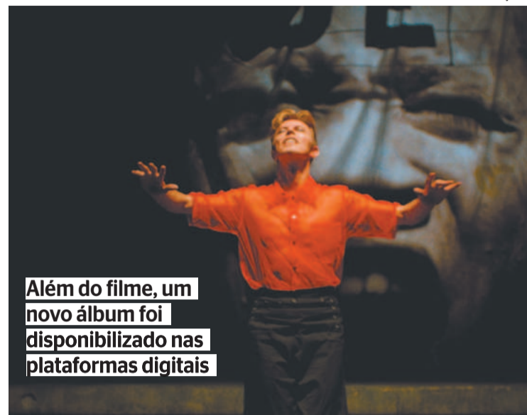
Além do filme, um novo álbum foi disponibilizado nas plataformas digitais

MÚSICA Para aproveitar a estreia, um álbum inédito com a trilha sonora do documentário foi lançado e está disponível nas plataformas digitais. São 43 faixas com canções clássicas do extenso repertório de Bowie e material inédito produzido especialmente para o filme. Mixagens únicas e falas do próprio músico foram adicionadas, proporcionando uma experiência musical inédita.