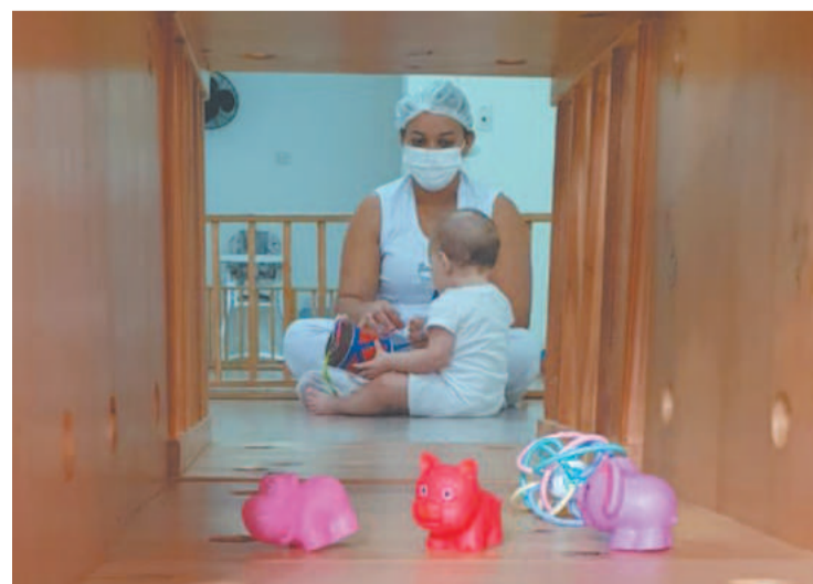
Berçário deixa tudo ao alcance das crianças