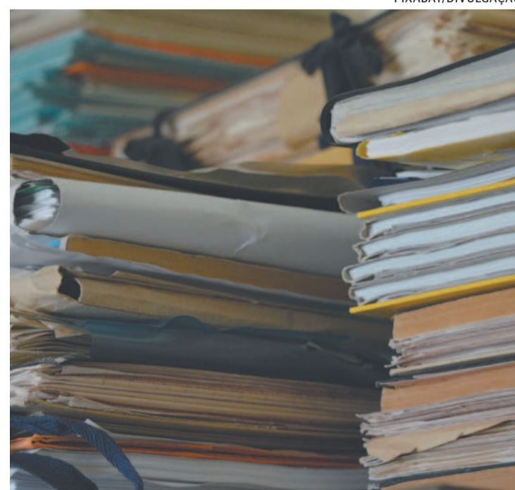
Desburocratizar é um dos caminhos para reduzir custo

Dentre as possíveis soluções vislumbradas pelos especialistas estão a desburocratização