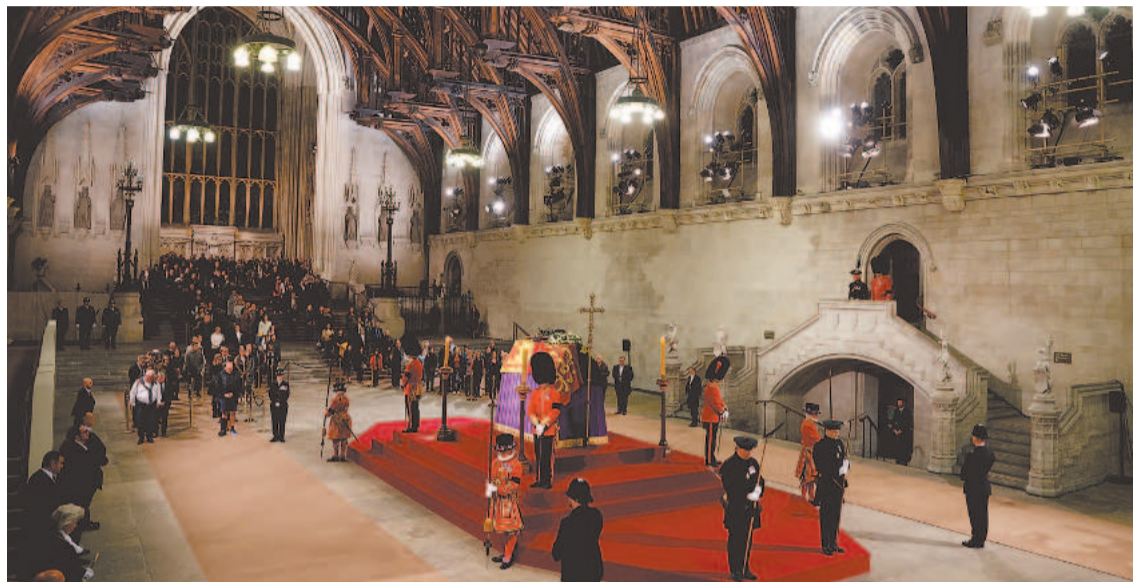
Ontem à noite, britânicos fizeram um minuto de silêncio em homenagem à rainha

Os presidentes dos Estados Unidos, Joe Biden; da França, Emmanuel Macron; do Brasil, Jair Bolsonaro, assim como os monarcas da Espanha, Suécia, Noruega, Luxembur-