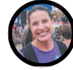
Raquel Lyra (PSDB)

14h45 - Apresenta propostas para segurança pública e caminhada (Jaboatão dos Guararapes)