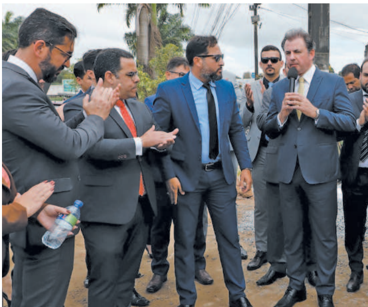
A Ordem em Pernambuco já promoveu três desagravos nos primeiros meses da atual gestão da entidade