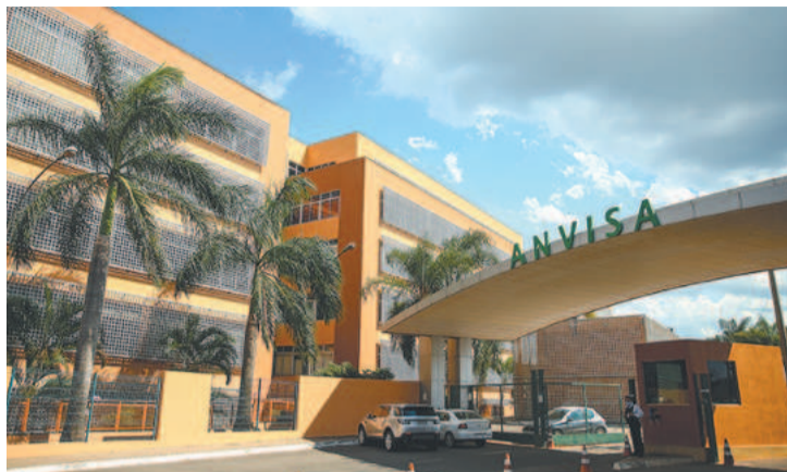
“Consumidores que tenham comprado o produto, também não devem fazer uso”, alertou a agência

Segundo o órgão, foi usada na massa alimentícia a mesma substância dos petiscos que causaram a morte de ao menos 54 animais no país