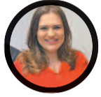
Marília Arraes (SD)