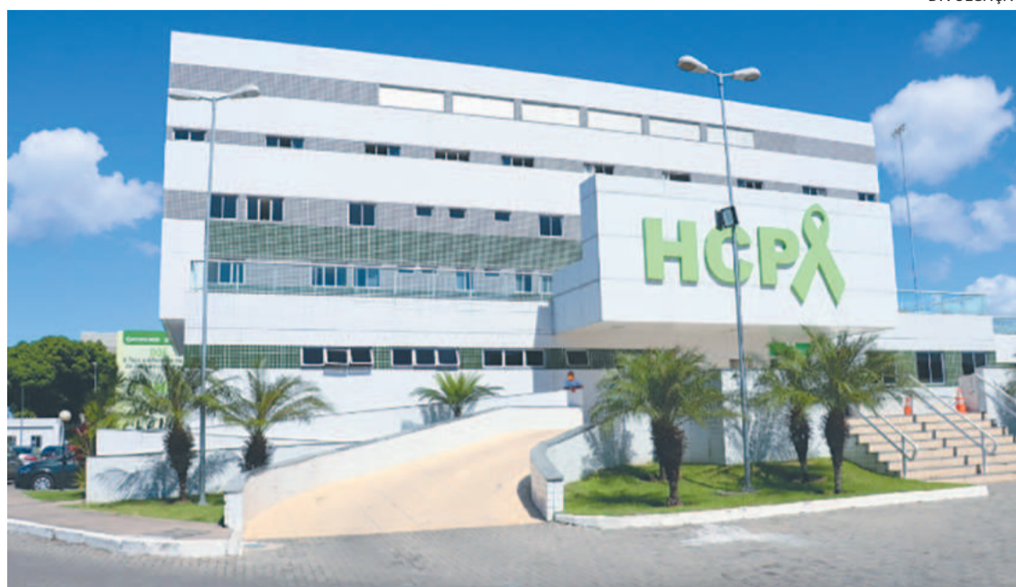
Hospital do Câncer de Pernambuco é um dos locais a receber as palestras sobre o tema

Os trabalhos começam hoje e são voltados para médicos e enfermeiros que atuam em serviços de transplantes no estado