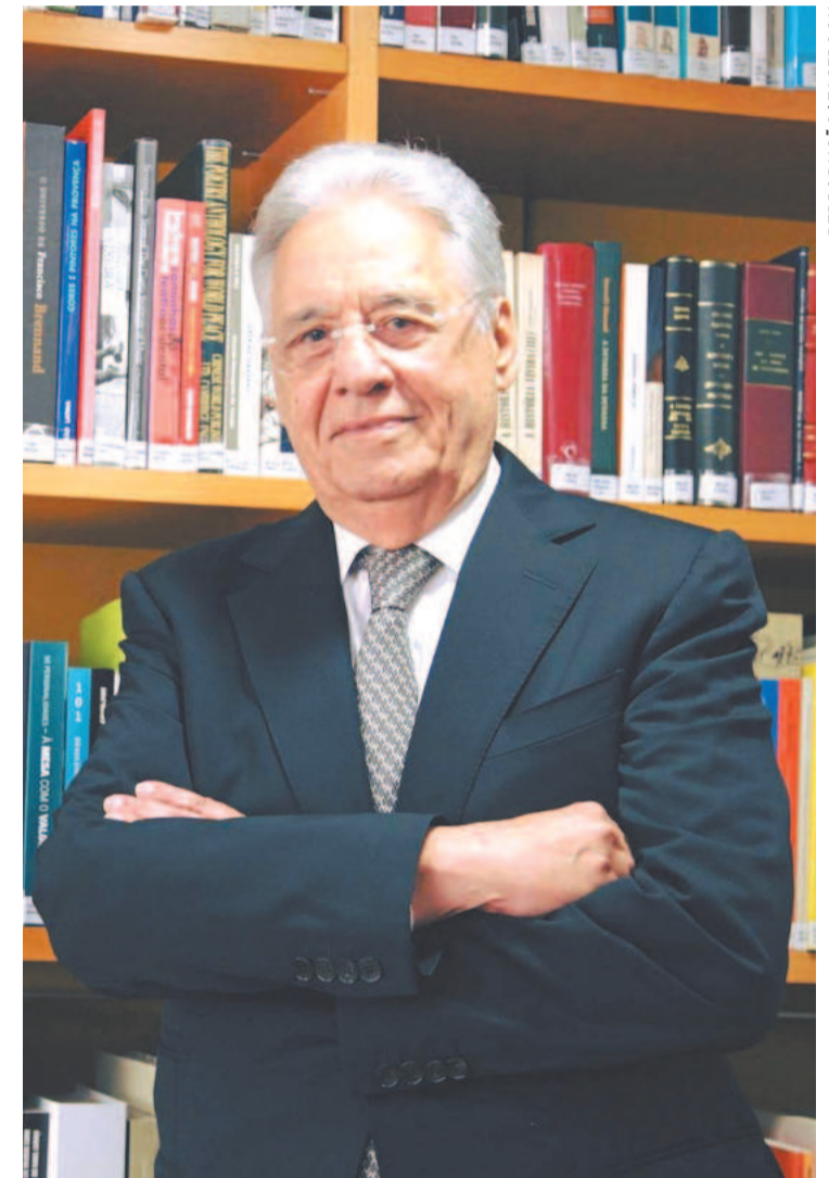
Oficialmente, o PSDB de FHC apoia Simone Tebet (MDB)

Em nota "pró-democracia", ex-presidente pediu que eleitores votem em quem tem "compromisso com o combate à pobreza e à desigualdade"