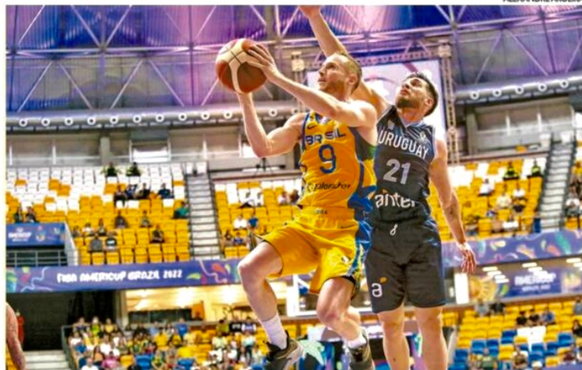
Brasileiros vencem Uruguai por 76x66, no Geraldão, e garantem primeiro lugar no Grupo A

A diferença de dez pontos caiu para três no início do segundo quarto. A virada brasileira parecia estar próxima, mas a reação foi arrefecida. Faltou força nos minutos deci-