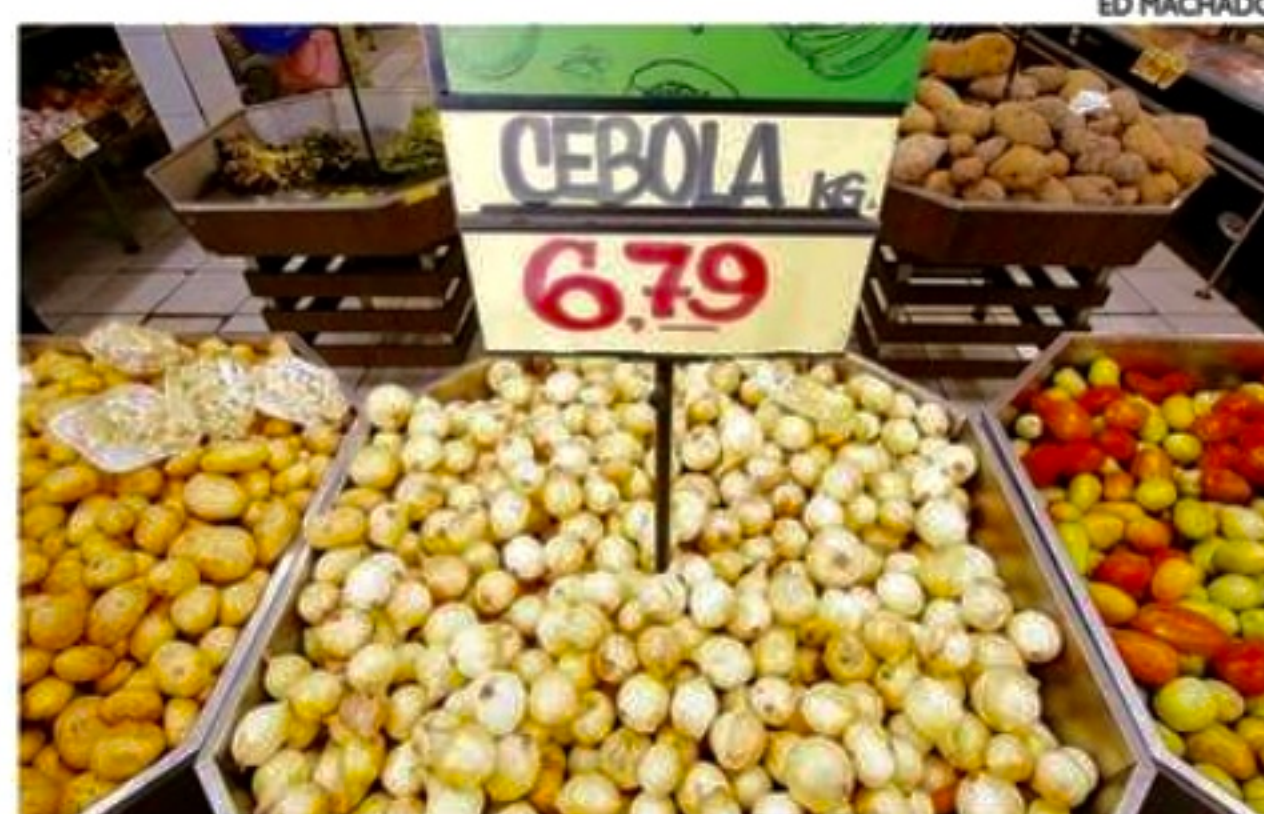
Números apontam queda da inflação, mas ainda longe da meta

Para o mercado financeiro, a expectativa é de que a Selic encerre o ano nesse patamar. Para o fim de 2023, a estimativa é de que a taxa básica caia para 11,25% ao