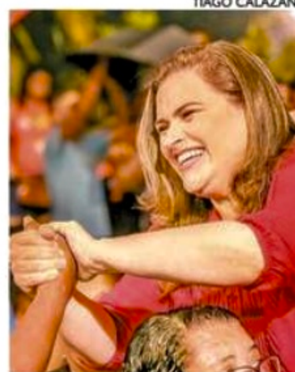
Marília apostou em promessas para criar o Programa Água