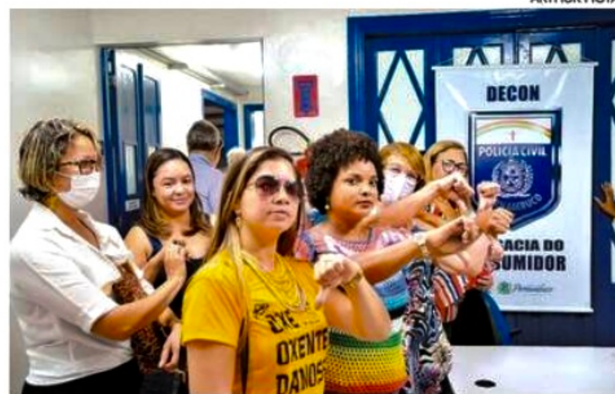
Vítimas compraram pacotes de viagem, mas não conseguiram embarcar

A reportagem da Folha de Pernambuco tentou entrar em contato com a responsável pela Jô Turismo