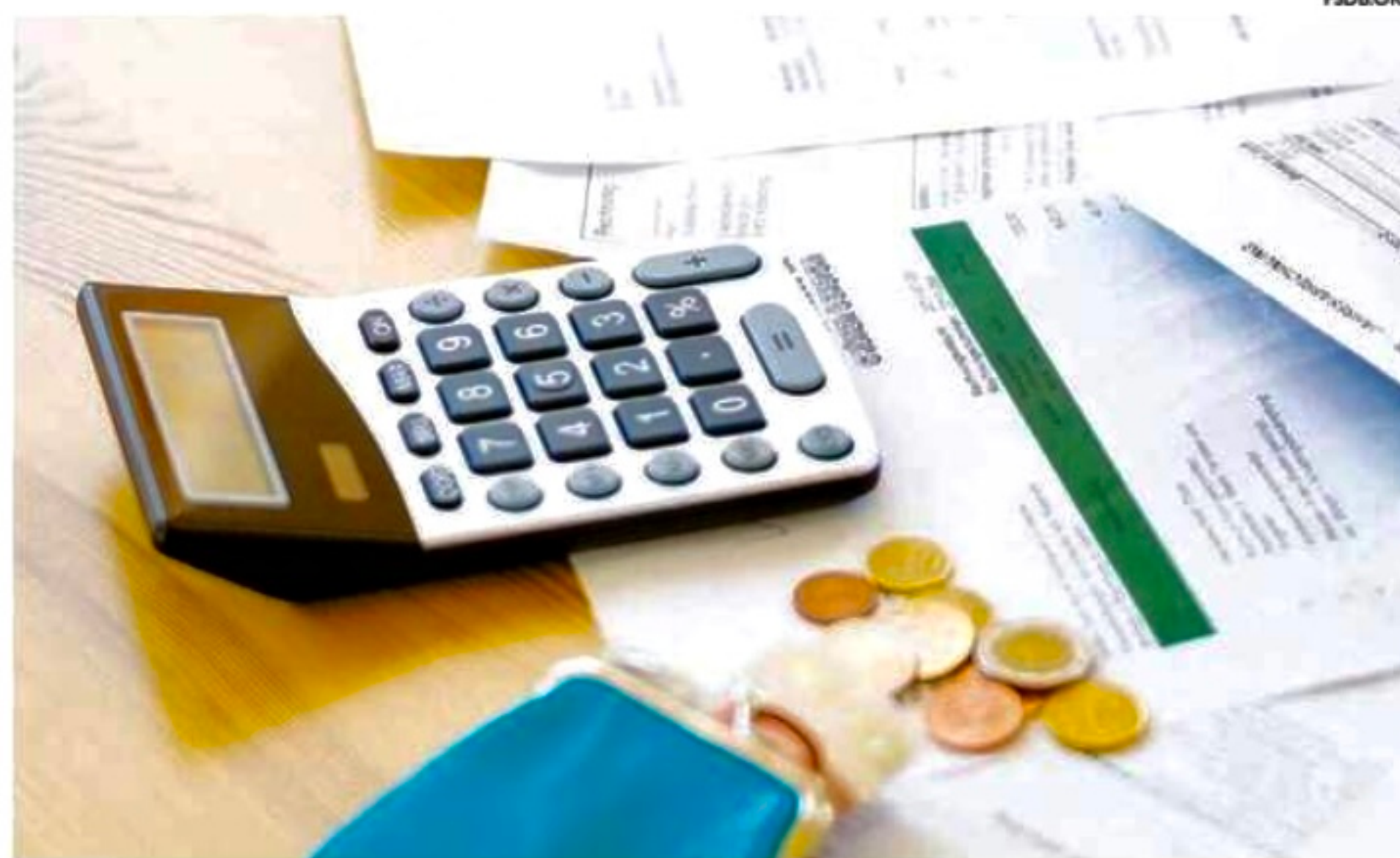
Preços dos alimentos impacta nas dívidas das famílias, e a inflação alta desafia o poder de compra

“A melhora no mercado de trabalho e as políticas de transferência de renda têm favorecido as famílias nas faixas mais baixas, mas a inflação em nível ainda elevado desafia o poder de compra desses consumidores. O crédito tem sido uma forma importante para eles sustentarem o consumo”, analisa Izis Ferreira.