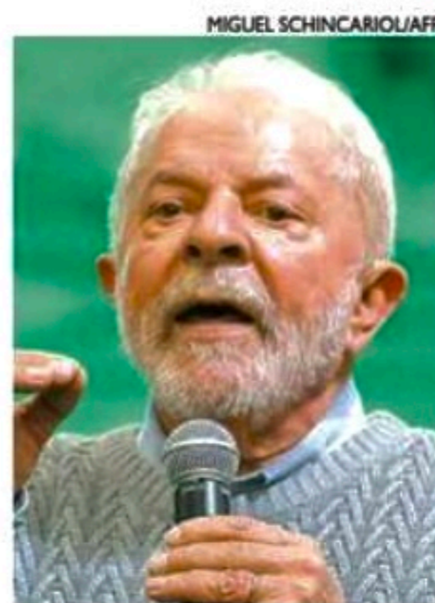
Lula se manteve em primeiro em mais uma rodada de pesquisa

O percentual dos que disseram que votariam em branco, anulariam ou não votariam em nenhum candidato foi 4% e dos que não sabiam, 2%. A margem de erro é de dois pontos percentuais para mais ou para menos.