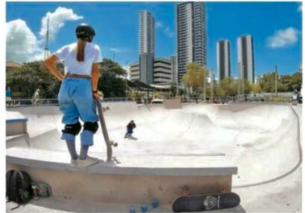
Pista onde será disputada a modalidade Park foi finalizada para o STU

Depois de passar por Criciúma (SC) e Porto Alegre (RS), o STU