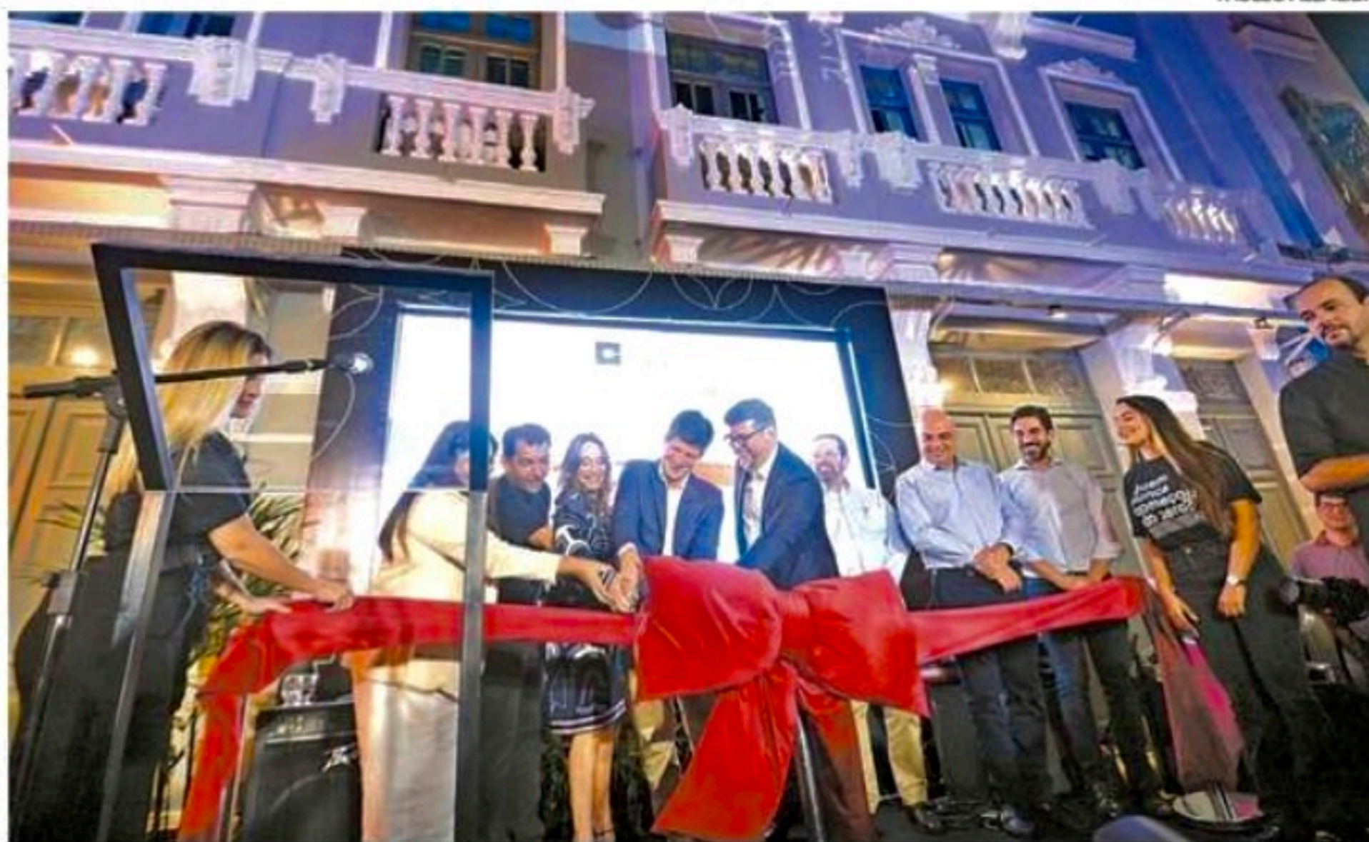
Ocorrida ontem, no Bairro do Recife, inauguração foi prestigiada por autoridades e empresários

“Não temos como nos organizar, superar, crescer, sem formar pessoas. A cidade é feita de pessoas e para elas. Temos dedicado tempo para isso. É o único caminho para