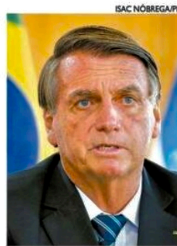
Bolsonaro aparece atrás de Lula em um eventual 2º turno

Em um cenário de segundo turno entre os dois candidatos com maiores percentuais de intenção de votos, Lula ficaria com 54% e Bolsonaro ficaria com 38%. O percentual de brancos e nulos ou nenhum no segundo turno seria de 7%; o dos que não sabem, 2%.