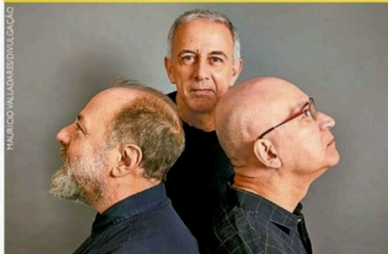
Banda toca os maiores sucessos, hoje, no Teatro Guararapes

Recife, sexta-feira, 23 de setembro de 2022 Ano XXV nº 222