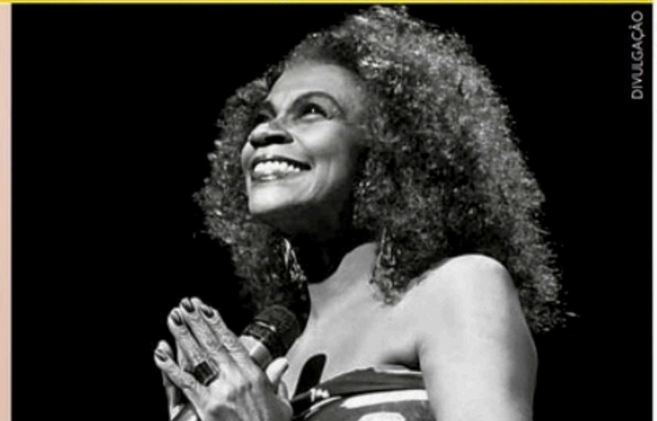
Cantora faz show, hoje, em Olinda, na II Feira do Afroempreendedorismo