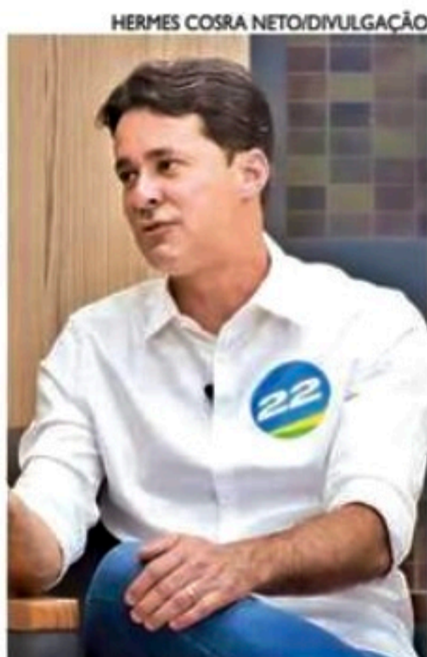
Anderson deu entrevista e reafirmou apoio a Bolsonaro