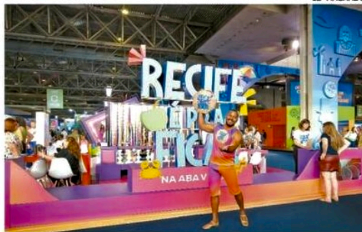
A Expo Abav, maior feira de turismo do Brasil, ocorre até hoje

Os novos voos do Recife anunciados pelas companhias aéreas recentemente, além do reforço das malhas aéreas para a alta temporada do verão, vão ampliar a ida dos visitantes para Porto de Galinhas, em Ipojuca, na Região Metropolitana do Recife. Segundo a associação Porto de Galinhas Convention & Visitors Bureau, a estimativa de ocupação hoteleira para o réveillon de 2023 é de quase 100%. Para janeiro, mês de férias e de sol, a ocupação está prevista em 87%, mas pode alcançar maiores números. "As ocupações já estão boas em