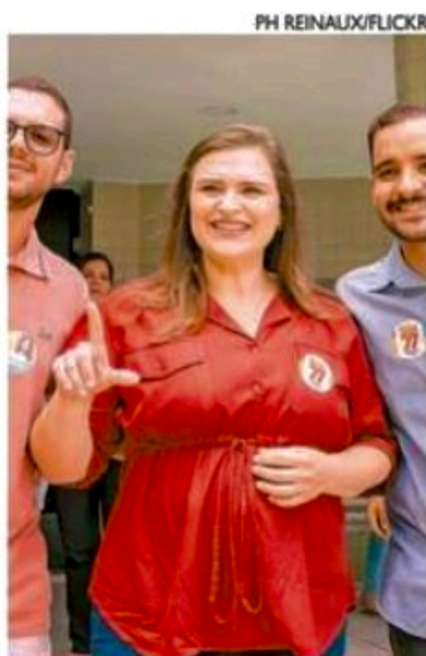
Marília visitou Casa do Estudante de Pernambuco pela manhã