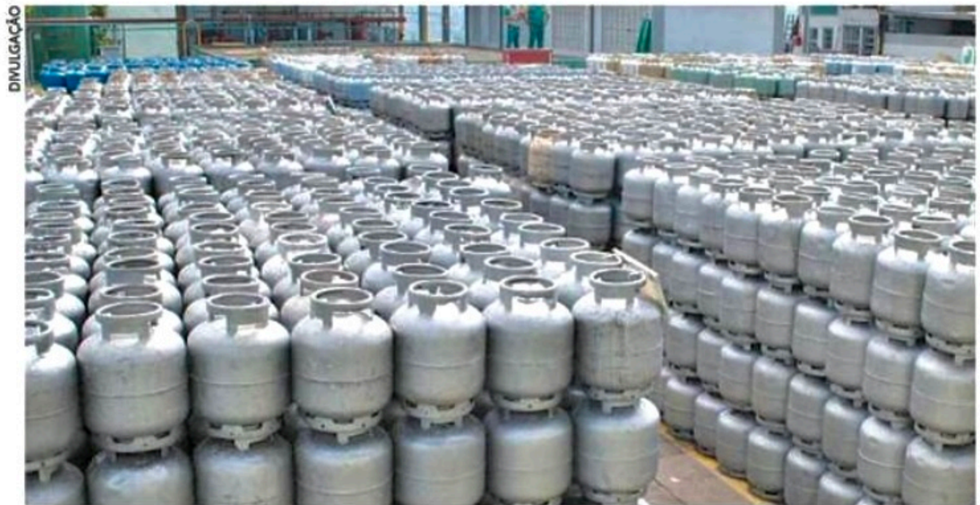
Corte nos preços é o terceiro registrado em 2022 nas refinarias, mas no varejo o produto continua em alta

Na segunda-feira passada, a estatal já havia anunciado uma redução do GLP. Na ocasião, a estatal anunciou queda para as distribuidoras de R$ 4,23 por quilo (kg) para R$ 4,03/kg. Foi um recuo de