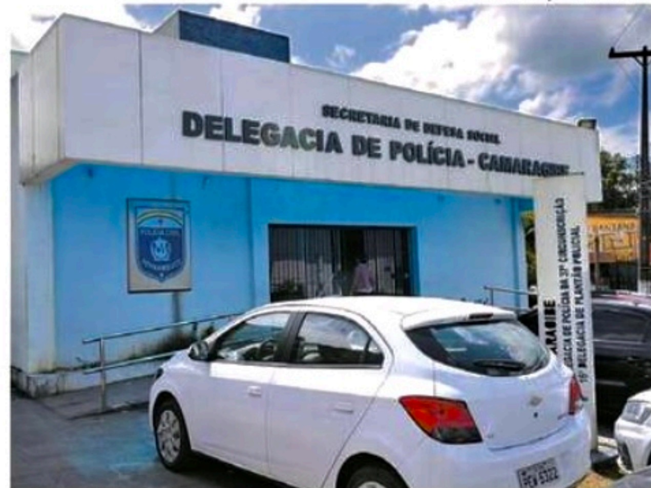
Polícia segue em busca de criminoso, que também cometeu roubo