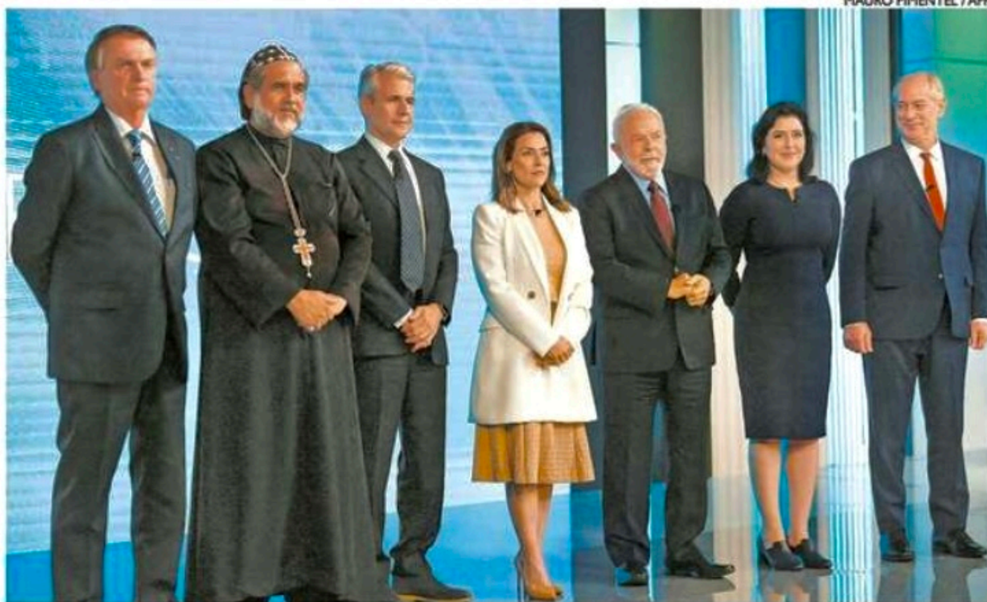
Bolsonaro, Kelmon, Felipe, Soraya, Lula, Simone e Ciro: debate polêmico, mas esvaziado de propostas

Já Bolsonaro usou seu direito de resposta para se defender de acusações de Lula sobre atraso na compra de vacinas, sigilo de 100 anos sobre alguns documentos e também das denúncias de corrupção, e negou todas as situações. Segundo ele, nenhum país comprou vacinas em 2020. Quando teve a oportunidade de perguntar diretamente a Lula, por ter aberto a rodada, Bolsonaro preferiu indagar Felipe D'Ávila sobre o risco de um governo de esquerda para a economia. Bolsonaro também chegou a usar um direito de resposta contra uma acu-