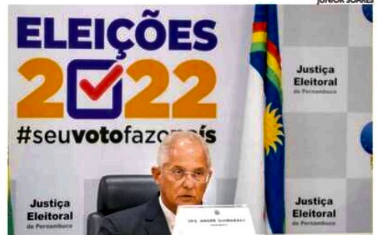
Presidente do Tribunal: atentos e unidos para eleições tranquilas

Estão previstas a articulação de ações de cooperação para prevenir e reprimir condutas ilícitas que causem perturbação ao processo eleitoral. Essas condutas incluem, atos que "atentem contra a legitimidade e a integridade do exercício do direito público de votar e ser votado, atos de violência que atentem contra a integridade dos magistrados, servidores da justiça eleitoral e demais participantes do pleito eleitoral e a liberdade de expressão".