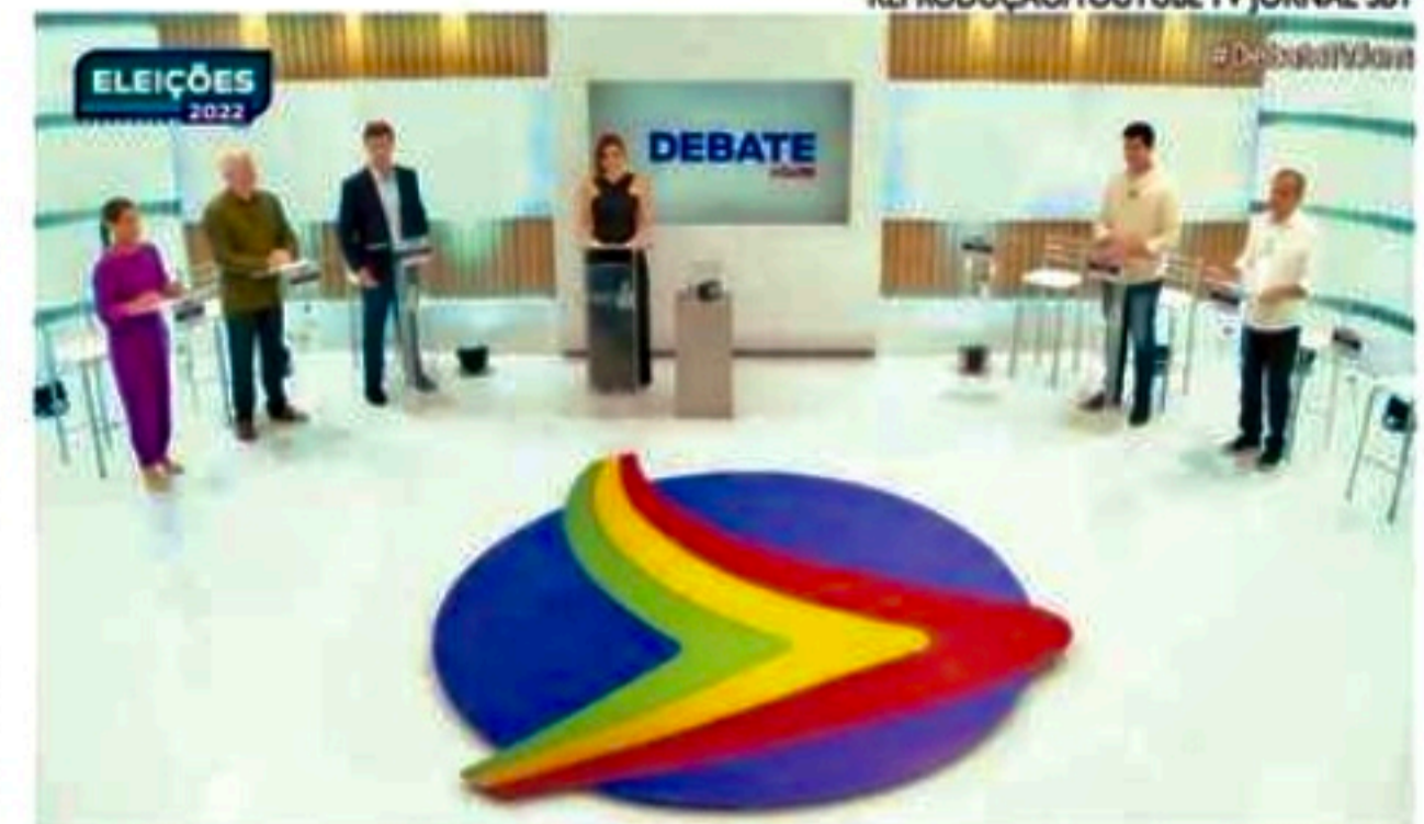
Debatedores voltaram a trocar acusações e repetiram propostas

Raquel perguntou a Danilo como ele vai fazer diferente sendo o candidato do Governo. "Paulo Câmara deixou um legado importante para Pernambuco, mesmo em meio à crise econômica, à pandemia e ao maior inimigo da história política do Estado, o presidente Bolsonaro",