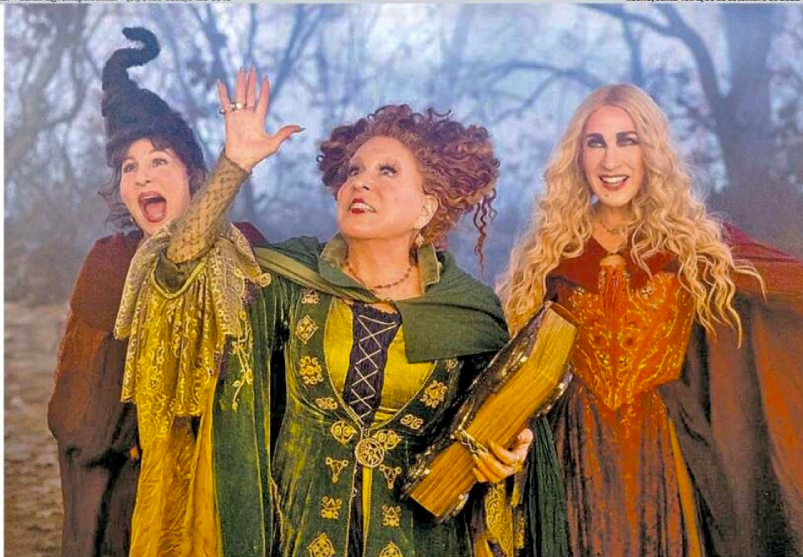
No primeiro enredo, as feiticeiras foram derrotadas por um grupo de crianças e agora têm nova oportunidade de se vingar

É óbvio que reflexões sobre os papéis de gênero não poderiam faltar no roteiro, afinal seria possível fazer um filme sobre bruxas, em 2022, sem questionar as imposições