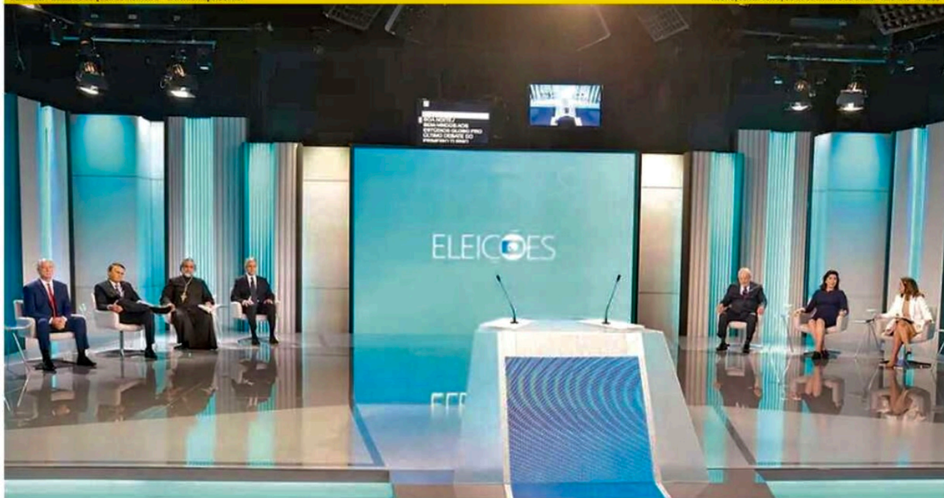
Ciro (PDT), Bolsonaro (PL), Padre Kelmon (PTB), d'Ávila (Novo), Lula (PT), Tebet (MDB) e Soraya (União Brasil) participaram de debate na Rede Globo

Recife, sexta-feira, 30 de setembro de 2022 Ano XXV nº 228