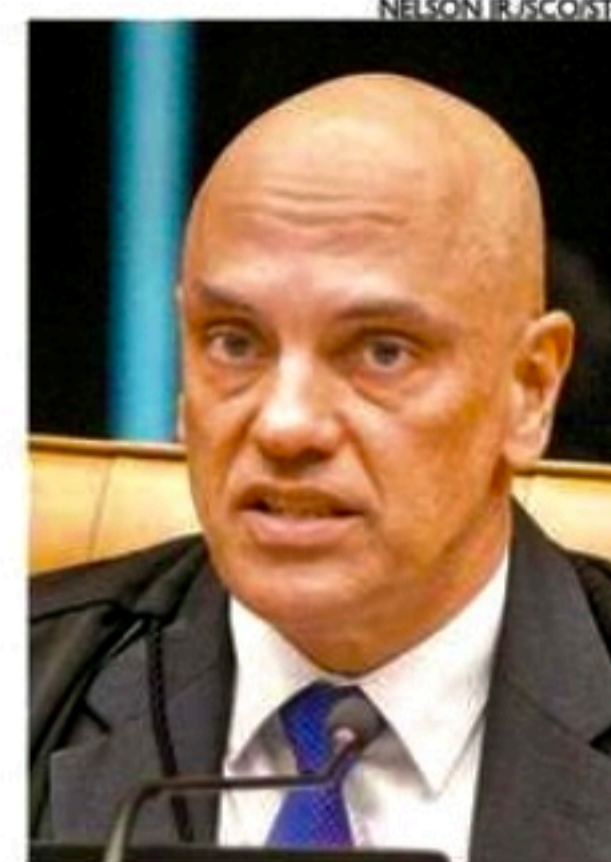
Ministro acredita que abstenção será baixa neste primeiro turno

O presidente do Tribunal Superior Eleitoral (TSE), ministro Alexandre de Moraes, garantiu ontem que os eleitores terão “segurança e liberdade” para votar no domingo.