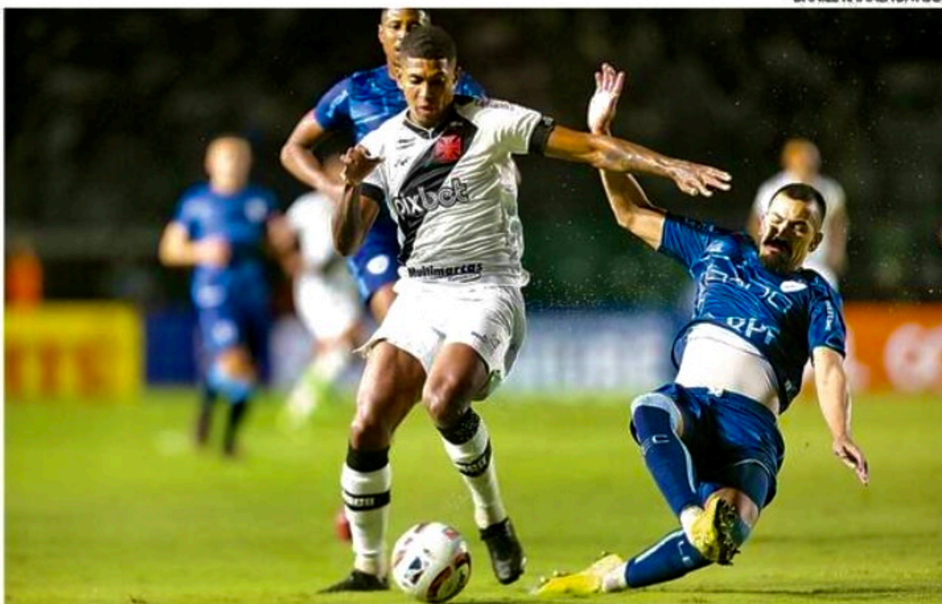
Vasco tropeça em São Januário, mantém 4ª posição, mas vê concorrentes se aproximarem

■ Partida foi confronto direto pelo acesso à Série A e interessou ao Rubro-negro, que agora fica a apenas três pontos do G4