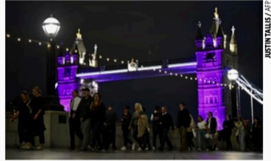
ELIZABETH II Fila de 8 quilômetros antecede cerimônia privada