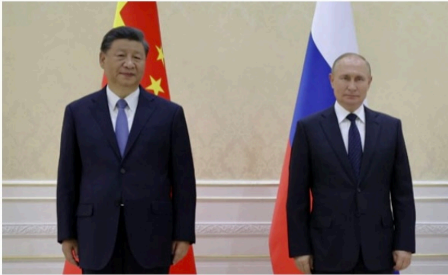
XI JINPING E PUTIN Esta é a primeira reunião entre os líderes desde os jogos de inverno, realizados em Pequim

E para os dois, o encontro de cúpula é uma oportunidade para desafiar o Ocidente, em