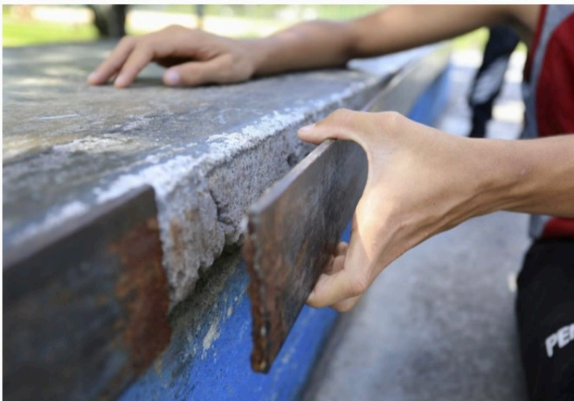
PARQUE SANTANA Espaço está com estruturas de cimento desgastadas, placas de ferro soltas e rachaduras significativas