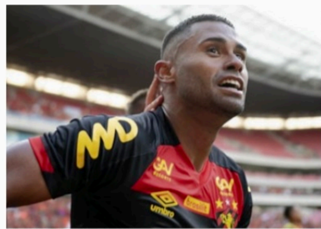
CONTESTADO Atacante tem cinco gols em 23 jogos na Série B