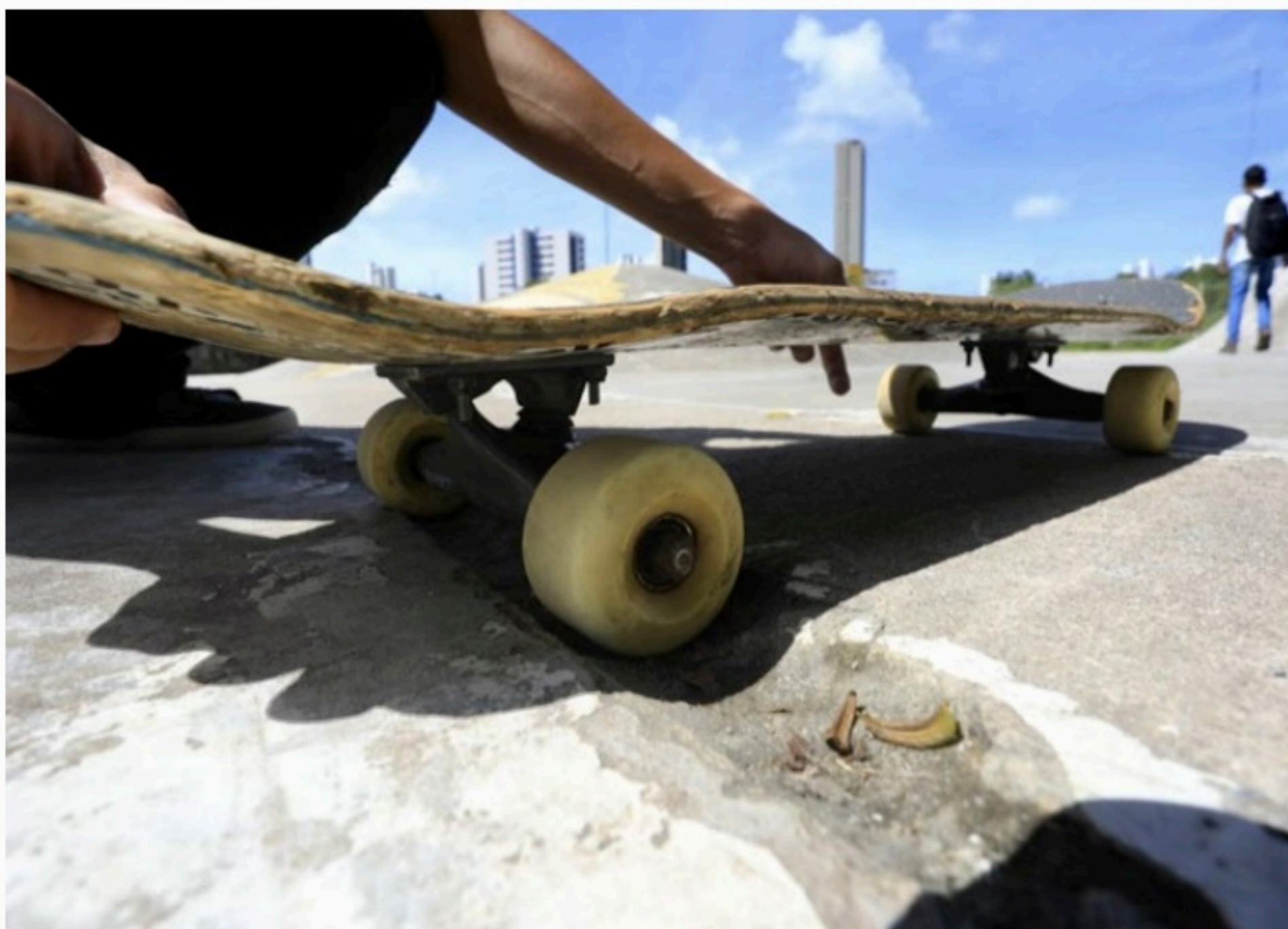
PERIGO Em alguns locais, acidentes são comuns porque as especificações não estão corretas e por conta do desgaste do tempo