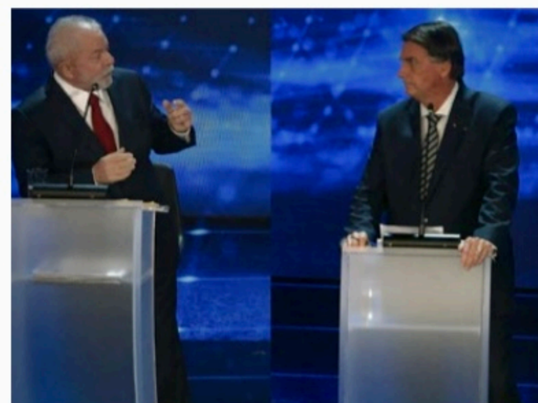
PANORAMA Lula tem 45% das intenções de voto, e Bolsonaro, 33%

Pesquisa anterior apontou níveis semelhantes: Bolsonaro oscilou 2 pontos para cima, saindo de 51% para 53%, e Lula oscilou 1 ponto para baixo, de 39% para 38%.