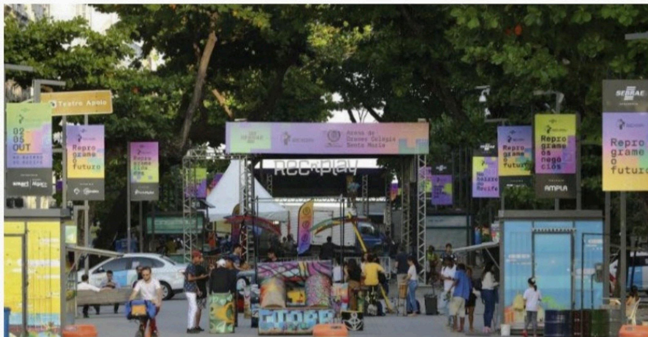
PROGRAMAÇÃO 'Carnaval do conhecimento' será realizado no mês de novembro e espera superar a marca de 60 mil pessoas no evento em 2022

O anúncio da quarta edição, em 2022, foi feito nessa quinta-feira (15). A expectativa de público é superar as 60 mil pessoas, em mais de 500 atividades distribuídas em 23 prédios, além de ruas e praças dos bairros do Recife e Santo Antônio.