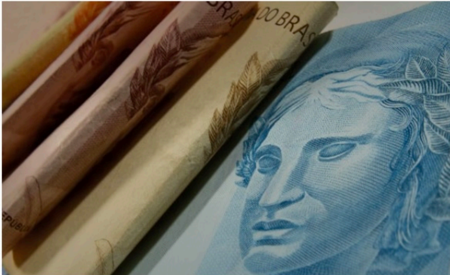
ECONOMIA Estimativa para o aumento do PIB foi de 2% para 2,7%, em relação ao boletim de julho

No primeiro semestre, o indicador acumula alta de 2,5%. Em 2021, o PIB do Brasil cresceu 4,6%, totalizando R$ 8,7