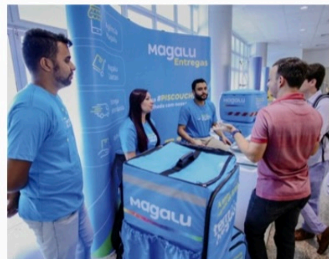
Caravana acontece no dia 21 de setembro, às 13h, no Classic Hall, em Olinda

Uma equipe do Sebrae e da Associação Comercial também estarão na carreta pa-