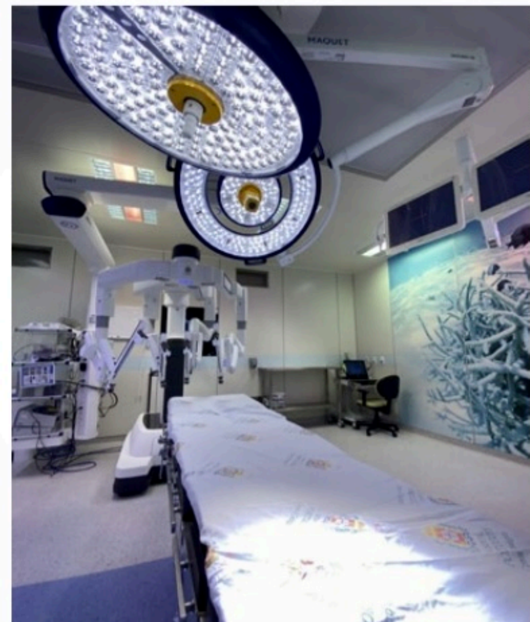
MODERNO RHP investe em tecnologia, como a compra do robô Da Vinci Xi

no Estado e, ao longo da crise sanitária, chegou a destinar 50 leitos de terapia intensiva (UTI) para esses pacientes.