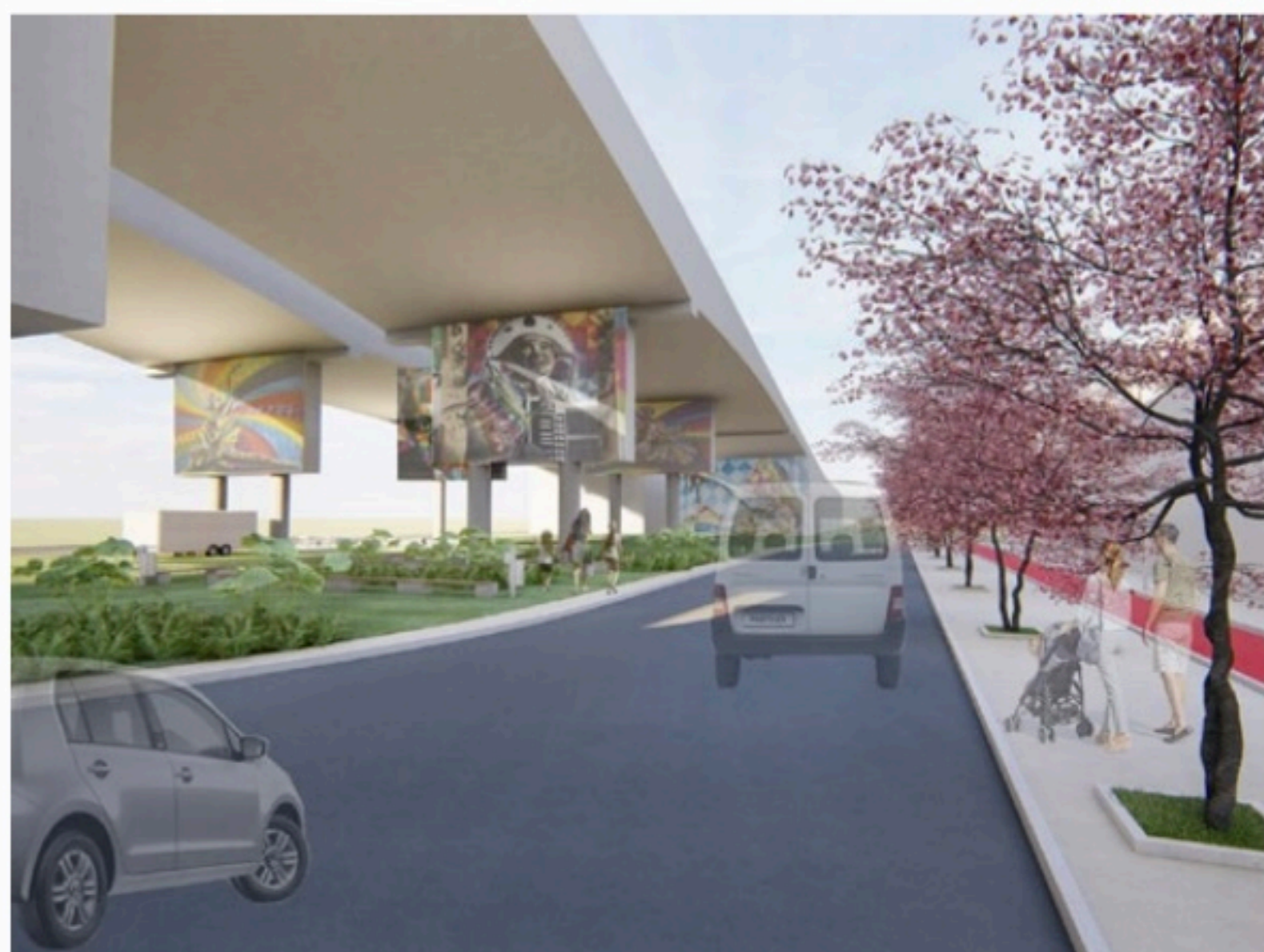
CONCEITO A reforma da PE-15 é uma tentativa de transformá-la em uma rodovia um pouco mais humanizada