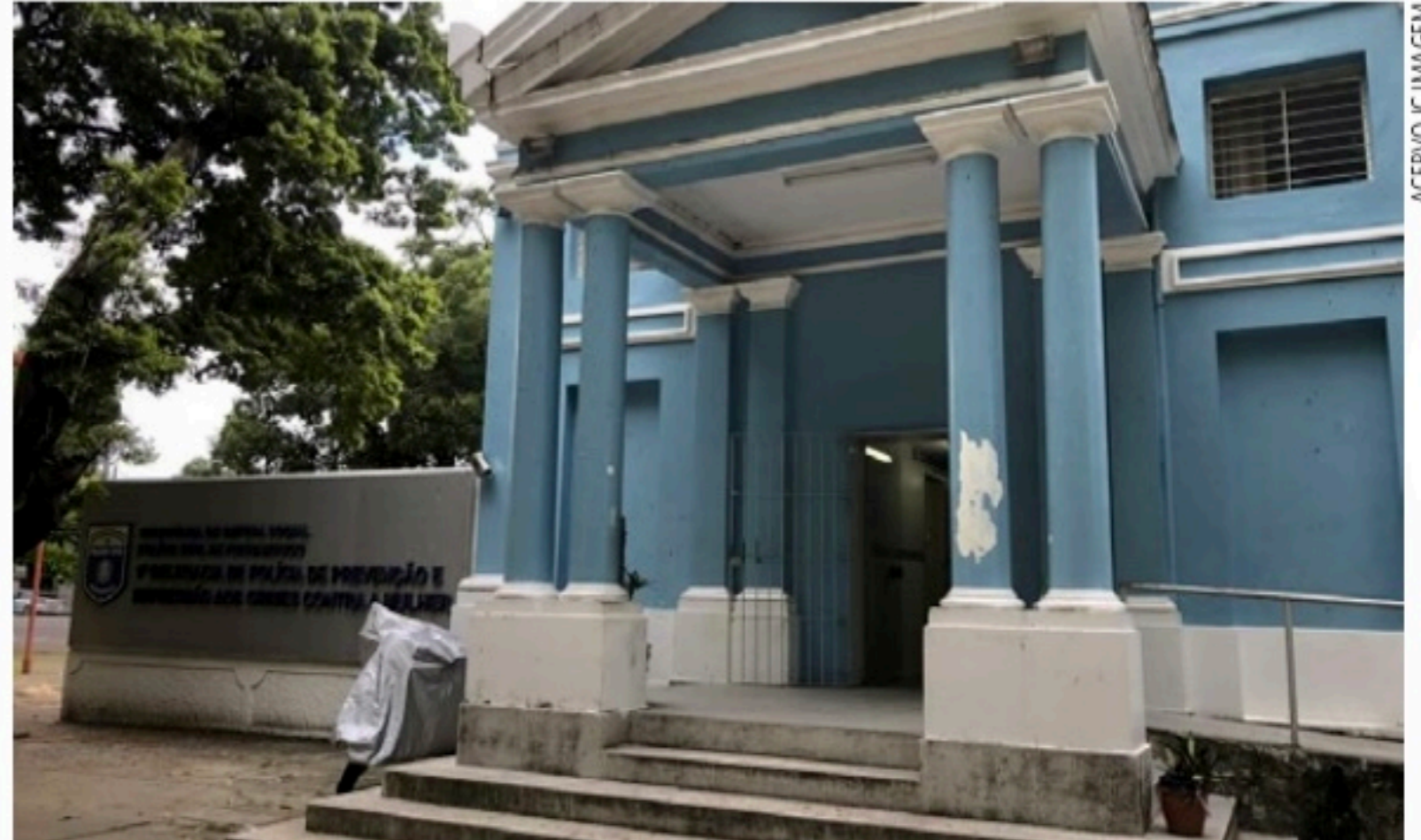
VIOLÊNCIA DE GÊNERO Entre agosto de 2021 e 2022, houve alta de 3,3% na quantidade de mulheres agredidas

Ele pontuou que não comemora os números, mas que está confiante de que, pelas projeções, de chegar ao fim do ano com uma sequência de resultados importantes. "Ressalte-se, ainda, que estamos mantendo a política de ingresso permanente de efetivo nas forças de segurança, com o lançamento, neste segundo semestre, de editais para contratação de mais de 4.700 profissionais para as polícias Militar, Civil, Científica e Corpo de Bombeiros", garantiu.