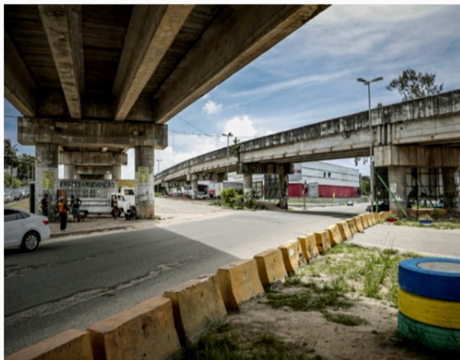
CARA NOVA Dos 24km de rodovias requalificadas, 13,5km serão na PE-15, por onde passam 50 mil veículos por dia

Os recursos são do Plano Retomada, principal aposta do governo para recuperar a infraestrutura de todo o Estado, que já teve investimentos superiores a R$ 2 bilhões. Os serviços serão coordenados pela Secretaria de Infraestrutura e Recursos Hídricos (Seinfra) e executados pelo Departamento de Estradas de Rodagem (DER).