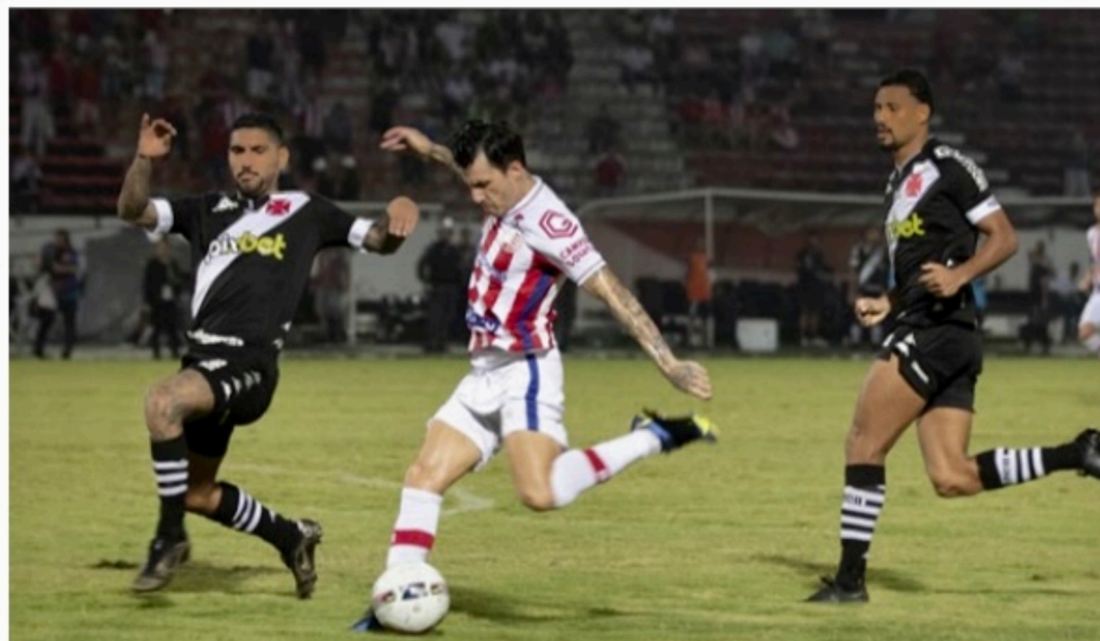
SURPRESA Alvirrubros esperam engatar a terceira vitória consecutiva para deixarem a lanterna da Série B