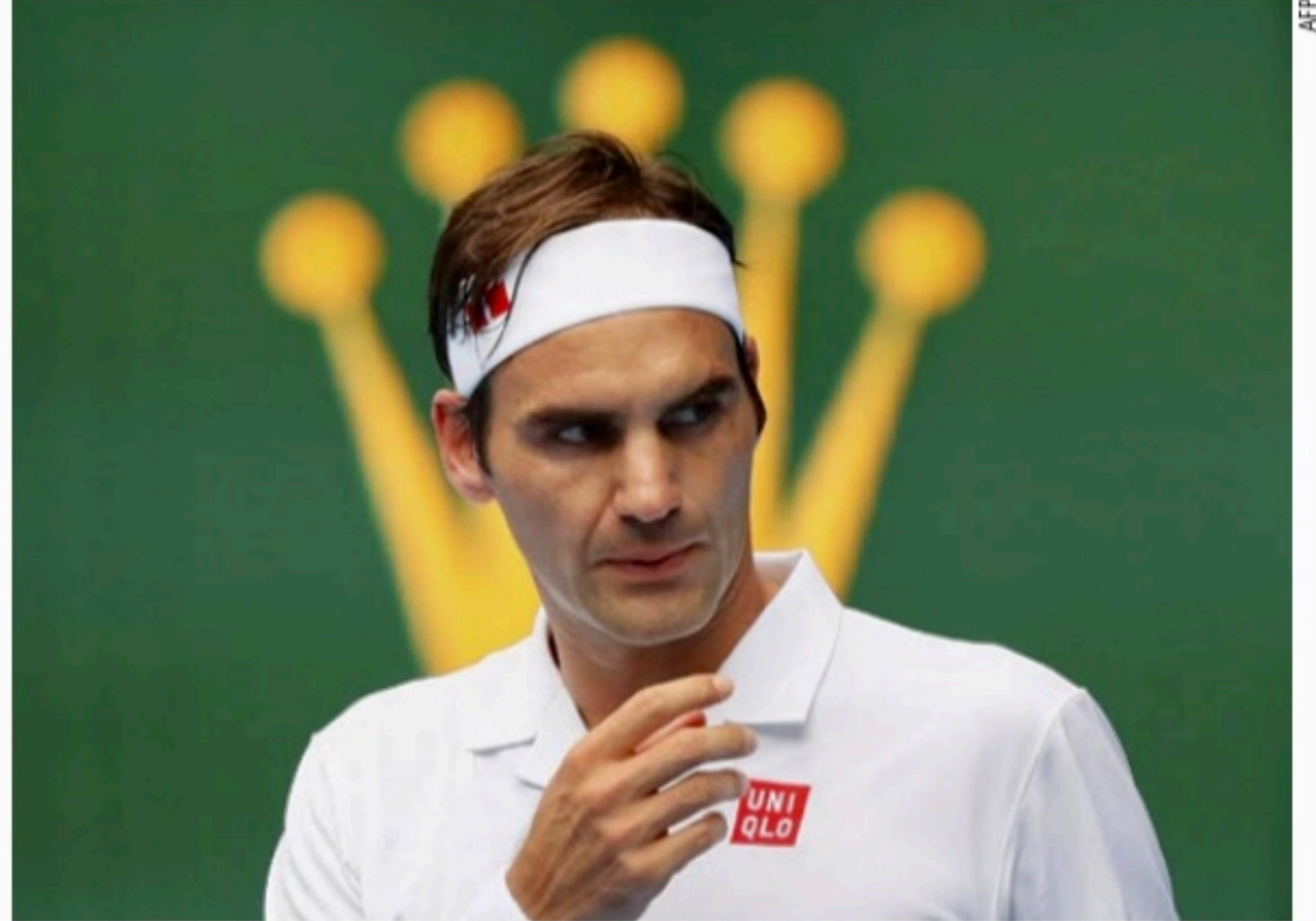
LENDA Considerado por muitos como o maior tenista da história, Federer jogou mais de 1.500 partidas

A última partida oficial do tenista aconteceu em 7 de julho do ano passado, quando foi eliminado nas quartas de final de Wimbledon pelo surpreendente polonês Hubert Hurkacz, então número 18 do mundo. Desde então, o suíço tem dado entrevistas falando mais sobre cirurgias e possível aposentadoria do que