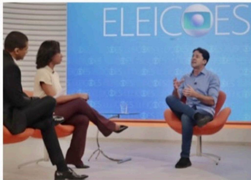
SABATINA Ex-prefeito de Jaboatão foi entrevistado pela TV Globo

"Ninguém sabe ao certo o que vai poder ser feito a par-