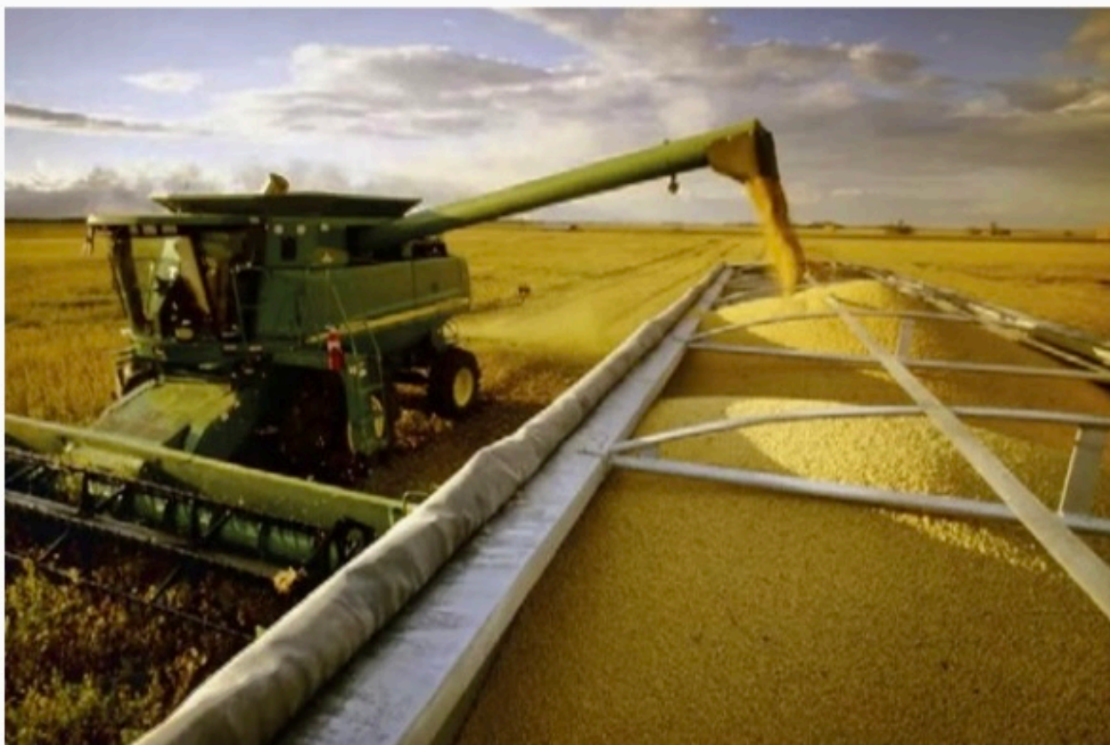
PRODUÇÃO Soja representou 134,9 milhões de toneladas, 10,8% mais que em 2020, com R$ 341,7 bilhões em valor

A produção de cereais, leguminosas e oleaginosas alcançou 254,4 milhões de