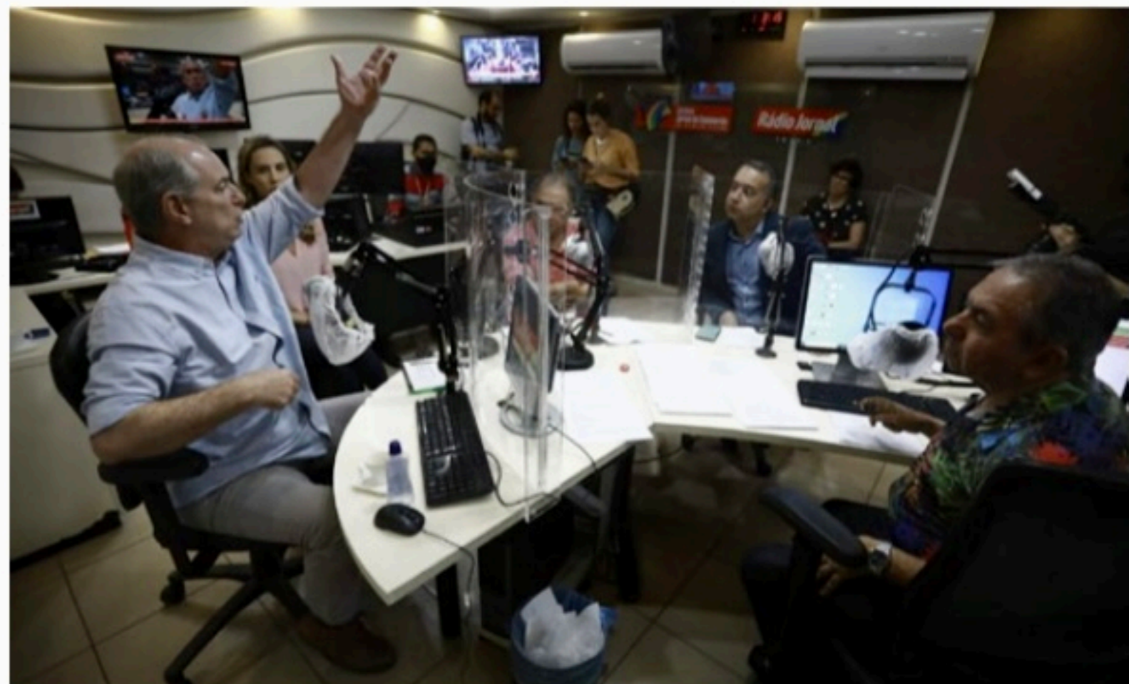
RÁDIO JORNAL Postulante ao Planalto esteve no estúdio para participar do programa Passando a Limpo

O pedetista também se comprometeu com instauração de imposto sobre lucros e dividendos empresariais. "O mundo inteiro cobra e eu cobrei quando