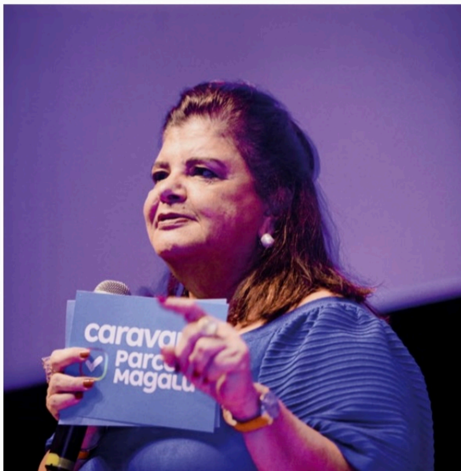
Luiza Helena Trajano, presidente do conselho do Magalu, é presença confirmada na Caravana

O evento funciona como uma grande feira do empreendedor, totalmente gratuita, onde o visitante poderá se informar sobre como ingressar no comércio eletrônico, até como anunciar e entregar seu produto em todo o país. Os inscritos também poderão assistir à palestra de Luiza Helena Trajano.