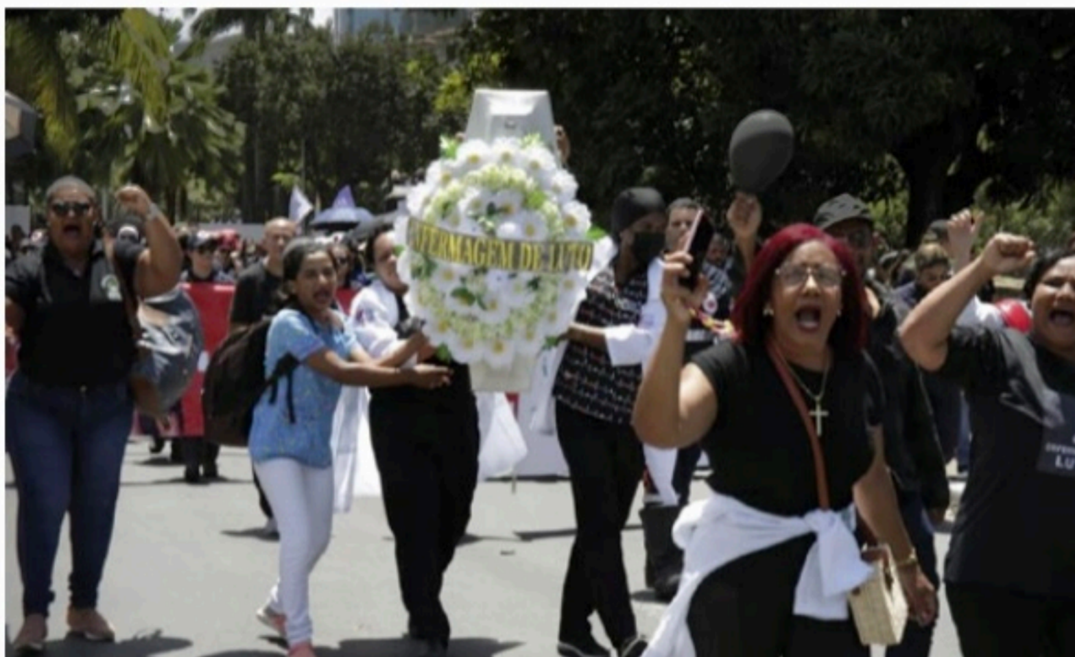
ESTRATÉGIA Presidente do Senado diz que fará reuniões para encontrar forma de custear o piso da enfermagem

Ainda não é possível, contudo, vislumbrar qual deve