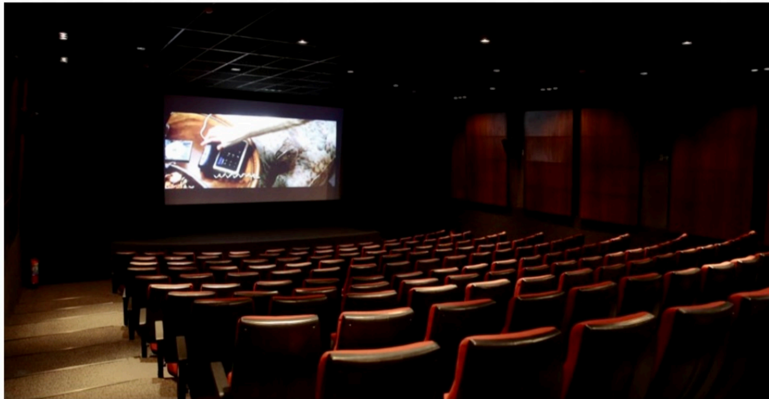
PANORAMA Ir ao cinema foi um dos hábitos que sofreu maior queda de frequência entre os brasileiros quanto a atividades de cultura e lazer, aponta pesquisa do Datafolha com o Itaú Cultural

“Com esta campanha queremos celebrar a volta do público e demo-