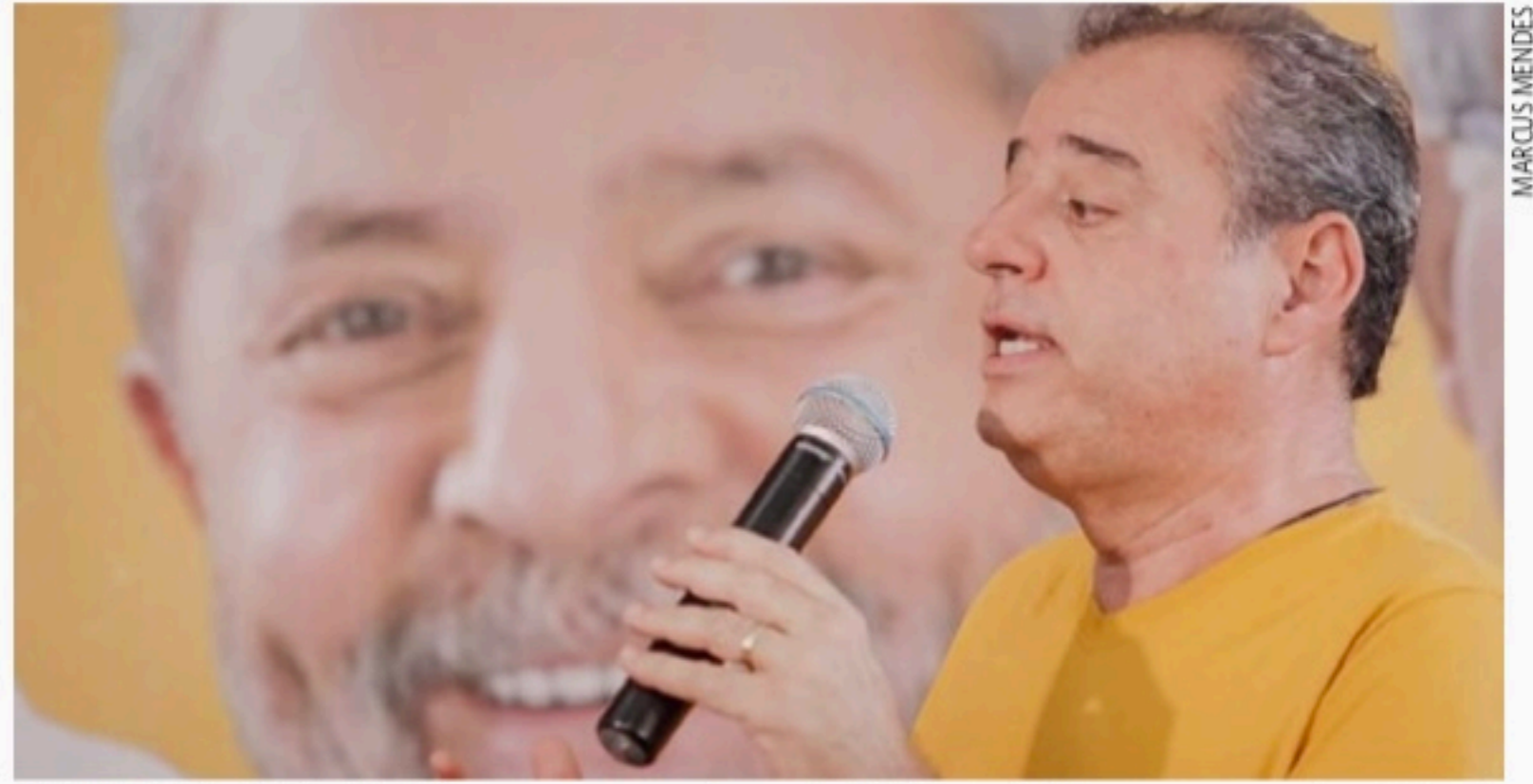
FINANÇAS Candidato do PSB ao governo recebeu mais de R$ 12 milhões para campanha eleitoral