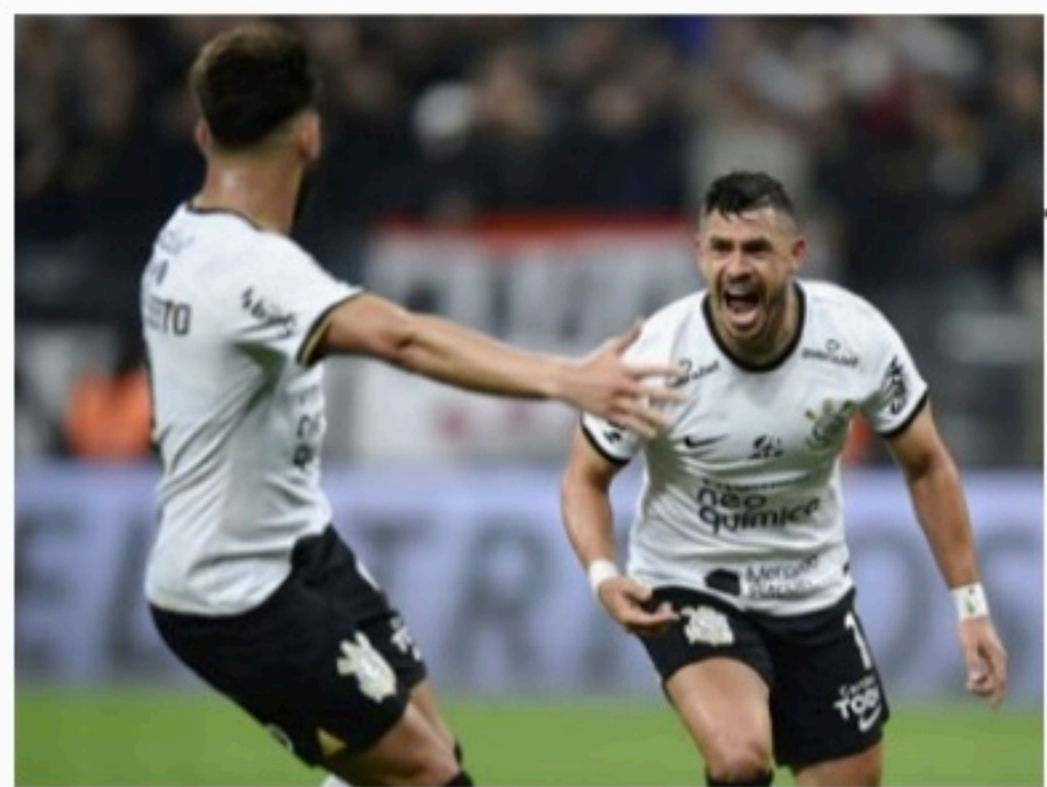
EFICIENTE Timão bate Fluminense e decide competição contra o Flamengo

Concentrado e organizado, o time anfitrião errou menos do que o Fluminense, que teve a saída de bola travada. Mesmo assim, a