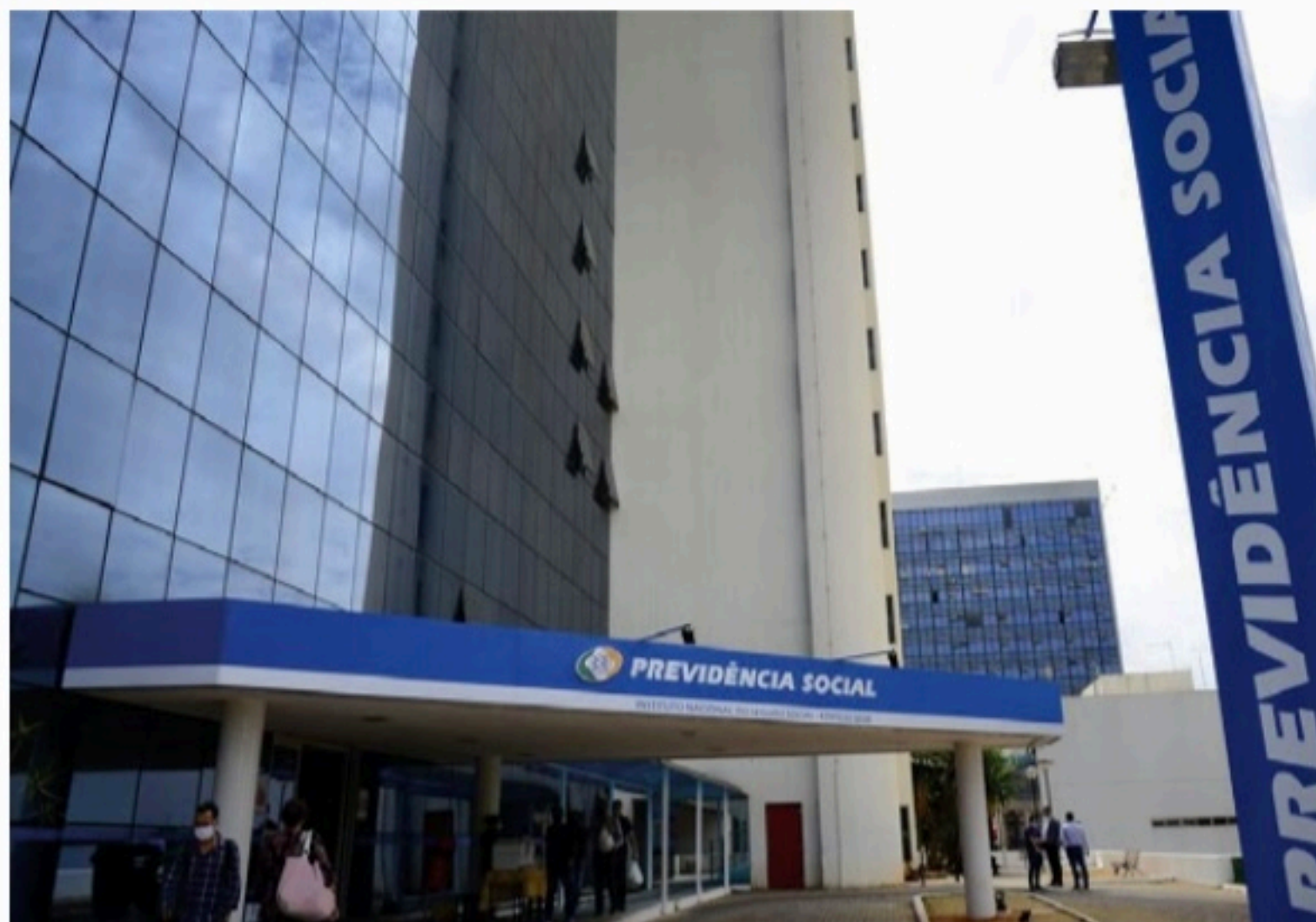
PREVIDÊNCIA Remuneração bruta inicial é de R$ 5.905,79. Taxa para realização da prova, em novembro, é de R$ 85

Do total de vagas oferecidas, 5% (90) são destinadas a pessoas com deficiência e 20% (202) para pessoas negras. O valor da taxa de inscrição é R$ 85, a ser pago até o dia 21 de outubro.