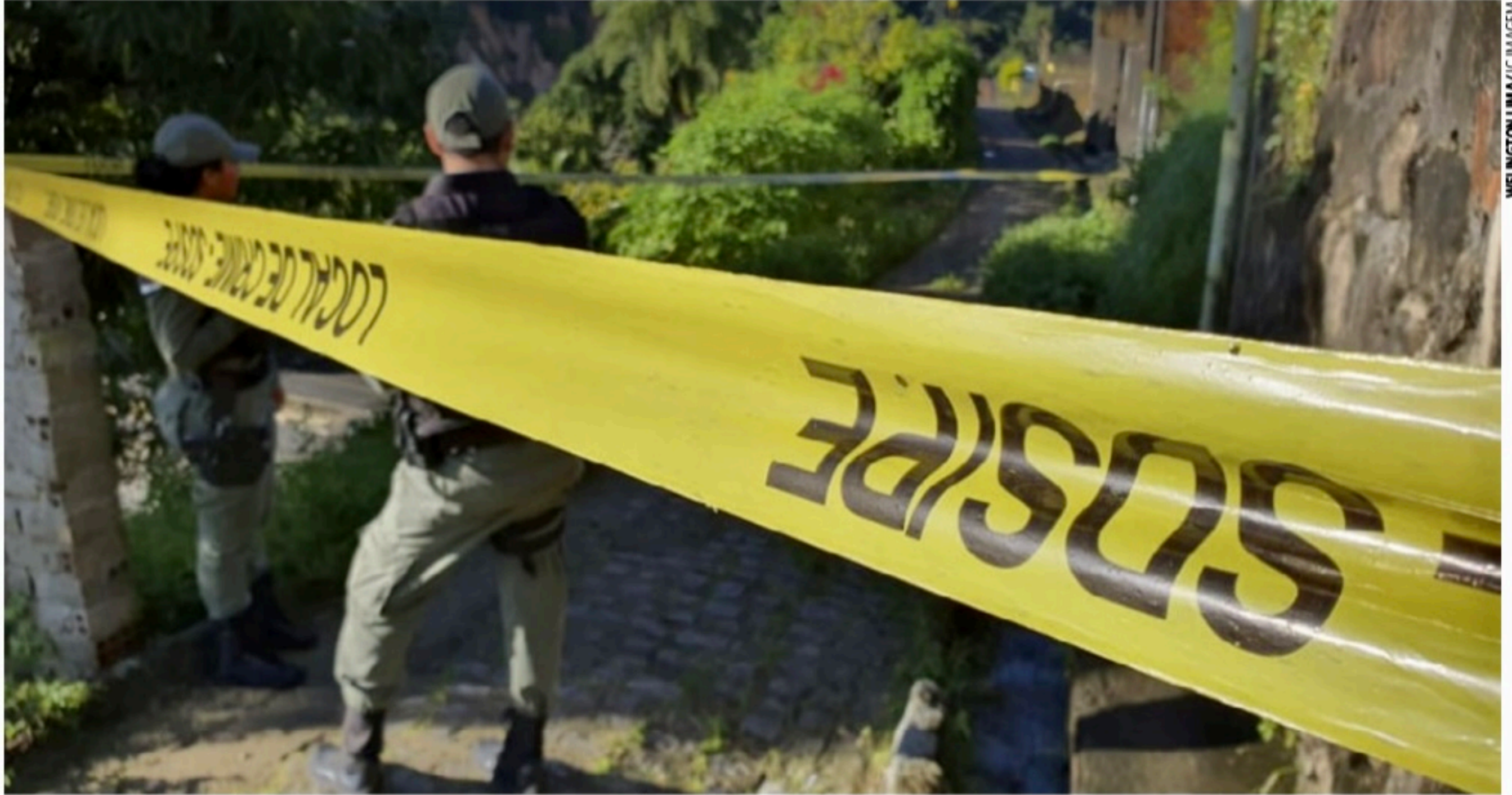
HOMICÍDIOS Mesmo com redução de 23,4% em agosto com relação ao mesmo mês de 2021, Pernambuco ainda acumula 4% de aumento em 2022; Pacto pela Vida prevê redução anual de 12%

Pernambuco ainda teve redução de 23,4% no número