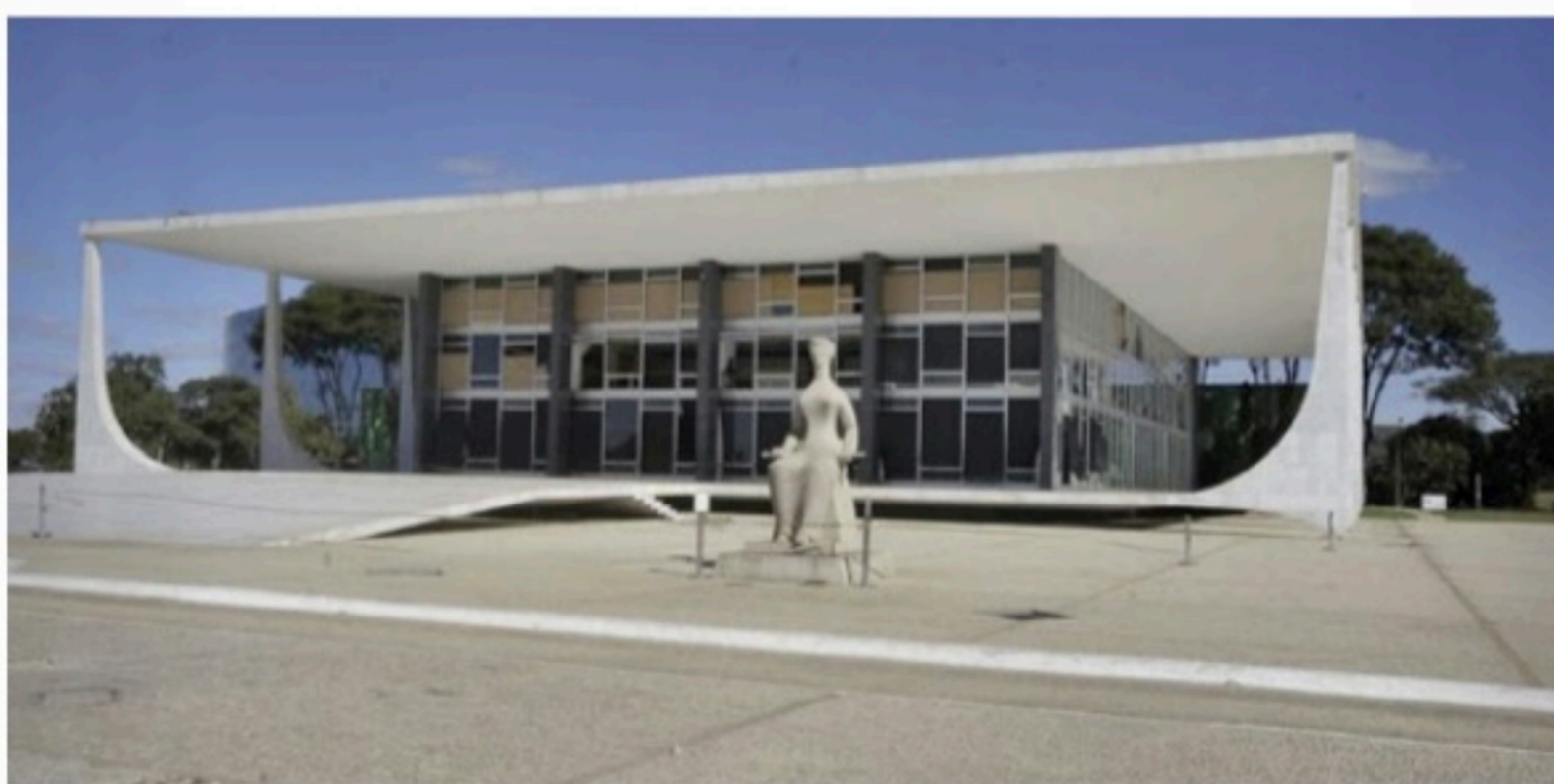
PRAZO Julgamento no plenário virtual sobre o piso da enfermagem termina nesta sexta; placar está em 7x3

Os ministros Nunes Marques, André Mendonça e Edson Fachin foram a favor da derrubada da liminar que suspende o piso