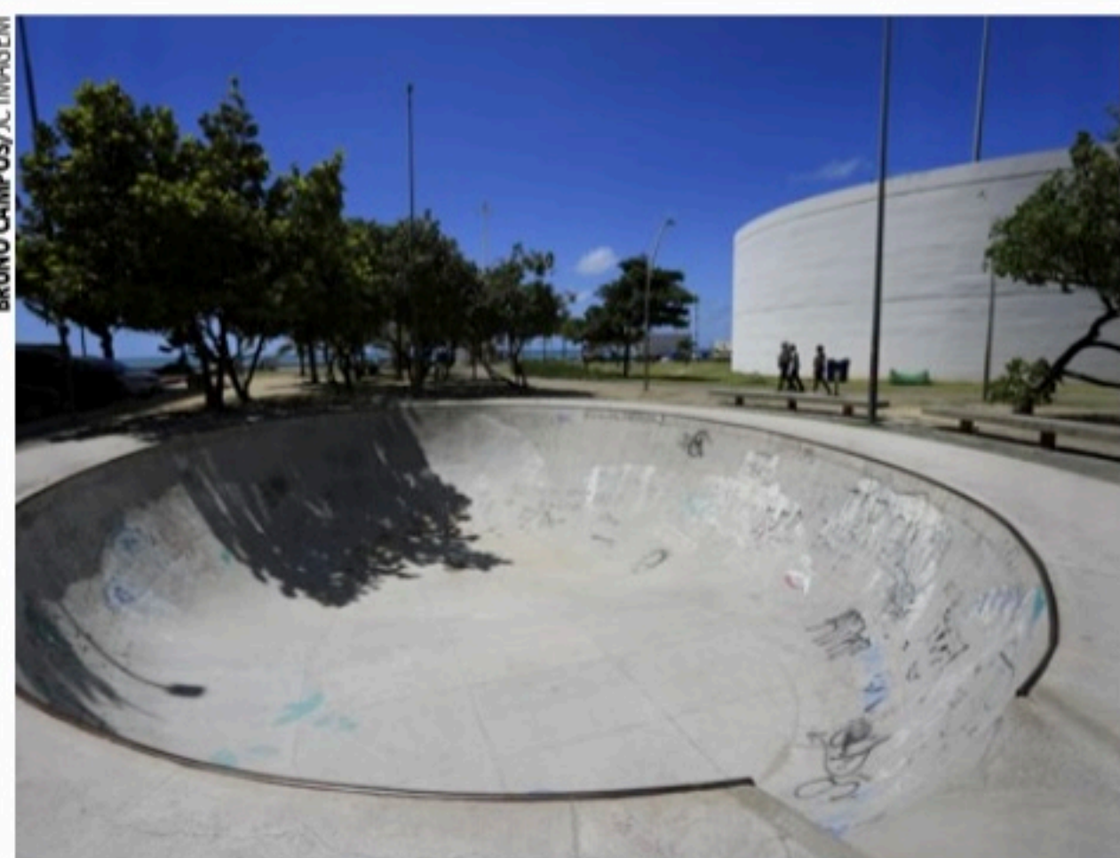
DONA LINDU Segundo usuários, bow foi construído sem orientação de especialistas