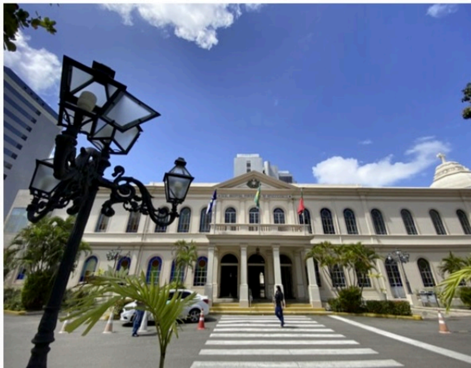
HISTÓRICO O título de “Real” ao nome do hospital foi conferido pelo rei português dom Carlos I, em 1907

um leito individual, onde recebe a assistência e conta com a presença do acompanhante o tempo todo.