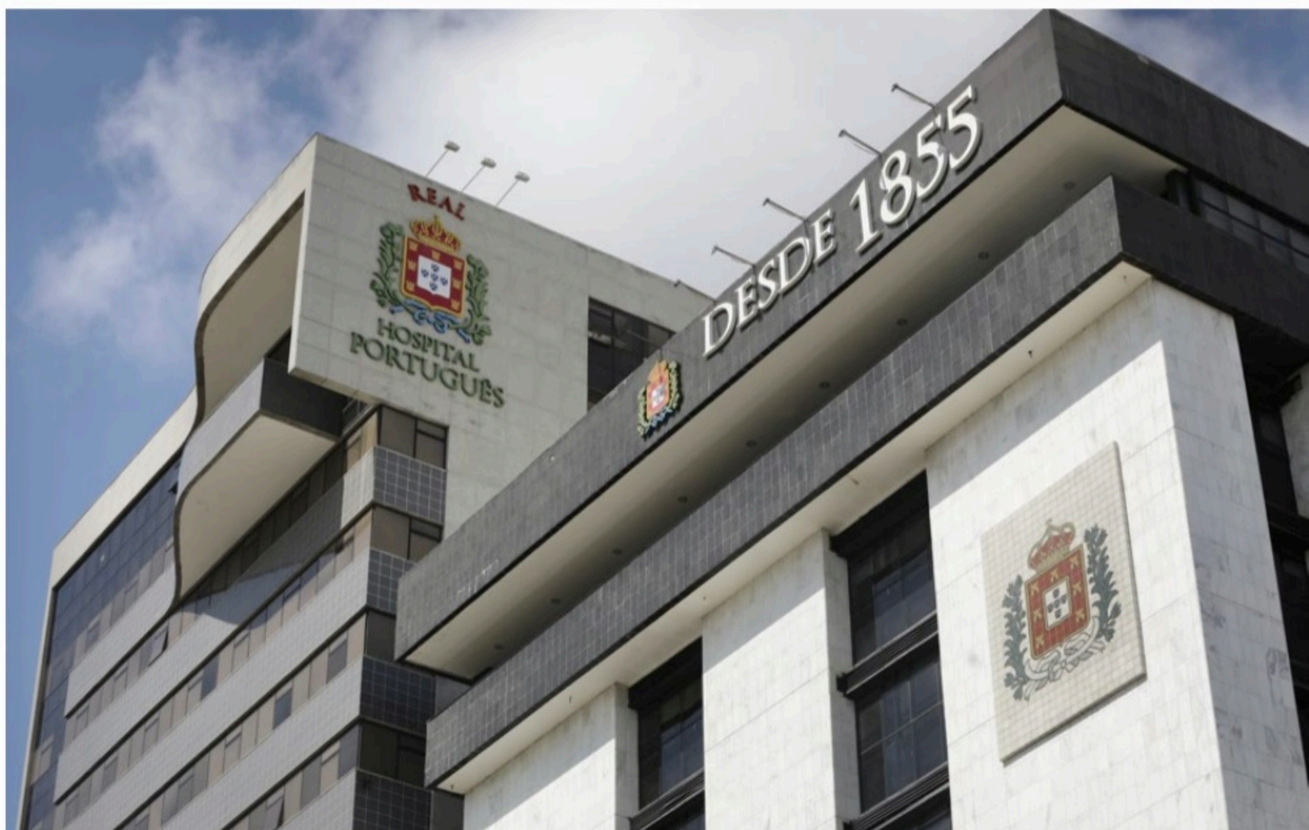
EQUIPE Com duas unidades (uma no Paissandu e outra em Boa Viagem), o Real Hospital Português (RHP) conta com mais de 6 mil colaboradores, 3.200 médicos e parceiros

Com formato inovador de atendimento beira leito, a emergência acolhe o paciente desde a chegada ao hospital. A pessoa é acomodada em