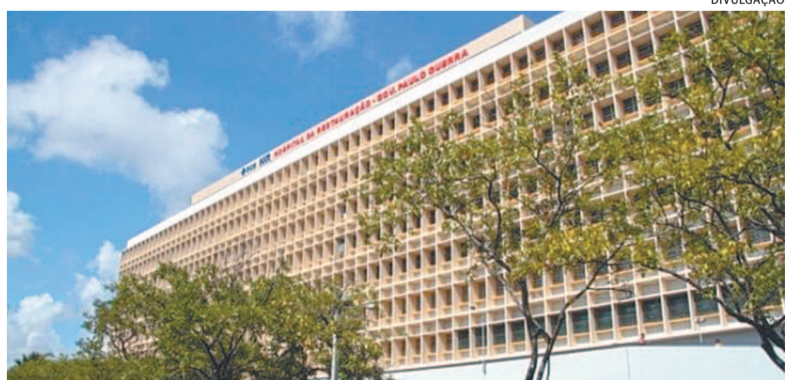
Problemas do tipo se acumulam no hospital, apesar das promessas do governo

Contudo, não é a primeira vez que problemas do mesmo tipo ocorrem no Hospital da Restauração. Em 2 de maio deste ano, estruturas de gesso também desabaram causando transtornos e assustando os presentes. Alguns dos pacientes estavam entubados e