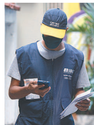
No momento, o IBGE tem 95.448 recenseadores atuando