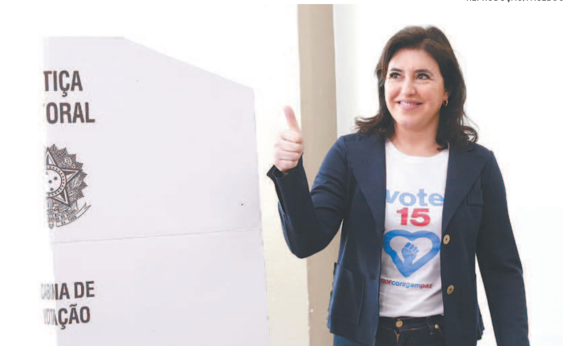
Tebet prometeu se pronunciar em breve e descartou o que chamou de “omissão”

Em Pernambuco, Lula conta com o apoio de Marília Arraes (SD). Apesar de as pesquisas terem apontado a candidata liderando com folga as pesquisas de intenção de voto, os resultados