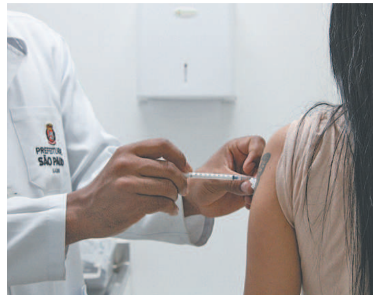
Para a autorização, a agência analisou os dados das etapas anteriores de desenvolvimento dos produtos

"O ensaio clínico incluirá participantes saudáveis de ambos os sexos, com idade entre 18 e