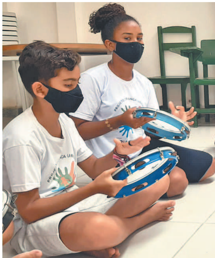
Cerca de 70 crianças participam das oficinas, atualmente

Além do trabalho desenvolvido na região, a iniciativa também tem como objetivo de fortalecer os direitos das crianças e adolescentes através da presença efetiva em debates e conferências sobre o tema. "A gente também está junto na construção da política da criança e do adolescente do nosso município, participamos do Conselho Municipal da Criança e do Adolescente e de conferências. Onde está sendo pautado esses direitos, o Projeto Criança Urgente estará lá na luta por esta de-