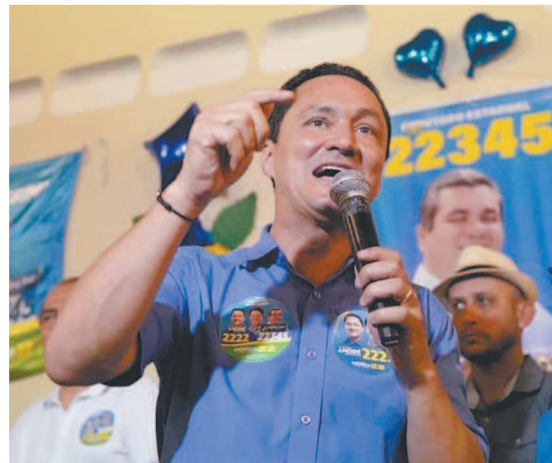
Deputado ganhou quase 100 mil votos em quatro anos