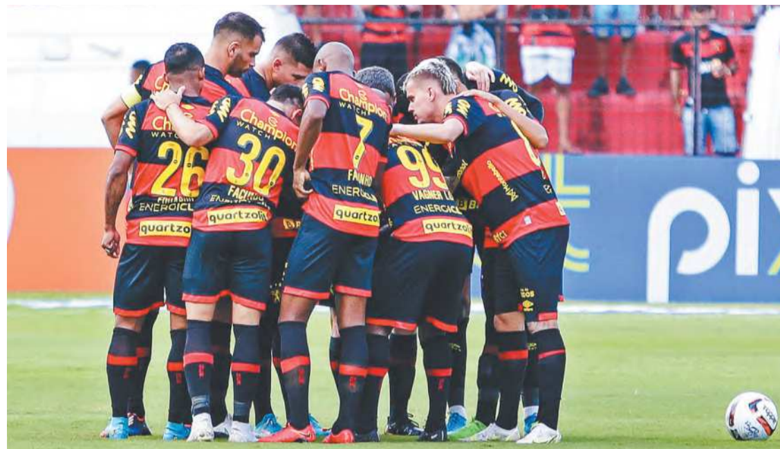
Com vitória sobre o Cruzeiro por 3 a 1, Sport chegou ao G4 dos mandantes da Série B

Outro fator positivo que representa a evolução leonina é o seu crescimento ofensivo. O Leão marcou seis gols nos últimos três jogos. Um recorde de dois gols por jogo em média, que faz um grande contraste em relação à média da equipe em geral na Série B, que sequer alcança um gol por jogo, apenas 0,88 por partida.