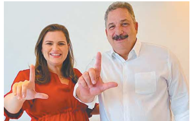
Candidata garantiu aliança com o presidente da Alepe