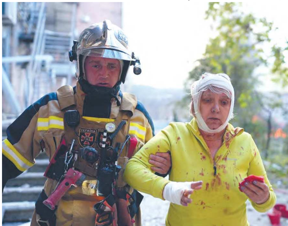
Socorrista ajuda uma mulher ferida no local do bombardeio em Kiev, capital da Ucrânia

Secretário-geral da ONU disse que agressões são uma escalada inaceitável da guerra, iniciada em fevereiro