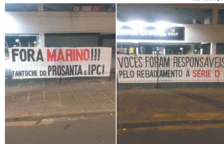
Poderes Executivo e Deliberativo trocam acusações