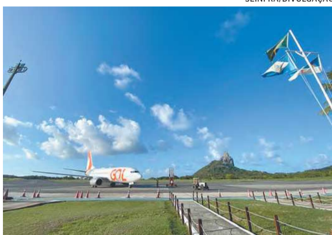
Terminal recebe quatro voos diários de aviões a jato

Além de suspender as vendas, a Azul, que não venderá novas passagens até 31 de janeiro do próximo ano, anunciou um esquema alternativo para atender os clientes que já compraram bilhetes. Desta quarta-feira até o dia 31 de outubro, a princípio, a empresa vai manter os seus três voos diários e operar mais dois