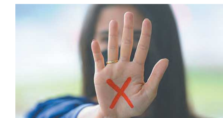
Essa foi a segunda edição da Operação Maria da Penha

Qualquer pessoa que presencie ou saiba de um caso de violência doméstica ou familiar pode lançar mão dos canais de atendimento especializado ou de denúncia geral para delatar