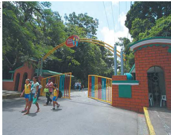
Local abre às 9h e terá quarta-feira cheia de atrações

te Educação, que está sendo assinado pela Secretaria Estadual de Meio Ambiente e Sustentabilidade (Semas-PE), para contemplar os municípios pernambucanos com 17 peças teatrais relacionadas ao calendário ambiental, que depois serão impressas e distribuídas como livreto, e 150