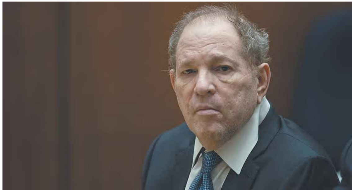
Magnata do cinema pode ser sentenciado a mais 140 anos de prisão

As acusações de assédio e abuso sexual contra Weinstein se tornaram públicas em outubro de 2017. Sua condenação em Nova York em 2020 foi um marco para o movimento #MeToo. Em caso de condenação, o magnata do cinema - que se declarou inocente de todas as acusações - po-