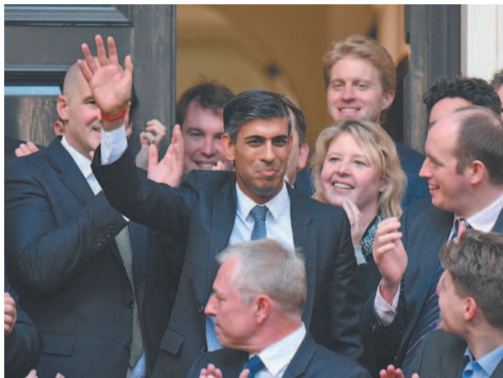
Quando Sunak nasceu não havia deputados de origem asiática ou africana no país desde a Segunda Guerra

Ainda que a nomeação de Sunak “conte uma história importante sobre nossa sociedade”, sobre seu passado e seu futuro, “espero que seja consciente de que nem todo mundo teve seus privilégios na vida”, disse Katwala. (AFP)