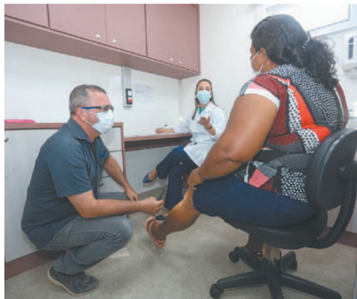
Ação começou ontem e segue até esta quinta-feira (27)

A Prefeitura do Jaboatão dos Guararapes iniciou, ontem, uma ação de diagnóstico precoce para casos de Hanseníase. Os atendimentos seguem até a quinta-feira (27), das 13h às 16h, no Centro Cultural Miguel Arraes, em Prazeres. A atividade, chamada de Carreta da Hanseníase, é uma ação conjunta entre o município, Governo do Estado, Ministério da Saúde e o Movimento de Reintegração dos Acometidos pela Hanseníase (Morhan). Durante os três dias, serão atendidos 25 pacientes de todas as regionais, que já foram agendados por apresentarem suspeita