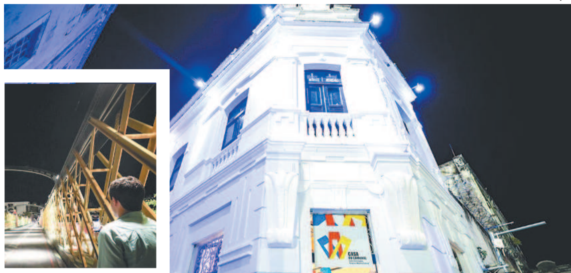
Ponte de Ferro e Casa do Carnaval foram dois dos primeiros locais com novo visual

O próximo equipamento beneficiado será o Teatro Santa Isabel. A expectativa é ter um projeto aprovado a cada 60 dias e, à medida que estiverem prontos, realizar a licitação para a exe-