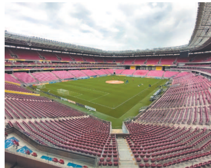
Estádio surge como alternativa após interdição da Ilha

Também no julgamento desta quarta ficará definido a respeito da presença ou não da torcida rubro-negra. Em decisão liminar expedida pelo Presidente do STJD no último dia 16, ficou determinado que até o julgamento a Ilha do Retiro seguirá interditada para receber jogos, assim como a suspensão do direito do Sport em receber torcida nos jogos.