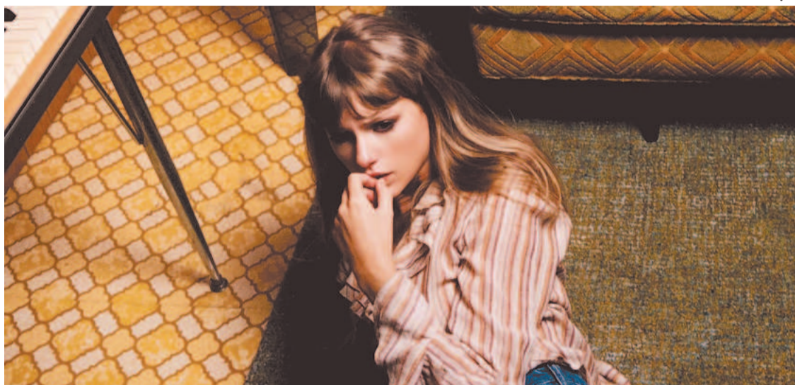
Álbum inclui 13 músicas que, segundo Taylor, foram escritas em noites de insônia

Além disso, em seus três primeiros dias, as 20 músicas do álbum geraram mais de 284 mi-