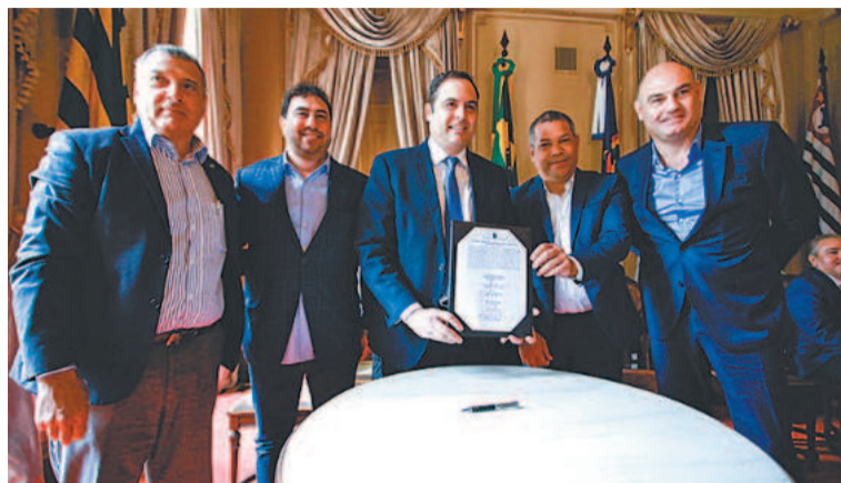
Assinatura do contrato ocorreu no Campo das Princesas