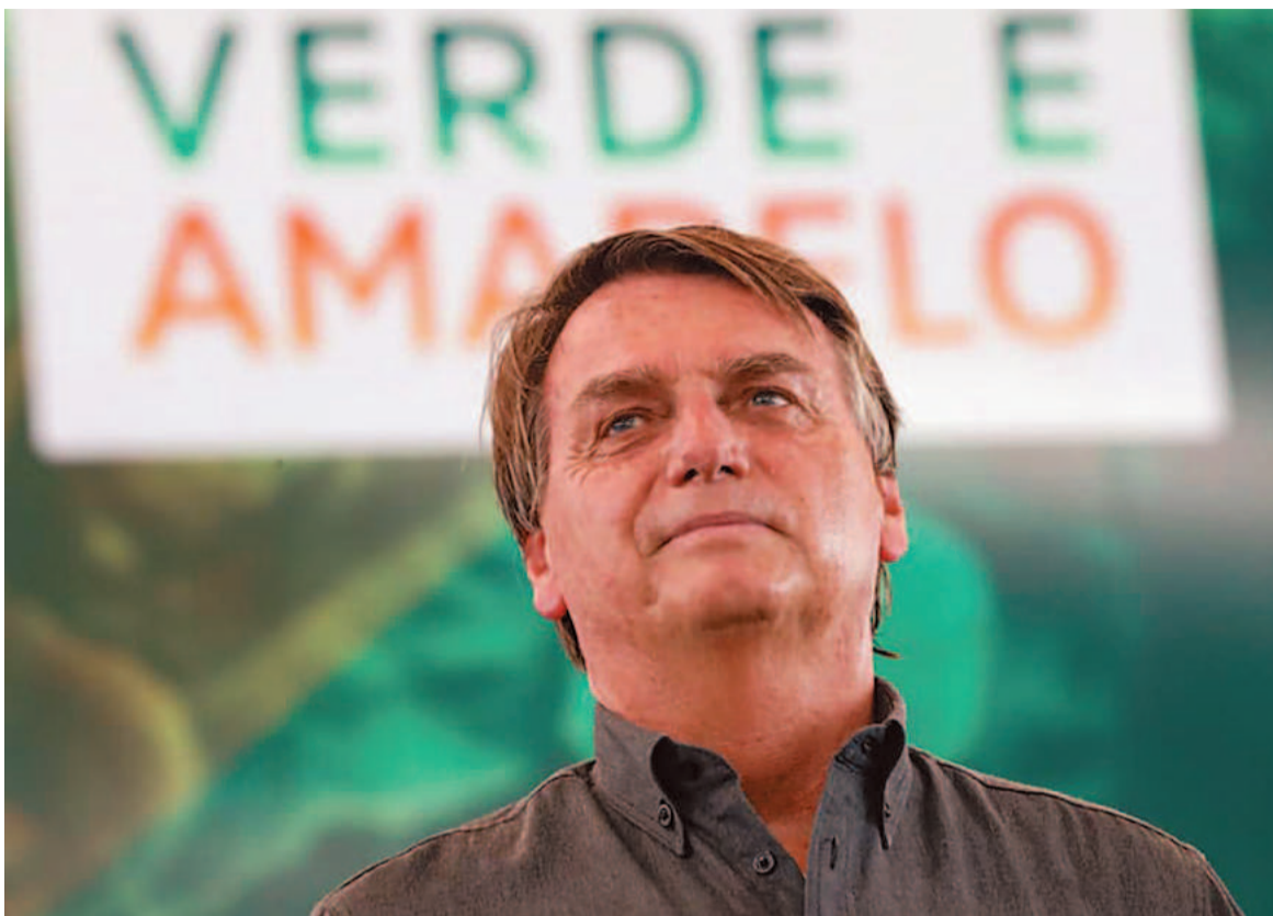
Chefe do Executivo também comemorou a eleição de um Congresso mais à direita