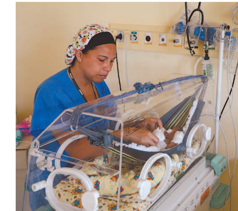
Dados são de pesquisa do Observa Infância, da Fiocruz

O pesquisador lembra que a taxa de hospitalizações por desnutrição a cada 100 mil bebês nascidos vivos tem aumentado no Brasil desde 2016, e a