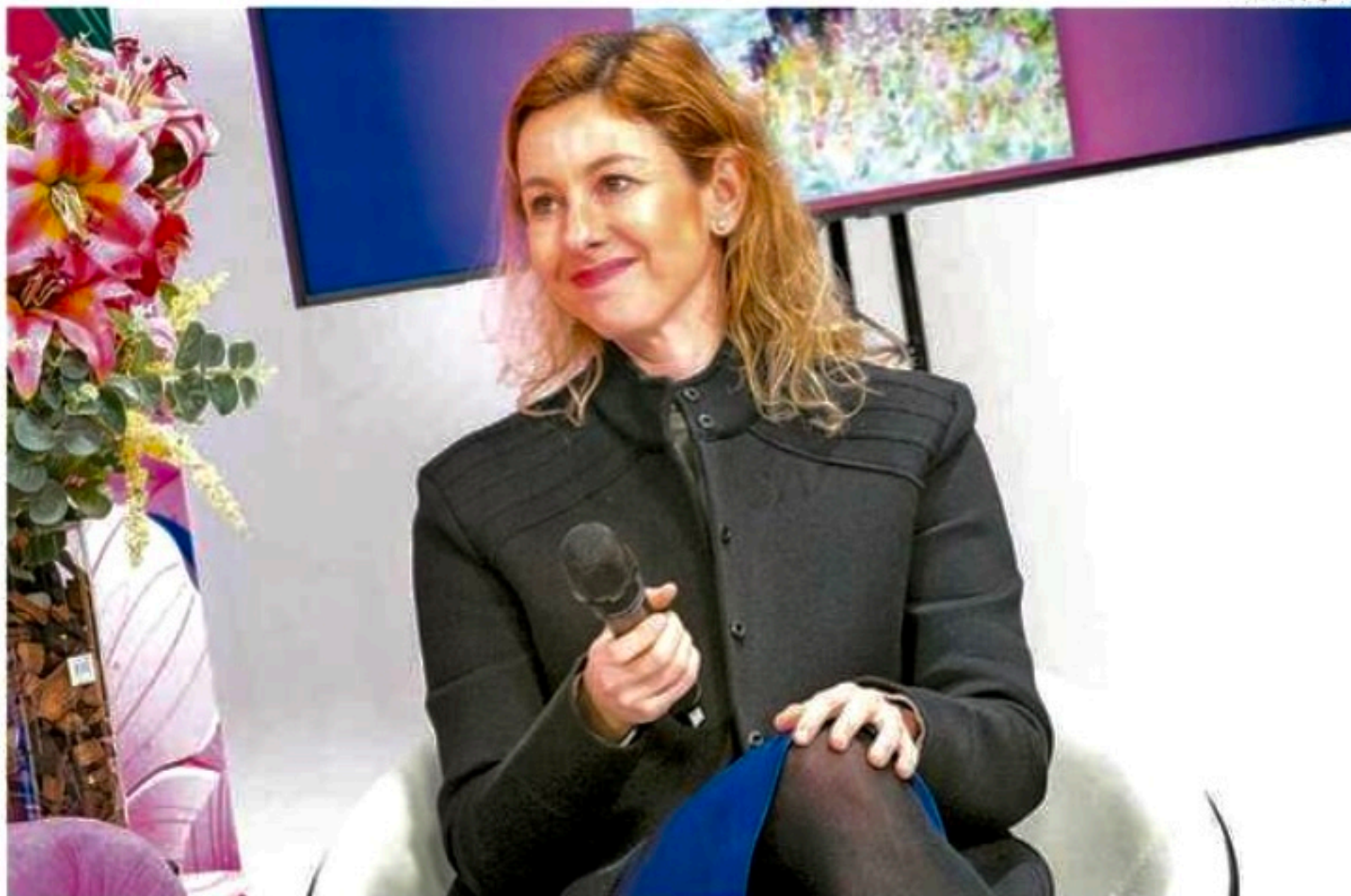
Segundo Débora Gagliato, é comum pacientes que não têm nenhum fator de risco desenvolverem a doença

■ Especialista destaca evolução de terapias contra a doença, ressalta importância do diagnóstico precoce e atenta sobre fatores de risco