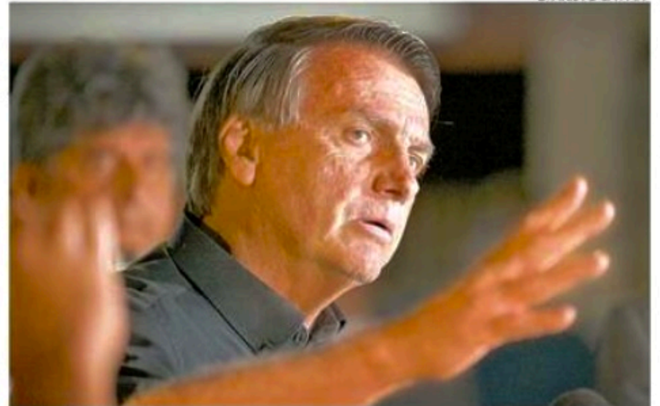
Bolsonaro contou, em entrevista, sobre presente dado a Moraes