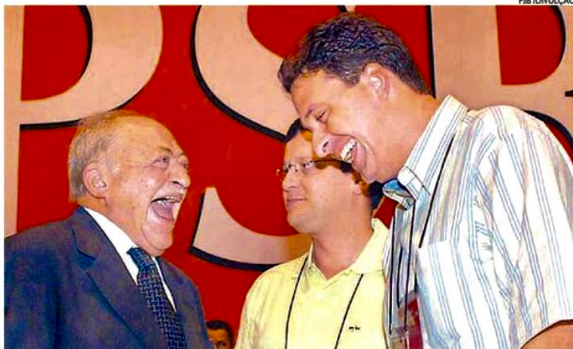
Miguel Arraes e Eduardo Campos protagonizaram dois momentos distintos de permanência no poder

No entanto, nem Arraes e Jarbas conseguiram fazer os seus sucessores. Já Eduardo foi eleito e reeleito, além de garantir a eleição de seu sucessor, Paulo Câmara, em 2014 - mesmo após a sua morte, naquele mesmo ano, vítima de