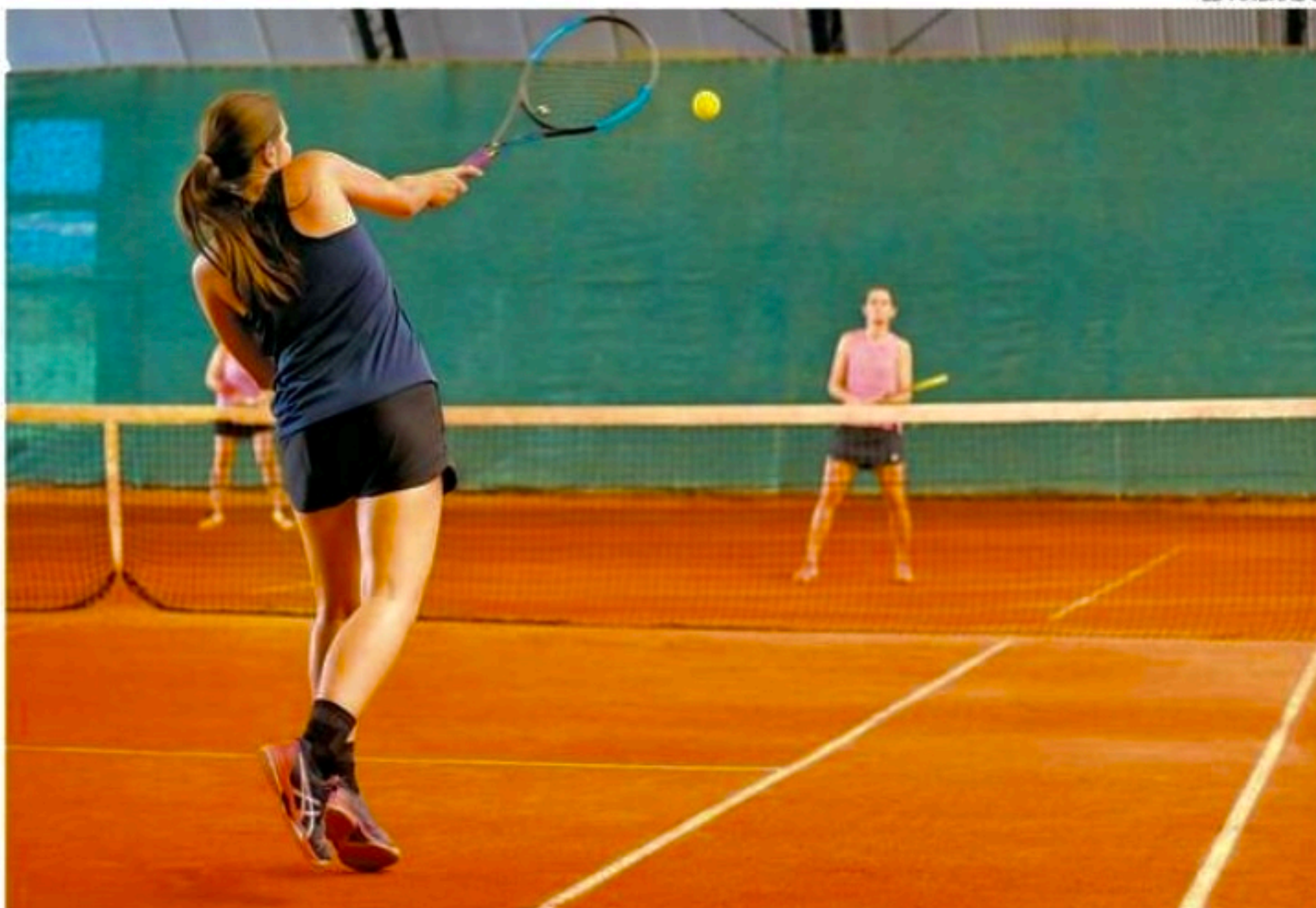
Torneio que tem início no dia 27 (quinta) e segue até 30 (domingo) de outubro irá agitar Recife Tênis Clube

Com o intuito de conscientizar as mulheres sobre a realidade do câncer de mama e a importância do diagnóstico precoce, Recife vai receber no final do mês o II Open Outubro Rosa de Tênis Feminino. O torneio, exclusivo para o sexo feminino, ocorre no Recife Tênis Clube, no bairro da Imbiribeira, na Zona Sul do Recife. A competição tem início no dia 27 (quinta) e segue até o dia 30 (domingo).