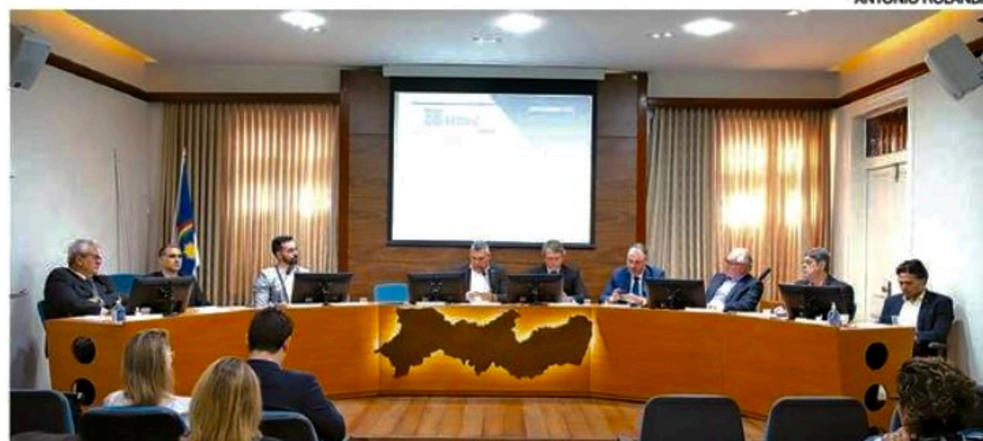
Os projetos aprovados na 120ª reunião do Condic vão gerar 613 novos empregos no Estado

Entre os empreendimentos com destaque na Região Metropolitana estão a Salmeron Energia Renovável, Indústria Brasileira de Lonas