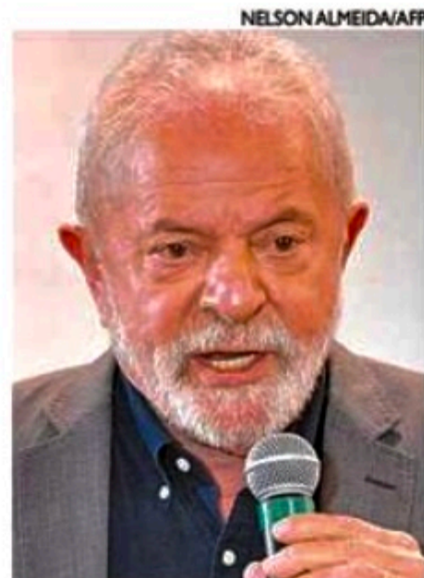
Lula manteve 49% e Bolsonaro cresceu um ponto percentual, com 45%