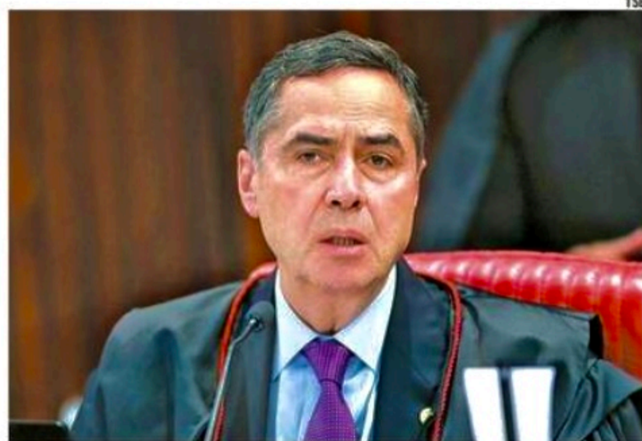
STF confirmou decisão individual do ministro Luis Roberto Barroso

Além do relator, também referendaram a liminar os ministros Edson Fachin, Cármen Lúcia, Dias Toffoli, Alexandre de Moraes e Luiz Fux.