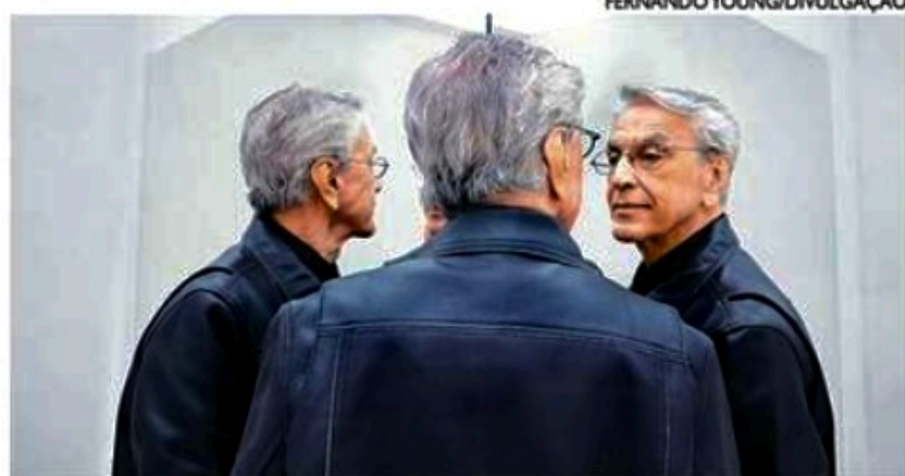
Cantor baiano gravou o repertório da turnê em estúdio caseiro

"Este é um disco de quantidade e intensidade. "Autoacalanto" é re-