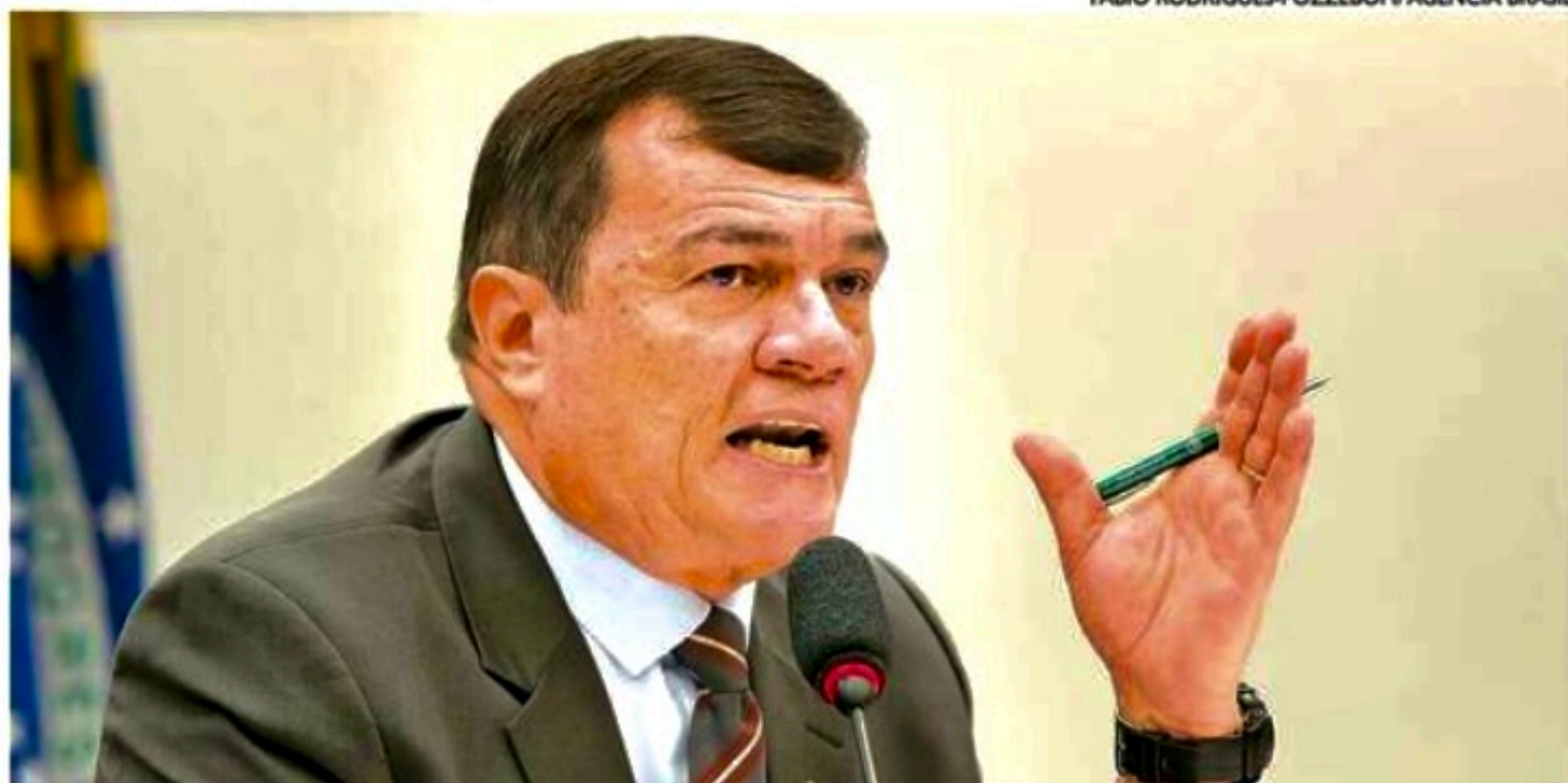
Ministro da Defesa, Paulo Sérgio Nogueira de Oliveira (foto) teve reunião com Alexandre de Moraes (TSE)

Segundo as Forças Armadas, a apresentação de um documento final está de acordo com o "Plano de Trabalho em vigor, e que as despesas correspondentes se restringem a pagamentos de diárias e passagens, custeadas com os recursos próprios do Ministério da Defesa, na Ação Orçamentária 2000". "A emissão de um relatório parcial, baseado em fragmentos de informação, pode resultar-se inconsistente com as conclusões finais do trabalho, razão pela qual não foi emitido", diz a nota técnica.