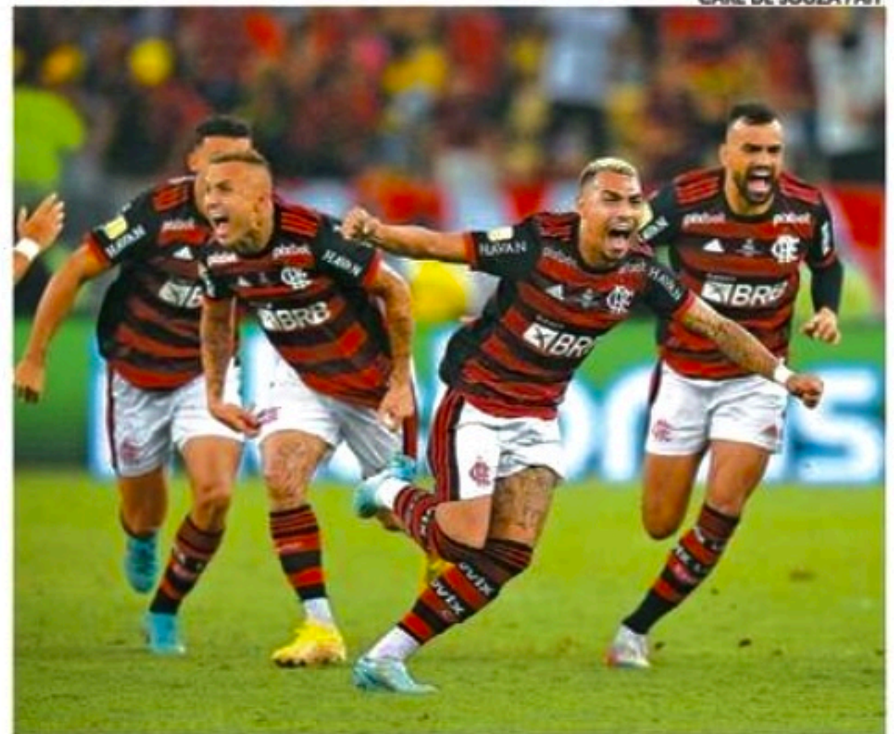
Cariocas levantam taça da Copa do Brasil e fazem a festa no Maracanã

Foram sete minutos de blitz do Corinthians na área do Flamengo no início do segundo tempo. Rodou a bola pelos dois lados, tentou chegar pelo alto em cruzamentos e escanteios, mas sem chance real de perigo. Quando o Flamengo saiu ao ataque, Gabigol deixou Arrascaeta de frente à meta e o uruguaio só não fez o dele porque Cássio se esticou para defender. Aos 13, um momento de incredulidade no lado visitante. Adson bateu cruzado e Roger Guedes, dentro da pequena área, perdeu um gol feito. O castigo quase veio minutos depois. Em novo con-