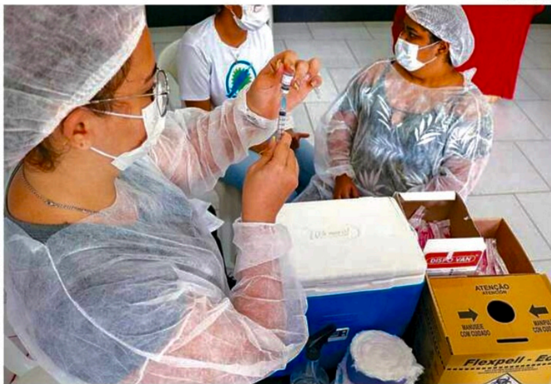
No Estado, 86,92% da população completou esquema vacinal, de acordo com a SES-PE

Dados da Secretaria Estadual de Saúde (SES-PE) de terça-feira indicam que Pernambuco apli-