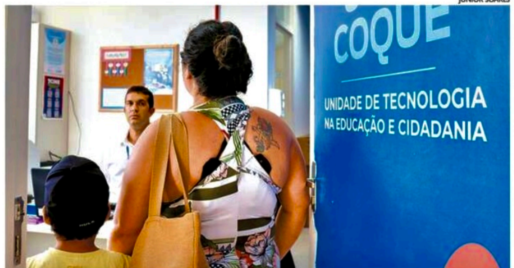
Ação ocorre até amanhã no Compaz Dom Helder Câmara, localizado na Ilha de Joana Bezerra

Para solicitar o CPF, o pai ou responsável precisa comparecer ao Compaz levando a Certidão de Nascimento e o RG da criança, bem como o comprovante de residência. De acordo com a Secretaria de Educação do Recife, para estudantes com menos de 18 anos de idade que não possuem RG, é ne-