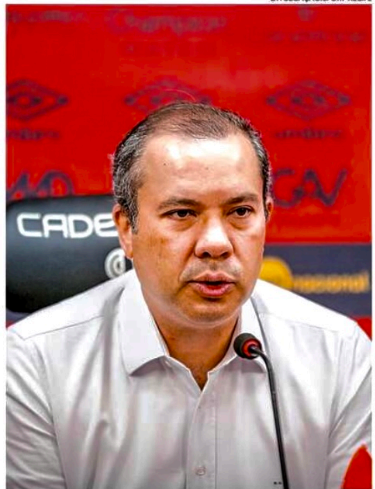
Vice-presidente jurídico prepara defesa do Sport junto ao STJD

A atuação da cabine demorou cerca de três minutos, enquanto Claus, que inicialmente não notou penalidade na jogada, precisou de apenas alguns segundos para mudar de opinião. "Vou sair com pênalti e sem cartão, porque é em disputa", afirmou o árbitro à cabine.