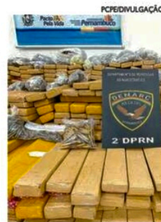
Droga foi localizada em flat. Um homem também foi preso

O preso possui três antecedentes criminais por homicídio e um antecedente criminal por roubo, já tendo ficado preso por cerca de 10 anos. O suspeito foi autuado por tráfico de drogas, associação para o tráfico e posse irregular de munição.