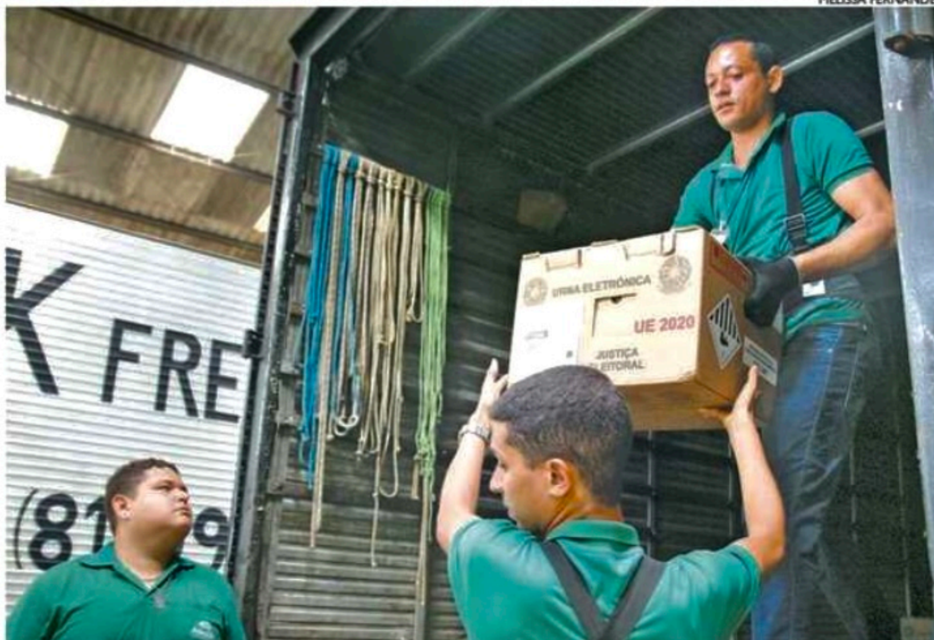
TRE iniciou, ontem, a distribuição das urnas eletrônicas que serão utilizadas no segundo turno

ção foi o arquipélago de Fernando de Noronha. "Por conta da dificuldade no transporte aéreo, enviamos as urnas por navio, para evitar algum problema. As urnas já estão no local onde falta apenas a montagem", declarou George.