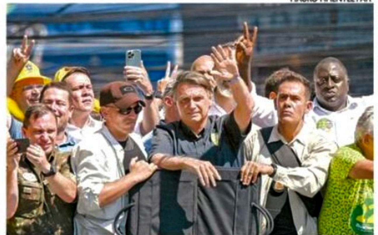
Presidente fez carreta de Belford Roxo a São João do Meriti

Em campanha no Rio de Janeiro, o candidato à reeleição não citou as denúncias sobre inserções e voltou a falar sobre a agenda de costumes