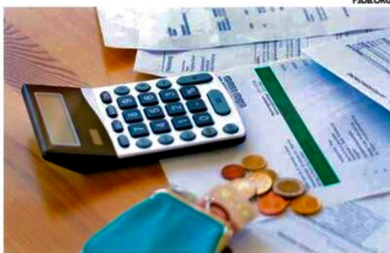
Pesquisa mostra que a inadimplência também aumentou

Segundo os dados da autoridade financeira, a inadimplência também cresceu. O percentual de pessoas que não conseguem pagar as