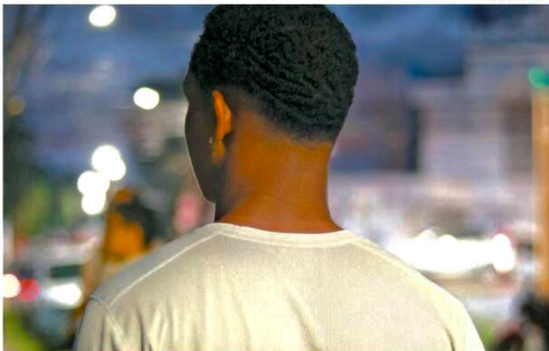
Adolescente prestou queixa à polícia, que instaurou procedimento para apurar possível crime de injúria racial