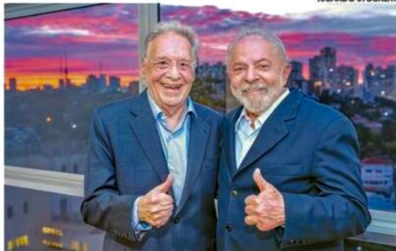
Lula e FHC chegaram a se encontrar depois do primeiro turno