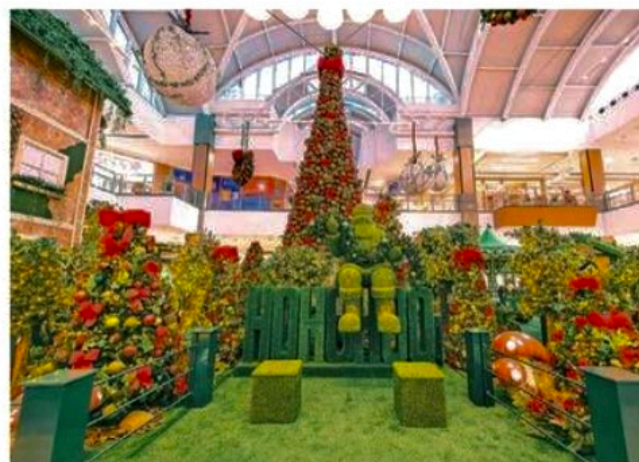
A inauguração da decoração natalina do mall será amanhã

O prazo das linhas de crédito passou de 48 para 72 meses. Os juros passarão a ser definidos pela Secretaria Especial de Produtividade e Competitividade (Sepec) do Ministério da Economia. Até agora, as linhas do Pronampe seguiam a Taxa Selic (juros básicos da economia) mais 1,25% sobre o valor contratado, para financiamentos