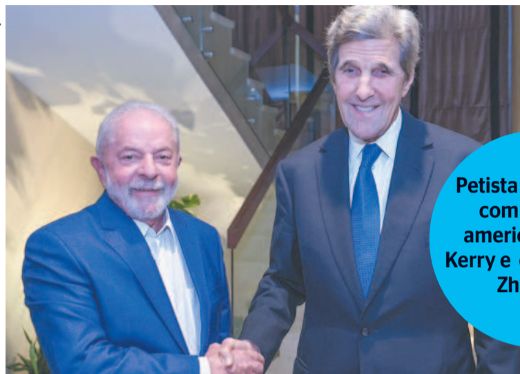
Petista conversou com o norte-americano John Kerry e o chinês Xie Zhenhua