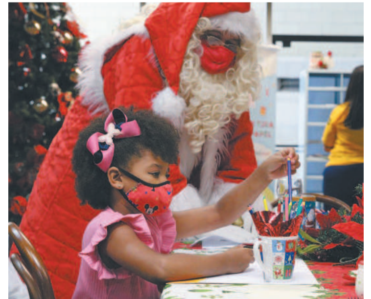
Lançamento será na Secretaria de Educação de Paulista