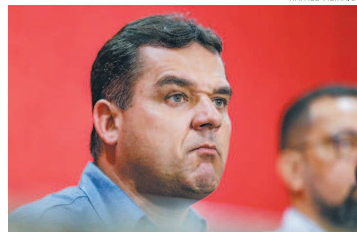
Oposição quer tirar Diógenes Braga da presidência