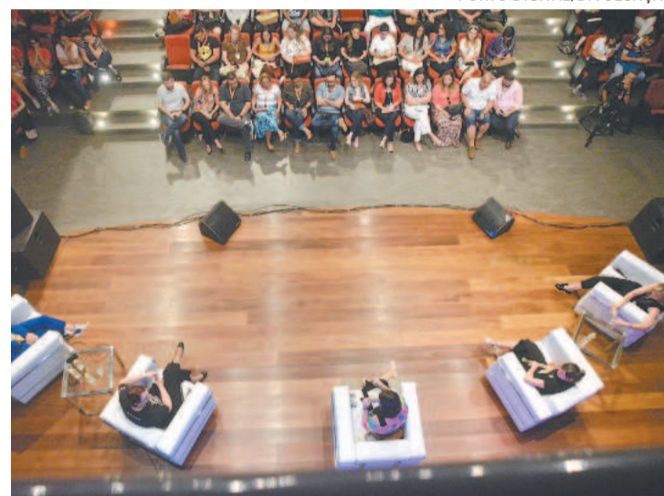
Programação do evento tem quatro eixos temáticos

Entre as atividades estão aulas sobre metaverso, design, programação e comunidades digitais promovidas pela Cesar School, braço de ensino do Centro de Estudos e Sistemas Avançados do Recife (Cesar). Já o Sebrae desenvolverá atividades relacionadas ao ecossistema de inovação nas áreas de saúde, educação, agrotécnicas e um espaço para networking, além de abrir o espaço Cliente do Futuro, voltado para os futuros empreendedores.