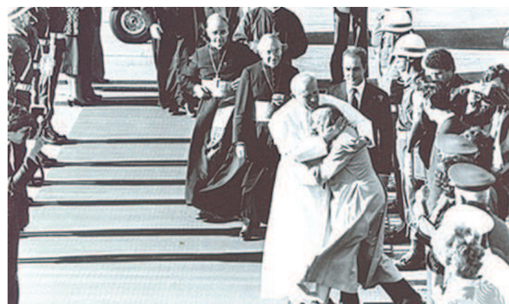
Dom Helder com o papa João Paulo II, no Recife, em 1980