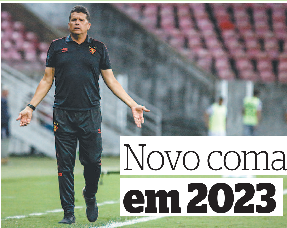
Treinador ficou marcado por campanha ruim longe da Ilha do Retiro durante a Série B

Sendo assim, o Sport sinaliza novamente o seu nome no mercado I, como mais um clube que vai buscar novo técnico pensando na temporada 2023. Busca, porém, que tende a sofrer entraves, sobretudo por conta das eleições do clube, agendadas para o próximo dia 16 de dezembro.