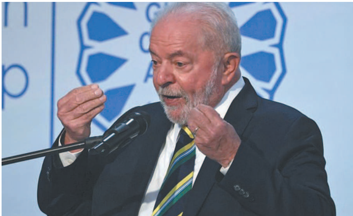
Lula disse que o combate à mudança climática terá prioridade no seu governo

No discurso de Lula, o combate ao desmatamento foi além da relação com o agronegócio. Segundo ele, seu governo irá reativar os trabalhos da equipe de fiscalização e proteção ao meio ambiente.