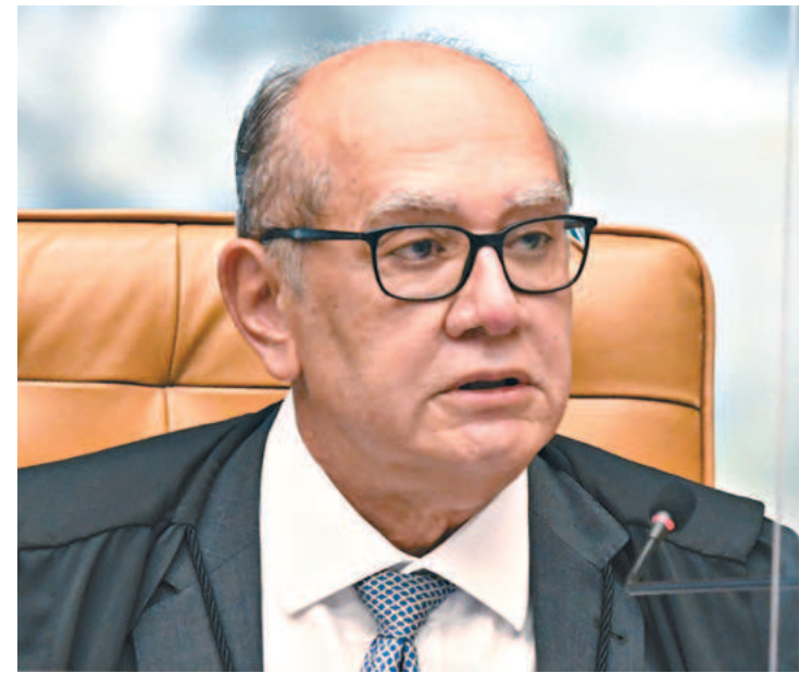
Gilmar Mendes falou das eleições brasileiras em Lisboa

Para Gilmar, apesar dos transtornos, foi importante o diálogo com todos os participantes do seminário promovido pelo Lide, de João Doria. “Havia, ali, 200 empresários brasileiros e americanos, e muitos estavam seguindo pela internet. Os ministros do Supremo explicaram todo o papel das instituições brasilei-