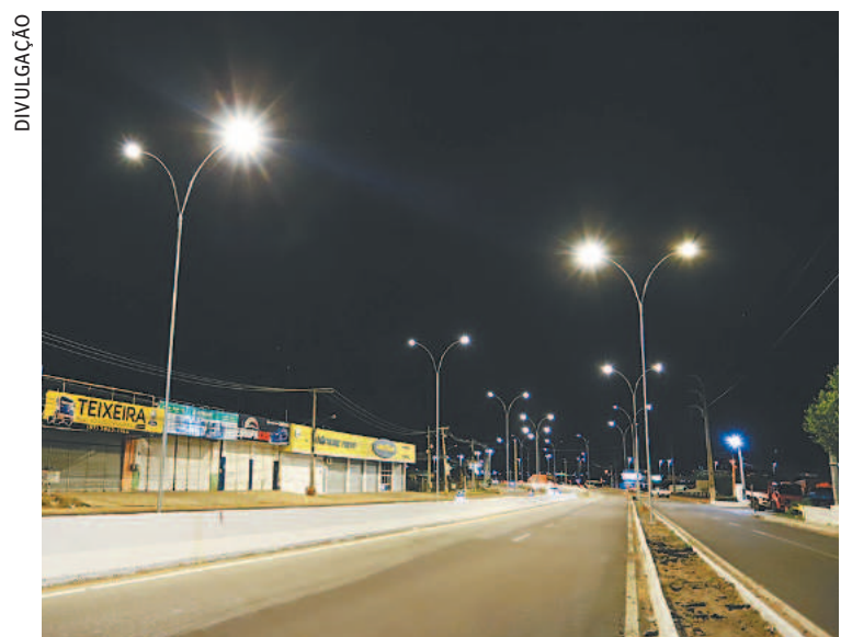
Investimento na modernização foi de R$ 70 milhões

Caso seja constatado algum ponto que a equipe não tenha identificado e a lâmpada não tenha sido trocada, bem como iluminação queimada ou apagada, o morador deve fazer a solicitação, de acordo com a gestão municipal, pelo telefone 0800-608-1022. Em caso de pedido de expansão de pontos (se não houver luminária), deve-se ligar para 3862 2993 para o cadastro.