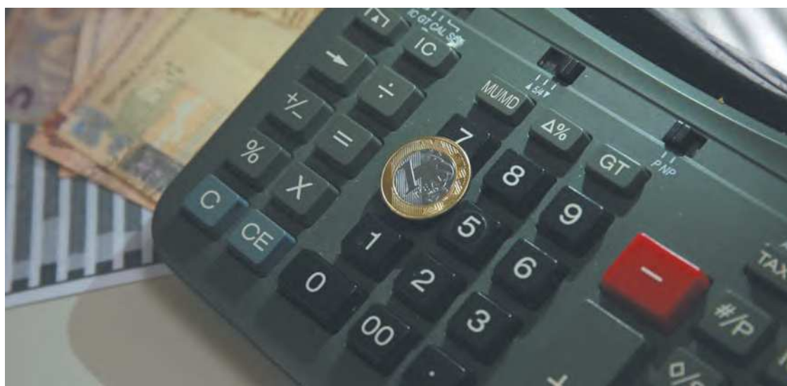
Apesar da queda, novo patamar inflacionário continua acima da meta, que é de 3,5%

desaceleração da atividade econômica no segundo semestre deste ano, resultado dos efeitos defasados do ciclo de ajuste da política monetária [aumento de juros pelo Banco Central]. No entanto, projeta-se que os impactos advindos da elevação da taxa de juros se reduzam ao longo do próximo ano”, informou a SPE.