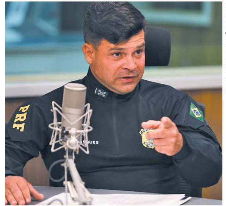
Diretor-geral pediu voto para Jair Bolsonaro na internet

Não é possível [...] dissociar da narrativa desta inicial a possibilidade de que as condutas do requerido, especialmente na véspera do pleito eleitoral, tenham contribuído sobremodo para o clima de instabilidade e confronto instaurado durante o deslocamento de eleitores no dia do segundo turno das eleições e após a divulgação oficial do resultado pelo TSE", argumentou. (Luana Patriolino, do Correio Braziliense)