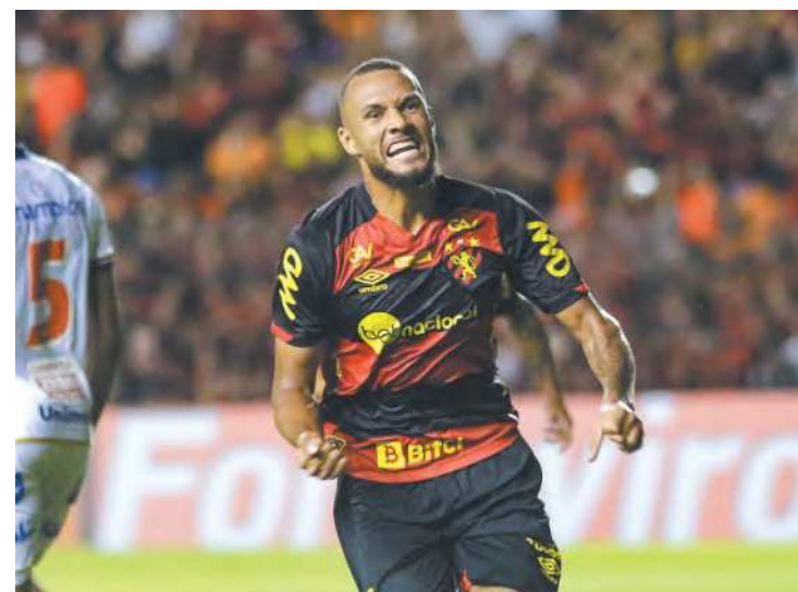
Atleta está entre as prioridades para renovar para 2023

“O Sport comprando, sem problemas. Empréstimo, não. Só por compra”, cravou o executivo, sem descartar a possibilidade de que a compra de parte dos direitos seja possível, não necessariamente envolvendo 100% do passe do atleta. “Sem problemas.”