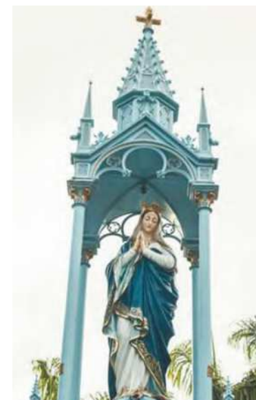
Sem restrições, procissões vão retornar este ano

Em 8 de dezembro, data dedicada à Imaculada Conceição, as tradicionais Santas Missas de hora em hora serão celebradas no palco montado na praça em frente à torre da Igreja, com início à 0h. As demais celebrações serão realizadas das 2h às 16h. Dentro do Santuário, a primeira Santa Missa vai ser celebrada à 1h (e vai até as 15h).