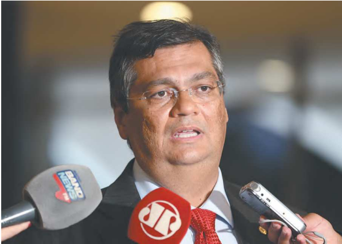
Ex-governador do Maranhão está entre os cotados para assumir o Ministério da Justiça