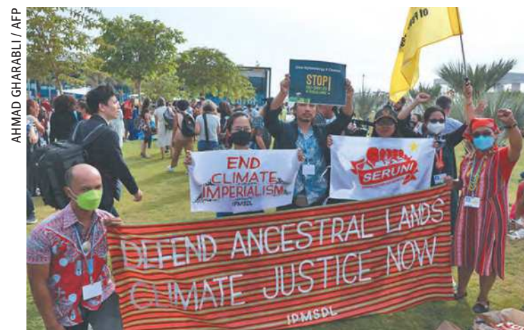
Ativistas protestam do lado de fora do Centro de Convenções Internacional de Sharm el-Sheikh

um novo fundo especialmente dedicado à espinhosa questão de uma indenização pelas consequências da industrialização e pela emissão de gases de efeito estufa. (AFP)