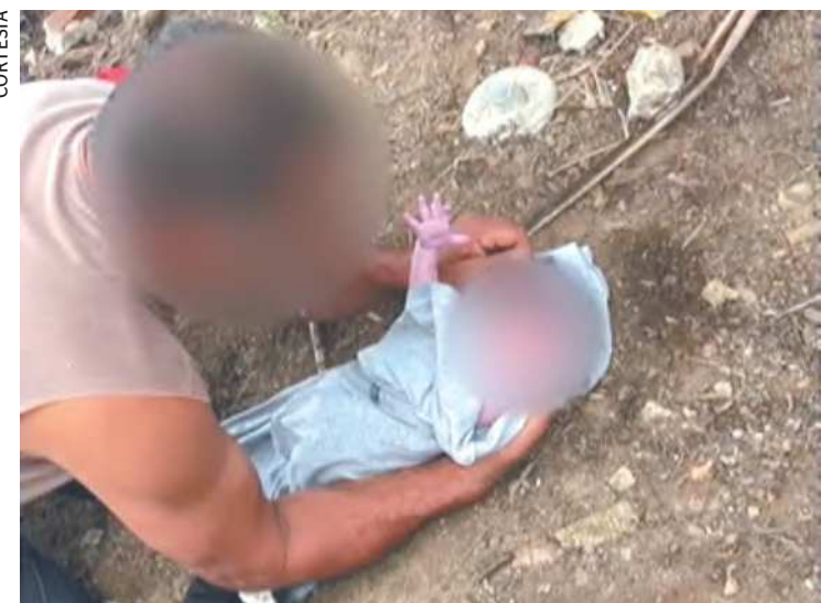
A recém-nascida não se feriu e foi levada a um hospital

rerem problemas, será entregue aos cuidados do Conselho Tutelar de São Lourenço da Mata. Não foram informados mais detalhes da vítima, como a do su-