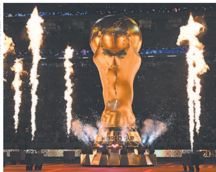
Evento teve cânticos de torcedores dos 32 participantes

A organização da Copa do Mundo do Catar realizou ontem uma cerimônia de abertura que relembrou a história do torneio e apresentou a vida e a cultura nesta região do Golfo. A festa durou 30 minutos no estádio Al-Bayt.