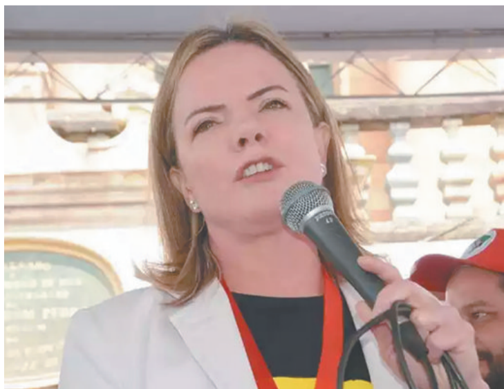
Presidente do PT é um dos principais nomes da transição