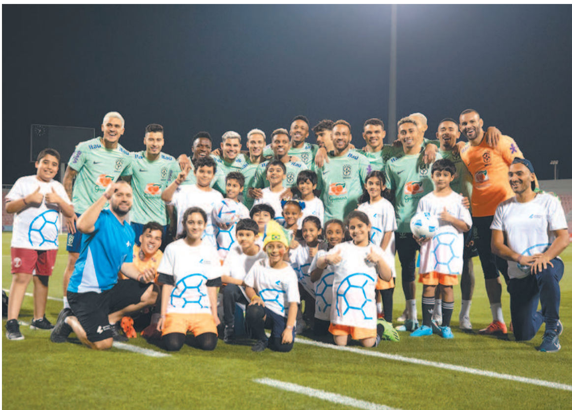
Jogadores participaram de uma ação social promovida pela Fifa com crianças imigrantes