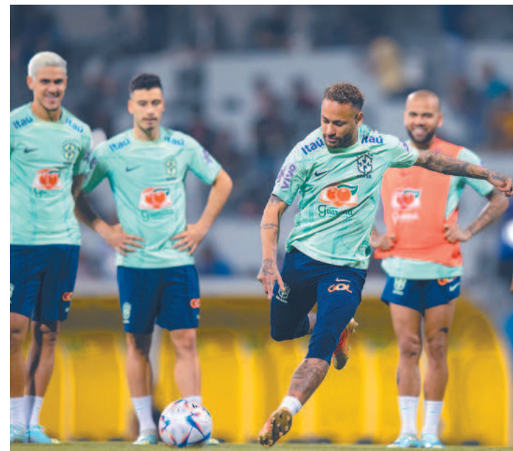
Seleção brasileira está na reta final para estreia na Copa