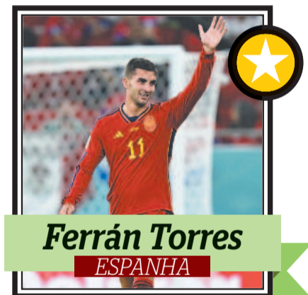
Ferrán Torres ESPANHA