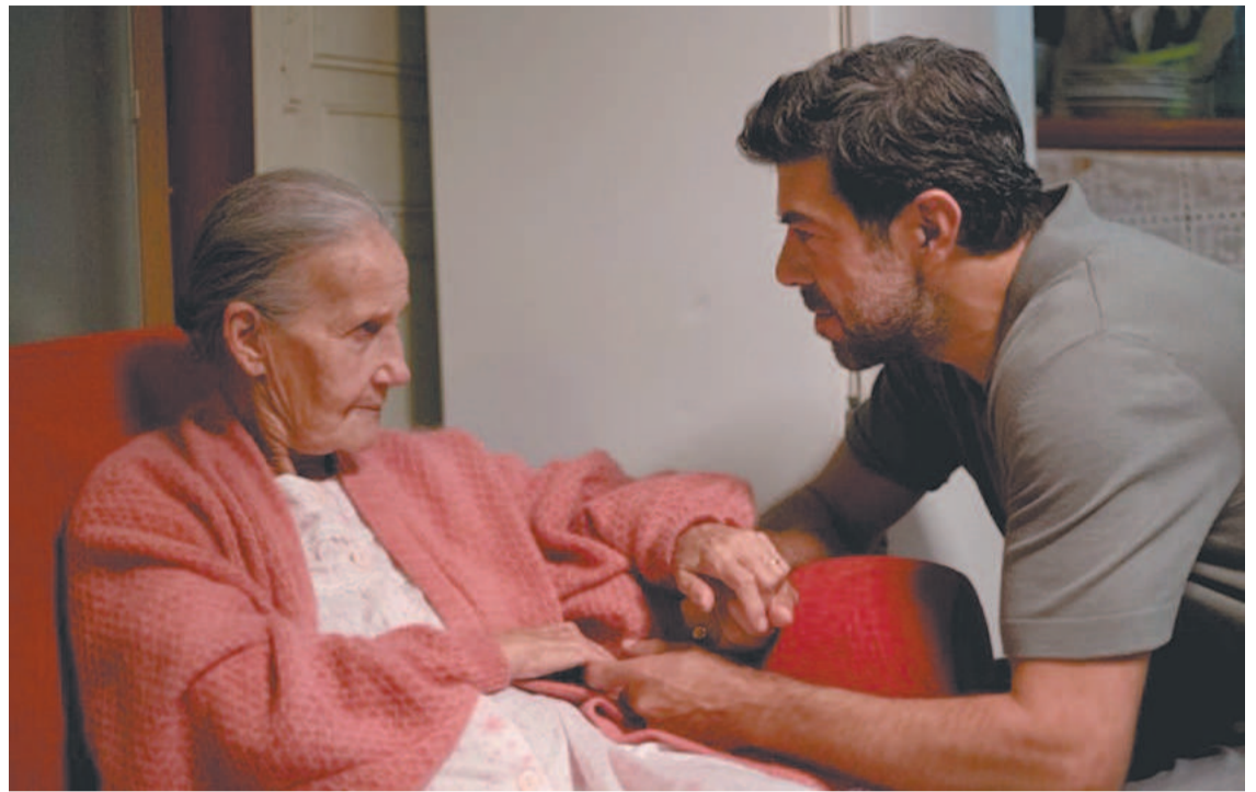
O destaque vai para “Nostalgia”, de Mario Martone, representante da Itália no Oscar 2023

mostras de cinema mundiais. Entre os longas-metragens inéditos, o destaque vai para o filme Nostalgia (2022), de Mario Martone, escolhido para representar a Itália na edição do Oscar 2023. O filme será exibido na sala do Museu amanhã, às 19h30. Outro filme inédito é a comédia Acqua e Anice (Água e Anis), do diretor estreante Corrado Ceron. A sessão de Água e Anis será na próxima terça-feira, às 15h20. Na mostra As Musas do Cine-