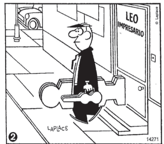
Resolução: 1. Tamanho de quadrado na parede; 2. Gravata; 3. Cor da camiseta; 4. Final da mala maior; 5. Pedago de camiseta abaixo da mala menor; 6. Detalhe na escada; 7. Parede ao lado da porta; 8. Piso próximo do poste.