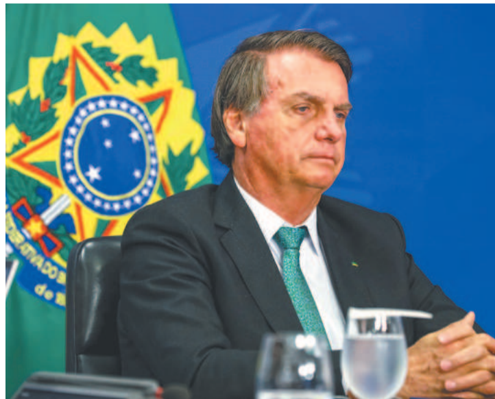
Aliados atribuem ausência de Bolsonaro à doença

A primeira-dama, Michelle Bolsonaro usou as redes sociais para rebater as informações de que Bolsonaro não havia sido internado no HFA. Além dela, o ex-ministro das Comunicações Fábio Wajngarten afirmou, em entrevista à reportagem que o presidente não havia, sequer, sido atendido por médicos, naquele dia. ( Correio Braziliense )