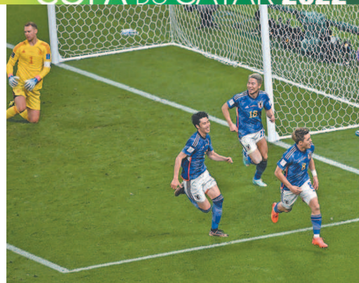
Japoneses foram ao delírio com a vitória surpreendente

Os tentos espanhóis foram assinalados por Dani Olmo, Asensio, Gavi, Soler, Morata e Ferran Torres, duas vezes. Do outro lado, os costarriquenhos não mostraram qualquer indício de reação.