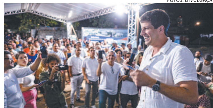
De acordo com prefeito, o projeto é de R$ 13 milhões

mangue e recuperação de 7 mil metros quadrados da vegetação típica de estuários. Haverá a preservação de parte da antiga pista do aeroclube e a construção de um memorial. O projeto inclui um parque urbano, que será o maior da cidade, com 11,9 hectares.