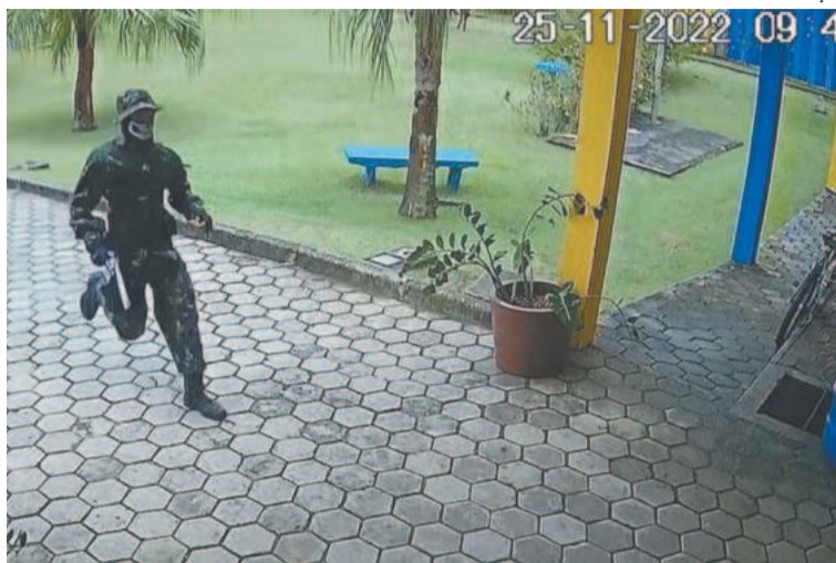
O adolescente era considerado introspectivo, fazia tratamento psiquiátrico e havia abandonado a escola

Em entrevista coletiva na manhã de ontem, as autoridades