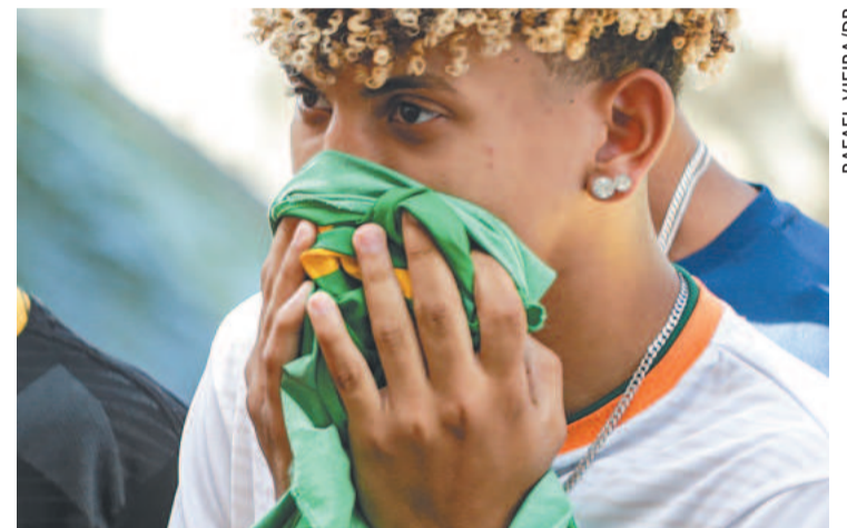
Assim como no primeiro jogo, houve tensão na partida