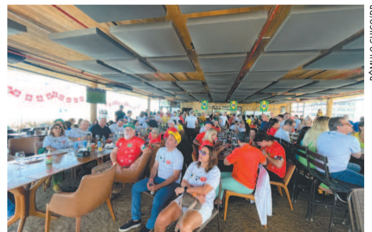
Já no Cais Rooftop, suíços eram maioria em evento...