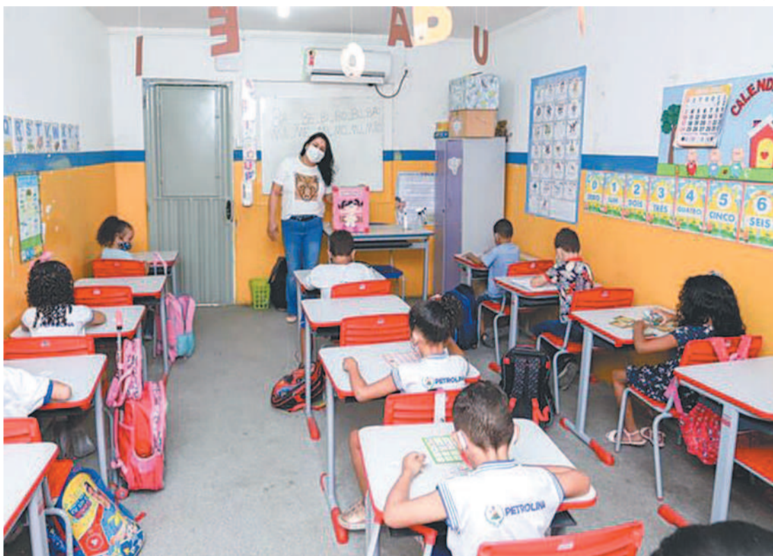
Cidade procura substitutos para disciplinas como matemática e inglês, por exemplo

Serão disponibilizadas vagas temporárias para os cargos de nível superior, superior/normal médio, médio, fundamental completo e incompleto em diversas áreas, que vão desde professor substituto de educação infantil, matemática, inglês, atendimento educacional especializado e outras disciplinas a assistentes administrativos e educacionais, auxiliares de limpeza e cozinha, barqueiro de transporte escolar e motoristas. O valor da inscrição para os cargos de Ensino Fundamental completo é de R$ 90, Fundamental incompleto é R$, para os cargos de nível