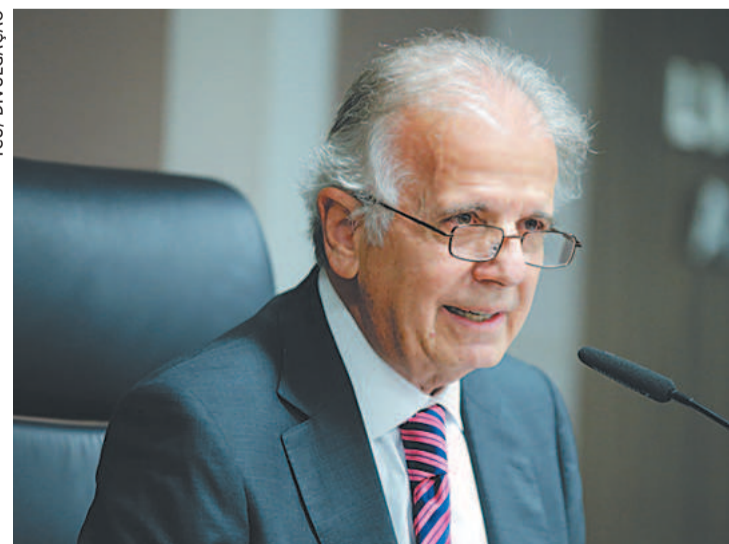
Pernambucano se reuniu com Lula, segundo colunista

O pernambucano e ex-presidente do Tribunal de Contas da União (TCU) José Múcio Monteiro, que integra a equipe de transição do governo Lula (PT), pode ser o nome escolhido pelo presidente eleito para assumir o Ministério da Defesa.