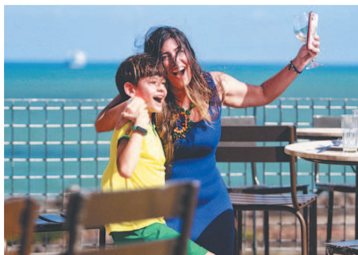
... mas quem comemorou mais foram os brasileiros