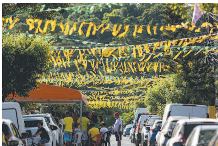
Rua na Várzea foi ornamentada para a Copa do Catar