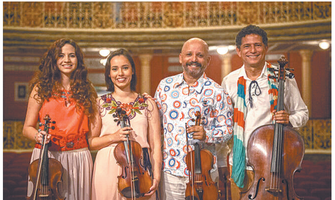
“Viagem pela Alemanha e Nordeste” acontece na próxima quinta-feira, em Olinda

celebra neste ano seus 52 anos. O evento acontece na próxima quinta-feira, às 19h, no Convento de São Francisco, em Olinda. A entrada é gratuita. O Movimento Armorial busca a criação de arte erudita com base na cultura popular nordestina.