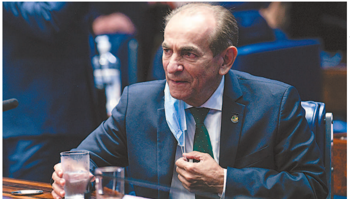
Relator do Orçamento da União prevê que a PEC seja aprovada até 10 de dezembro

PEC exclui do teto de gastos os recursos extras obtidos por convênios e serviços prestados pelas universidades públicas