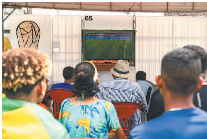
Moradores da Rua Apuleu Vieira concentrados na TV

Há 22 quilômetros do bairro da Várzea, no Recife Antigo, brasileiros e suíços se reuniram para ver a Canarinho vencer a sua segunda partida seguida no mundial. Lá, os suíços eram maioria. Com o encontro, o cônsul Rodolfo Fehr espera que essa ligação seja mantida além do futebol. “Juntamos suíços e amigos da Suíça para assistirem aos jogos, principalmente contra o Brasil. Com isso, esperamos poder fortalecer todos os laços de Suíça e Brasil”, projetou.