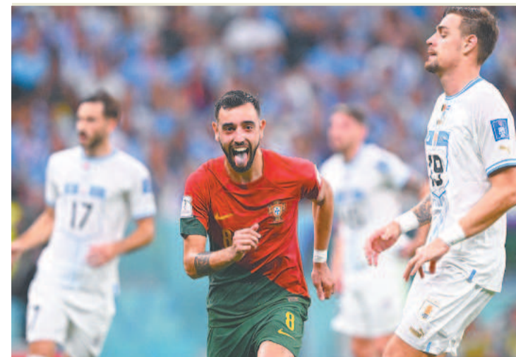
Fernandes marcou seus gols na segunda etapa do jogo

Às 10h, Gana e Coreia do Sul realizaram outra emocionante partida, com vitória dos africanos por 3 a 2 no estádio Cidade da Educação. Os ganeses abriram uma vantagem de dois gols ainda no primeiro tempo com Salisu e Kudus. Na segunda etapa, os coreanos reagiram e o atacante Cho Gue-Sung marcou duas vezes para empatar o jogo, mas Kudus apareceu novamente para anotar o gol da