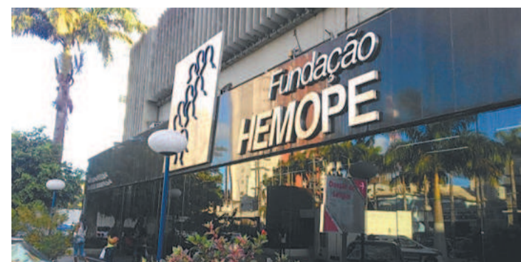
Há duas vagas pediátricas e duas para intensivistas

O projeto acontecerá dentro da Feirinha Criativa, na Praça do Campo Santo, em Santo Amaro. As trocas serão entre às 14h e 17h.