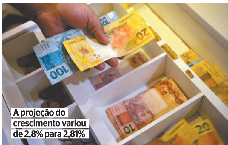
A projeção do crescimento variou de 2,8% para 2,81%

O Índice Situação Atual (ISA) recuou 4,6 pontos, para 91,8 pontos, enquanto o Índice de Expectativas (IE) caiu 2,4 para 92,6 pontos, indicando que a perspectiva futura também está em baixa. O que mais influenciou o resultado no mês é o indicador sobre a tendência dos negócios para os próximos seis meses. Esse índice recuou 4,5 pontos, para 87,8 pontos, mantendo-se abaixo dos 100 pontos desde setembro de 2021 (102,7 pontos). (ABR)