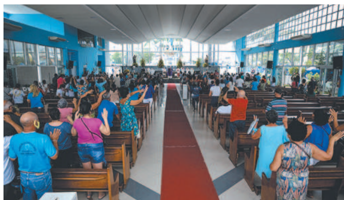
Haverá dezenas de missas até a próxima quinta-feira