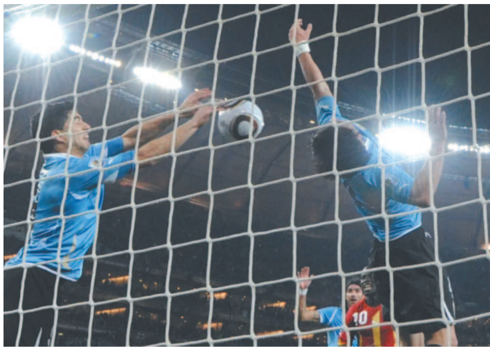
Em 2010, Luiz Suárez salvou um gol de Gana usando as mãos. Na Copa da Rússia, Xhaka provocou sérvios ao fazer gol

“As pessoas estão esperando por esta partida por conta da vingança. Eu também estou esperando por esta partida. Tenho que lutar pelo meu país. Sou parte da vingança. Quando jogamos contra o Uruguai naquela Copa, fomos a melhor seleção africana, aquela que chegou mais longe. Ter isso na cabeça me inspira”, falou Salisu sobre a fatídica partida. Na ocasião, após a mão de Suárez, Asamoah Gian acabou