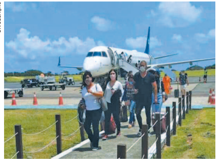
Pista chegou a fechar, interrompendo o fluxo de turistas

mil passageiros no Aeroporto Internacional dos Guararapes. De acordo com dados da Empeur e da Anac, Pernambuco aparece em segundo lugar no ranking das dez frequências mais procuradas de janeiro a outubro, com a ligação São Paulo (Guaru-