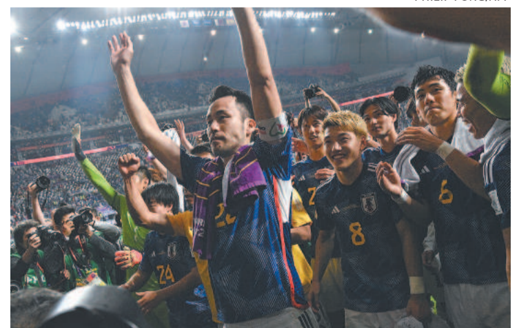
Japoneses venceram os dois campeões de sua chave

ração belga” se despediu da Copa do Mundo com um empate em 0 a 0 com a Croácia, que se classificou para as oitavas de final como segunda colocada do Grupo F. (AFP)