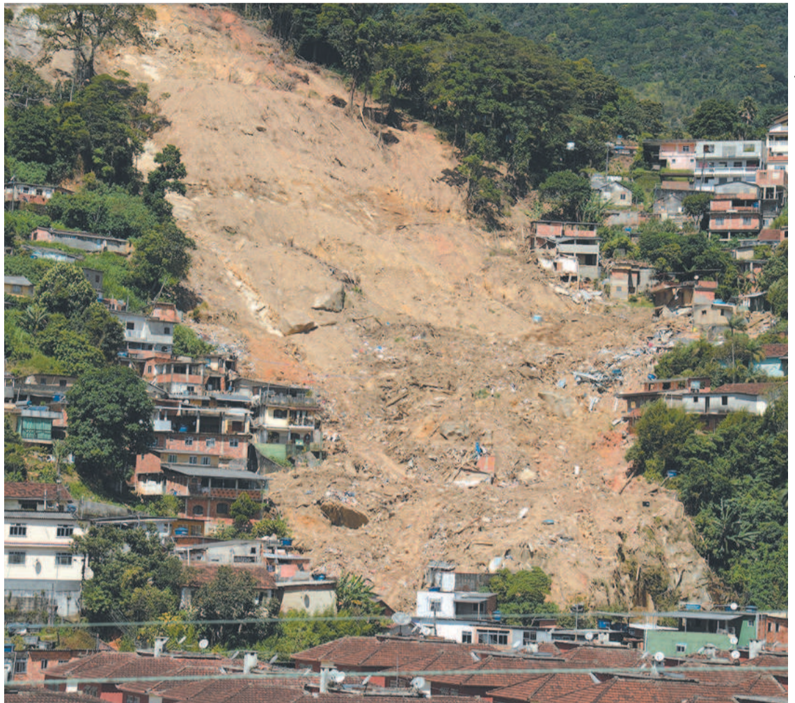
Tragédia de Petrópolis deste ano alerta para necessidade de verbas para desastres

Além disso, Randolfe disse que o orçamento para 2023, de cerca de R$ 3 bilhões, é inferior ao necessário, que seria na faixa de R$ 5 bilhões. “É mais um dado que informa a necessidade de aprovação da proposta de emenda constitucional que foi apresentada essa semana no Congresso Nacional”, destacou, em referência à PEC da Transição, para excluir o Auxílio Emergencial da regra do teto de gastos e abrir espaço orçamentário para novas despesas. (Da Redação com Correio Braziliense e Estado de Minas)