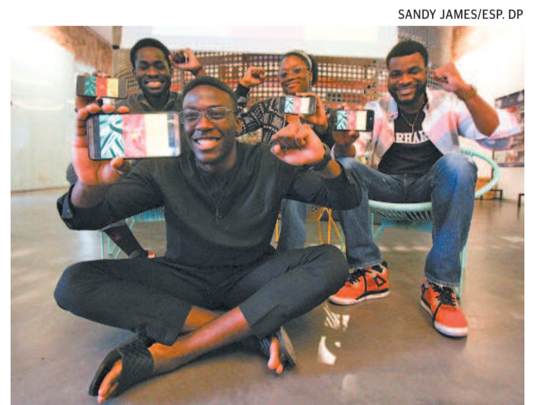
Grupo estuda Engenharia da Complexidade na Unicap