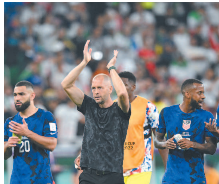
Os EUA representam a Concacaf no primeiro mata-mata