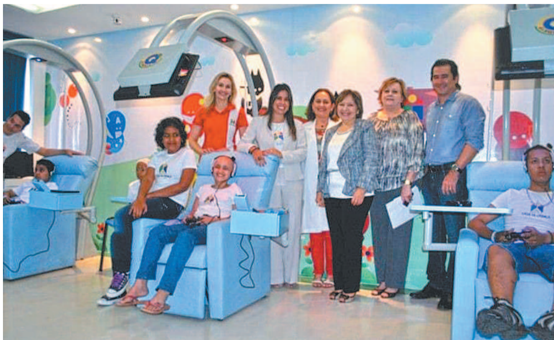
Uma das ações da entidade é a ajuda a instituições que tratam crianças com câncer

O projeto atua a partir de quatro programas, o de reformas, onde instituições são selecionadas e tem seus espaços reformados por uma rede de arquitetura e construção, o Cia dos Anjos, que a partir da sua rede de voluntários oferecem treinamento e capacitação as entidades atendidas, com o foco no aprimoramento e na qualidade do aten-