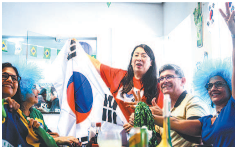
Torcida coreana e brasileira vibrou junta no restaurante

Não muito longe dali, na Fan Fest, no Cais da Alfândega, o público resistiu ao clima chuvoso e nublado e pôde acompanhar o show da Seleção, que venceu com gols de Vinícius Júnior, Neymar, Richarlison e Lucas Paquetá. O espaço ficou novamente lotado para acompanhar o jogo da Seleção Brasileira