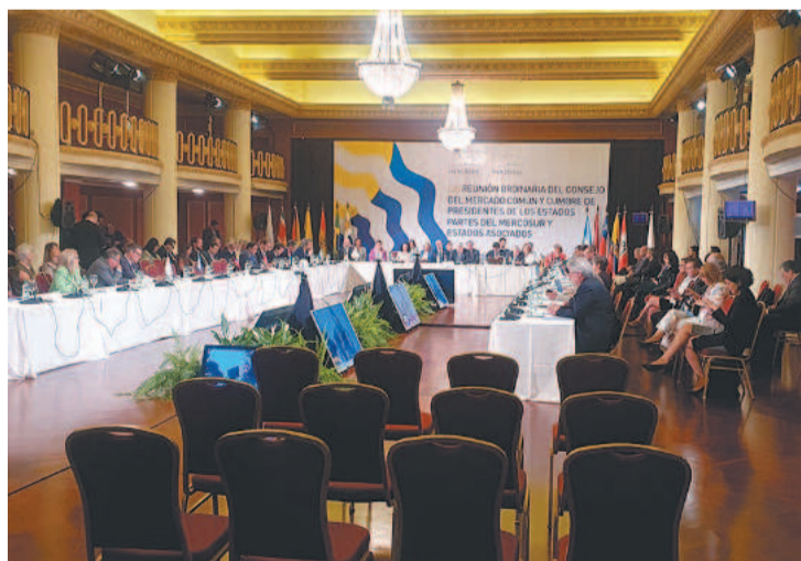
Encontro vai tratar de mais abertura do bloco comercial

gentino Alberto Fernández e o paraguaio Mari Abdo, além do uruguaio Luis Lacalle Pou. Assim como ocorreu em julho passado na reunião de Assunção, Jair Bolsonaro faltará a este encontro e será representado pelo vice, Hamilton Mourão. (AFP)