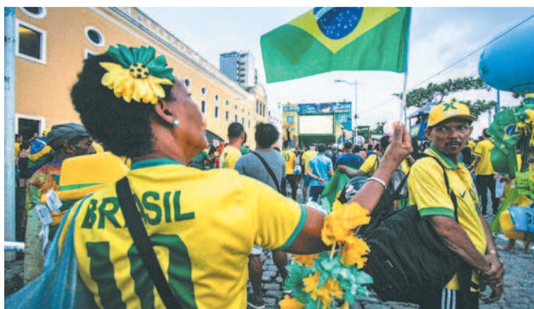
Expectativa pelo hexa está aumentando na torcida...