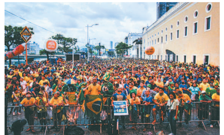
Já na Fan Fest, no Recife Antigo, nem a chuva atrapalhou