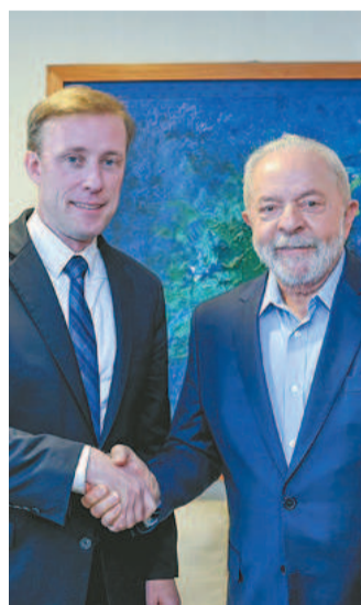
Sullivan convidou Lula para viagem aos EUA

Amorim afirmou que a conversa abrangeu “temas ligados à cooperação, desenvolvimento,