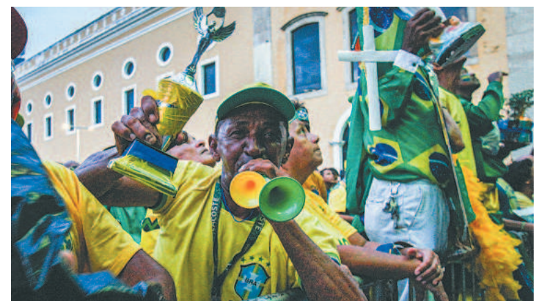
... que capricha na criatividade em dia de jogos do Brasil