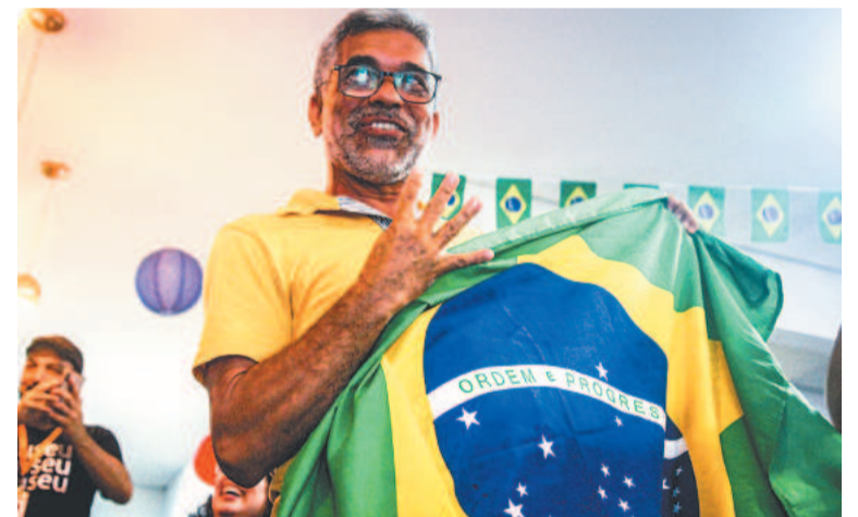
Quem terminou alegre foram os brasileiros com os 4 a 0