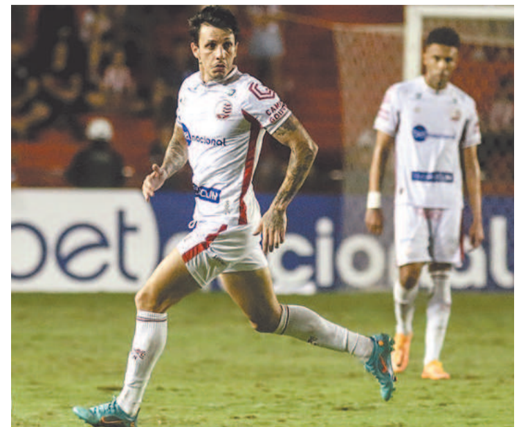
Alguns clubes tentaram tirar o camisa 10 dos Aflitos