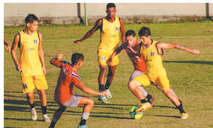
Tricolor ficou no 2 a 2 com o CSP-PB em partida no CT

rada de 2023 no dia 5 de janeiro, quando terá pela frente o Caucaia do Ceará. O jogo é válido pela primeira pré-eliminatória da Copa do Nordeste. Em caso de vitória, o Santa Cruz vai en-