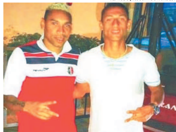
Artilheiro da seleção pediu para tirar uma foto com CR7

nha de 2013 do Santa Cruz no Estadual e foi o principal nome do acesso para a Série B daquele ano. Atualmente o jogador de 36 anos defende o Náutico de Roraima. Já Richarlison está focado