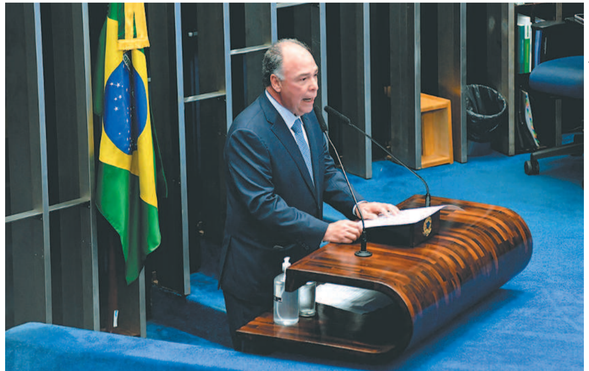
No último pronunciamento, Bezerra Coelho lembrou as quatro décadas de atuação

Bezerra Coelho deixa o Senado no dia 31 de janeiro, cedendo lugar para Teresa Leitão (PT), eleita neste ano. Humberto Costa (PT) e Jarbas Vasconcelos (MDB), licenciado para tratamento médico, são os outros dois senadores pernambucanos.