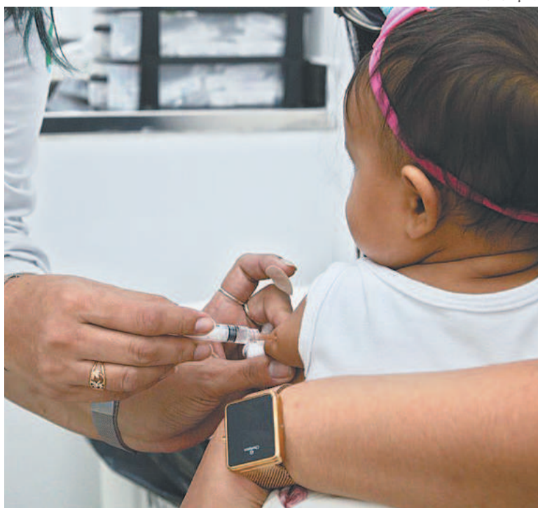
Campanha conscientiza sobre a cardiopatia infantil no país