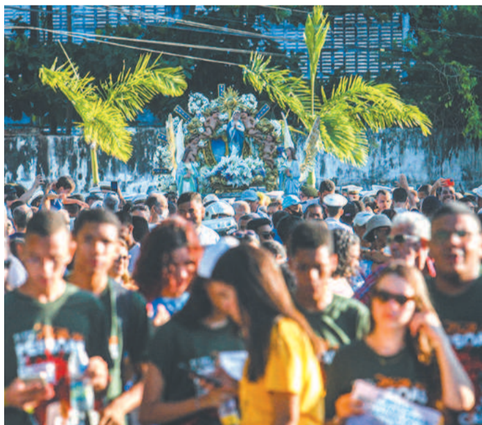
Procissão percorreu 8 km na tarde de ontem

num total de 72 cerimônias em 11 dias de festa. 850 voluntários foram escalados para atuar nas equipes de trabalho. 750 refeições, entre almoço e janta, além de 300 lanches foram produzidos diariamente. Também vale ressaltar que, às vésperas do feriado, a festa do Morro da Conceição recebeu o título de Patrimônio Cultural Imaterial de Pernambuco, após decreto do governador Paulo Câmara.